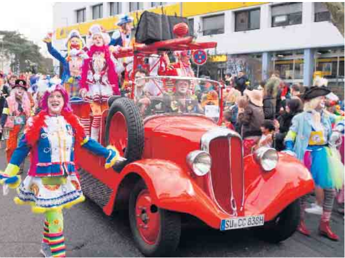
Eine kunterbunte Truppe - der Circus Comicus

Circus Comicus, der ATV Selhof, die KG Löstige Geselle, die KG Klääv Botz, die KG Ziepchens Jecke, das Damenkomitee Ziepchens, das Rhöndorfer Weinhaus Hoff, die Große Selhofer KG, der Club im Club, der Honnefer Fußballverein, die Dragons Rhöndorf, die Jecken Piraten, die KJG Rhöndorf, das Tanzcorps Sackmarie, Küfer Jupp, die KJG Selhof, die Villa von Sayn, der WSVH Bad Honnef, die Kieselsteine, der Spielmannszug TV Eiche und die Jubiläums-KG Halt