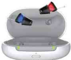
Silk Charge&Go IX

Das muss gar nicht sein. Denn heutzutage haben Hörgeräte nichts mehr mit den klobigen Hörhilfen von früher zu tun. Längst sind sie zu wahren Wunderwerken in Miniaturform geworden. Eines der kleinsten auf dem Markt ist das Silk von Signia. Jetzt bringt der Erlanger Hörgerätehersteller eine