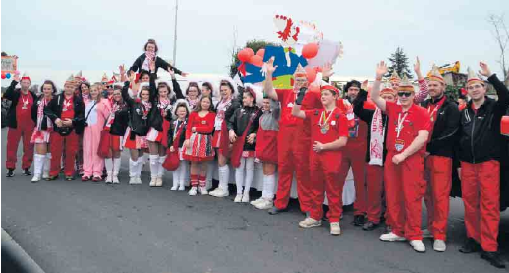
Die Karnevalsfreunde aus Bockeroth ließen es sich nicht nehmen, in Vinxel dabei zu sein

(bk) Vinxel. Wie stets war das Treiben im Straßenkarneval auch in Vinxel ein „Muss“. So formierten sich bereits am Karnevalssamstag die Jecken, um, wenn auch klein aber dennoch fein, durch die Straßen des Ortes zu ziehen. Die Freunde Vinxel/Oelinghoven und der Bürgerverein Vinxel waren mit dabei. Die Kids der Kita Löwenzahn hatten sich bunt kostümiert und begeisterten die Jecken am Zugrand. Auch die Veuxeler Buben und Mädels durften nicht fehlen. Aus den Nachbarorten verstärkten die KG Bockeroth-Düferoth und die KG Neues Rauschendorf das närrische Treiben auf den Straßen von Vinxel. Komplettiert wurde Zoch von dem Freundeskreis Ritzdorf und der Explosive KG. Auch wenn ohne neues Prinzenpaar, so rundete doch der Prunkwagen der KG Vinxel das närrische Treiben im Straßenkarneval ab.