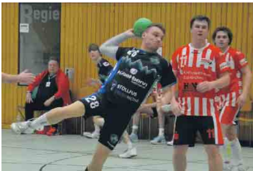
Die HSG dominierte das Spiel und gewinnt verdient gegen die HSG Euskirchen