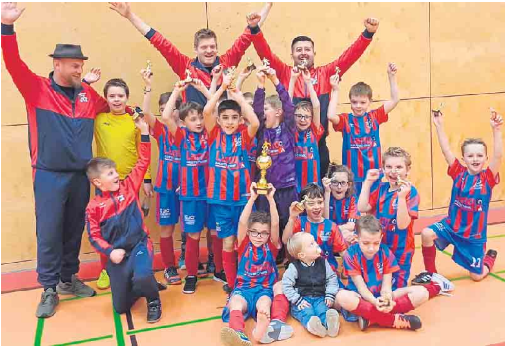
Die Mannschaften waren am Ende stolz über ihre Pokale

(bk) Aegidienberg. Am vergangenem Sonntag fand der mit Spannung erwartete Vitalium Junior Cup 2024 statt, ein herausragendes Fußballereignis, das von Windhagen und der SG Aegidienberg/Eudenbach veranstaltet wurde. Dieses Turnier brachte junge Talente aus den Altersklassen U8 und U9 zusammen und bot ihnen eine Plattform, um ihre Fähigkeiten in einem wettbewerbsorientierten Umfeld unter Beweis zu stellen. Beide Altersklassen spielten in zwei Gruppen mit anschließenden Halbfinals, Platzierungsspielen für alle Plätze und einem Finale. In der U8-Kategorie zeigten Teams wie SSV Kaldauen, SG DJK Neustadt und Wahlscheider SV hervorragende Leistungen, mit SSV Kaldau-