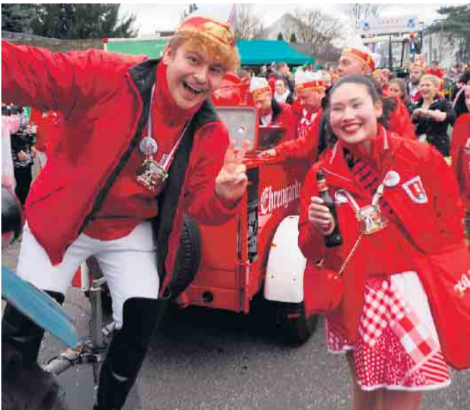
Vom Berg ins Tal - die KG Klääv Botz aus Aegidienberg