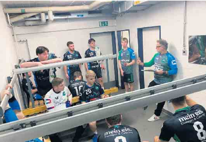
Nach intensiver Besprechung in der Kabine begannen die Siebengebirgler die zweite Halbzeit ähnlich stark wie die erste