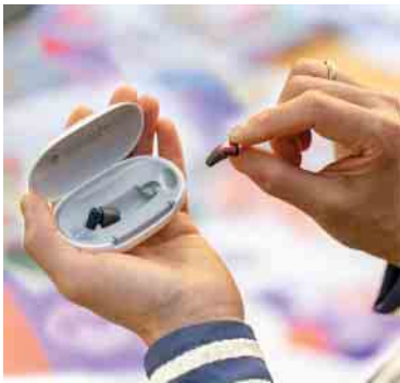
Modernes, maximal diskretes Design

Verschiedene Aufsätze („Click Sleeves“) sorgen für flexiblen Komfort im Ohr, so dass die Silk Geräte ohne Maßanfertigung schnell verfügbar und trotzdem bequem zu tragen sind.