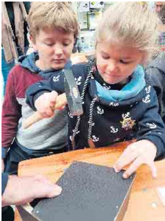
Die Kinder und Jugendlichen sind immer mit Feuereifer dabei.

und Niststätten werden immer weniger. Hecken, Bäume, Wildwuchs, Totholz und Wildwiesen müssen immer mehr weichen. Stattdessen findet man saubere, „aufgeräumte“ Einheitsgärten ohne Vielfalt für Tier und Natur. Mit einem geschützten Nistkasten an der richtigen Stelle im Garten oder auf dem Balkon kann man den heimischen Wildvögeln einen sicheren Nistplatz für ihren Nachwuchs anbieten und unterstützt somit die heimische Vogelwelt. Bei Fragen rund um das Thema Tierschutz erhält man Auskunft über die Vereins-Hotline 02224