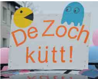
Ein Hinweis auf all das, was nun folgte - eine kunterbunte Narren-Show

Auch wenn in Vinxel Karneval in der Session 2023/24 auf Sparflamme gefeiert wurde und erneut kein Prinzenpaar die Narrenschar anführte - der Zoch ging doch durch den Ort