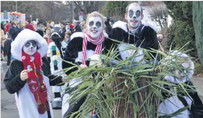
Einen natürlichen Flair verlieh diese Gruppe dem närrischen Treiben