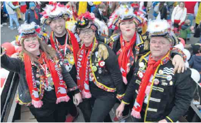
Auch die Equipe jubelte dem neuen Prinzenpaar zu