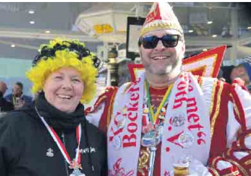
Prinz Guiseppa gönnte sich erst einmal am Milchbock ein leckeres Kölsch

dem Genussvollen weg gelockt werden, ihre Aussichtsplattform besteigen und damit den Startschuss zu dem närrischen Treiben des Ortes geben. Zugegeben, seit ihrer Proklamation durch die KG „Mir komme met“ Bockeroth-Düferoth im November des vergangenen Jahres war einiges passiert und eine Session kann durchaus schön anstrengend sein. Somit war Gemach angesagt. Doch dann setzte sich das jecke Trio doch noch in Bewegung, der kunterbunte Lindwurm nahm Fahrt auf und ließ damit die Narren am Zugweg jubeln. Spaß an der Freud war angesagt und bei tollem Wetter wurde der Höhepunkt des Straßenkarnevals auch in Bockeroth und Düferoth zu einem herrlichen Erlebnis..