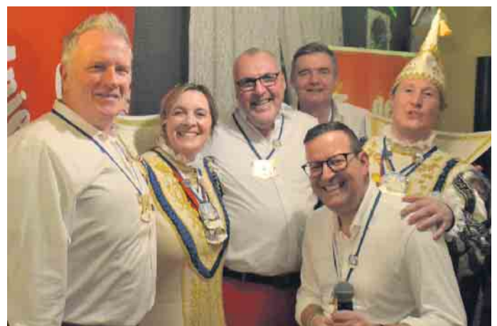
Der Dank der Tollitäten galt der Boygroup „De Anjeschwemmt“