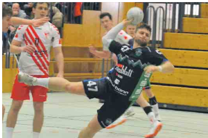
Es war ein überaus intensives Spiel in dem zwei Topteams der Oberliga aufeinander trafen