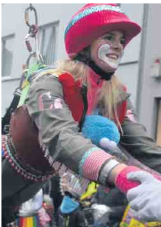
Auch der Circus Comicus durfte in Honnefer Karnevalszug nicht fehlen