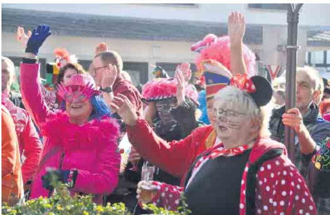
Ein dreifaches „Alaaf“ auf den Dollendorfer Fasteleer