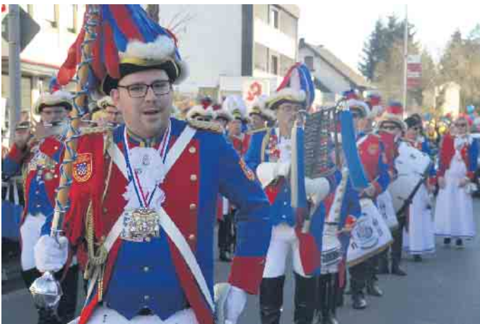
Der Spielmannszug des TV Eiche, spielte im 111-jährigen Jubiläum des Verein auch in Aegidienberg auf