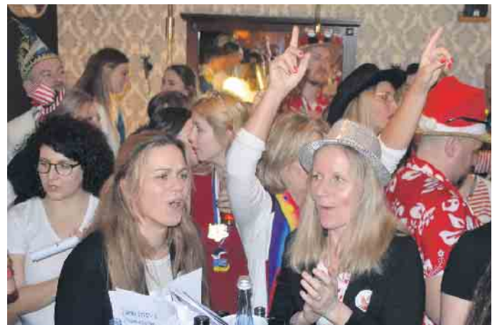
Ausgelassene Stimmung herrschte im Bramkamp und „Sing doch eene mit“ war gesetzt