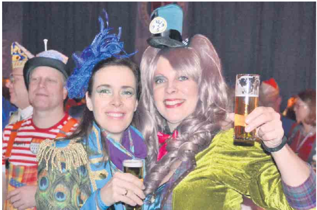
Die Jecken, weiblich wie männlich, feierten ausgelassen auf der Prunksitzung der Narrenzunft

Mit Stadtrand endete eine stimmungsvolle Zunftszene