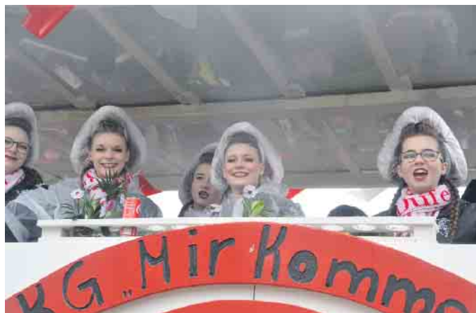
Die KG „Mir komme met“ auf ihrem Karnevalswagen im Veußeler Zooch