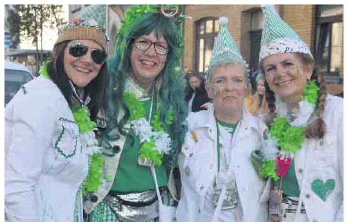
Die Farben der Küzengarde, grün und weiß, waren auch im Dollendorfer Zug vertreten