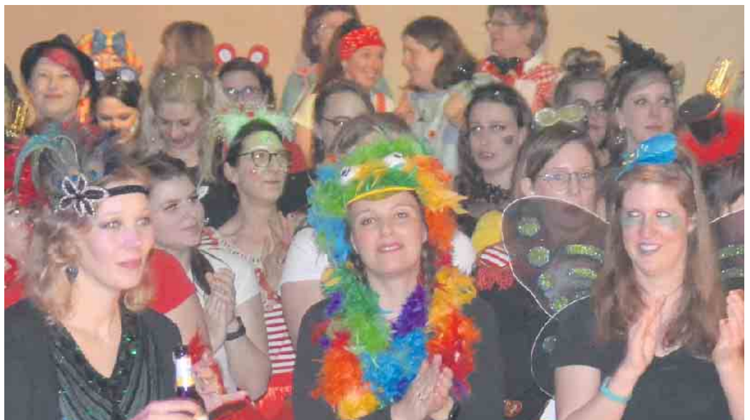
Ausgelassene Stimmung im Jillienberger Narrentempel, in dem die Damenwelt das Sagen hatte