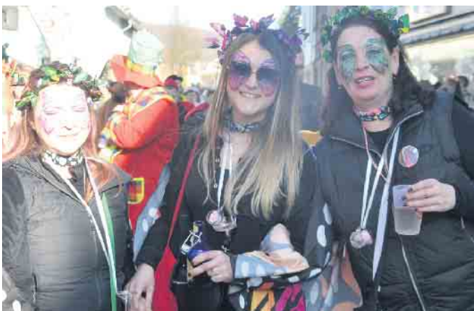
Sie hatten auch ihren Spaß beim Zoch durch Dollendorf