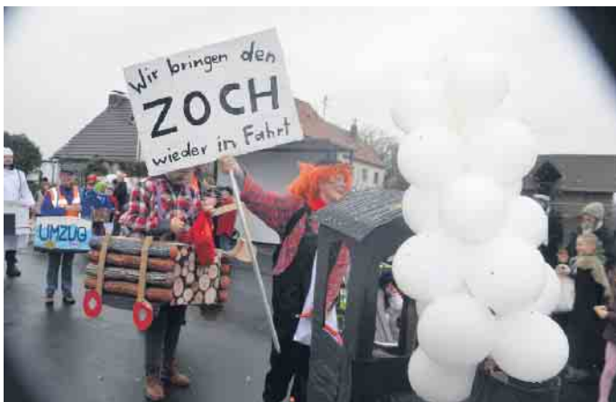
Auch ohne Prinzenpaar zogen die Jecken durch Vinxel