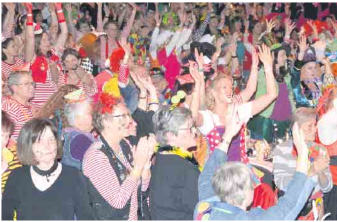
Eine tolle Stimmung im Pleeser Narrentempel, den die Weiber fest im Griff hatten