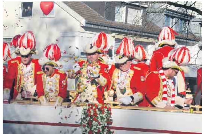
Wie hier vom Prunkwagen der Ehrengarde regneten Kamelle auf die Narren am Zugrand nieder