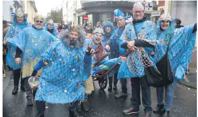
Die Jecken im Zooch hatten ihren Spaß und feierten ihren Straßenkarneval