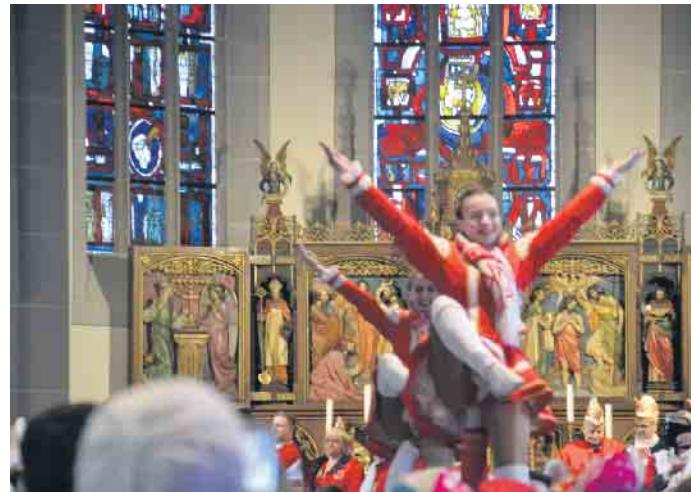
Karneval und Kirche - in St. Johann Baptist wurde diese Beziehung lebendig

Herrjott uns hilf, immer wieder neu anfangen zu könne. Mir könne immer widder beginnen, unsere Heimat zu gestalten. Wenn mir im Vertraue zum Herrjott stonn, könne mir auch auf ihn vertraue.“ Die Töllitäten aus Berg- und Talbereich trugen die Fürbitten vor, deren Anrufung „Här, hür uns aan und dun et jevve!“ lautete. Mit dem Schlusslied und dem Refrain „Un bis meer uns widder treffe, soll der Herrjott immer mit dir sin“, entließ der Pfarrer die Karnevalisten, die sich im Anschluss an die Kölsche Mess vor der Pfarrkirche versammelte, um bei Speiß und Trank den Sonntagvormittag ausklingen zu lassen.