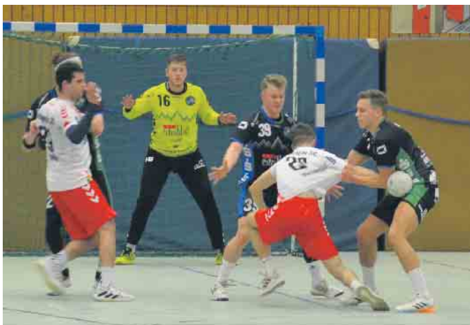
Gegen die starken Longericher musste jeder 7-Meter sitzen