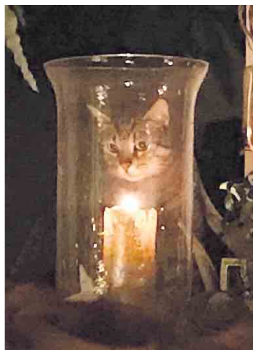
Ein Licht setzen gegen Ungerechtigkeit, Gewalt und Ausbeutung von Tieren.

schutz Siebengebirge aktuell passiert, welche Tiere ein Zuhause suchen, welche wichtigen Termine anstehen, wo Hilfe dringend nötig ist.