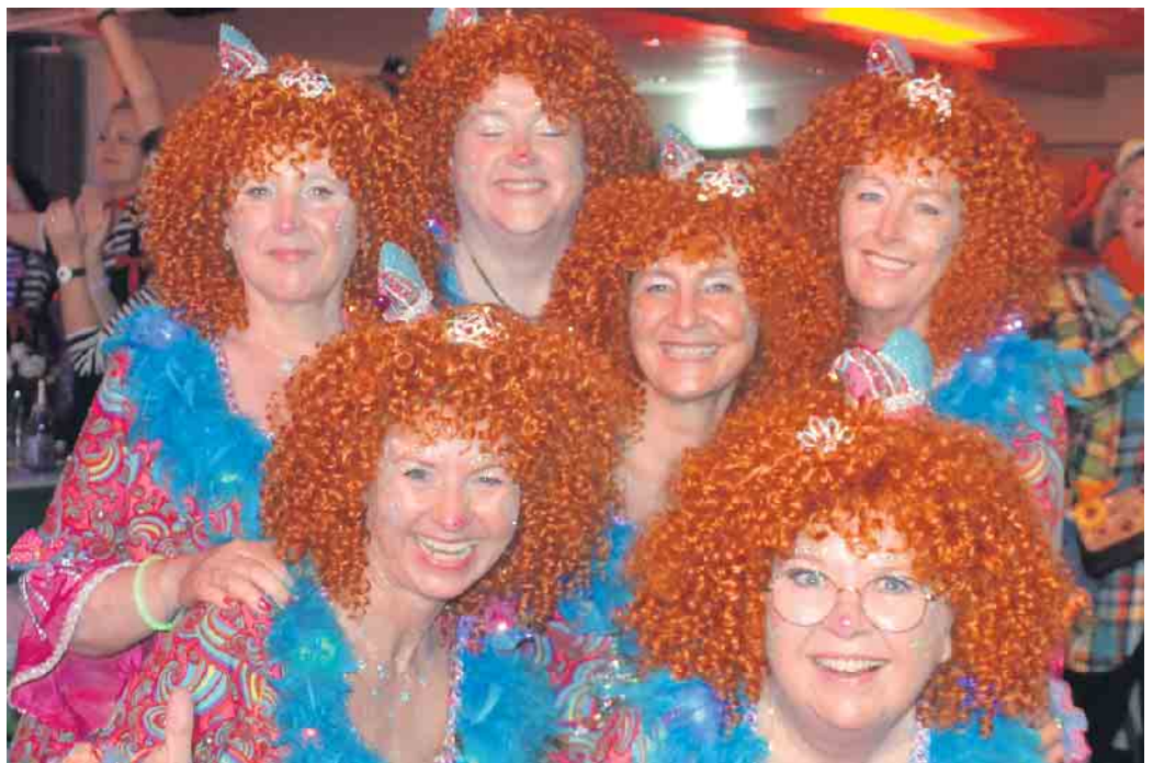
In tollen närrischen Outfit präsentierten sich die Weiber in Aegidienberg