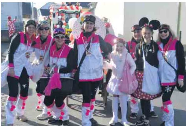
Auch Micky-Mäuse wurden in Bockeroth und Düferoth gesichtet