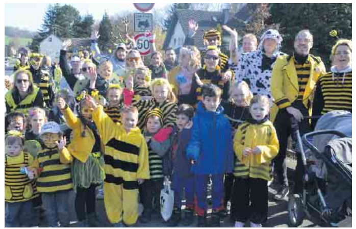
Die Kids vom Kindergarten Zwergenland hatten gemeinsam mit Mama und Papa Spaß im Zoch durch Uthweiler