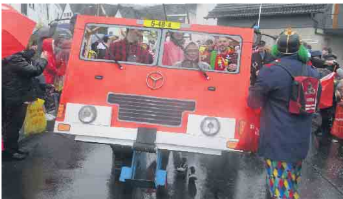
Die Freiwillige Feuerwehr mit ihrem neuesten Fahrzeug