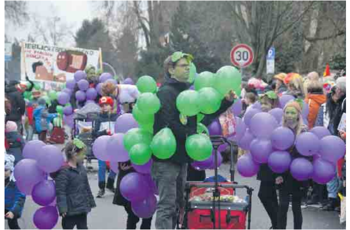
Ein schönes Bild - die Weintrauben zogen durch Plees - lieblich und berauschend

(bk) Oberpleis. Zootiere außer Rand und Band, Karamba - das Trümpche ungerwääs mit Mario, so lautete im Pleeser Zoch. Aber auch Aufschriften, wie „Pleiser-