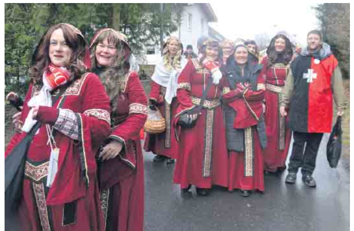
Auch das Mittelalter wurde im Oberhauer Zoch gesichtet