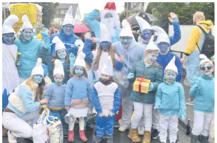
Die Kita-Kids zogen mit Mama und Papa durch Ittenbach