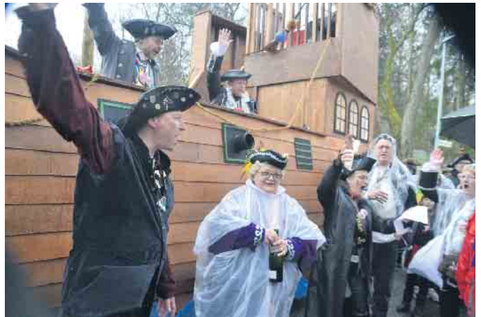
Das neue Schiff der Ölbergpiraten wurde zum Beginn des Zuges durch Ittenbach auf den Namen Calypso getauft

vor dem Start des Zuges eine erfreuliche Handlung durchführen konnte. Lange Zeit mussten die Ölbergpiraten auf einen schwimmenden Untersatz verzichten. Nun können sie jedoch wieder über die Weltmeere schippern. „Calypso“ so das Zauberwort. Mit der Schiffstaufe lief die Galeere vom Stapel und bahnte sich auf der Jungfernfahrt den Weg durch die Narrenschar am Zugrand in Ittenbach.