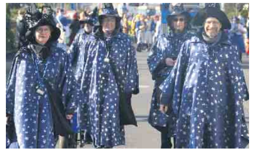
Bei strahlendem Sonnenschein zog die Narrenschar durch Uthweiler

ten beide noch eine weitere Amtszeit dran. Zum Abschluss wurde nochmals das ehemalige Feuerwehrhaus aktiviert und dort klang das närrische Treiben nach mehreren gemeinsamen Stunden aus.