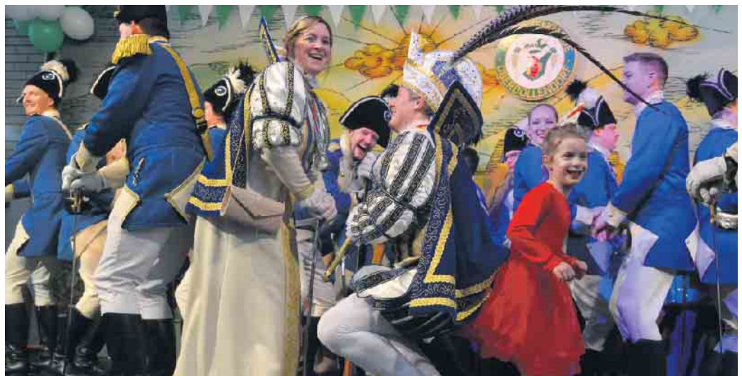
Beim Stippföttche musste der Pleeser Prinz in die Knie gehen