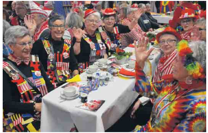
Bunt kostümiert und in bester Laun - so präsentierten sich diese Damen auf der Seniorensitzung in Eudenbach