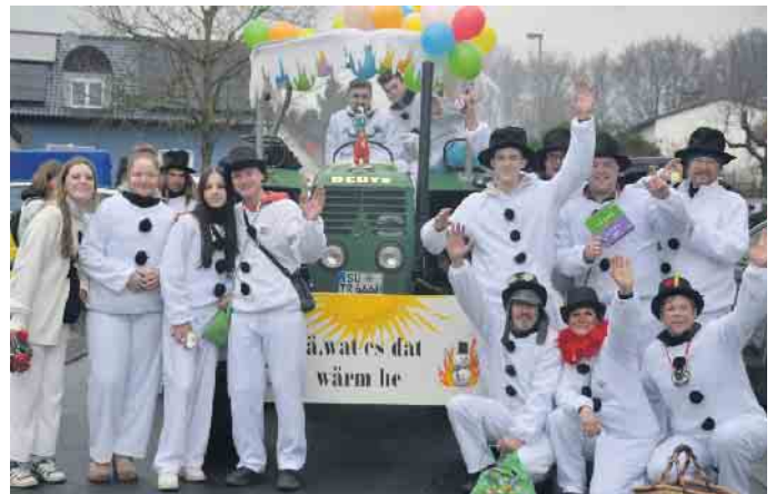
Der Schneetruppe wurde es trotz der bewölkten Wetterlage im Oberhau zu warm