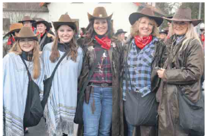
Der „Wilde Westen“ zog durch Wald und Wiese quer durch die Landschaft im Osten der Stadt Königswinter