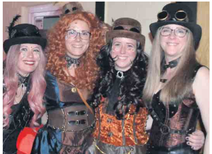
Während das närrische Bühnenprogramm seinen Lauf nahm, feierten die Mädels ihren Weiberfastnacht im Saal