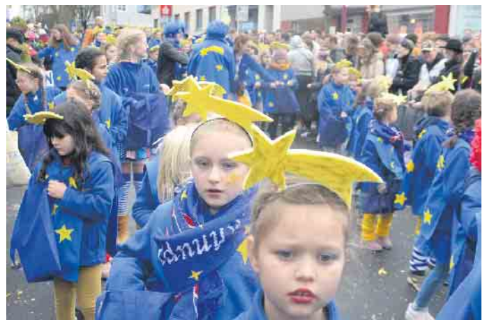
Sternschnuppen erhielten das närrische Geschehen in Plees