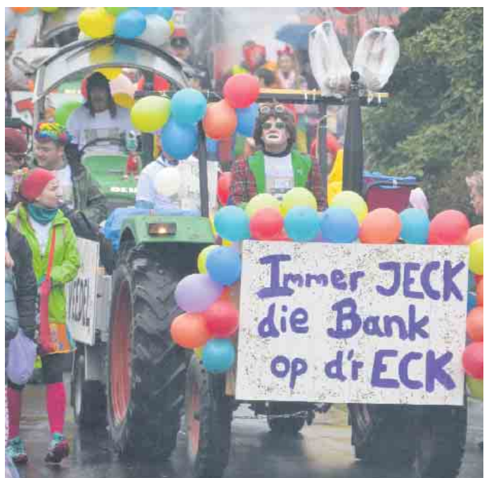
Es zischte und puffte im Zoch der Ittenbacher Jecken