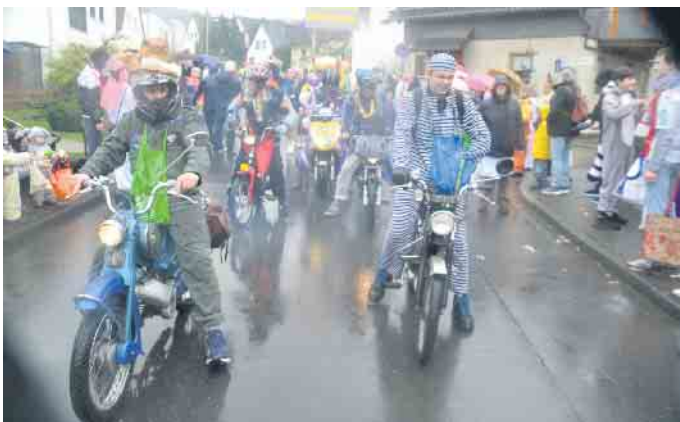
Auch die Mofa-Gang knatterte durch den Ort