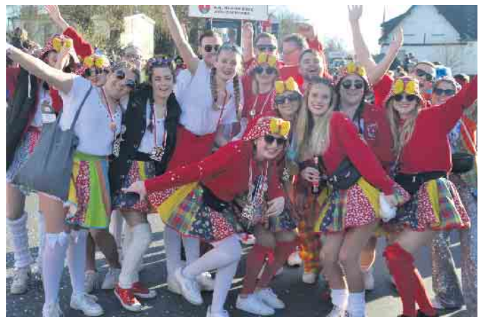
Stimmung pur beim Dienstagszug durch Aegidienberg