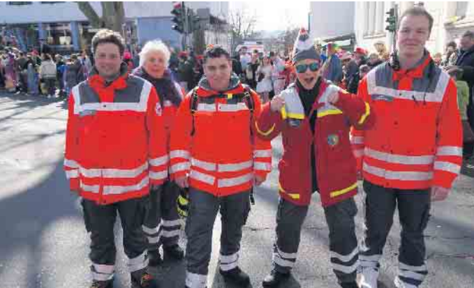
Das DJK wird auch im Straßenkarneval in der Siebengebirgsregion präsent sein

(bk) Siebengebirge. Den Auftakt für sechs närrische und zugleich arbeitsreiche Tage bildet die Weiberfastnacht für die Helferinnen und Helfer des Deutschen Rotes Kreuz. Wie in jedem Jahr leisten mehr als 50 Ehrenamtliche über 450 Einsatzstunden bei Karnevalsveranstaltungen wie der Marktschau sowie den drei Umzügen in Bad Honnef. Selbstverständlich wird dabei auch weiterhin die Einsatzbereitschaft des örtlichen Bevölkerungsschutzes jederzeit und wie gewohnt sichergestellt. „Damit ihr den Karneval unbeschwert genießen könnt, haben wir