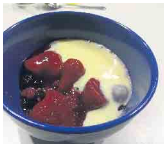
Traditionsnachtisch: Rote Grütze

Im Ev. Gemeindehaus Oberpleis wurde wieder gemeinsam gekocht und gegessen