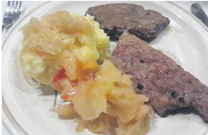
Berliner Kalbs- und Rinderleber frisch zubereitet.

Nach gesundheitlich- und wetterbedingten Absagen wurde endlich wieder gemeinsam gekocht in der Evangelischen Kirchengemeinde Siebengebirge, Gemeindeteil Oberpleis. Da die Zutaten für die Berliner Leber schon gekauft waren, entfiel der Schwarzwurzelkoch-