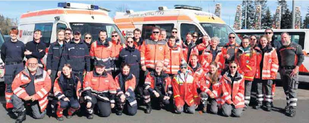
DRK und MHD arbeiten an den tollen Tagen Hand in Hand