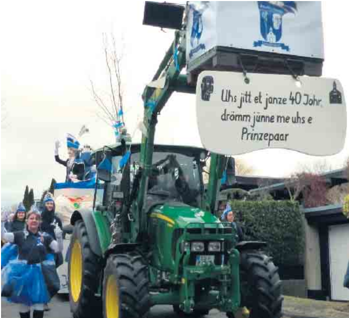
Auch ein Prinzenpaar aus Pape zog durch Rauschendorf