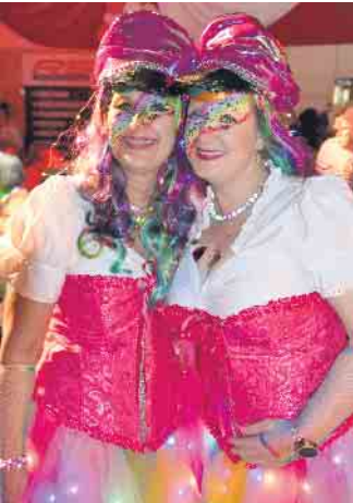
Ein tolles Outfit für die Weibersitzung