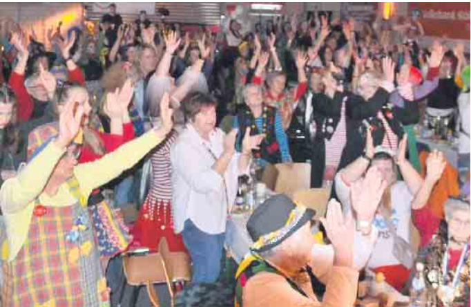
Eine tolle Stimmung im Uthweiler Narrentempel, der Halle Neuenfels