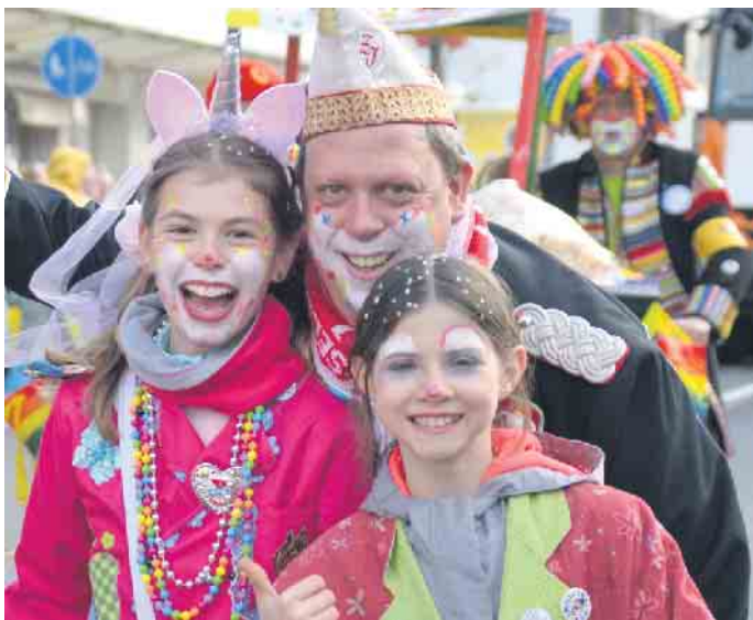
Ein Alaaf auf den Fasteleer