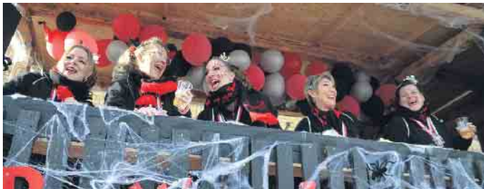
Die Powerhexen lieben den Straßenkarneval, was sie auch hier im Zug wieder zeigten

Jecken machten ihrem Namen alle Ehre und behaupteten „Wild, Wild, Jeck“. Es war ein kunterbunter Zoch mit zahlreichen kleinen und großen Karnevalisten. Am Ziel angekommen wurde im Franz-Unterstell-Saal kräftig weiter gefeiert.