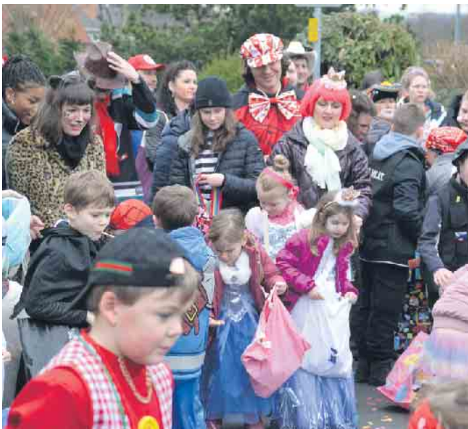
Die Jecken am Zugrand genossen den kleinen aber feinen Ittenbacher Zug