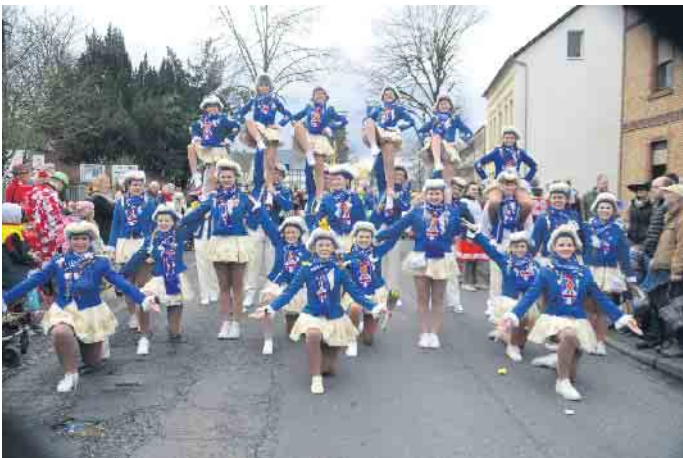
Die Tanzgruppen der Narrenzunft zeigten auch im Zoch ihr Können