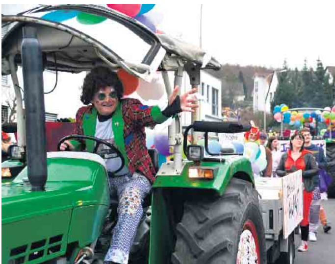
Der Zoch kütt - fünf Wagen und fünf Fußgruppen gingen im Ittenbacher Karnevalszug mit