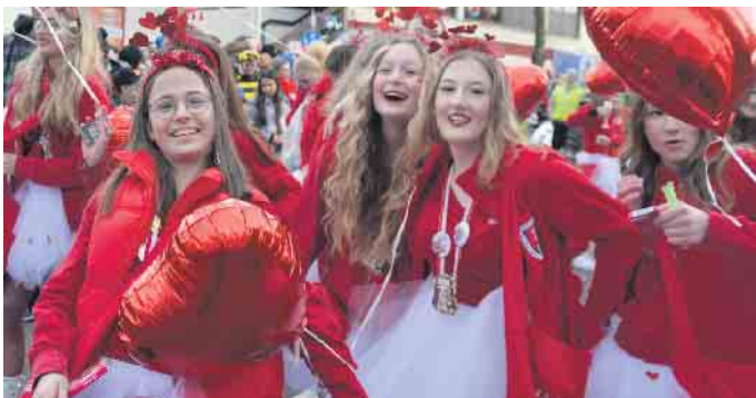
Bunt und vielfältig ging es im Aegidienberger Veilchendienstagszug zu