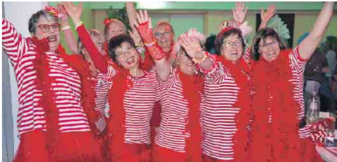
Kunterbunt ging es im Bürgerhaus zu