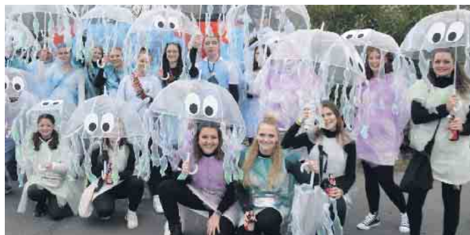
Die Tanzgruppe Scarabäus wurde als Quallen oder auch Jelly Fishes im Oberhau gesichtet