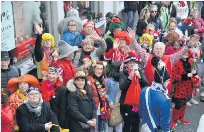
Kamelle - die Jecken feierten in Plees