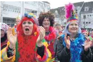
Ein Hoch auf den Honnefer Karneval