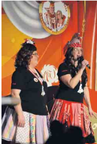
Die Moderatorinnen hatten ihren Spaß auf der Bühne