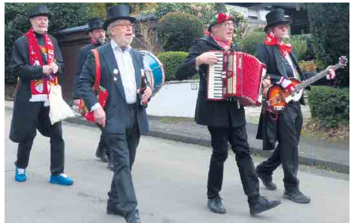
Auch Life-Musik belebte das Geschehen im Karnevalszug

KG Neues Rauschendorf in der Propsthofstraße eingeladen. Marchetti's Imbis und DJ Orca sorgten dort für Kulinarisches und fetzige Musik. „Wir könnten uns tatsächlich vorstellen in den nächs-