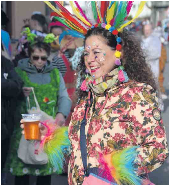
Auch am Zugrand wurden tolle Kostüme gesichtet