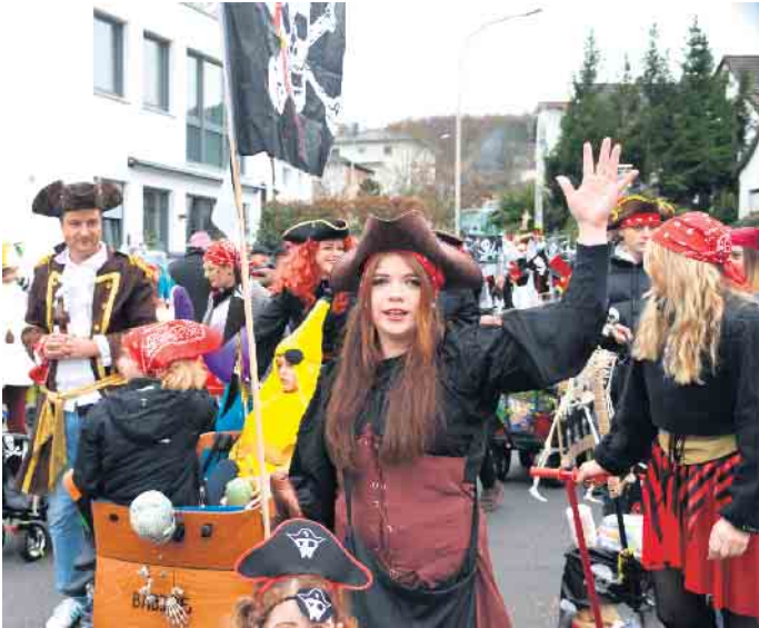
Spaß und Freud im Ittenbacher Karnevalszug