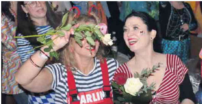
Für die Damen regnete es Rosen