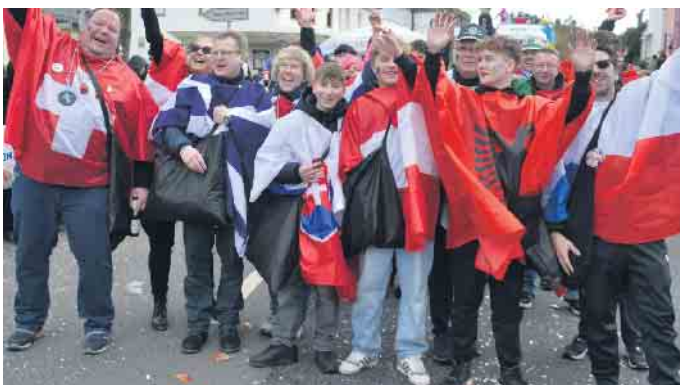
Die Sportfreunde Aegidienberg waren natürlich auch mit dabei