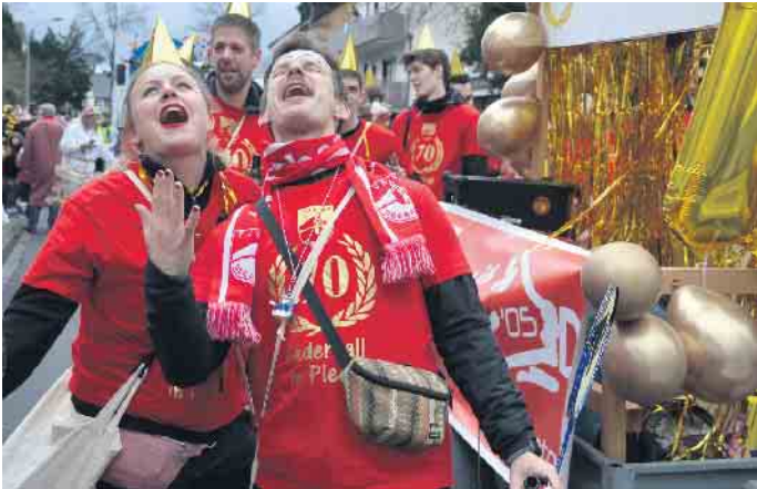
Ne wat is dat schön - es lebe der Karneval