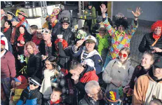
Ein Hoch auf den Karneval

Jecken machten ihrem Namen alle Ehre und behaupteten „Wild, Wild, Jeck“. Es war ein kunterbunter Zoch mit zahlreichen kleinen und großen Karnevalisten. Am Ziel angekommen wurde im Franz-Unterstell-Saal kräftig weiter gefeiert.