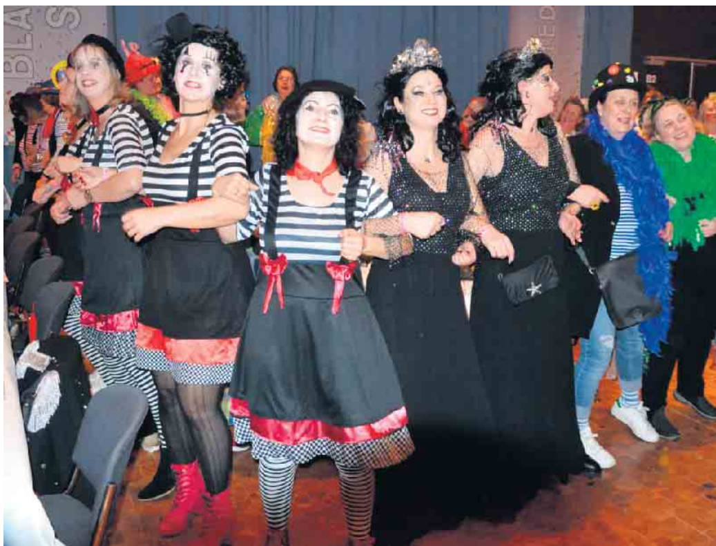
Es wurde auf der Weibersitzung geschunkelt und getanzt