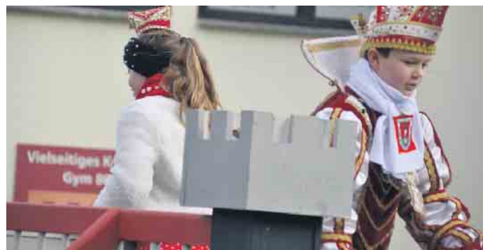
Auch das Jillienberger Kinderprinzenpaar genoss die tolle Atmosphäre am Zoch