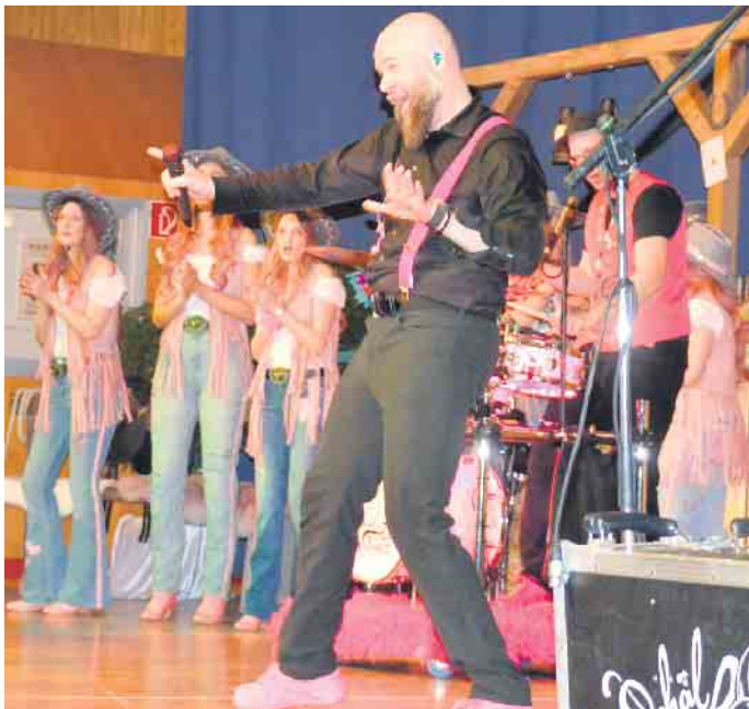
Auf der närrischen Bühne wurde gerockt