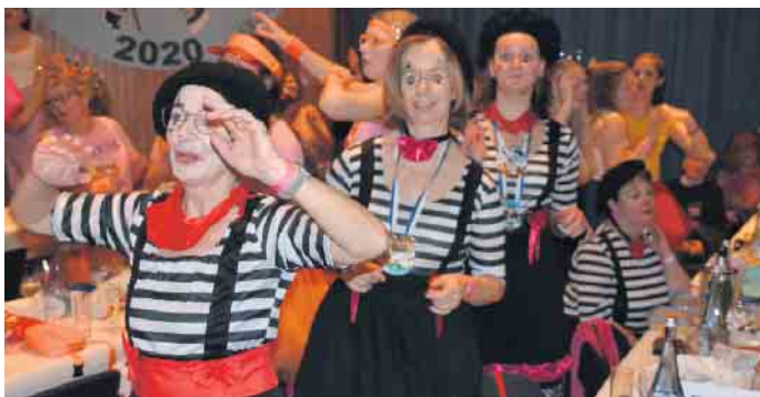
Mädels können feiern - eine tolle Stimmung bei der Weibersitzung der Zunftfrauen