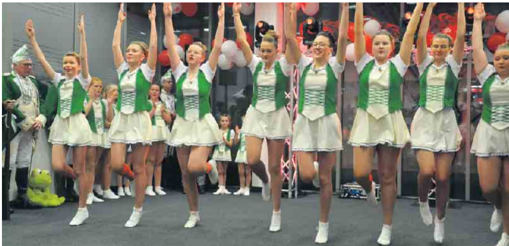
Auch die Küzengarde aus Oberdollendorf war nach Bad Honnef gekommen