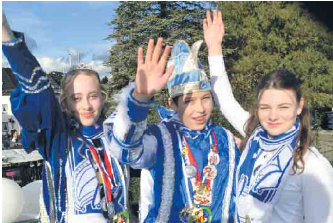
Das Kinderprinzenpaar strahlte mit der Sonne