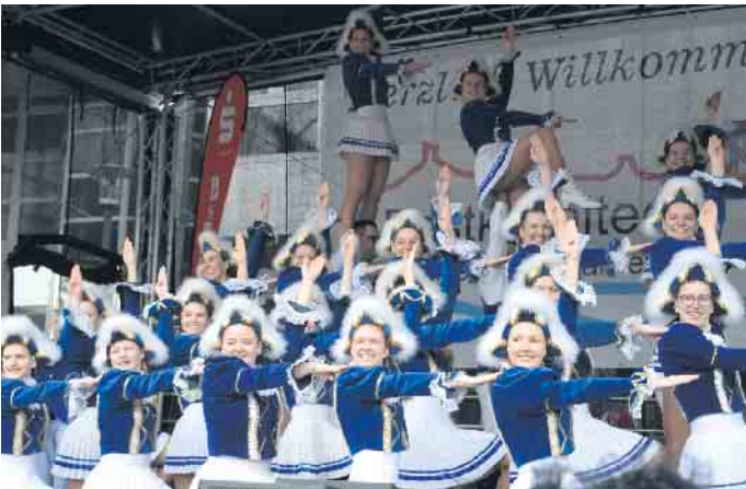
Die Große Selhofer KG ließ ihre Tanzgruppen auftreten