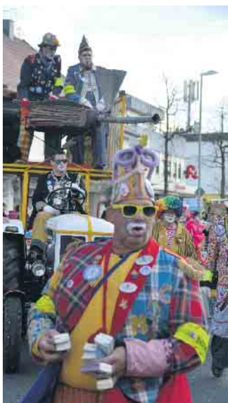
Der Circus Comicus war wieder mit einer großen Gruppe dabei