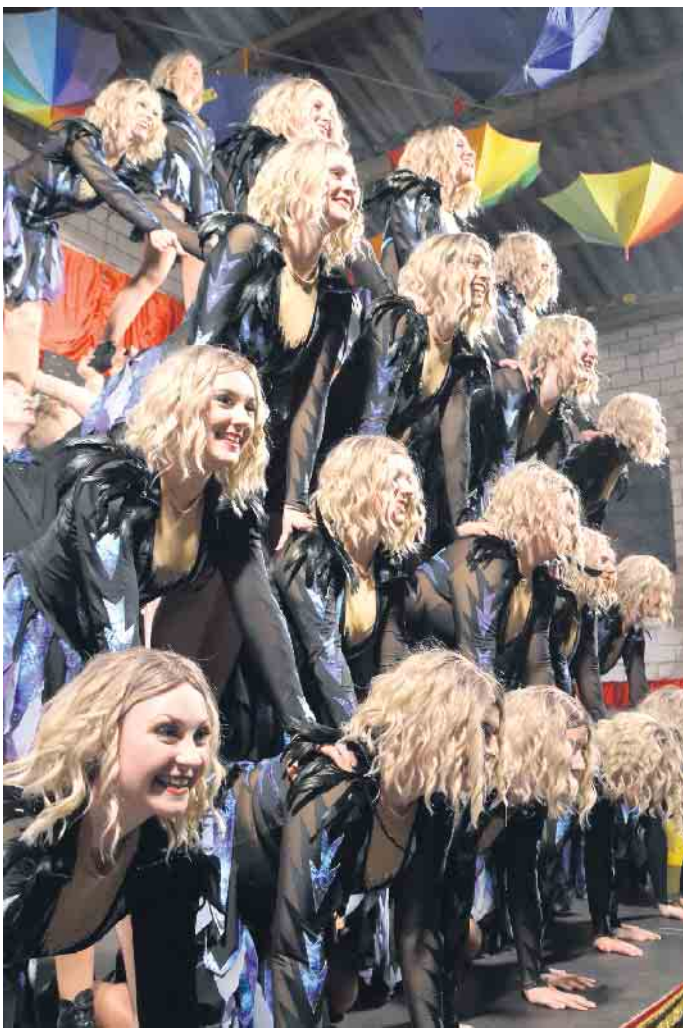
Die Sternschnuppen Bockeroth boten eine tolle Bühnenshow