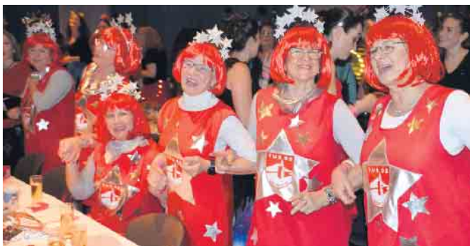
Kunterbunt ging es im Oberpleiser Narrentempel zu