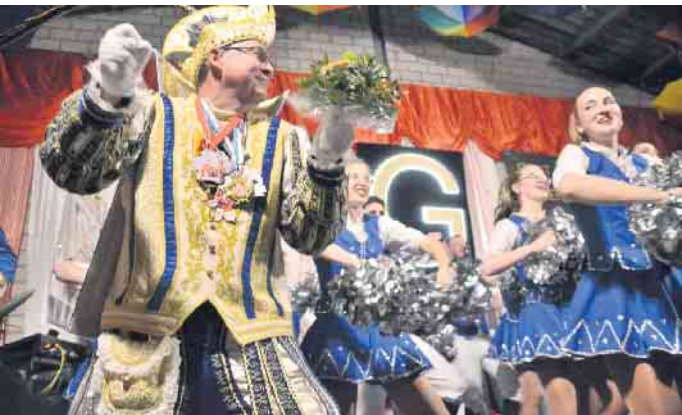
Prinz Rainer II. rockte mit den Zunftsternen die Bühne