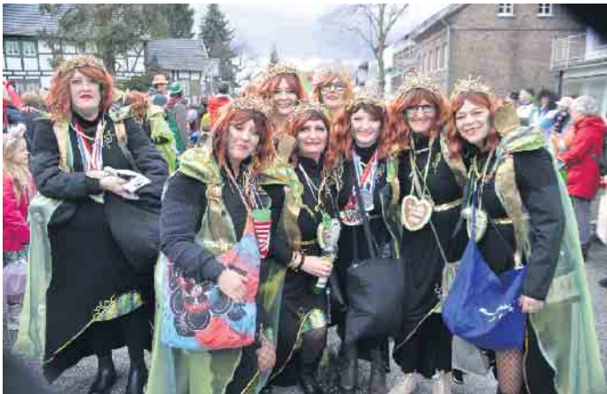
Tolle Kostüme und beste Stimmung in Straßen von Plees