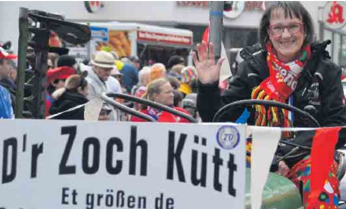
Mit dem Leitfahrzeug begann das kunterbunte Spektakel in Plees