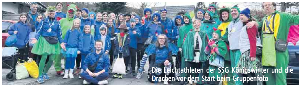
Die Leichtathleten der SSG Königswinter und die Drachen vor dem Start beim Gruppenfoto