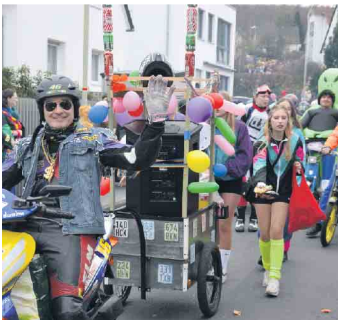
Die Mofa-Gang knatterte durch Ittenbach