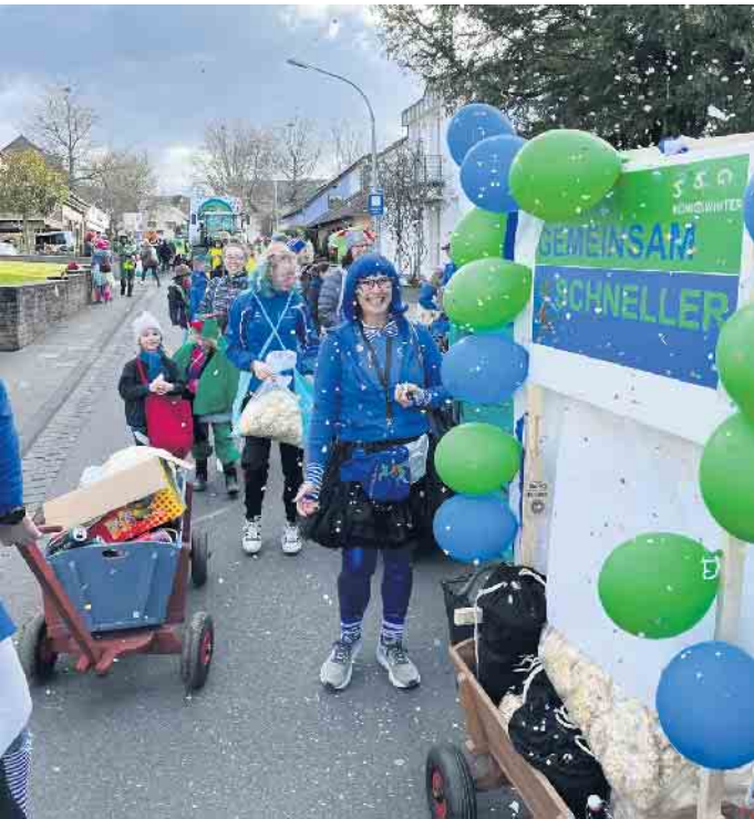
Jecke Leichtathleten auf der Oelbergstraße in Heisterbacherrott

sein werden historische Landkarten Gesamtschlesiens sowie einzelner Teilregionen, Stadtpläne und Spezialkarten, außerdem Ansichten schlesischer Städte und Landschaften mit einem Schwerpunkt auf der Region Glatz sowie Bücher und Mappenwerke. Dem Besucher bietet die Ausstellung einen Überblick über die Entwicklung Schlesiens, die Geschichte der Kartographie, den Fortschritt der Drucktechnik und den Wandel des Zeitgeschmacks von mehr als 400 Jahren. Mit musikalischer Begleitung durch die Musikschule Königswinter. Der Eintritt frei, um Anmeldung unter 02244 886 231 oder kultur@hausschlesien.de wird gebeten.