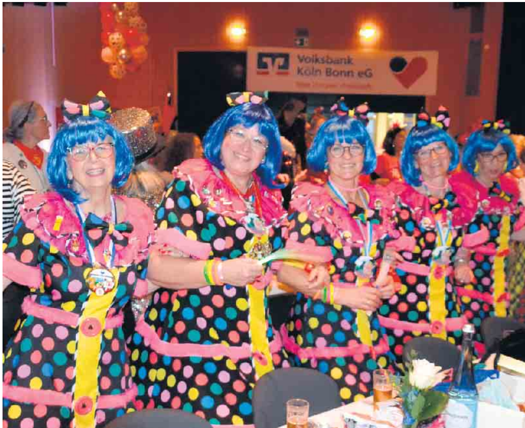
Auch die Damen des „KEC“ fühlten sich pudelwohl

Im Oberpleiser Gürzenich feierten die Weiber wie raderdoll und ließen ihrem Spaß freien Lauf