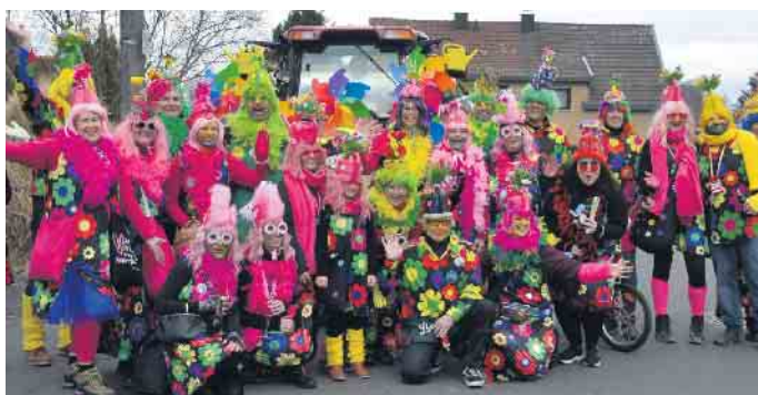
Blumenkinder machten den Karnevalzug kunterbunt