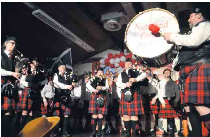
Ein toller Auftritt der Nutscheid Forest Pipe Band