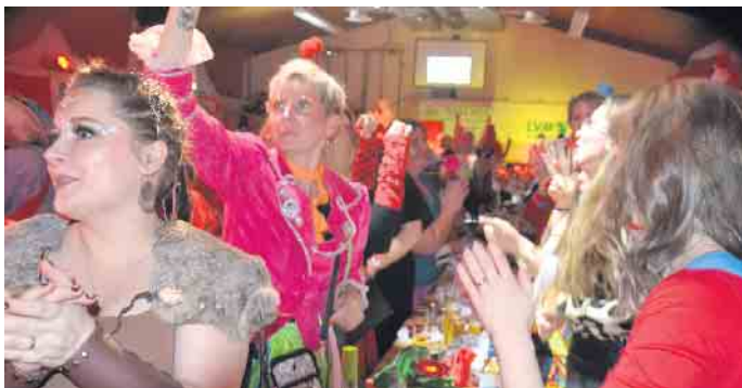
Die Weiberschar war in bester Stimmung