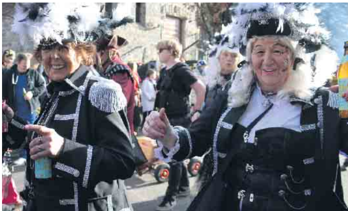
Der Vielfalt war auch im Zoch durch Thomasberg und Heisterbacherrott keine Grenze gesetzt