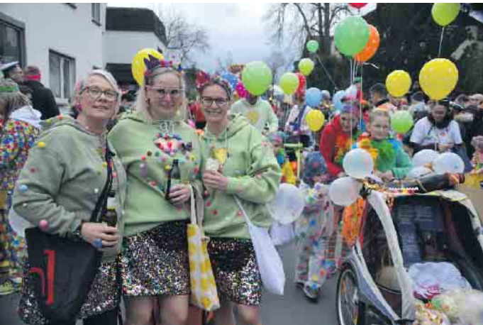
Ein kunterbundes Bild im Ortskern von Oberpleis