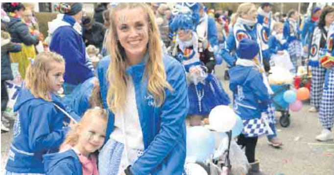
Die Kids in Blau und Weiß bestimmten das bunte Bild im Karnevalsaufmarsch