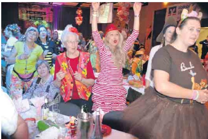
Eine Hoch auf den Fastleer