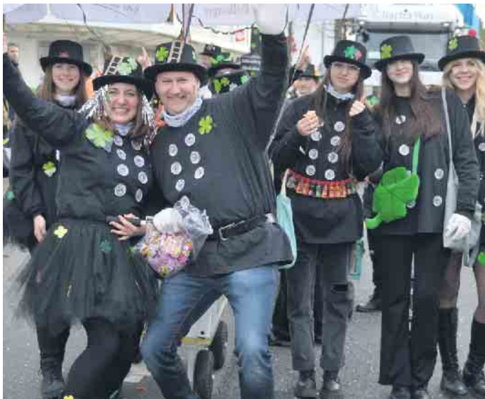
Schornsteinfeger belebten das Bild, dass sich den Karnevalisten zeigte