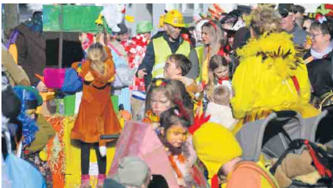
Ein karnevalistisches Spektakel bei strahlendem Sonnenschein