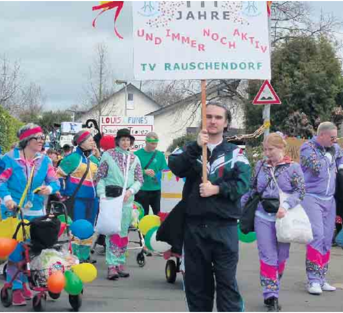
Der TV Rauschendorf feierte sein Jubiläum im Zug