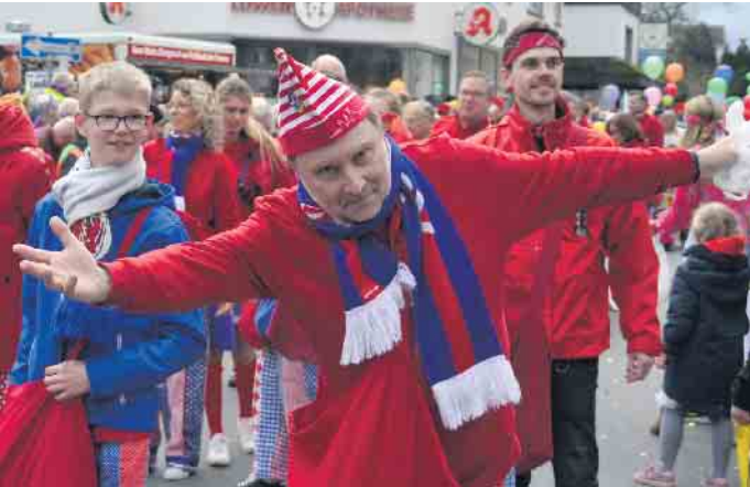
Eine Verbeugung vor dem Fasteleer - die KG Eisbach war auch mit dabei

paar. Gleiches galt auch für das Kinderprinzenpaar aus Uthweiler, das traditionell durch den Zoch in Oberpleis zieht. Nicht nur aus Ort selbst hatten sich die Gruppen angemeldet. So zog die KG Eisbach unter dem Motto „Us Spass an der Freud“