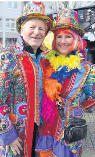
Wie lieben den Karneval und genießen das gemeinsame Feiern wie hier auf der Markschau