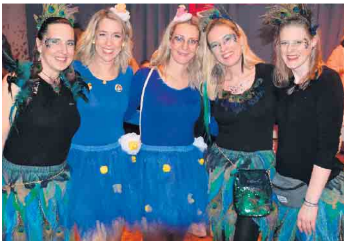
Spaß und Freund in Reinform - so auf der Weibersitzung im Oberpleiser Gürzenich