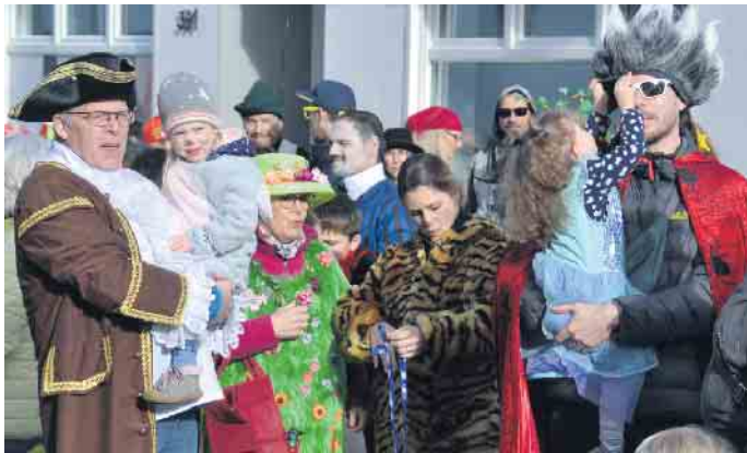
Auch die kleinen Jecken freuten sich über das närrische Geschehen im und am Karnevalszug