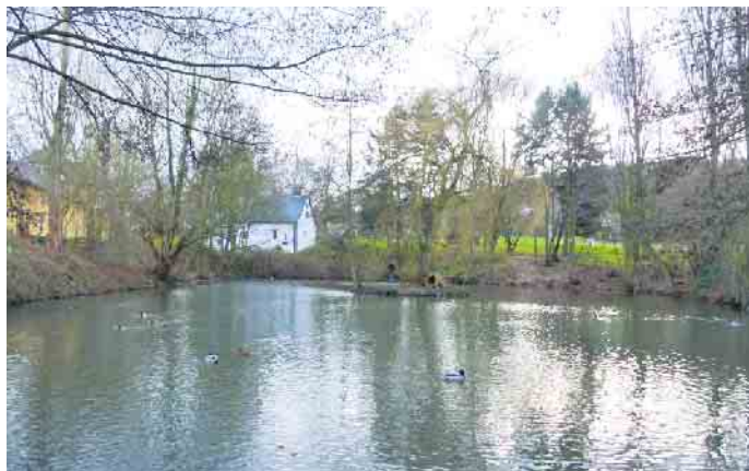
Mit den Maßnahmen soll eine allmähliche Verringerung der Schlammmenge erreicht werden.

gewertet und kann seine Funktion innerhalb der Parkanlage neben Haus Schlesien besser erfüllen. Die Jahreszirkulationsleistung beträgt 800.000 m³. Zwei Solarpaneele auf dem Modul versorgen das System permanent mit dem notwendigen Strom, wodurch ein klimaneutraler Anlagenbetrieb erreicht wird. Die Solarpaneele sind mit Vogelschutzdrähten versehen. Das Modul ist mit Mess-Sonden ausgestattet, über die Temperatur und Sauerstoffgehalt des Wassers fernüberwacht werden können. Für die Parkanlage sind bezüglich der Bepflanzung und Pflege noch weitere Maßnahmen in Vorbereitung. Die Stadtverwaltung steht bei Rückfragen zur Regenerationsanlage unter Osman.Baydan@koenigswinter.de zur Verfügung.