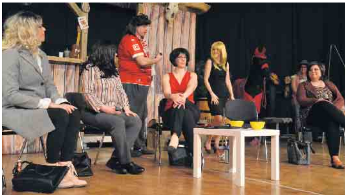
Die Zunftfrauen hatten sich einiges einfallen lassen, um die Weiberschar zu begeistern