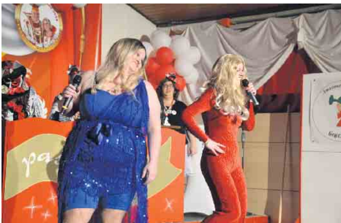
Zahlreiche „Eigengewächse“ erfreuten die Narrenschar