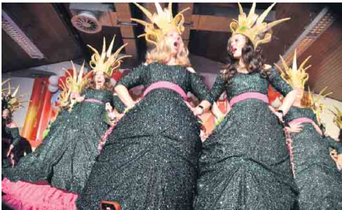
Die Amazonas überraschten die Weiber mit einem tollem Auftritt