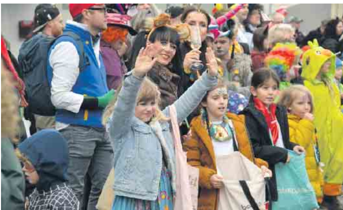
Die Kids wurden mit Süßigkeiten überhäuft und die Tüten füllten sich zunehmend