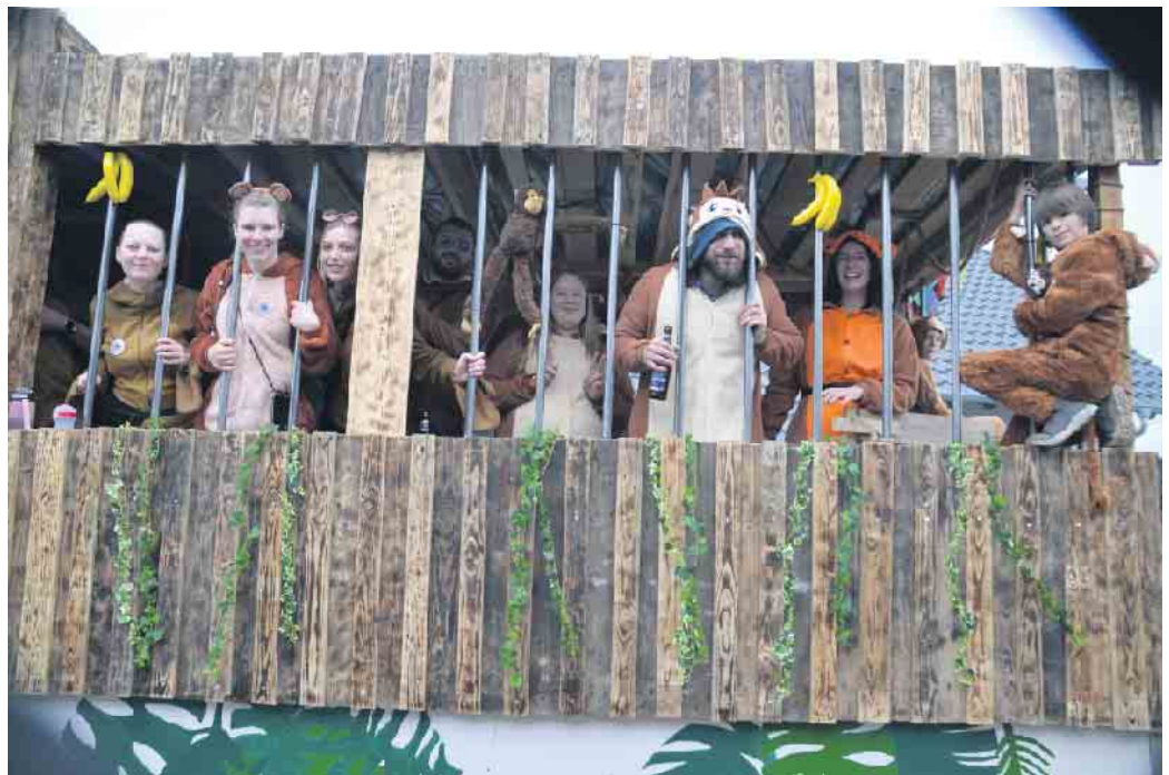
Hammelshahn 2.0 versuchte ihrem Affenkäfig zu entkommen und in die Wälder des Oberhau zu flüchten