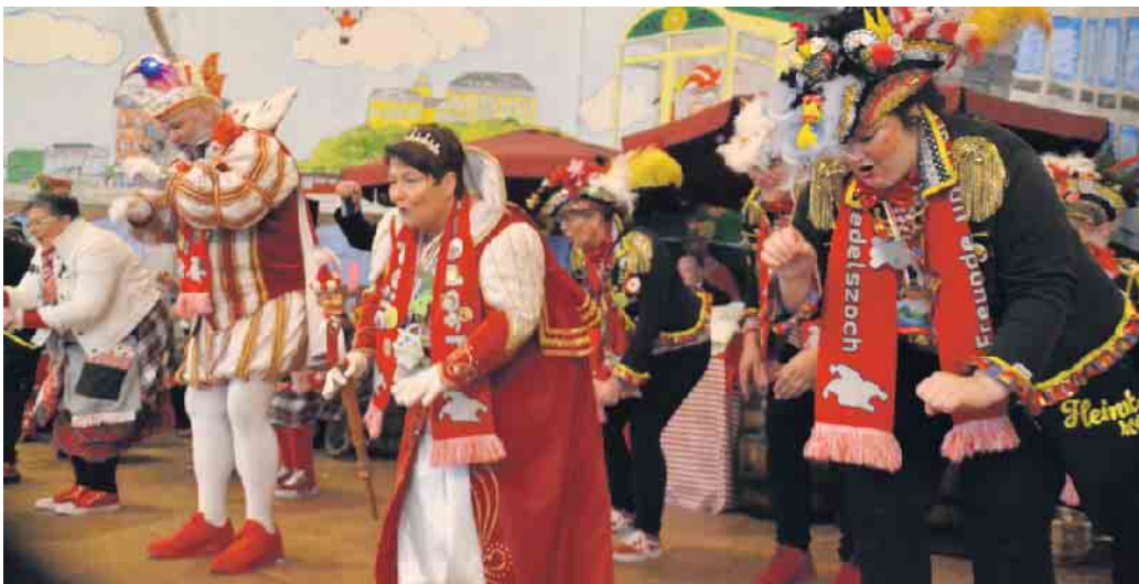
Die Tollitäten rockten die Bühne