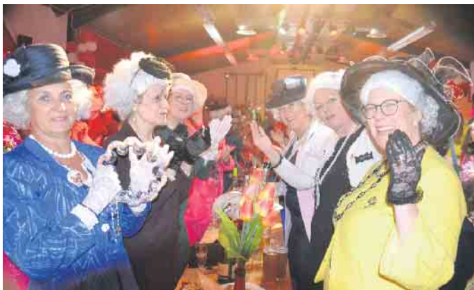
Die Mädels fühlten sich bei den Amazonas pudelwohl

den Prinzenpaar zu vorgerückter Stunde in den Festsaal ein. Den besonders bejubelten Abschluss machten „Nit fööhle - sons klatsch“et“ die gemeinsam mit der Nutscheid Forest Pipe Band auf der Bühne zu sehen waren. Ein tolle Weibersitzung, die mit einem dreifachen „Amazonen - drink us“ endete und damit der wartenden Mönnerschar den Zutritt in den Narrentempel ermöglichte.