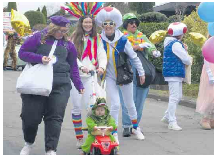
Selbst die Kleinsten zogen bereits durch die Straßen

ten Jahren auch ortsübergreifend einen Zug zusammen zu stellen, der möglicherweise in Oelinghoven beginnt und durch Stieldorf nach Rauschendorf führt“, so Wichartz.