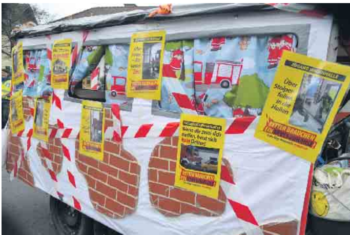
Die Freiwillige Feuerwehr Ittenbach machte auf die Mängel ihres Feuerwehrhauses aufmerksam