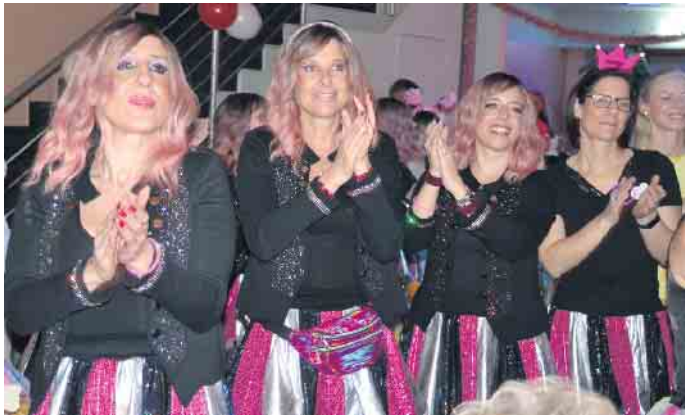
Die Damenwelt hatte ein tolles Outfit