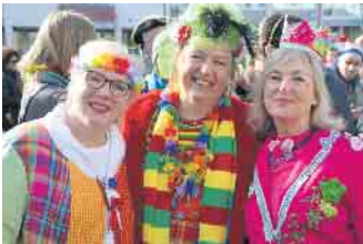
Beste Stimmung bei Karnevalisten, die auf den Rathausvorplatz gekommen waren