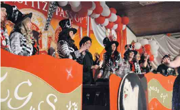
Die Amazonas feierten einen tollen Weiberfastnacht