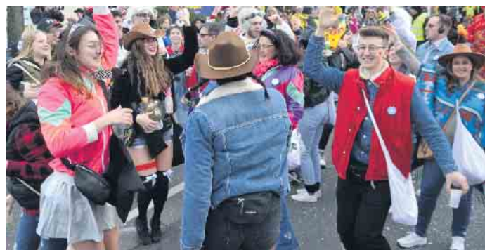
Im Zug wurde getanzt und geschunkelt