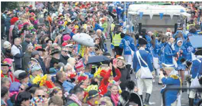
Die Narrenschar am Zugrand war gigantisch