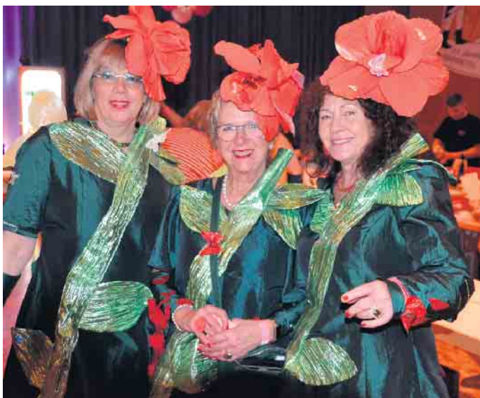
Die Outfits der Damen waren nicht zu toppen