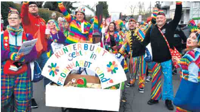
Die Frohnhardter Jecken waren erstmals beim Pleeser Zoch mit dabei