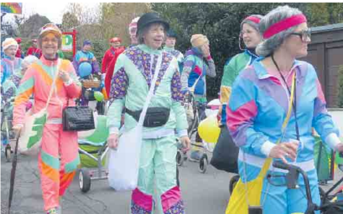
In bunten Kostümen ging es durch den Ort

verein sein 40-jähriges Bestehen und hatte damit natürlich die Ehre des letzten Wagens. Bereits im Vorfeld hatte die KG Neues Rauschendorf e.V. den Karnevalistischer Frühschoppen, die große Kotümparty für 350 Gästen und nun den Karnevalszug auf die Beine gestellt. Zur Afterzochparty war in der beheizte Festhalle der