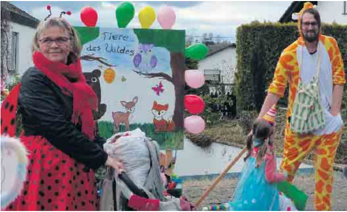
Zahlreiche Fußgruppen machten den Karnevalszug kunterbunt