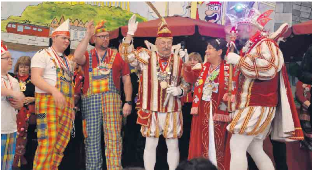
Ein Hoch auf den Kinderkarneval - die Tollitäten besuchten die jungen Karnevalisten