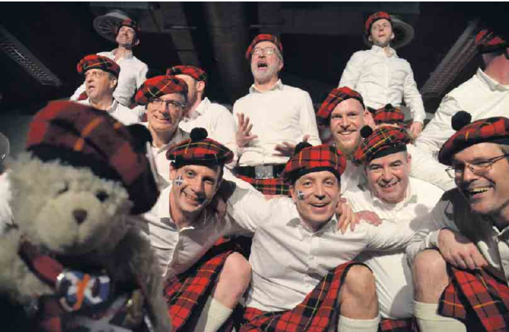
„Nit fööhle - sons klatsch’et“ durfte auf der Bühne nicht fehlen