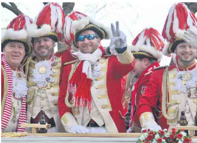
Die Ehrengarde fuhr auf ihrem Prunkwagen durch Aegidienberg