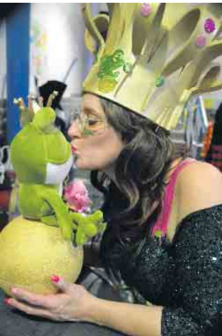
Am Ende platzte der Traum - aus dem Frosch wurde doch kein Prinz