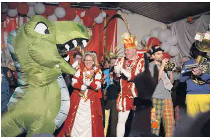
Die Prinzessin musste sich dem Krokodil zur Wehr setzen