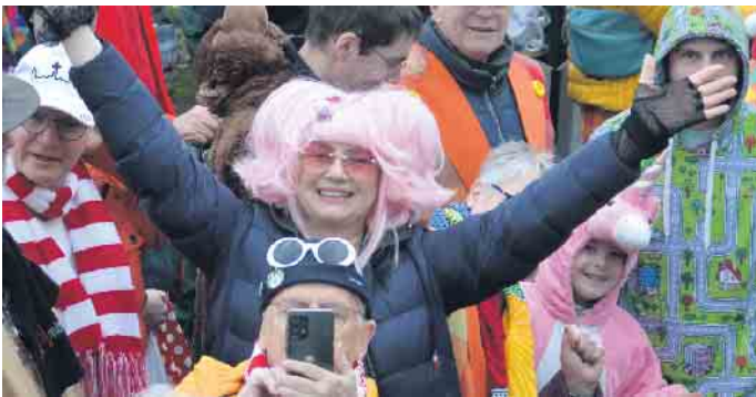
Es lebe das Karneval - Plees Alaaf