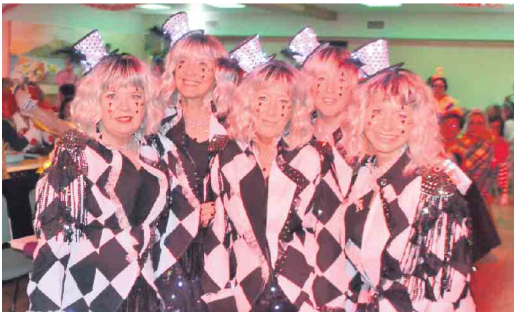
Sie hatten sich ein tolles karnevalistisches Outfit übergeworfen - die Weiberschar in Jillienberg