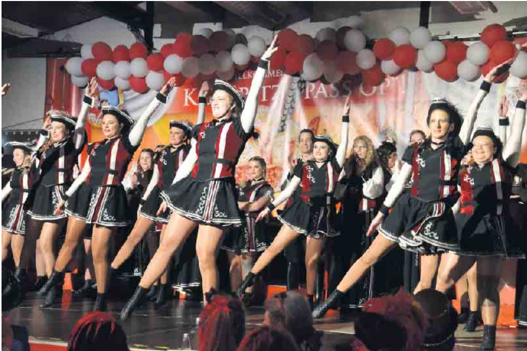
Aus Hennef war eine tolle Tanzgruppe in den Oberhau gekommen