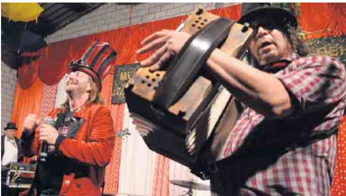
Wildbach - die etwas andere Partyband aus Tirol heizte die Stimmung mächtig an