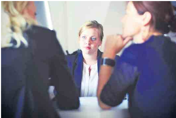
Mit gezielten Fragen können Bewerber im Vorstellungsgespräch ihr Interesse an einem Job untermauern.