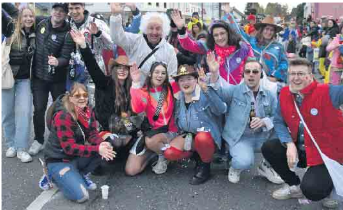
Ein dreifaches Alaaf auf den Jillienberger Karneval