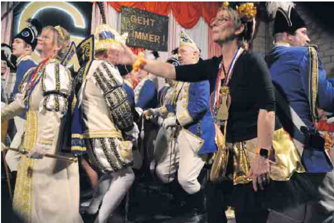
Gemeinsam mit den Goldenschnitten tanzte die Narrenzunft Stippföttje