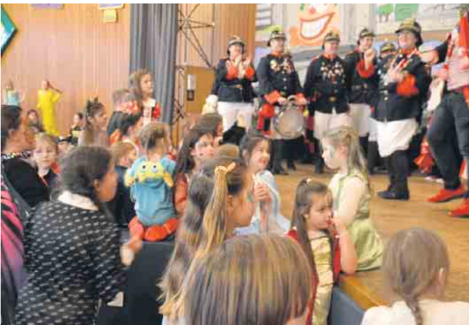
Der Musikzug der Freiwilligen Feuerwehr Königswinter-Altstadt sorgte für die karnevalistischen Töne

gab. Auch im nächsten Jahr werden die Männer vom „Team Königswinterer Kinderkarneval“ (TKKK) wieder die Tore für die Pänz öffnen. Männer, die Interesse gerne Teil dieses tollen Teams werden wollen, können die Mitglieder ansprechen und werden gerne aufgenommen.