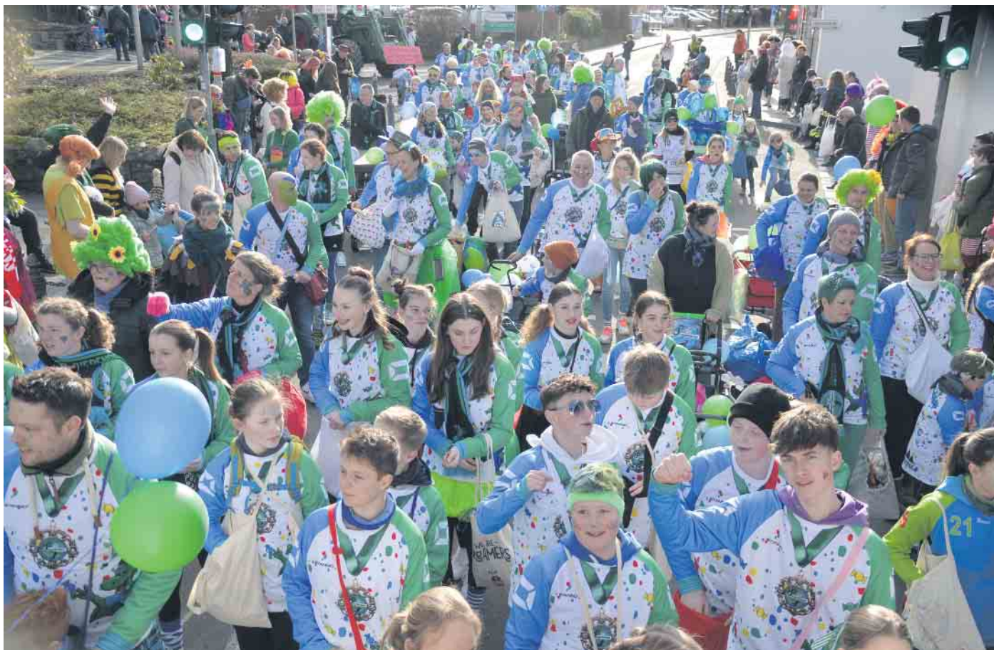
Eine tolle Gruppe - mit 140 jungen Handballern und Handballerinnen nahm die HSG a Zug teil