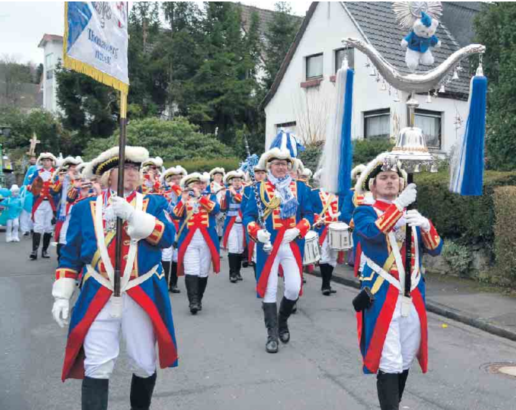
Das Tambourcorps Siebengebirge sorgte für den guten Ton