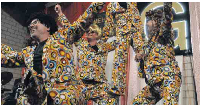
Die Herren aus dem Ort tanzten und begeisterten die Weiberschar