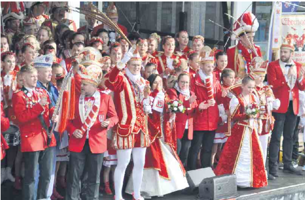
Für die KG Klääv Botz war die durchaus große Bühne noch zu klein

Ottersbach tat sich schwer seinen bekannten Marthon aufgrund des geringen Platzes zu absolvieren. Nachdem die Tanzcorps Blau-Weiß Selhof ihre Tänze präsentiert hatten, war das Jugendtanzcorps und die Tanzgarde der Ziepchens Jecke an der Reihe. Aus Rheinbreitbach waren die Kindertollitäten nach Bad Honnef gekommen. Die Old Stars der Großen Selhofer KG ließen es sich nehmen vor den Jecken aufzutreten. Nachdem die Showtanzgruppe wieder von der Bühne zeigte die Rheingarde Bad Honnef ihre Tänze. Mit dem Auftritt der KölschRockKapelle VEEDEL FOR 12 endete die tolle Bühnenshow, was jedoch nicht zur Folge hatte, dass sich die Karnevalisten auf den Heimweg machten. Es wurde weiterhin gemeinsam gefeiert und der „Fünften Jahreszeit“ mit einem dreifachen Alaaf gehuldigt.