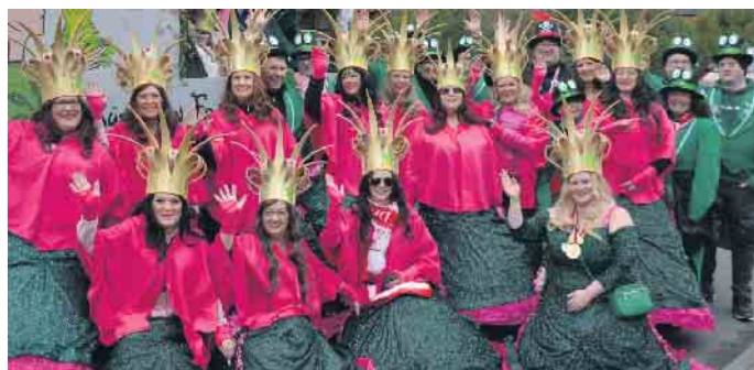
Die Hoffnung stirbt zuletzt - die Amazonas suchten ihren Froschkönig entlang des Zugweges