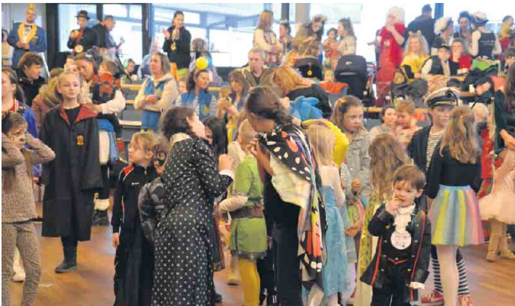
An Weiberfastnacht feierten die Kids gemeinsam mit dem „Team Königswinterer Kinderkarneval“