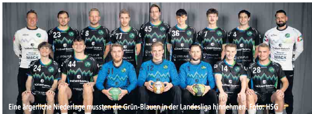
Eine ärgerliche Niederlage mussten die Grün-Blauen in der Landesliga hinnehmen.