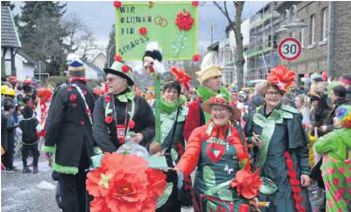
Die Blumenkinder mit tollen Kostümen