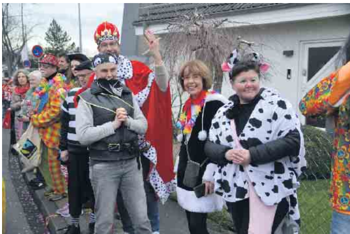
Gute Laune am Zugweg - die Jecken freuten sich über den farnefrohen Zug