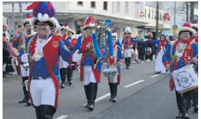
Der Spielmanszug TV Eiche sorgte für jecke Töne