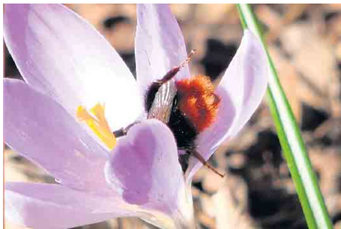
Die ersten Frühlingsboten sind schon da

Hinweis zum allgemeinen Hecken-schnittverbot: In der Zeit vom 1. März bis 30. September dürfen Hecken, Wallhecken, Gebüsche sowie Röhricht- und Schilfbestände weder abgeschnitten noch zerstört werden. Kleinere Formschnitte dürfen jedoch ausgeführt werden. Hinweis zum Rückschnitt der Stauden und Gräser: Wer sinnvollerweise über den Winter seine Stauden und Gräser hat stehen lassen und diese nun zurückschneiden möchte, sollte den Schnitt ein paar Tage im Garten oder auf der