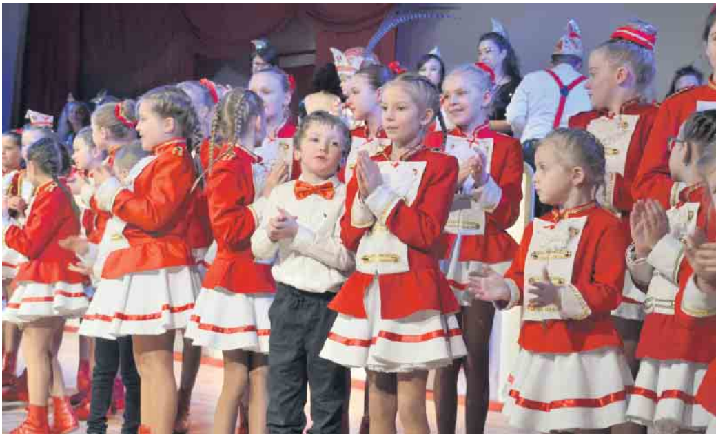
Die Kindertanzgruppen der KG Klääv Botz tanzten für die Mamas