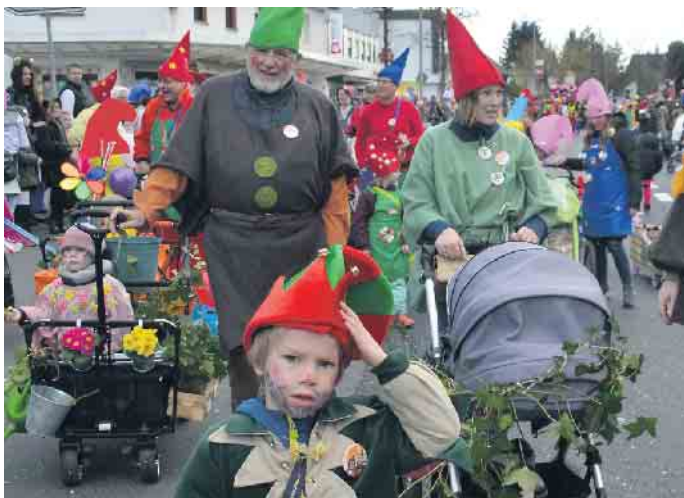
Auch die Kids gingen im Zug mit