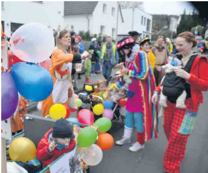
Kunterbunt ging es auch in Ittenbach zu