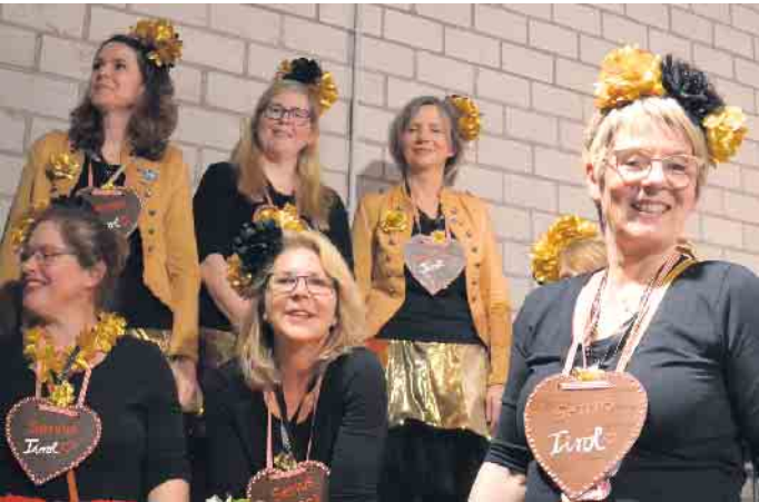
Die Goldenschnitten feierten mit den Mädels eine tolle Weibersitzung

(bk) Uthweiler. Die legendäre Weibersitzung der Goldschnitten des Bürgervereins Uthweiler lockte wieder zahlreiche jecke Damen an, denen in der goldenen Festhalle der Baumschule Neuenfels ein tolles Programm geboten wurde. Traditionell begann das närrische Treiben mit einer Stärkung. Kaffee und Kuchen stärkte die jecken Weiber, um danach in das kunterbunte Programm zu starten. Neben den Auftritten der Goldenschnitten zeigten sich die Zunftfrauen Oberpleis, das Bockeroth Damenkomitee und die Berghexen aus Niederbuchholz auf der Bühne. Auch die Tollitäten aus der Nachbarschaft mitsamt Bläsercorps und Tanzgruppen ließen sich in Uthweiler blicken. Eingehetzt wurde der weiblichen Narrenschar von den „Söhnen Rauschendorf“ aber auch vom UDC, der Männertruppe des Ortes, die über die Bühne fetzte und dafür tosenden Applaus erhielt. Erstmals puschte die Tiroler Partyband „Wildbach“ die Stimmung. Das Duo Rainer und Helmut sorgte derweil für den guten Ton im Uthweiler Narrentempel.