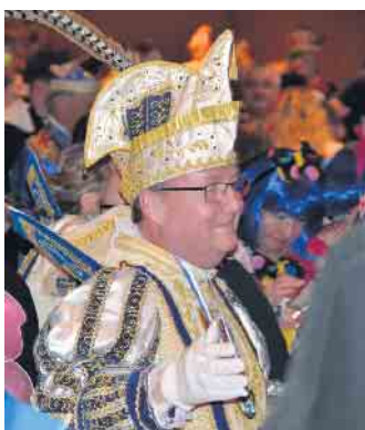
Noch nicht proklamiert aber bereits in den Herzen der Narrenschar