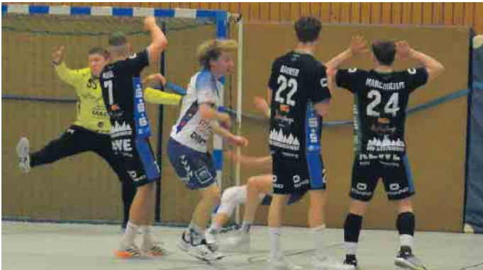
Der HSG-Keeper machte dem Gegner das Leben schwer