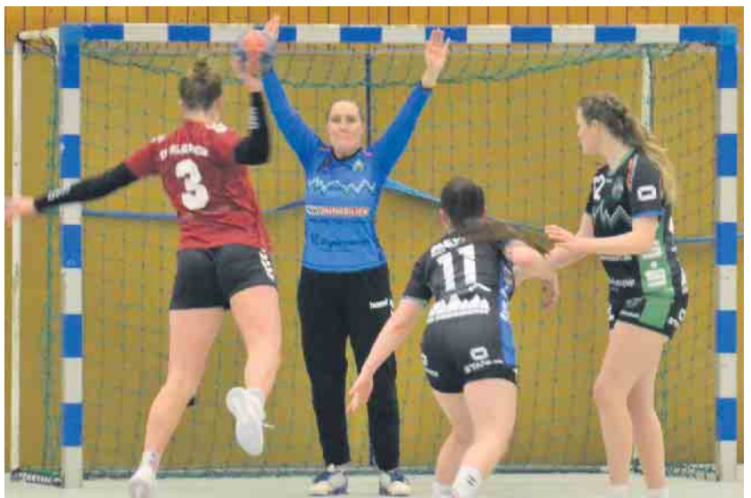
Immer wieder luden Lücken in der eigenen Abwehr den Gegner zu erfolgreichen Abschlüssen ein