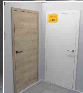
Abb. sind Beispiele! Produkte in Ausstellungen und Lager können abweichen!

KLEIN BAUSTOFFE Baumarkt Brennstoffe FUTTERMARKT