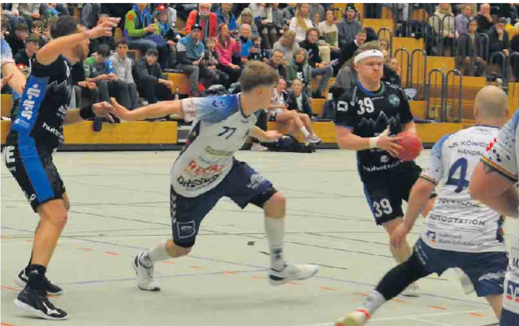
Mit zunehmender Spieldauer fand die HSG immer besser ins Spiel