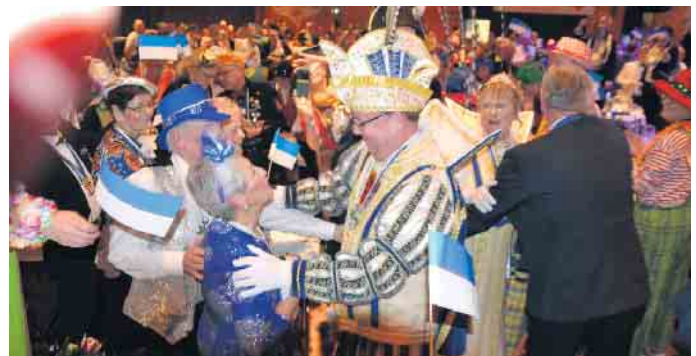
Bereits der Einzug wurde zu einem waren Triumpfzug