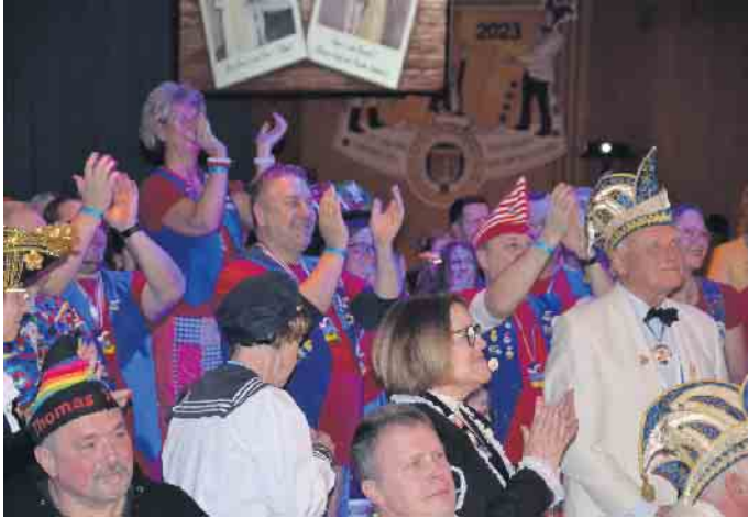
Die KG Eisbach feierte das Prinzenpaar aus den eigenen Reihen

pass op aus Eudenbach war die erste Gesellschaft, die dem neuen Prinzenpaar durch ihren Auftritt gratulieren konnte. Damit ging eine kunterbunte Proklamation zu Ende, für Prinz Rainer II. und Prinzessin Gabi II. der Start in ihre närrische Session.