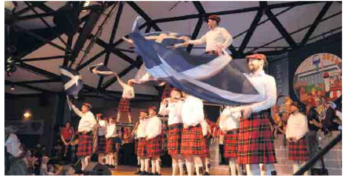
Nit fööhle - son's klatsch et, die Männertanztruppe aus Eudenbach tanzten für die Jecken im Saal