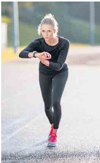
Immer mehr Menschen halten sich mit Sport fit und nutzen dabei auch sogenannte Wearables wie eine Fitnessuhr.

Neben den Leistungen des zweiten Gesundheitsmarktes haben auch digitale Dienste und Apps für das individuelle Training sowie Wearables immer mehr an Bedeutung gewonnen. Ausgaben für Aktivitäten in den Bereichen Sport, Fitness und Gesundheit werden bereits von vielen Krankenkassen erstattet. Der interdisziplinäre Studiengang Bachelor-of-Science Sport-/Gesundheitsinformatik etwa qualifiziert die Absolventinnen und Absolventen, digitale Trainings-, Assistenz- und Datenverarbeitungssysteme speziell für die Sport-, Fitness- und Gesundheitsbranche zu entwickeln. (djd)