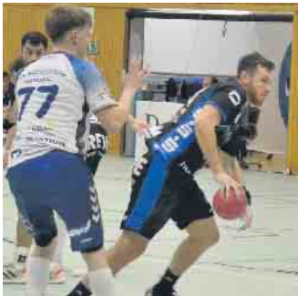
Konsequent nutzt der Gastgeber seine Chance und siegte am Ende auch verdient

dem Wechsel des Abwehrsystems konnten wir dann die Königsdorfer vor Probleme stellen und uns so einen guten Vorsprung erar-