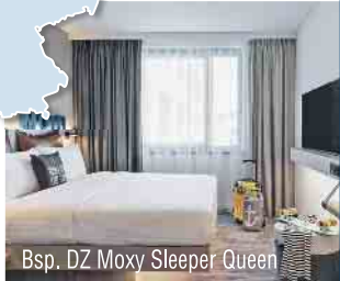
Bsp. DZ Moxy Sleeper Queen