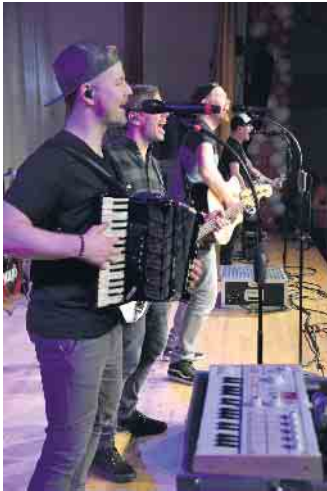
Die Bands gaben sich während der Superparty die Klinke in die Hand