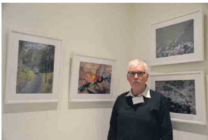
Karl-Heinz Rohde ist der Fotograf im Fotoclub, der die größte Nähe zur Welt der Technik hat.