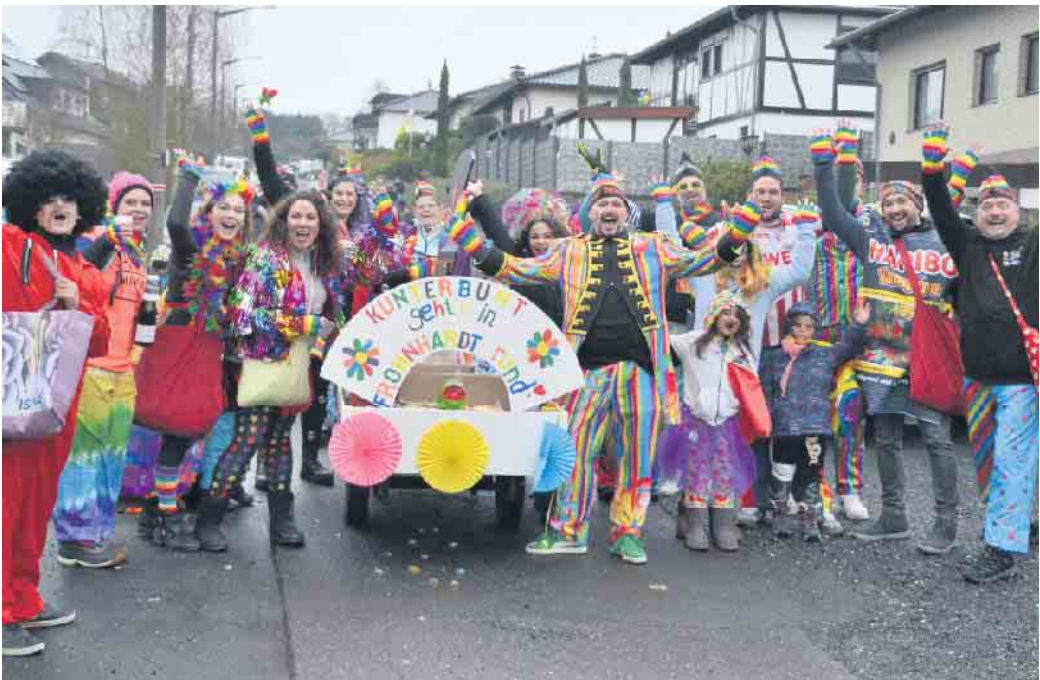
Kunterbunt in den Straßen von Frohnhardt, hier die Mitglieder des ausrichtenden Vereins

Ein besonderer Zoch inmitten der Session zog durch Frohnhardt - erstmals hatte der Verein „Fröhliches Frohnhardt“ zum Straßenkarneval eingeladen