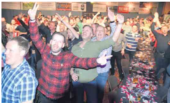
Plees Alaaf - der Saal tobte und der Durst stieg