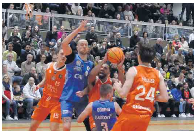
Die Dragons begeisterten ihre Fans und siegten verdient gegen die CATL Basketball Löwen