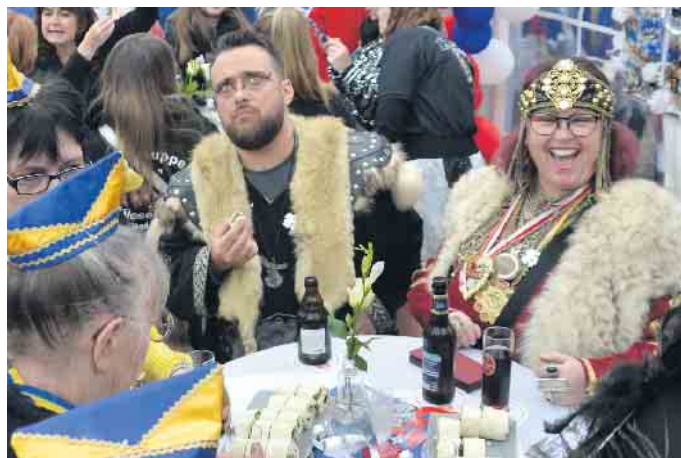
Gute Laune und tolle Stimmung auf der Geburtstagsfeier