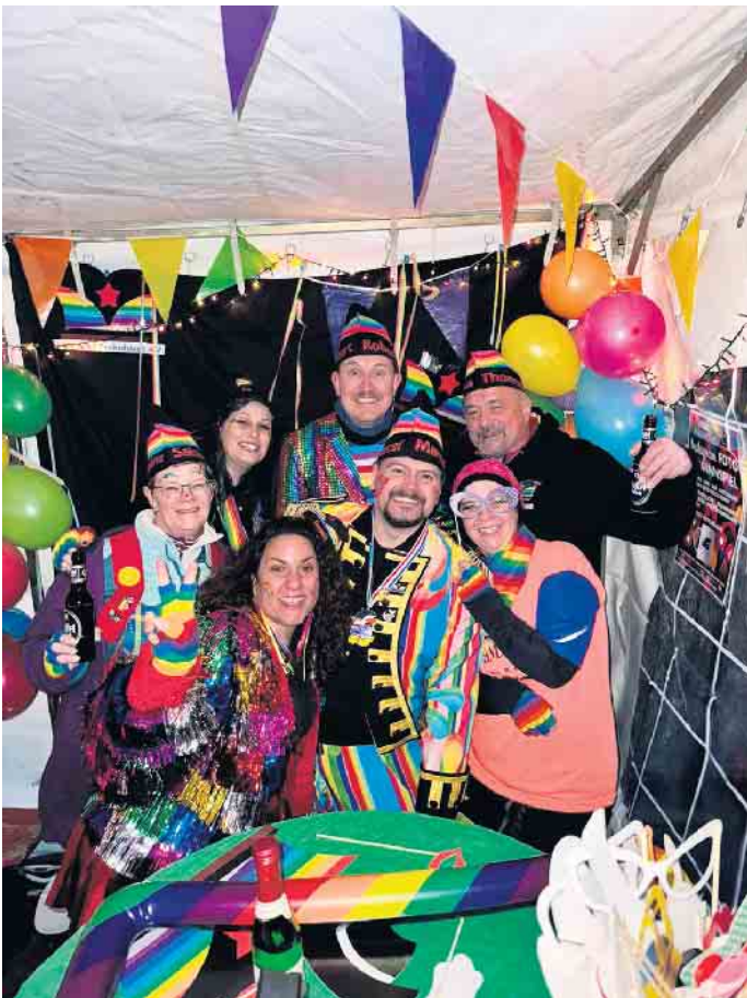
Der Vorstand des Vereins „Fröhliches Frohnhardt“ freute sich über die zahlreichen Karnevalisten im Zoch des Ortes

(bk) Frohnhardt. Anderenorts werden die Prunkwagen noch auf Vordermann gebracht und die Karnevalszüge als Höhepunkt jeder Session vorbereitet. Nicht so in Frohnhardt. Hier hatte man den Zoch bereits mitten in die laufende Session gelegt. Der Verein „Fröhliches Frohnhardt“, der es sich auf die Fahnen geschrieben hat, das gesellschaftliche Leben des Ortes oberhalb von Oberpleis zu beleben und dies auch bereits im vergangenen erfolgreich unter Beweis gestellt hatte, wollte auch das Karnevalstreiben nicht auslassen. Klein aber fein ging es dabei zu. Es war wohl der erste Karnevalszug in der Region, aber auch mit einer Wegstrecke von annähernd 400 Metern wohl der kürzeste im gesamten Siebengebirge. Doch all dies tat dem Spaß, den die Teilnehmer wie auch die Karnevalisten rechts und links des