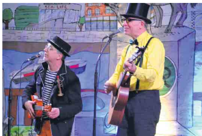
Das Krätzjer-Duo „Zwei Hillije“ präsentierte eine klassische, karnevalistische Form des musikalischen Zwiegesprächs