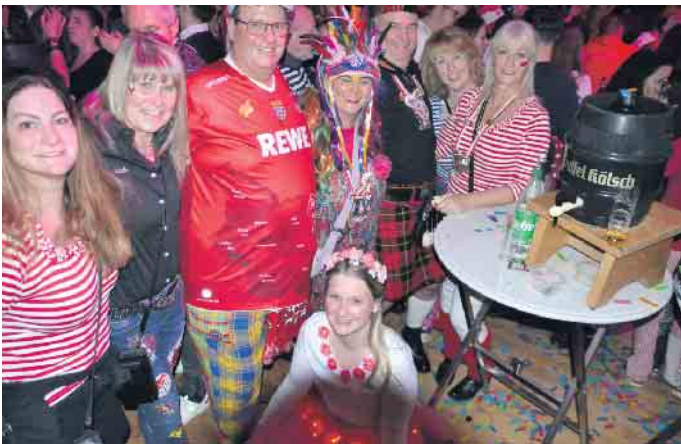
Im Bürgerhaus wurde ausgelassen Karneval gefeiert