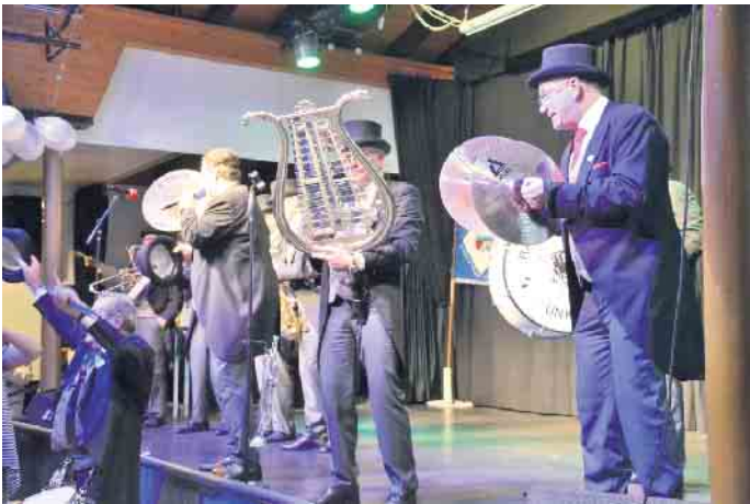
Die „Unkeler Ratsherren“ sind auf der närrischen Bühne in Thomasberg stets herzlich willkommen