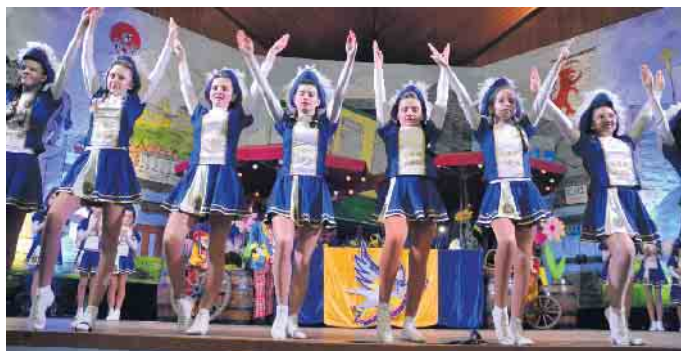
Die Tanzgruppen der Postalia begeisterten des närrische Publikum