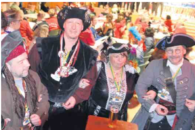
Aus Ittenbach waren die Piraten nach Aegidienberg gekommen