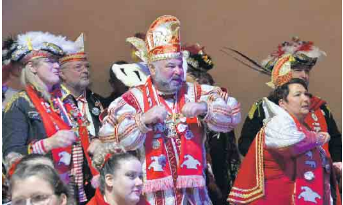
Auch die Tollitäten aus Niederdollendorf feierten im Bürgerhaus