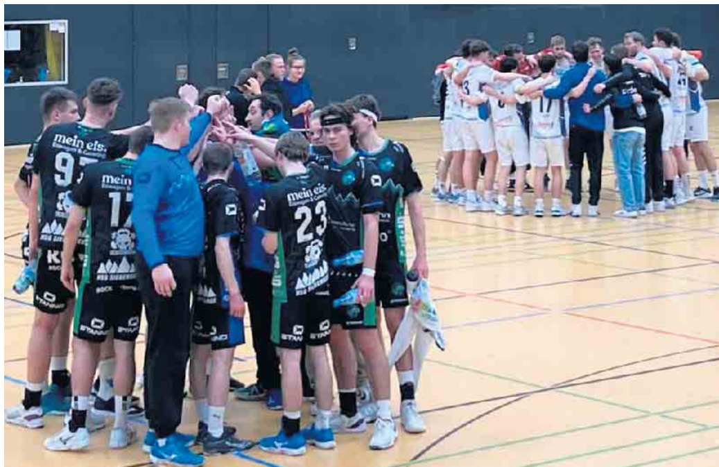
Die HSG (v.) musste sich gegen Geislar geschlagen geben.