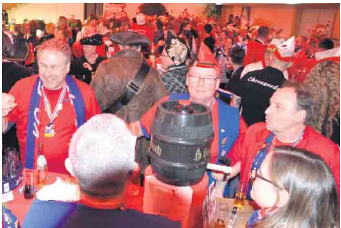
Die KG Eisbach fühlte sich in Jillienberg wohl und verfolgte das närrische Programm