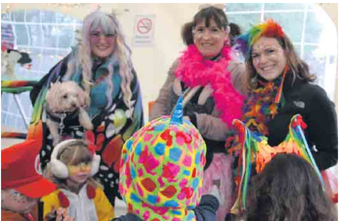
Nach dem Zoch feierten Jung und Alt im Festzelt