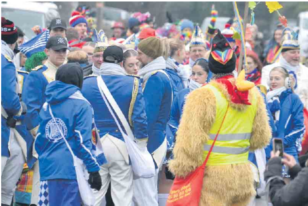
Befreundete Gesellschaften aus Oberpleis und Eisbach ließen den Fronhardtter Straßenkarneval nicht entgehen