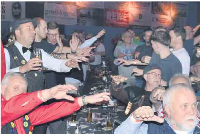
Die Stimmung auf dem Höhepunkt - die Männerschar war nicht mehr zu bremsen