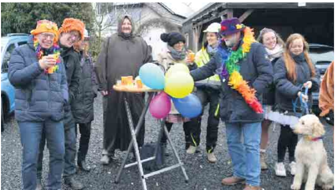
Am Zugrand feierten die Frohnhardter selbst bei kalten Temperaturen