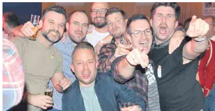
Mir sin jood drop - dessen waren sich die Jecken sicher