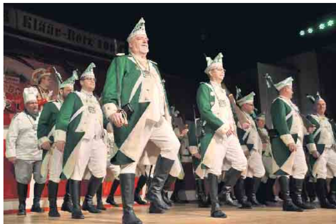
Die staatze Käls der Küzengarde tanzten für die Damenwelt im Saal