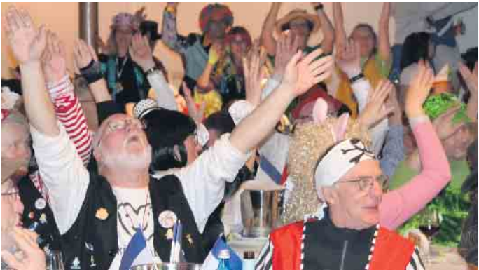
Ein Hoch auf den Karneval - die Narren im Saal feierten gemeinsam mit der Strücher KG

Der Franz-Unterstell-Saal war in blau und weiß geschmückt und die Kostümsitzung der Strücher KG nahm ihren abwechslungsreichen Lauf