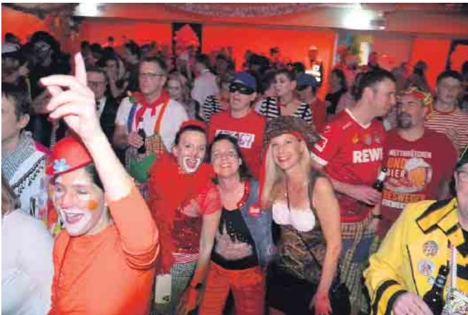
Eine Superstimmung bei „Jeck is geil“ im Aegidienberger Narrentempel