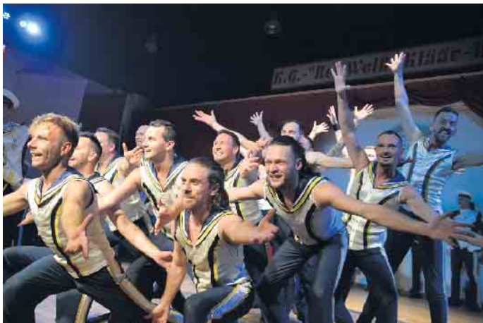
Das Männer-Tanzcorps der Stattgarde Colonia begeisterte die Narrenschar