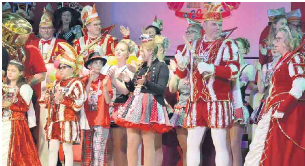
Die KG Spitz pass op war gleich mit zwei Prinzenpaaren gekommen