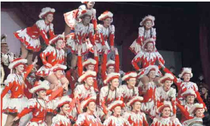
Tolle Tanzdarbietungen auf dem Frühschoppen im Bürgerhaus