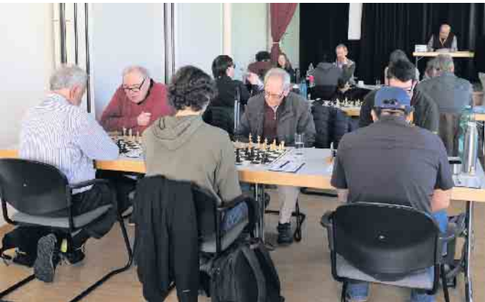
Bei einem Turnier im Probsthof in Königswinter-Niederdollendorf