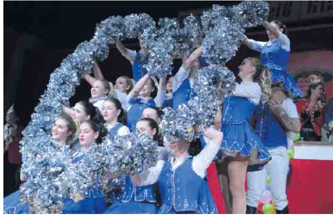
Mit einem Herz aus Silber bedankte sich das Tanzcorps der Oberpleiser Narrenzunft bei den Jecken im Saal