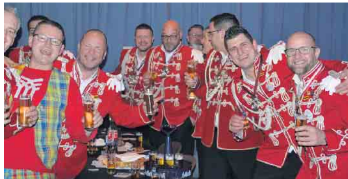
Selbst aus Asbach lohnte es sich zur Herrensitzung der Spitze[n]männer zu kommen