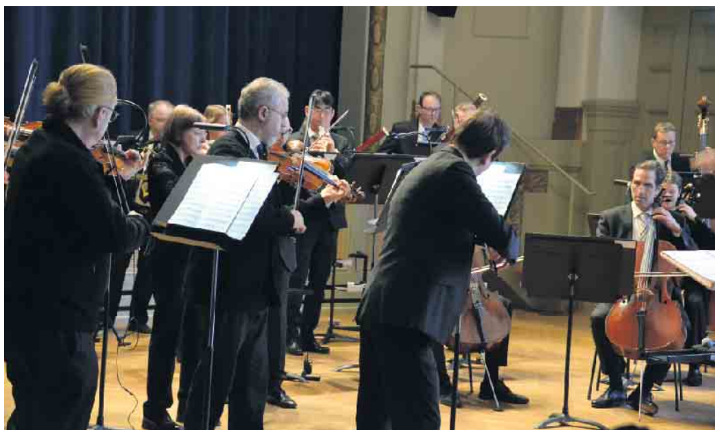
Die „Hofkapelle“ des Beethoven Orchesters Bonn überzeugte im Honnefer Kursaal