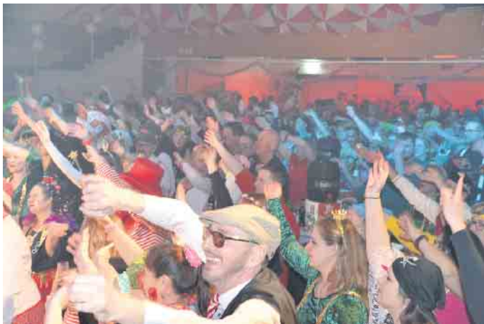
Das närrische Publikum war kaum mehr zu bremsen und feierte einen tollen karnevalistischen Abend