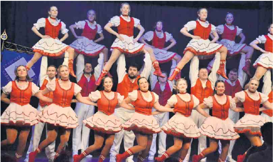
Das Ehrentanzcorps der KG Kölsche Figaros, „Agripina Colonia“ zeigte eine Höchstleistung tänzerischen Könnens