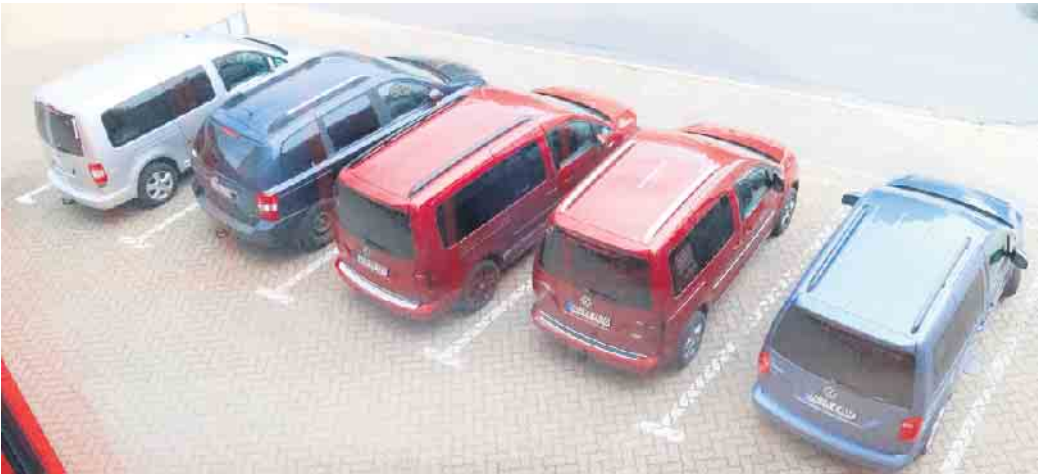
Die Caddys vor dem DDR Museum in Thale.