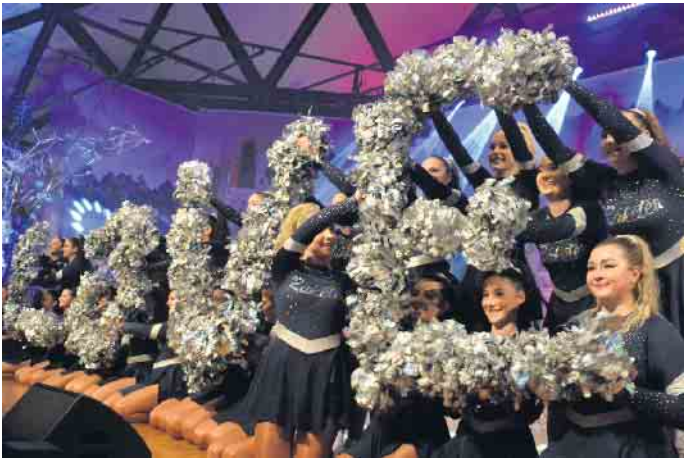
Eine Liebeserklärung der Bielsteiner Raketen an das jecke Narrenvolk im Saal

(bk) Oberpleis. Es ist stets ein erlauchtes Publikum, das auch in dieser Session in der voll besetzten Aula im Schulzentrum Oberpleis um Einlass bat. Als sich dann die Türen schlossen, nahm eine feucht-fröhliche „Horror“-Show ihren Lauf. Und laufen mussten auch die fleißigen Bedienungen, denn den Durst der Männerschar zu löschen, verlangte wahre Höchstleistungen. Die Darsteller der ersten Minuten machten deutlich, worum es sich an diesem Nachmittag drehte. „Mir han keene Elferrat! Mer pieffe uf de Herr[n] Senat! Mir fiere Fastelovent nur ene Daach im Jahr, is dat Brauchtum in Jefahr? Weder Prinze noch Buure, schon jar kin Jungfrau schmisse Strüssche oder Kamelle. Mir fiere Fastelovend wie