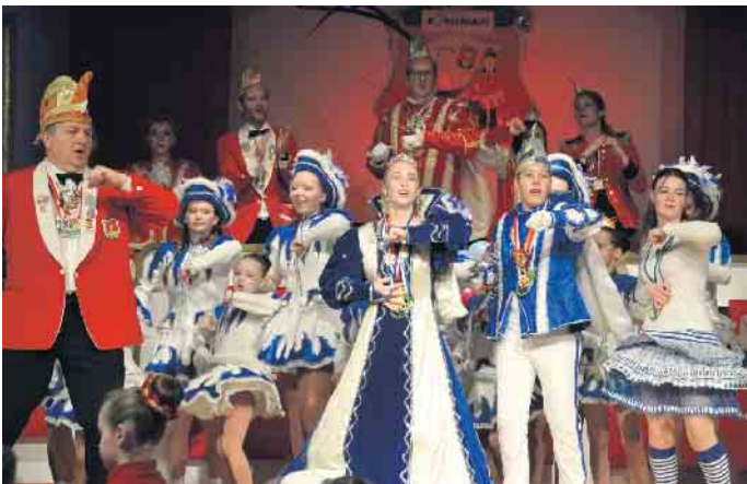
Das Kinderprinzenpaar de Strücher KG genoss den Auftritt vor den Narrenschar im Saal