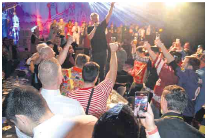
Kasalla, hier mit ihrem Frontsänger Bastian Campmann, tanzte auf den Tischen