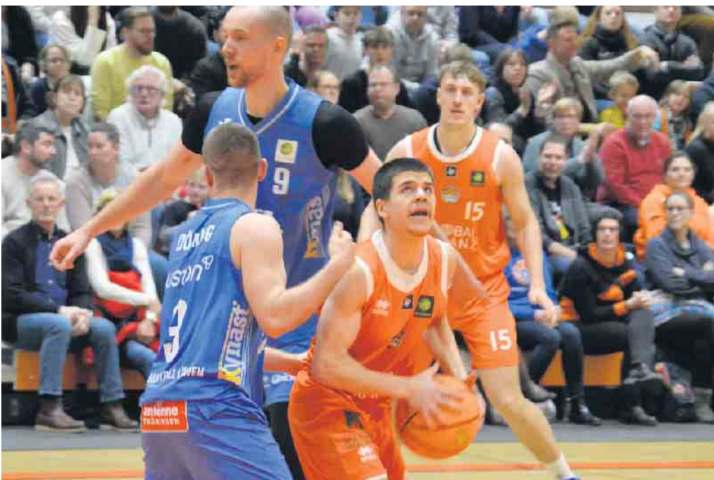
Mit Blick auf den Korb sammelte der Gastgeber Punkt um Punkt