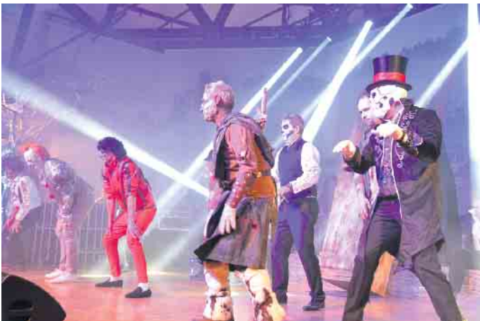
Die Horror-Show begann - seltsame Gestalten bevölkerten die närrische Bühne