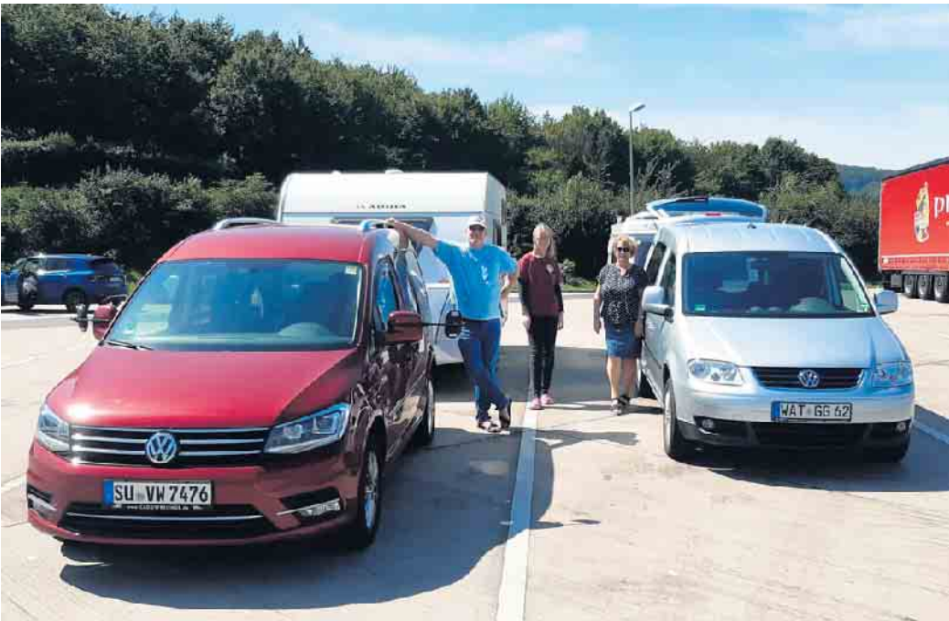
Zwei Caddyfamilien auf der Anreise zum 5. Nachttreffen im Wäller Land.