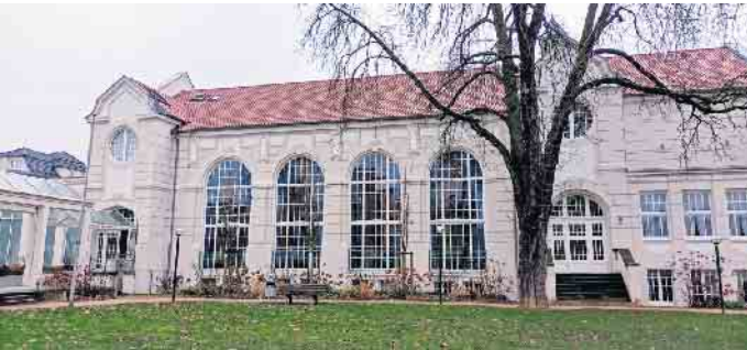
Das Kurhaus: Im Saal hinter den großen Fenstern wird das Turnier stattfinden

saal im historischen Kurhaus. Das Turnier mit dem Titel „Siebengebirgs-Open 2024“ findet statt vom 26. bis 28. April. Gespielt werden fünf Runden Schweizer System, die Bedenkzeit beträgt 90 Minuten je Spieler und Partie plus 30 Sekunden für jeden Zug. Das Angebot richtet sich an alle, die gern Schach spielen, vor allem an Spielerinnen und Spieler aus der Region. Ob groß oder klein, in einem Schachverein organisiert oder nicht - alle sind herzlich willkommen zum Siebengebirgs-Open 2024! Die Zahl der Plätze ist begrenzt, eine baldige Anmeldung daher sehr zu empfehlen. Weitere Informationen und Anmeldung unter www.sg-siebengebirge.de