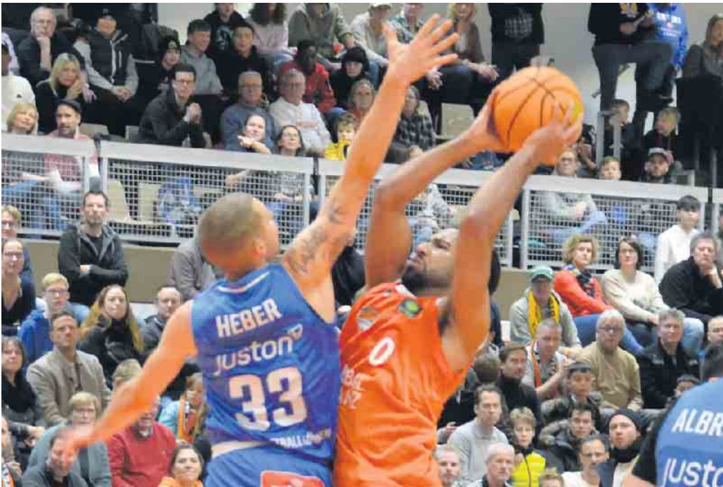
Mit einer starken ersten Halbzeit sicherten sich die Dragons einen weiteren Sieg im DragonDome