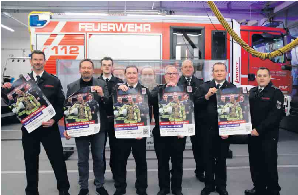
Im Feuerwehrgerätehaus der Löschgruppe Rhöndorf haben die Stadt Bad Honnef und ihre Feuerwehr die neue Mitgliederkampagne vorgestellt.