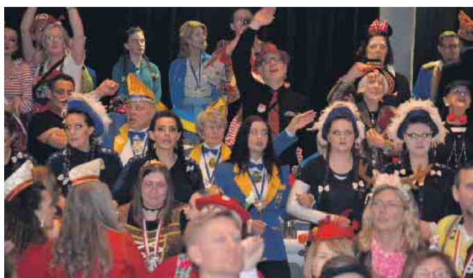
Stimmung pur im Königswinterer Narrentempel