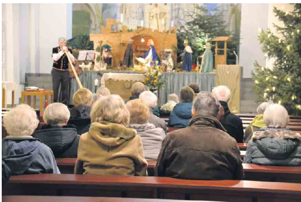
Der „Abschied von der Krippe“ wurde von einem Konzert begleitet