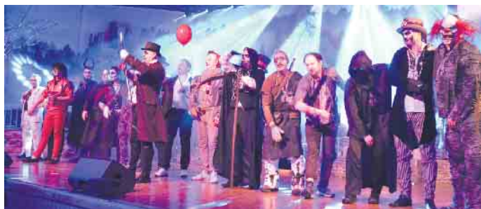
Das Horror-Team der Spitze[n]männer verabschiedete sich nach einer mehrstündigen Aktion-Show von der närrischen Bühne