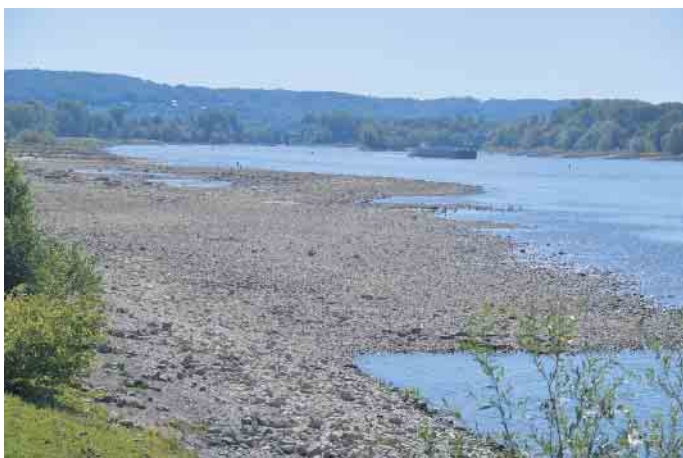
Vor der Talstation der Drachenfelsbahn musizierten Gäste aus York