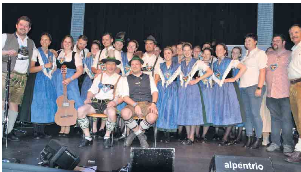
Gemeinsam mit Gästen aus Österreich feierte man in Thomasberg das Oktoberfest

„Wein & Weg“ unbekannte Ecken des Siebengebirges. Am Ende des Kirmestreibens in Ittenbach musste der Paia sich seinem Schicksal beugen. Die Stadt Königswinter ermöglicht ein Dienstrad-Leasing, um das Radfahren für die Beschäftigten der Verwaltung attraktiver zu machen. Außerdem hat man sich darauf geeinigt, die Nutzung von drei Gebäuden „Im Stadtgarten“ zur Unterbringung geflüchteter Menschen aus der Ukraine bis August 2023 zu verlängern. Der Oberhau feiert sein Kirchenjubiläum - im Jahre 1872 wurde in Eudenbach eine Notkirche, auch liebevoll der Stall von Bethlehem genannt, gebaut. Synergien, eine Premiere in der Residenz - Künstler*innen bezogen eine alte Villa in der Altstadt von Königswinter, die zum Hotspot KW gehört.