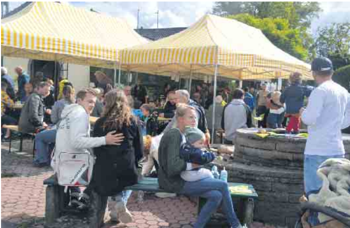
Auf dem Gassenflohmart in Rauschendorf ließ man sich, nachdem man kräftig Stöbern war, auf dem Dorfplatz nieder

Unterführungsneubau - ländliches Wegenetzkonzept - Rhein CleanUp - Seedbombs - Apfelsonntag - SchedRock Reloaded