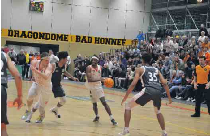
Die Dragons taten sich in der Verlängerung schwer, den Gegner zu kontrollieren

Zum Auftakt in die Rückrunde gegen RASTA Vechta II ging es in die Verlängerung