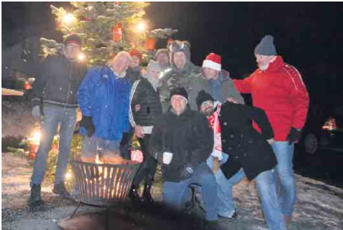
Zahlreiche Fenster öffneten sich in der Adventszeit, man kam selbst bei klirrender Kälte bei einem Glühwein zusammen, wie hier in Hühnerberg

Künstler Hotspot KW - Sea-Life - Krippenausstellung - Chirstophorusmarkt - Patronatsfest - Advents- und Weihnachtskonzerte - Grußworte