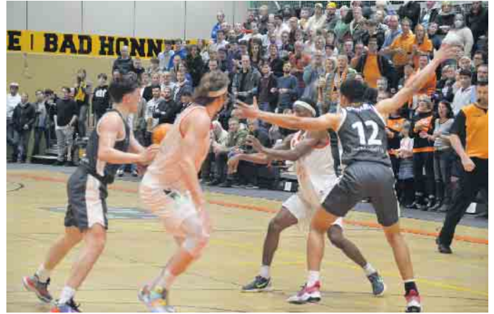
Am Ende fehlten die Kräfte und die Gäste zogen davon