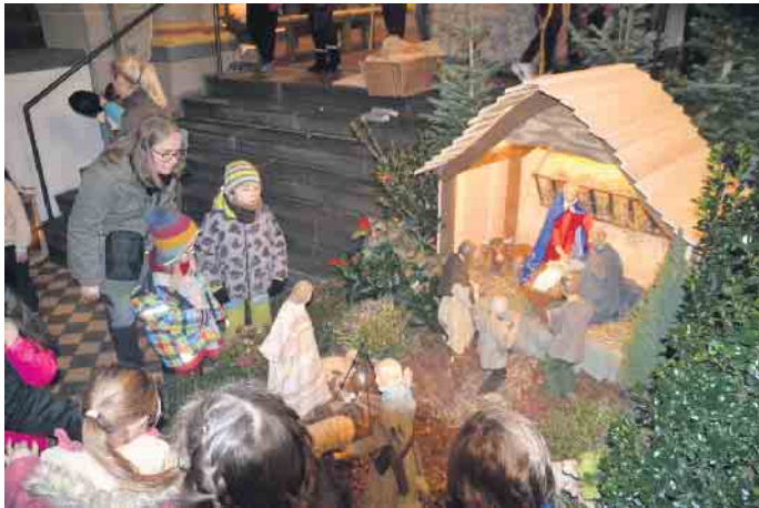
Die Krippe war wieder einmal Anziehungspunkt für Groß und Klein, wie in St. Pankratius in Oberpleis

(bk) Top secret - was geschieht da? Hotspot KW lud im Dezember zu einem Kunst- und Klangvergnügen in das ehemalige ZERA-Gebäude in der Königswinterer Altstadt ein. Viele Besucher nutzten die Gelegenheit, dem Sea-Life nochmals einen Besuch abzustatten - das Großaquarium schloss mit Ablauf des Jahres seine Pforten. Zwischen Himmel und Erde - das Siebengebirgsmuseum lud zu einer Sonderausstellung über Kirchen und Klöster im Rheinland ein. „Macht hoch die Tür“ damit war das Weihnachtskonzert des Bläsercorps Auel Gau überschrieben, dass in der kath. Kirche in Oberpleis stattfand. Verheißung, Er-