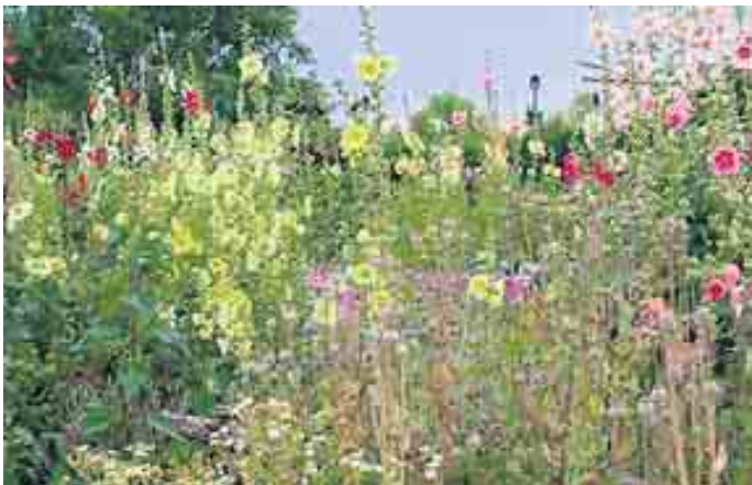
Ein idealer Lebensraum für viele Tiere - die bunte naturbelassene Wiese direkt vor der Haustüre

Insektenfreundliche und pflegeleichte Gestaltung von Gärten und Balkonen - ein Vortrag über naturnahe Gärten