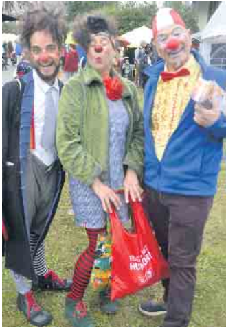
Auf dem Familienfest von Haus Heisterbach wurden die Kids von Clowns empfangen

und trafen sich anschließend zum geselligen Beisammensein auf dem Sportplatz. Beim Rhein CleanUp wurde das Rheinufer von allerlei Unrat befreit. Beim Fest der Lebensfreude fertigte das