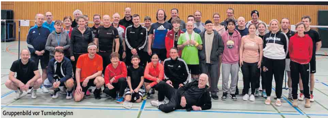
Gruppenbild vor Turnierbeginn

40 Spielerinnen und Spieler bei Badmintonturnier in Rheinbreitbach