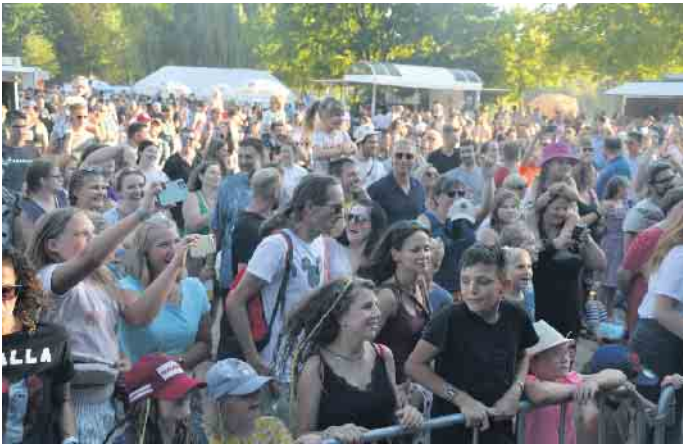
Endlich wieder ein Konzert auf Grafenwerth, das Festival lockte zahlreiche Musikfans an

Nicht Dahinter“ auf dem Marktplatz in der Königswinterer Altstadt ein Zeichen in Zeiten internationaler Konflikte. Christen aus Königswinter pilgerten für die zerstörte St. Josef Kapelle in Walporzheim an der Ahr. Zauberhaft, geheimnisvoll und prächtig - die Fantasien lockten auf Schloss Drachen-