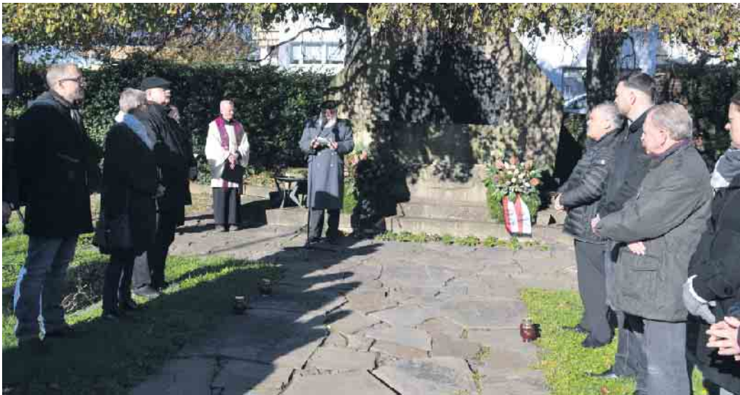
An zahlreichen Orten wurde im November der Gefallenen der Weltkriege gedacht