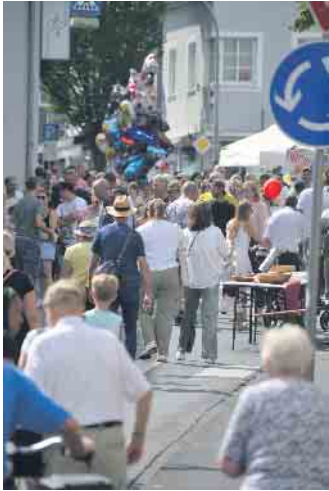
Zahlreiche Besucher zog auf den Apfelsonntag nach Oberpleis

ehrenamtlich Tätigen in Königswinter gedankt. Über 200 Bürgerinnen und Bürger waren dieser Einladung gefolgt. Rund um den Weiher hatte der Bürgerfestausschuss Heisterbacherrott wieder ein abwechslungsreiches Programm auf die Beine gestellt.