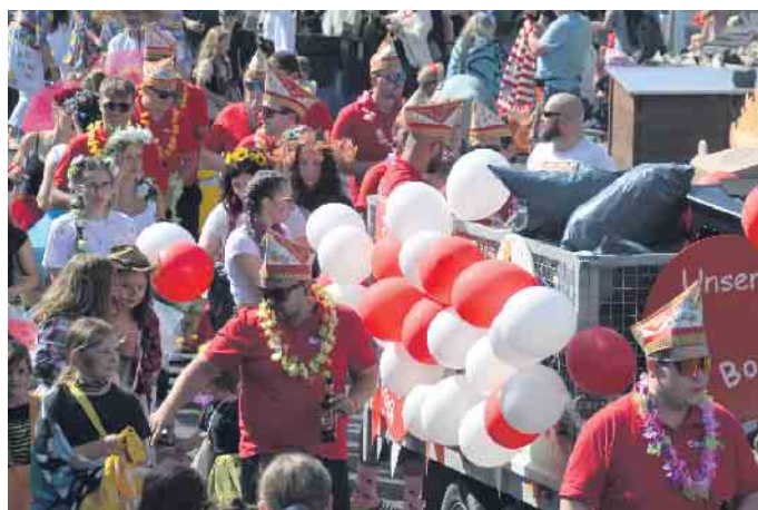
Ein ungewöhntes Bild - Karneval im August - in Bockereth war es möglich

setzt in kniffligen Situationen auf Bodycams als digitale Zeugen. Mit R(h)einspaziert kehrte das Festival des Stadtjugendrings Bad Honnef auf die Insel Grafenwerth zurück. Im Innenhof und Park von Haus Bachem präsentierte sich das Kunsthandwerk. Mit dem multinationalen Musik-Festival setzte der Verein „Nicht Davor