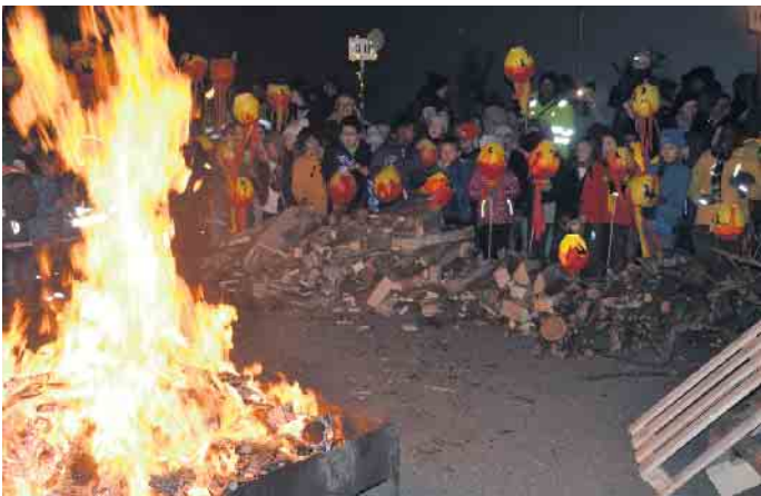
An den Schulen versammelten sich die Kinder um das Martinsfeuer