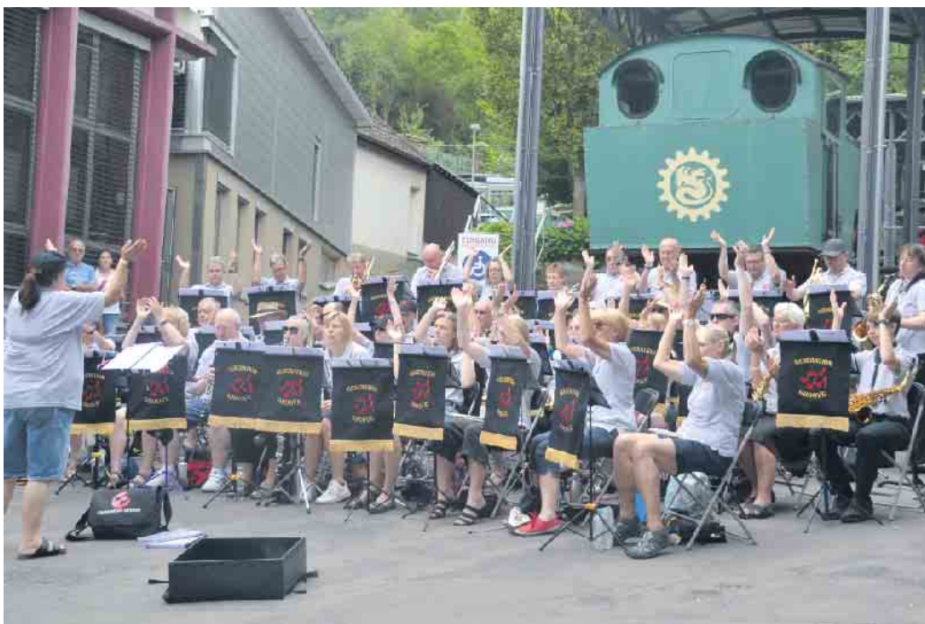
In den Sommermonaten fiel kein Niederschlag und bei den hohen Temperaturen hatte der Rhein auch auf Höhe des Siebengebirges extremes Niedrigwasser

sich für eine friedliche Weltgemeinschaft ein und hisste am Rathaus die Flagge „Mayors of Peace“ mit der Friedenstaube. 66 engagierte Abwasserbotschafter aus der Jahrgangsstufe 3 der Grundschule Aegidienberg wurden durch das Abwasserwerk der Stadt Bad Honnef im Umgang mit der lebenswichtigen Bedeutung der Ressource Wasser geschult. Die Stadt Königswinter organisierte ein zweitägiges Audit zur Hochwasser- und Starkregenvorsorge und sieht hier eine gemeinsame Aufgabe von Stadt und Bürgerschaft. Beim Tag des offenen Bienenstocks eröffnet der Imkerverein Siebengebirge seinen Lehrbienengarten. Die KJG Selhof wurde stolze 50 Jahre alt und organisierte wieder ein Pfingstzeltlager. Die Hitze und Dürre lassen die Natur leiden, die Waldbrandgefahr steigt und Warnungen werden ausgesprochen. Beim Dinner en Couleur wird in der königswinterer Altstadt ein Fest der Kulturen mit einem unterhaltsamen Bühnenprogramm gefeiert. Das Siebengebirgsmuseum reist mit Baedeker um die Welt. Auf der Anlage des HSV Bockereth treffen sich Schulkinder aus der Ukraine zu einem gemeinsamen Picknik. Die HSG Siebengebirge nahm wieder am Dronninglund Cup teil und reiste mit 81 Spielerinnen und Spielern nach Dänemark.