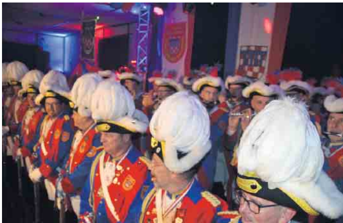
Aber auch das war der November, wie hier in Bad Honnef zeigten sich die Karnevalisten und läuteten die Session ein