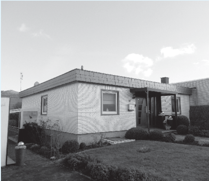
Bungalow vor der Aufstockung