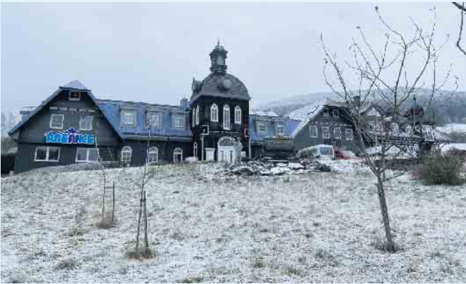
Der Meisterbetrieb Menke in Winterberg-Siedlinghausen

Die schlaue Wärmepumpe - leise, zeitlos, modular