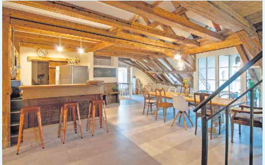
Lehmputz reguliert die Luftfeuchtigkeit in Innenräumen und passt perfekt zu Naturmaterialien in der Einrichtung.

die den Baufortschritt hemmen. Deutlich einfacher geht es mit innovativen Plattensystemen, wie sie etwa Naturbo entwickelt hat. Sie vereinen alle ökologischen Vorteile von Lehmputz mit der unkomplizierten Verarbeitung von Trockenbausystemen. Auf vorgefertigten Plattenelementen aus Holzweichfaser ist der Lehm bereits mit einer Gewebearmierung aufgebracht. Die Platten können ohne umfangreiche Vorarbeiten und ohne den Einsatz größerer Wassermengen verbaut werden. Unter www.naturbo.de gibt es dazu mehr Infos und Verarbeitungstipps. Auf Holzständer oder Holzplatten erfolgt die Befestigung durch Verschrauben, auf Mauerwerk oder Gipsbauplatten lassen sich die Elemente verkleben. Auch Innen-