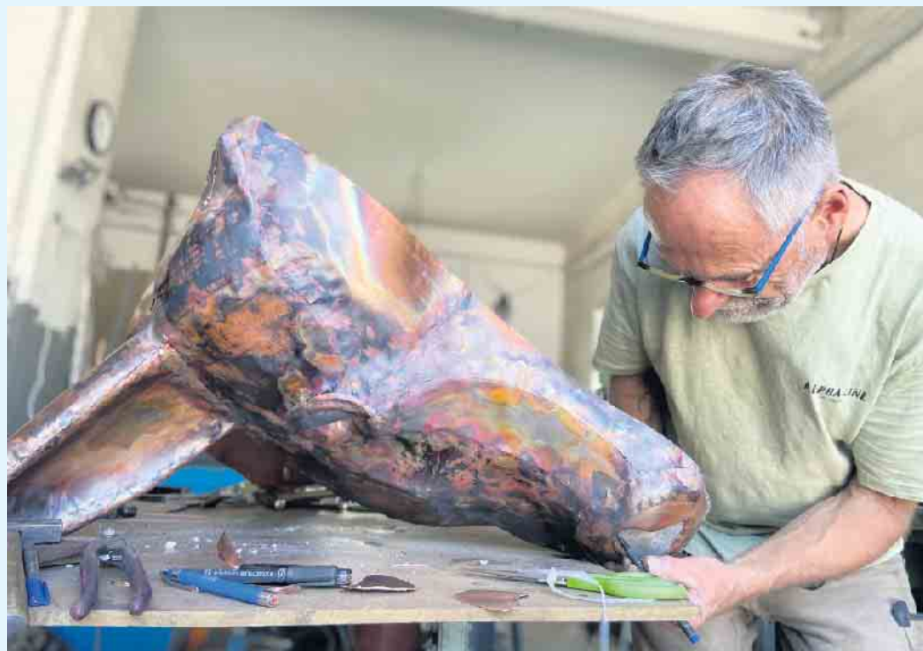
Der Kopf des Angusrind aus Kupfer in seiner Entstehung