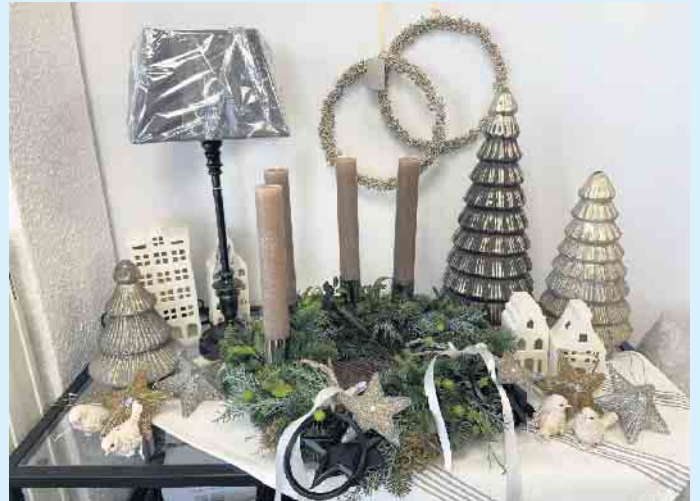
Weihnachtsdeko aus dem „Tischlein deck dich“

Im gemütlichen Haushaltswarenladen „Tischlein deck dich“ am oberen Waltenberg weihnachtet es sehr!- Weihnachtsdekorationen für den festlich geschmückten Tisch sowie ausgefallener Christbaumschmuck aus Holz, Papier und Porzellan zaubert eine besondere Atmosphäre in das Haus.