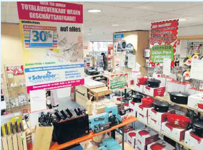
Markenküchenprodukte zu Schnäppchenpreisen bei Schreiber e.K. in Medebach