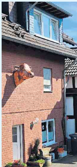
Der fertige Angusrind-Kopf als Eyecatcher an der Hauswand