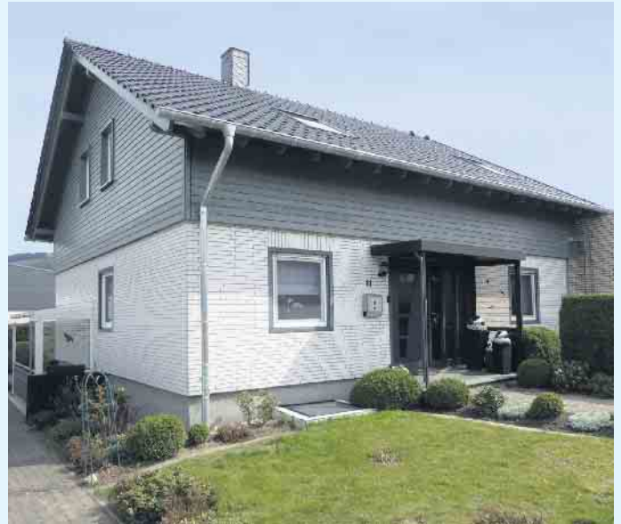
Nach der Aufstockung mit Satteldach

Sie möchten zusätzlichen Wohnraum schaffen und Ihr Haus aufstocken? Die Möglichkeiten ei-