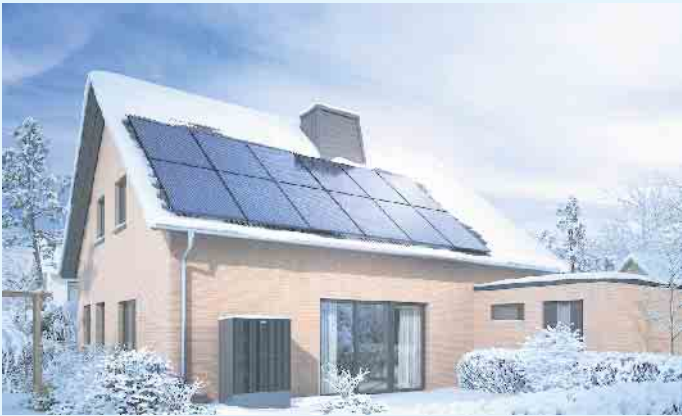
Modernes Einfamilienhaus mit Wärmepumpe und PV-Anlage

Das ist gut für das Klima und den Geldbeutel. Wussten Sie, dass 75% der Energie, die deutsche Haushalte verbrauchen, für die Raumwärme benötigt wird? Hinzu kommen nochmals 12% für Warmwasser. Und genau für diese 87% des durchschnittlichen Energieverbrauchs kann die schlaue Wärmepumpe eine kostengünstige und nachhaltige Lösung sein - als Alternative oder Ergänzung zur Gas- oder Ölheizung.