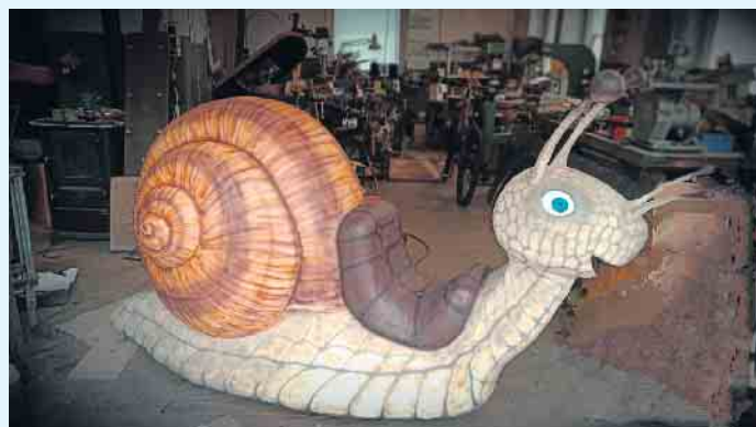
Eine Schnecke als neues Spielgerät, bevor es die Kinderaugen zum Leuchten bringt