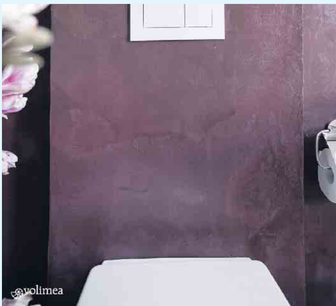
Volimea futado spricht für Farbe und Unikat-Charakter

machen die Beschichtung spannungsarm. Dank der guten Haftungs- und Druckfestigkeit halten sie einer hohen Belastbarkeit problemlos stand.