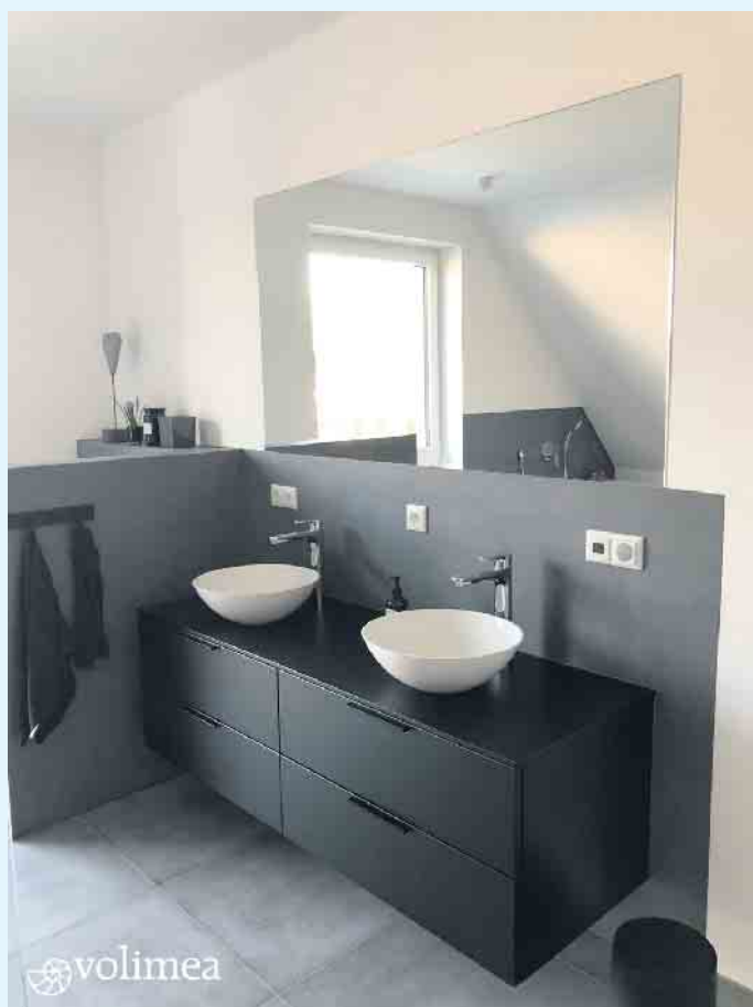
Moderne, farbenfrohe und fugenlose Badgestaltung von Volimea futado