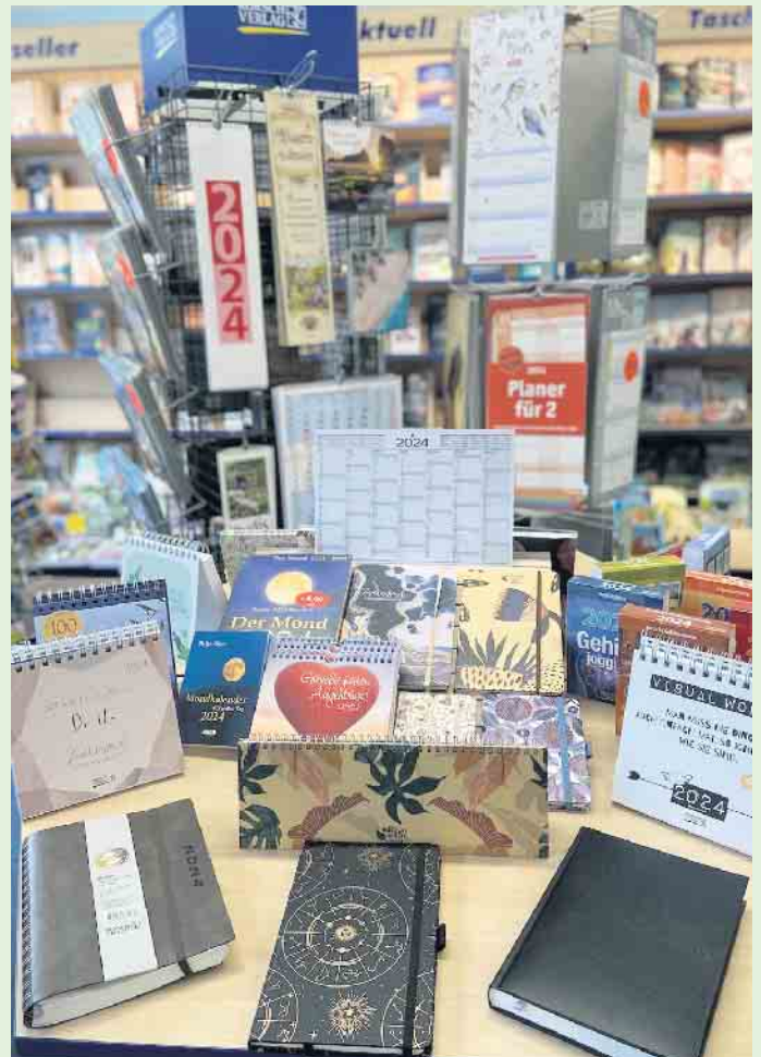
Viele Kalender für Privat bis Business bei „Buch bei Rudolph“

meist schon für den nächsten Tag bestellt werden. Über sechs Millionen literarische Werke können nur mit wenigen Klicks zur Abholung geordert werden.- Auf Wunsch auch versandkostenfrei mit Lieferung bis an die Haustür, mit Bezahlung auch an der Kasse bei „Buch bei Rudolph“ und Einsparung von lästigem Verpackungsmüll dank der Auslieferung in wiederverwendbaren Bücherkisten. Ein gutes Konzept zwischen „online shoppen“ und trotzdem „lokalement“ einkaufen. Bei „genialokal.de“ haben sich über 700 unabhängige Buchhandlungen zusammengeschlossen. Und das beste: Bei jedem Onlineeinkauf auf dieser Plattform werden die lokalen Buchhandlungen beteiligt. [BL]