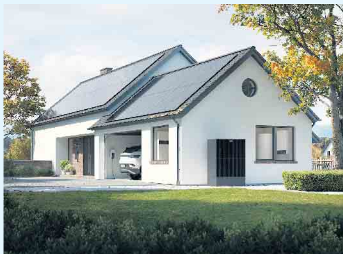
Modernes Heim mit Photovoltaik, Wallbox und Wärmepumpe

In der heutigen Zeit ist es die sinnvollste Art, mit einer Photovoltaik-Anlage selbst Strom aus Sonnenenergie zu produzieren. Es ist die umweltfreundlichste Lösung und zahlt sich sogar für den Hausbesitzer finanziell aus. Zur Beratung und Anbringung ist an dieser Stelle der Meisterbetrieb Menke aus Winterberg-Siedlinghausen der richtige Ansprechpartner. Viele sind fälschlicherweise der Meinung, dass eine PV-Anlage nur auf einem Süddach sinnvoll sei, was allerdings nicht mehr dem aktuellen Stand der Technik entspricht. Der Energieertrag ist zwar bei einer Südausrichtung am höchsten, aber eine Energieerzeugung auf Ost- und Westdächern passt besser zum typischen Verbrauchsverhalten eines Privathaushalts, weil die Module in den Morgen- und Abendstunden Strom produzieren. Also dann, wenn in den meisten Haushalten die meiste Energie benötigt wird. Über den Tag sind die Familienmitglieder in der Regel nicht zu Hause, deshalb ist in dieser Zeit der Energiebedarf vergleichsweise niedrig. Der Großteil des auf Süddächern produzierten Solarstroms fließt dann ins öffentliche Netz, aber wichtiger ist für Familien natürlich der