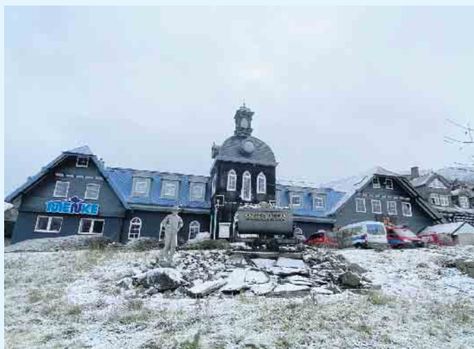
Der Meisterbetrieb Menke in Winterberg-Siedlinghausen

Modernste Technik vom Meisterbetrieb Menke