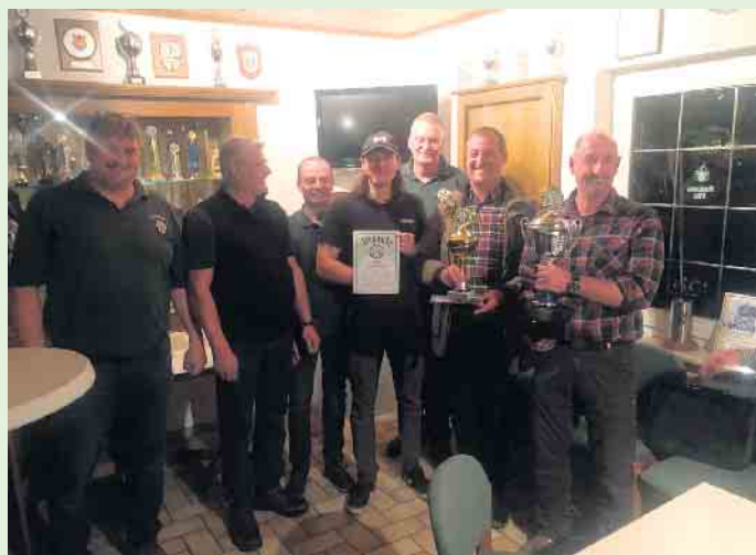
Sieger des Kreispokalschießens: die Schützengesellschaft Winterberg

ten konnte sich das Team 1 von der Schützengesellschaft aus Winterberg mit 348 Ringen vor dem Team 2 des Schützenvereins Neustenberg (344 Ringe) und dem Team der Schützengesellschaft