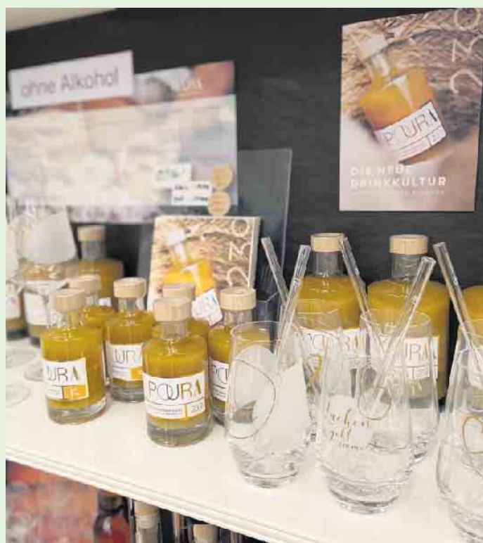
POURA , die neue „Drinkkultur“ beim „Tischlein deck dich“ in Winterberg

Das „Tischlein deck dich“ führt dazu passend auch Gläser von LEONARDO , auch bestens zum Verschenken für das anstehende Weihnachtsfest geeignet. Ebenso eine große Auswahl an Feinkost, Haushaltswaren, edle Geschirrkollektionen und Koch- sowie Backutensilien. Das Team vom „Tischlein deck dich“ berät Sie gern. [BL]