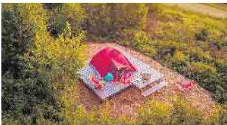
Die Trekkingplätze in der Ferienwelt Winterberg mit Hallenberg kommen hervorragend an bei den Wanderern und Mountainbikern. Die Nachfrage war in der jetzt abgelaufenen Saison sehr gut.