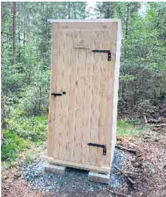
Auch eine Ökotoilette finden die Naturliebhaber an den Trekkingplätzen.

Winterpause für das Outdoor-Angebot der Ferienwelt Winterberg mit Hallenberg / Start 2024 voraussichtlich im April / Positive Bilanz