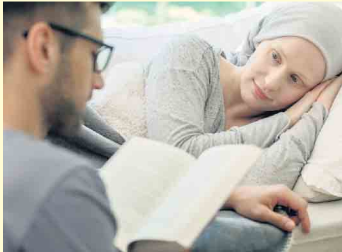
Bei der Hospizarbeit geht es darum, sterbenskranken Menschen Zuwendung zu schenken - beispielsweise, indem man ihnen vorliest.

Palliativ leitet sich vom lateinischen Wort „Pallium“ ab, das „Mantel“ bedeutet. Die Palliativversorgung möchte in diesem Sinne sterbenskranke Menschen umhüllen und ihre Schmerzen sowie andere Be-