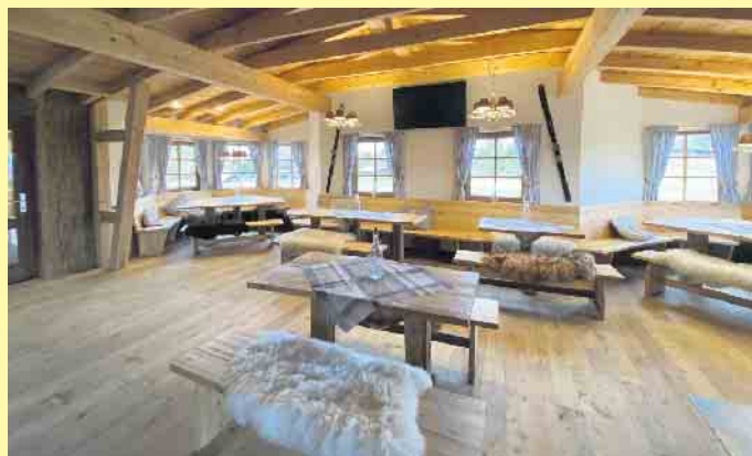
Das gemütliche Ambiente in der Homberg Jause in Züschen

Am 31.12. ist eine Silvesterfeier geplant.- Alles auf Voranmeldung. Wandern, Biken, Erleben und Schlemmen am Homberg, wo jeder Moment ein wenig Urlaub ist! [BL]