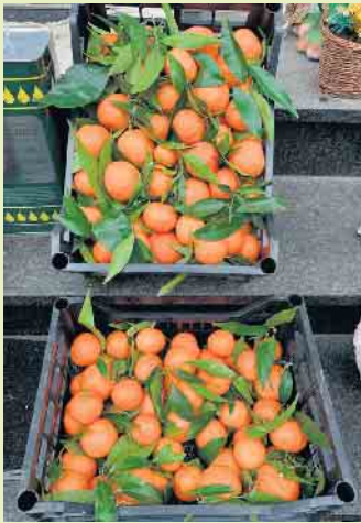
Sonnengereifte Früchte aus Italien

Jedes Jahr unterstützt die Familie aus Elkeringhausen diese tolle Aktion, weil sie diese für „gut“ befinden. „Dabei arbeiten wir in engem Kontakt mit dem Obstbauern aus Italien zusammen“, so die Familie. Alle angebotenen Früchte kommen direkt aus der Ernte des sonnigen Italien und sind nicht behandelt, also ungespritzt. Die Schalen können also auch verarbeitet werden, beispielsweise zum garnieren von Salaten.- Es handelt sich bei den Orangen, Blutorange, Clementinen und Zitronen um Ware in Bioqualität.