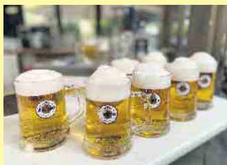
Frisch gezapftes Bier im Landgasthof Schöttes