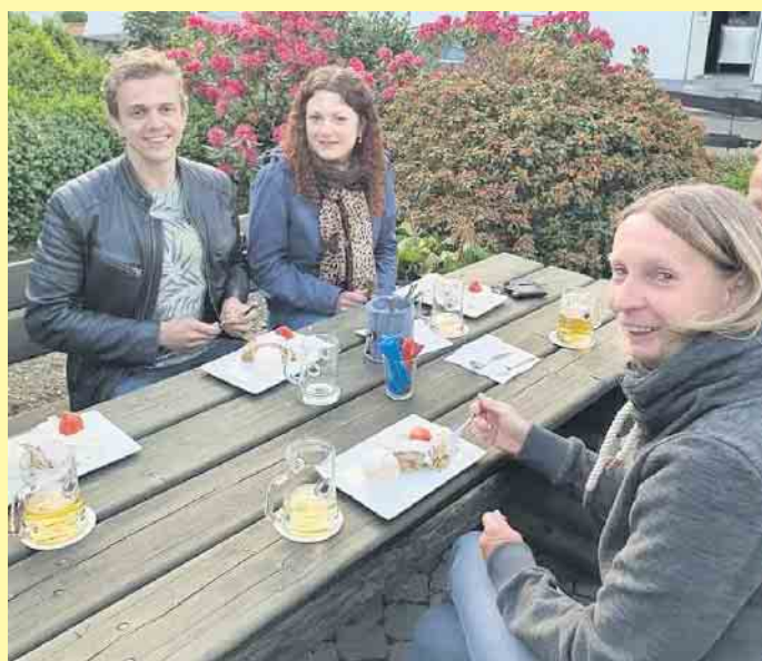
Feiern und Spaß haben ist im Landgasthof Schöttes immer Programm