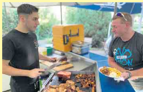
Kulinarisch immer große und rustikale Auswahl bietet der Landgasthof Schöttes

auch Motorradfahrer kehren schon seit vielen Jahren hier ein und kommen immer wieder. Alle Speisen können einen Tag zuvor auf Bestellung gerne auch für zu Hause abgeholt werden. Vorbeischaun lohnt sich immer. [BL]