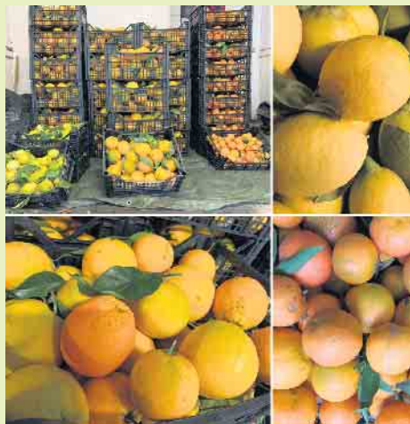
Leckere Zitrusfrüchte aus dem sonnigen Italien

Das kleine Dorf in Italien hat sich zusammengeschlossen und bietet zusätzlich kaltgepresstes Olivenöl, ebenfalls direkt vom Erzeuger an. Die Lieferungen erfolgen nahezu jeden Monat regelmäßig bis Februar 2023. Sobald die Ware angekommen ist, erfolgt ein Anruf und alles kann in Winterberg-Elkeringhausen abgeholt werden. „Wir würden uns sehr freuen, wenn die