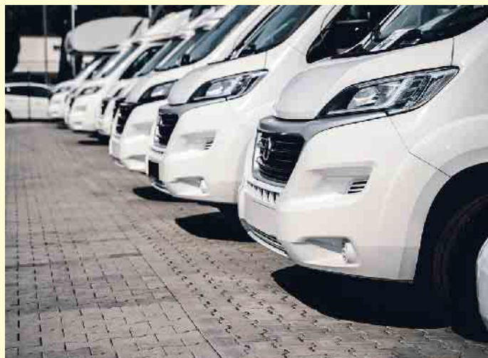
Wohnwagen sind aktuell sehr beliebt.

che Säuberung dauert deutlich länger und lohnt sich nur, wenn ein Fahrzeug über einen längeren Zeitraum am Stück vermietet wird. (mid/ak-o)