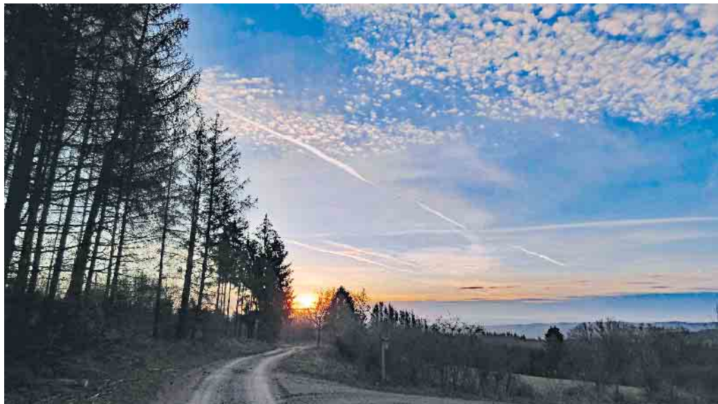
Leserfoto von Gerhard Kobbeloer aus Hallenberg