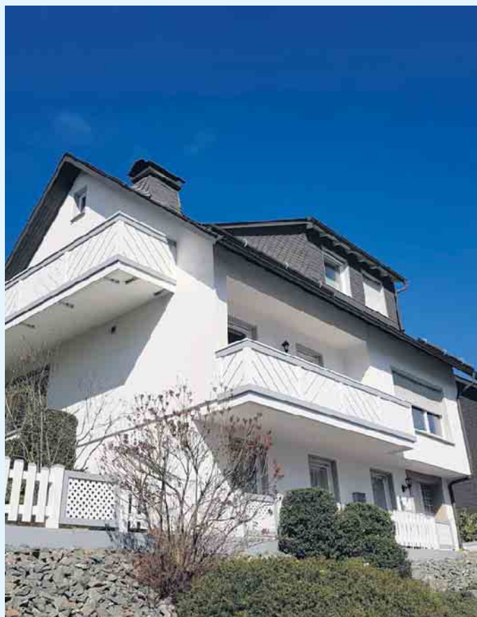
Moderne, helle Balkongestaltung der Tischlerei Holztec