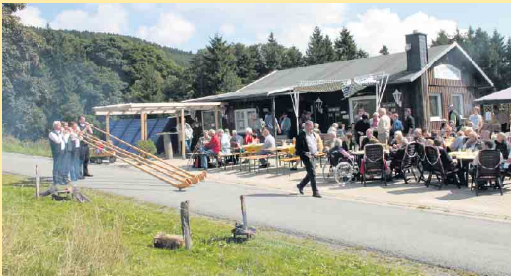
Superstimmung bei der Clemensberghütte in Winterberg-Hildfeld

Die Clemensberghütte, ein Treffpunkt für Wanderer, Mountainbiker und Naturliebhaber, liegt inmitten einer idyllischen Landschaft in der Nähe von Winterberg, im beschaulichen Urlaubsdorf Hildfeld. Über die Zubringerwege erreicht man unmittelbar den Rothaargebirge, der auch über die schöne Landschaft zur Hochheide mit dem Clemensberg (838m) hinaufführt, von dem man bei guter Fernsicht eine fulminante Aussicht über den Steinbruch hinweg, zum Schloßberg, dem Kahlen Asten und den umliegenden Ortschaften Küstelberg, Hildfeld, Grönebach und Winterberg erleben kann. Oder aber den Wanderpfad „Uplandsteig“ in Richtung Willingen.- Hier passiert man bereits die hessische Landesgrenze ins direkt angrenzende Upland.