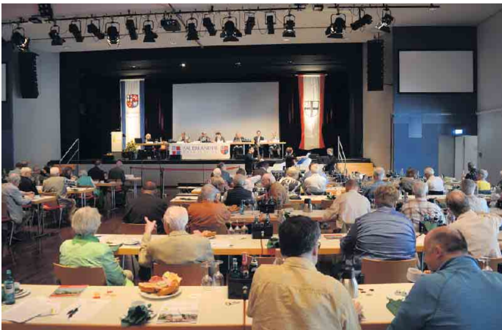
Gut besucht war die Versammlung in der Stadthalle Attendorn.