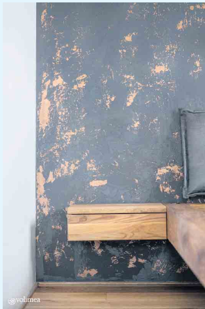
Anthrazitfarbene Wandgestaltung mit kupferfarbenen Akzenten

rät Sie gerne zu Ihrer individuellen, fugenlosen Wand- und Bodengestaltung. [BL]