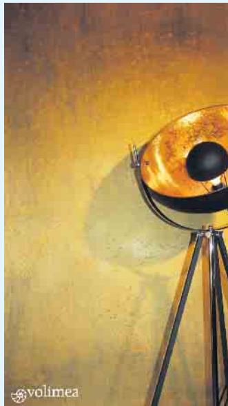
Edle, goldene Wandgestaltung