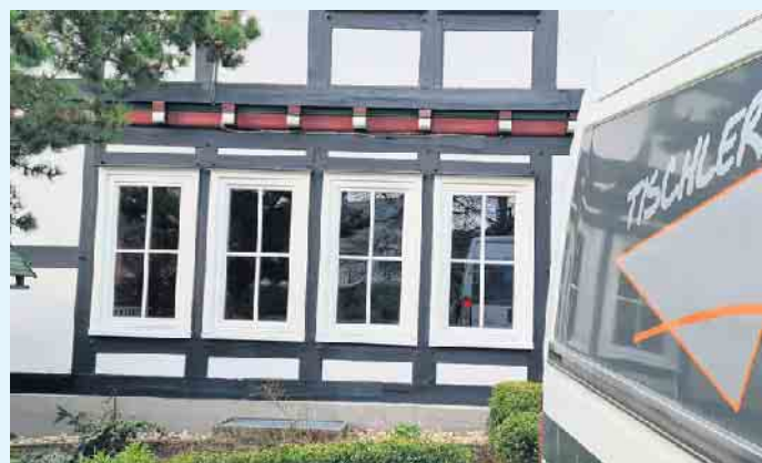
Renovierung mit neuen Fenstern von der Tischlerei Holztec

Auch das Verlegen von Fertigparkett, Laminat, Korkboden oder Vertäfelungen gehört neben der Beratung in Sachen Innenausbau und Treppenrenovierung zum Aufgabengebiet. Vor ein paar Jahren kam die Fertigung von Balkonen, Zäunen und Sichtschutzelementen aus Kunststoff hinzu. Natürlich gibt es auch hier eine Vielzahl von Gestaltungsmöglichkeiten in Form und Farbe. [BL]