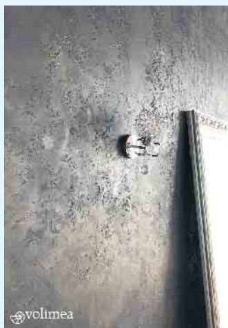
Silvoll silberne Wandgestaltung

Der Malerbetrieb Schnorbus aus Züschen verleiht Ihren Wänden eine zeitlos-elegante Noblesse mit schillernden farblichen Akzenten und außergewöhnlichen Strukturen. Dank der fugenlosen Spachtel mit authentisch wirkender Metalloptik von „ Volimea grandezza “.