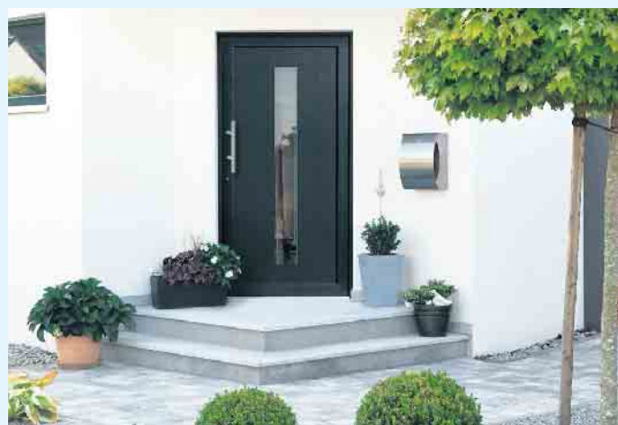
Stylische Haustür von der Tischlerei Holztec