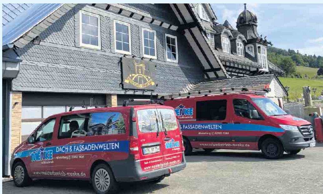
Der Meisterbetrieb Menke in Winterberg-Siedlinghausen

Sie sind bereits frischgebackener PV-Anlagen-Besitzer? Unter Umständen ist es dennoch nicht zu spät für die Beantragung der Förderung. Basierend auf den Tipps der Verbraucherzentrale Nordrhein-Westfalen darf die PV-Anlage bei Antragstellung nicht mehr als 3 Monate in Betrieb gewesen sein. Sonst gilt sie nicht länger als