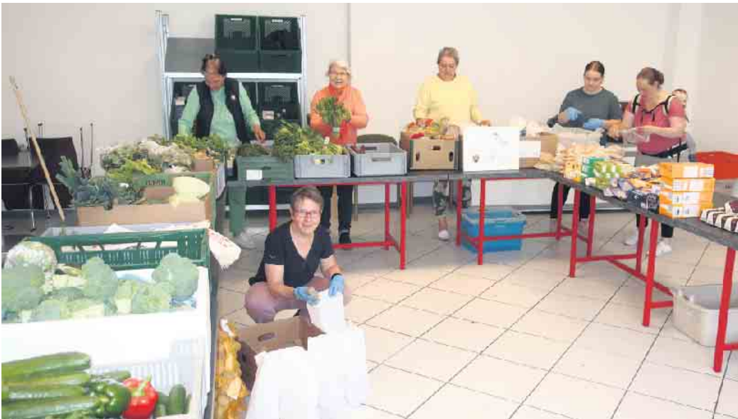
Ein Teil des ehenamtlichen Team bei der Vorbereitung der Ausgabe

Unter dem Motto „Zu gut für die Tonne“ engagieren sich Ehrenamtliche des Vereins Kipepeo und der Caritaskonferenz Winterberg für die Rettung und Weitergabe von Lebensmitteln.