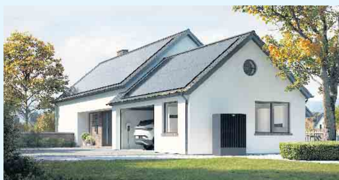
Modernes Haus mit PV-Anlage, Wallbox und Wärmepumpe

„Neubau“. Entscheidend ist dabei das eingetragene Datum im Marktstammdatenregister. Darüber hinaus darf das Leistungsverhältnis der PV-Anlage zur Kapazität des Speichers maximal 1 kWp zu 3 kWh betragen. Das bedeutet, eine PV-Anlage mit 10 kWp (Kilowatt Peak) kann mit einem Speicher von bis zu 30 kWh (Kilowattstunde) gefördert werden. Diese Beschränkung ist jedoch für die meisten Privathaushalte irrelevant.