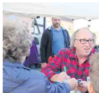
Sofort von Autogrammsammlern umringt. Kabarettist Urban Priol fuhr als Erster vor dem Kump vor.