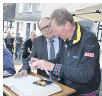
Rallye-Legende Walter Röhr trägt sich ins Goldene Buch der Stadt ein