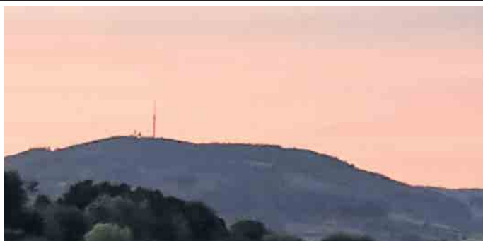
Bollerberg im Abendrot.