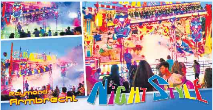
Night-Style - das Bewegungswunder

Der „Night-Style“ ist neben einem Hochfahr- auch ein Überkopfgeschäft mit beliebig vielen horizontalen, vertikalen und diagonalen Überschlagen.