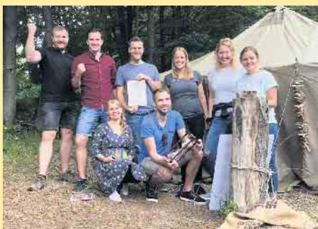
Der Gruppenspaß „Outdoor-Escape“ feiert sein 5-jähriges Jubiläum am Schlossberg

Apfel-, Käse- oder Schmandkuchen. Und der geht weg, wie nix. Leckere Eisbecher mit Eierlikör oder Nuss- und Schokobecher warten auf Ihre Abnehmer.