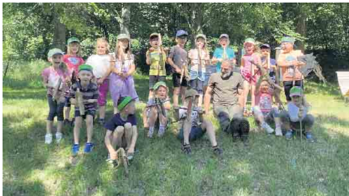
In Liesen am Tretbecken erstellten wir Stockpferde

erstes Highlight war die Übergabe der selbstgebastelten Schultüten und der Rausschmiss auf die dicke Weichbodenmatte. Nachdem die Eltern verabschiedet wurden, ging es für die Kinder und ihre ErzieherInnen