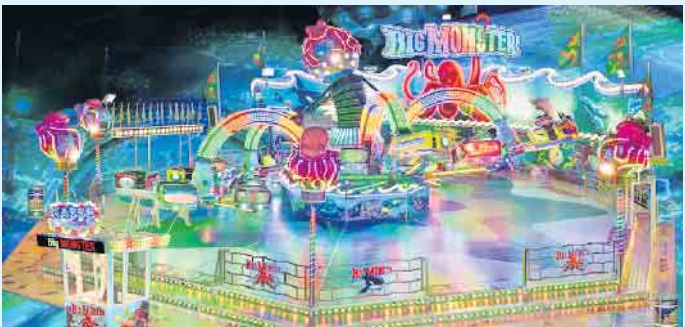
Big Monster - eine Fahrt auf dem Kraken

Das auch als „Kraken“ bezeichnete „Big Monster“ ist ein Fahrgeschäft, das an die Gestalt eines riesigen Seeungeheuers erinnert. Durch seine rasante Fahrweise und Drehungen in