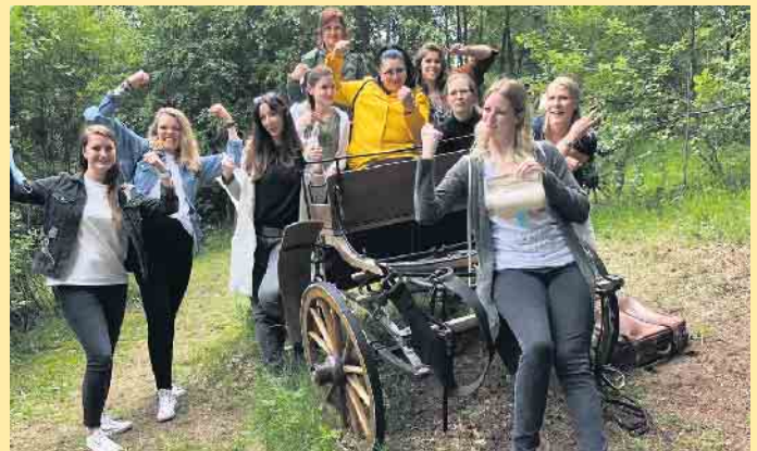
Erfolgreiches Damenteam beim Outdoor-Escape

Aufstieg zum Schlossberggipfel, Strecke 2 km, schwer