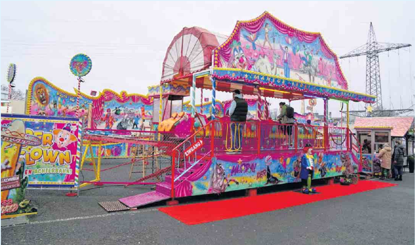
Wilder Clown - die Familien-Achterbahn

Getreu dem Motto „Manege frei für den Wilden Clown“ und einzigartig in Aufmachung und Design in zirkensischen Motiven, erinnert der „Wilde Clown“ an einen Zirkus und lädt sowohl Jung als auch Alt zu einer Fahrt ein.