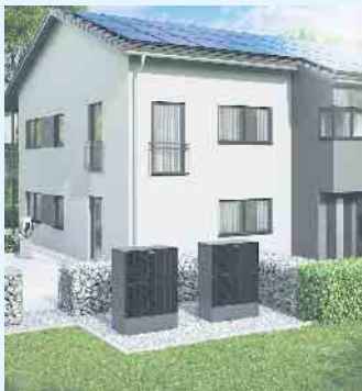
Bestens ausgestattetes Einfamilienhaus mit PV-Anlagen, Wärmepumpen und Wallboxen

Der Klimawandel betrifft uns alle, jeder kann dabei seinen Beitrag zur Erhaltung der Lebensräume für unsere Kinder und Enkel beitragen. Besonders der Austausch veralteter Heizungstechnik gegen klimaschonende Systeme sind dabei ein guter Anfang mit sofortiger Wirkung: