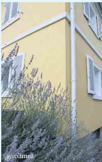
Helle Fassade mit Wohlfühlcharakter

vielseitiger. Mit diversen Fassadenbelägen kommen bewährte Materialien neu ins Spiel und eröffnen neue optische Möglichkeiten. Lassen Sie sich vom Malerbetrieb Schnorbus auch für außergewöhnliche Looks inspirieren und beraten. [BL]