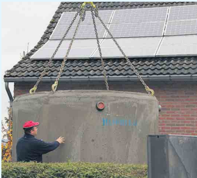
Aufgrund der immer länger anhaltenden Trockenperioden sollten die Regenwasserzisternen ausreichend groß geplant werden.

durch die Sammlung und Nutzung von Regenwasser erzielt werden. Je nach Gebührenmodell der Gemeinden kann sich eine solche Anlage sogar finanziell amortisieren. „Aufgrund der immer länger anhaltenden Trockenperioden sollten die Regenwasserzisternen allerdings ausreichend groß geplant werden“, rät Ringelstein. (akz-o)