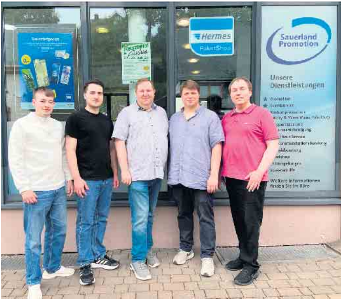
Das Team von „Sauerland Promotion“ aus Züschen

In den neuen zentral gelegenen Räumlichkeiten in Züschen befindet sich auch ein Hermes-Paketshop . [BL]