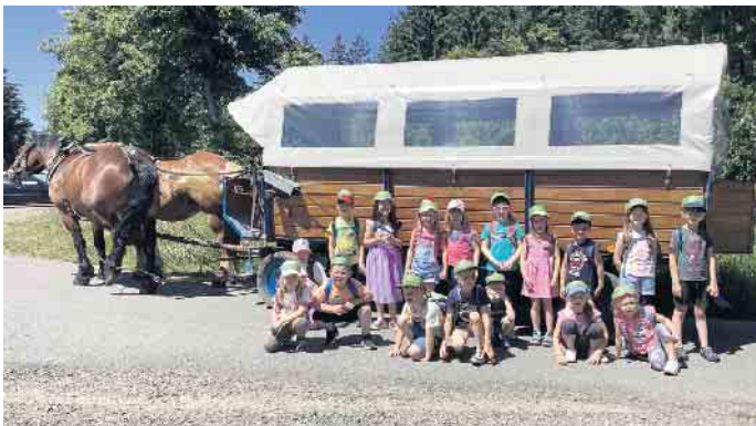
An der hohen Schlade wurden die Kinder mit dem Planwagen abgeholt

17 Kindergartenkinder des Kindergartens in Hesborn fliegen nun aus in die Schule