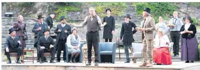
Phileas Fogg und die Lords und Ladies vom Reformclub.

Nun startet die Freilichtbühne in die zweite Saisonhälfte. Bis Anfang September können Sommertheaterfreunde Phileas Fogg noch neunmal auf seiner Reise begleiten. Siebenmal haben Kleine und Große Märchen-Fans Gelegenheit mitzufiebern, wenn der gewitzte Straßenkehrer Aladin mit dem Lampengeist und einem „gehenden Teppich“ an seiner Seite den bösen Zauberer besiegt und das Herz der Prinzessin erobert.