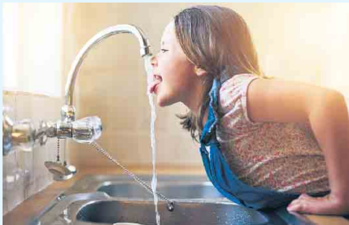
Wie selbstverständlich läuft bei uns das Wasser aus dem Hahn. Doch angesichts der Klimaveränderungen wird es nicht ewig so weitergehen.

Ein großer Vorteil von Regenwasser ist dessen gute Grundqualität, denn es ist frei von Spurenstoffen wie beispielsweise Medi-