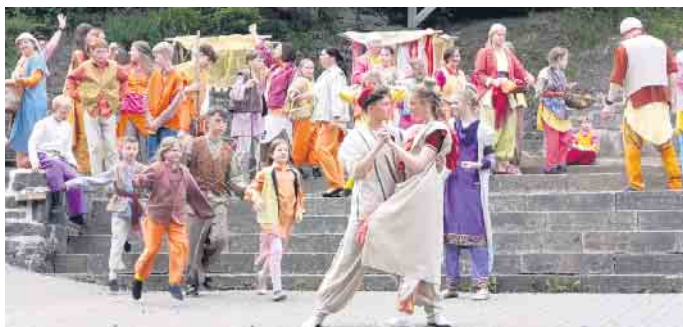
Aladin und Prinzessin Jasemine

Ausführliche Informationen und Karten für die Spielsaison 2024: Freilichtbühne Hallenberg, Freilichtbühnenweg, 59969 Hallenberg, Tel.: 02984 / 929190,