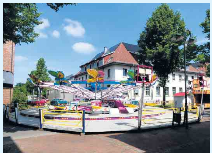
Twister - das Familien-Karussell

russell bietet dabei verschiedenste Fahrzeuge zur Mitfahrt an - darunter befinden sich zum Beispiel Motorräder, ein Feuerwehrauto und interaktive Flieger.