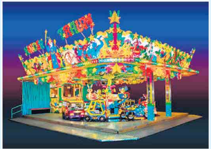
Kindertraum - bringt Kinderaugen zum Strahlen

Der „Kindertraum“ ist ein echtes Vergnügen für Kinder. Der kinderfreundliche Aufbau ermöglicht es auch den kleinen Gästen, eine schöne Fahrt zu erleben. Das Ka-