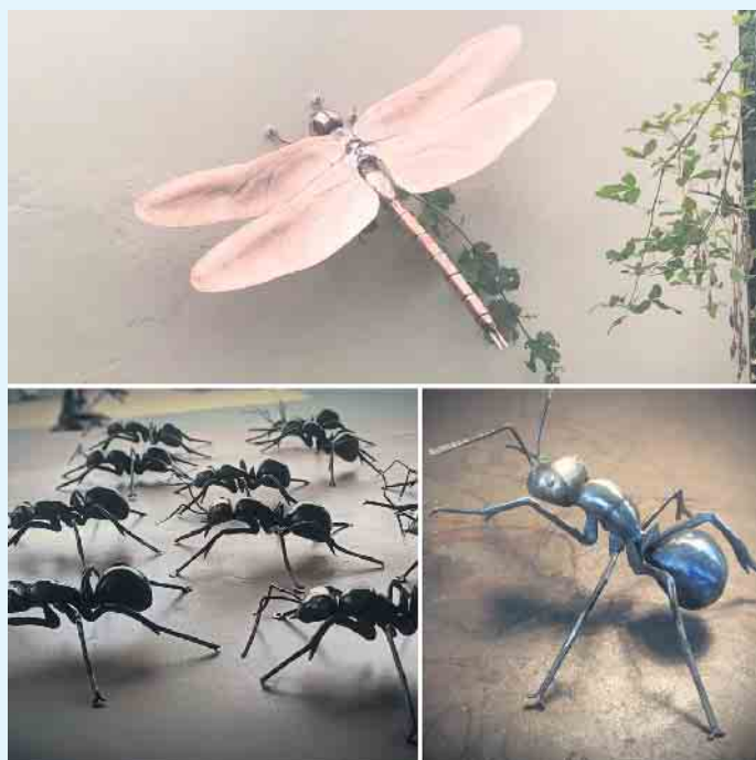
Die jüngst erschaffenen Werke von Michael Tuss aus Niedersfeld