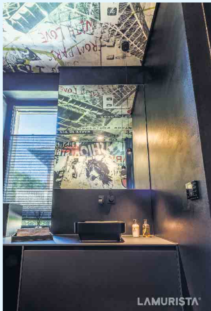
Ausgefallene Gestaltungsmöglichkeiten von LAMURISTA