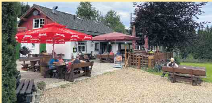
Die Schlossberg Alm bei Medebach-Küstelberg