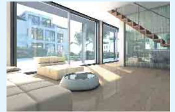
Gerade bei frei zugänglichen Terrassentüren bietet sich Sicherheitsglas besonders an.

Die beiden wichtigsten Ausführungen von Sicherheitsglas sind Einscheibensicherheitsglas (ESG) und Verbundsicherheitsglas (VSG). ESG weist eine hohe mechanische Festigkeit auf und bricht kleinkrümelig, wenn es kaputt geht. „Beim VSG sorgt eine Folie zwischen den Verglasungen dafür, dass bei einem Bruch die Glassplitter nicht herumfliegen und jemanden ver-