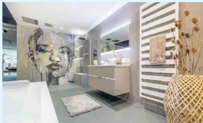
Moderne, fugenlose Badgestaltung von LAMURISTA

modernen Badgestaltung. LAMURISTA hat diesbezüglich einiges zu bieten. Verleihen Sie Ihrem Bad Exklusivität und Frische. Ihr Malerbetrieb Schnorbus berät Sie gerne zu Ihrer individuellen, fugenlosen Wand- und Bodengestaltung. [BL]