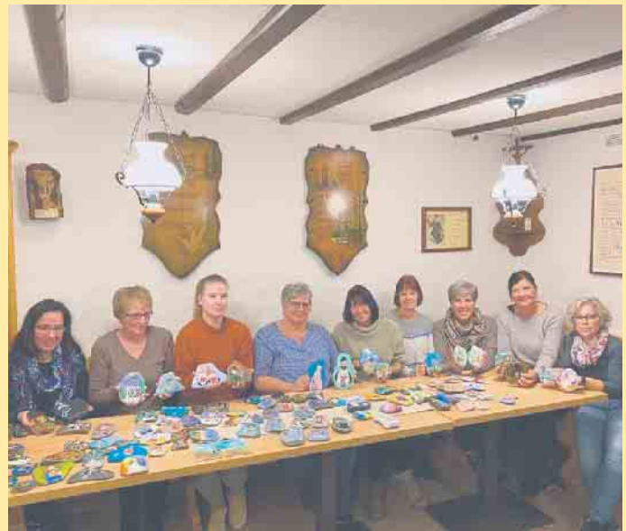
Die Bürgerinitiative „Sauerlandstones“

wurde dort zwei Monate später die nächste Spendenaktion gestartet, die über 3000,- € in die Kasse für die Flutopfer einbrachte. Zum zweiten Mal geht es nun weiter an der Hoheleyer Hütte: Am 27. August findet an der Hütte unter dem Motto „Spendensteine für Stolberg“ ein Sommerfest mit Spendenaktion statt, wieder mit den „Sauerlandstones“ zugunsten der Flutopfer für Stolberg bei Aachen.- An diesem Tag ist sogar das Maskottchen von Stolberg, das „Stolbärchen“ für die kleinen Gäste vor Ort. Ziel ist, die letzte Spendensumme zu übertreffen. Dienstags bis sonntags ist das Team der Hoheleyer Hütte um Volker Müller durchgehend von 11.00 bis 19.00 Uhr für alle Einkäufer da. Die Küche ist von 11.30 bis 18.00 Uhr geöffnet. Außerhalb der regulären Öffnungszeiten steht das Hüttenteam auf Vorbestellung auch für private oder geschäftliche Feierlichkeiten gerne zur Verfügung. [BL]