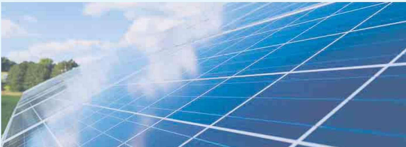
Solarpanel zur Aufnahme des Sonnenlichts