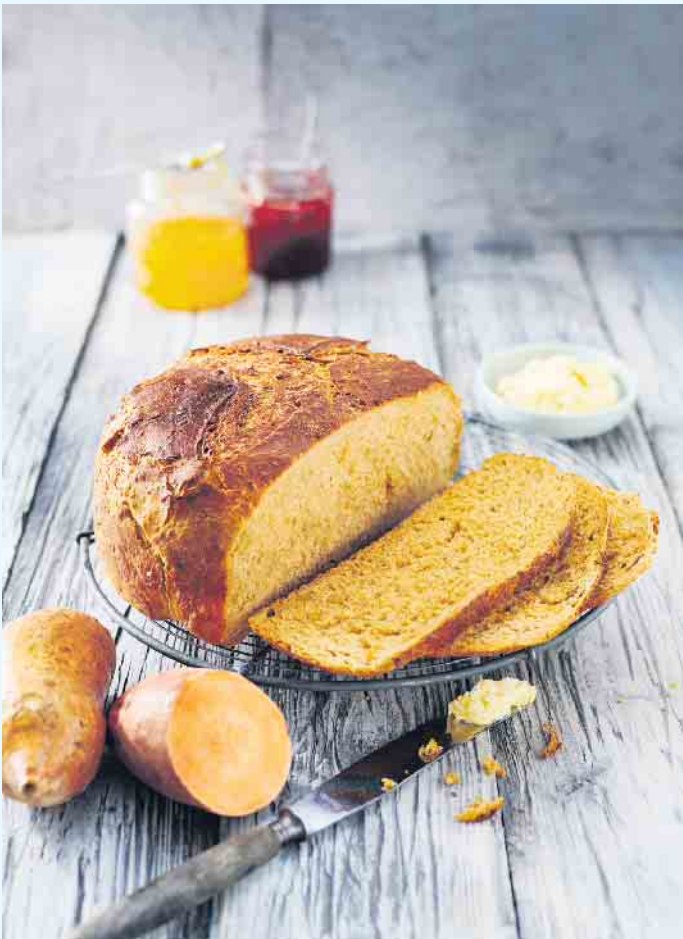
Süßkartoffel-Brot mit Walnüssen und Ahornsirup-Butter.

Das orange Gemüse kann ganz einfach im Backofen gegart werden. Dann nur aufschneiden, kurz abkühlen lassen und entweder mit Joghurt, Früchten und Nüssen füllen oder mit etwas Mandelmilch in einen leckeren Süßkartoffel-Smoothie verwandeln. In Pancakes, Muffins oder Waffeln sorgt das orange Gemüse für einen leicht süßen Geschmack und cremige Textur. Wer es morgens lieber herzhaft mag, kann seinen Toast gegen ein selbstgemachtes Süßkartoffel-Brot tauschen. Gründlich abgewaschen, muss die Süßkartoffel nicht mal geschält werden, denn in und unter der