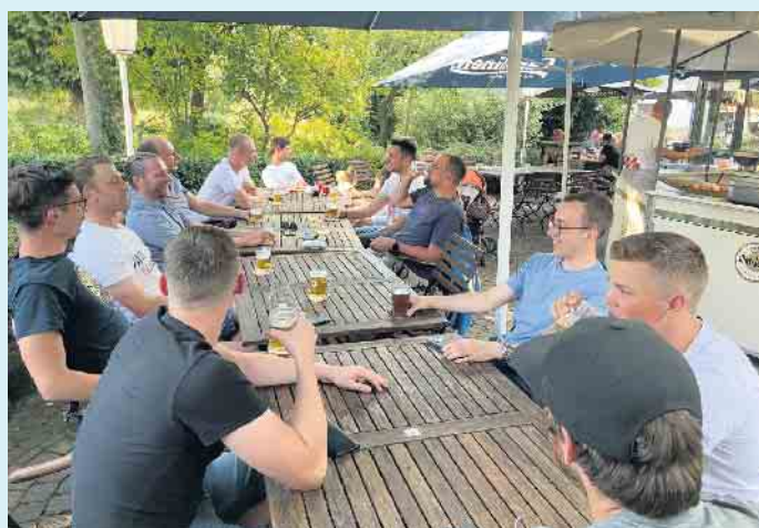
Lustige Runde im Biergarten bei Gasthof Schöttes

stellung gerne auch für zu Hause abgeholt werden. Vorbeischaun lohnt sich immer. [BL]