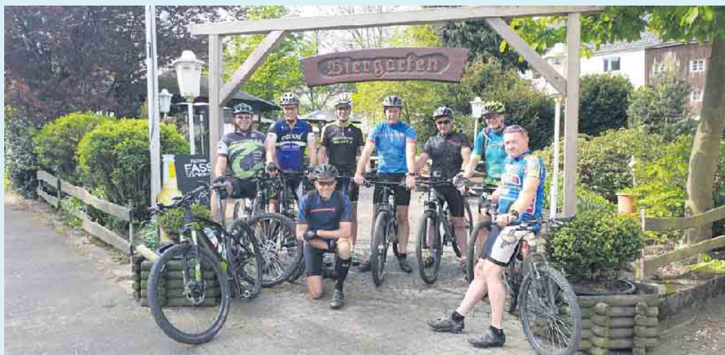
Bikegruppe vor dem Biergarten des Landgasthof Schöttes