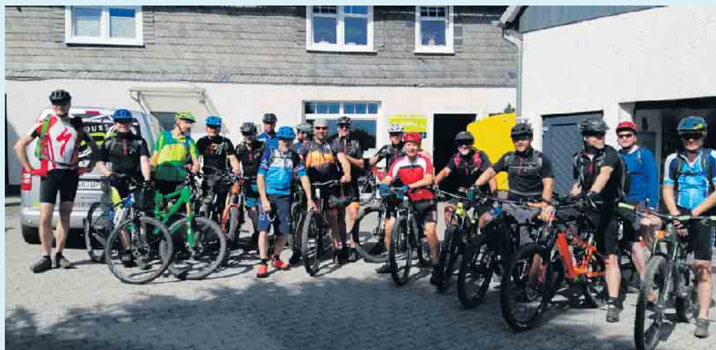
Bikegruppe an Uppu's Bikewerkstatt

von Windrädern durch Eisschlag sehr gefährlich. Die Fahrwege für die schweren LKW und Kräne, die zum Transport und Aufbau notwendig sind, werden die Waldwege zudem für einige Zeit unpassierbar machen.