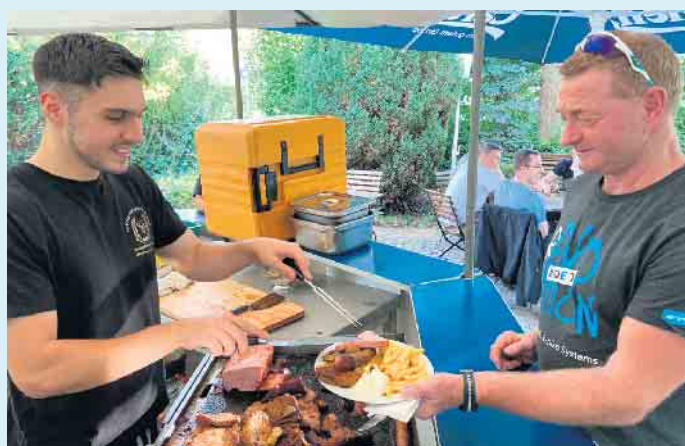
Leckeres vom Grill bei Gasthof Schöttes im Biergarten