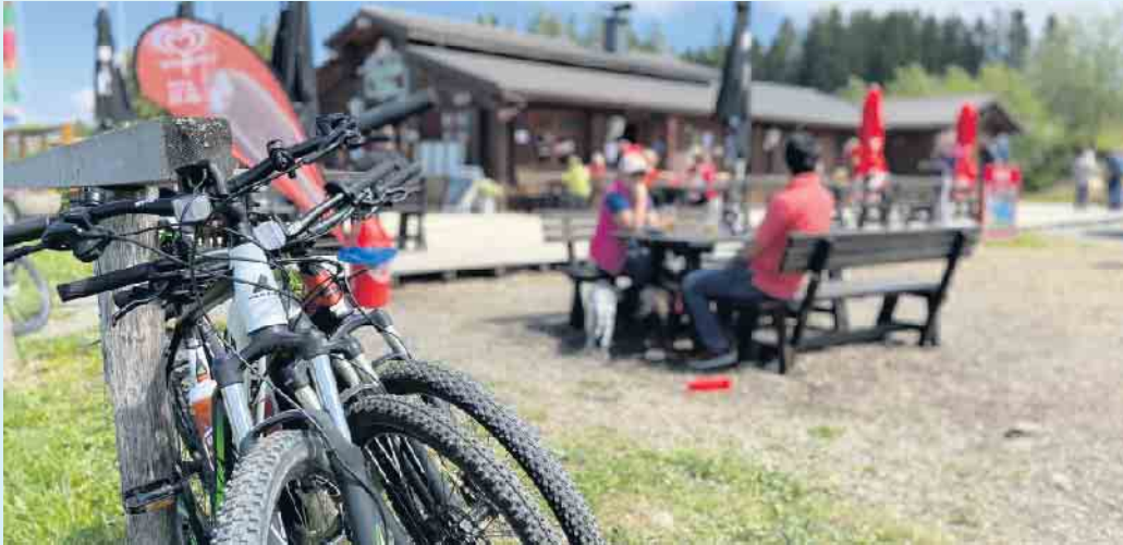
Tolle Einkehrmöglichkeit am Rothaarsteig: Die Hochheide Hütte