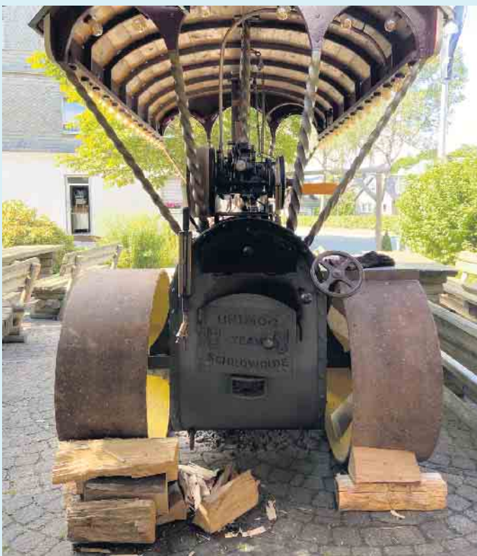
Der Barbecue-Grill im Dampflok-Style