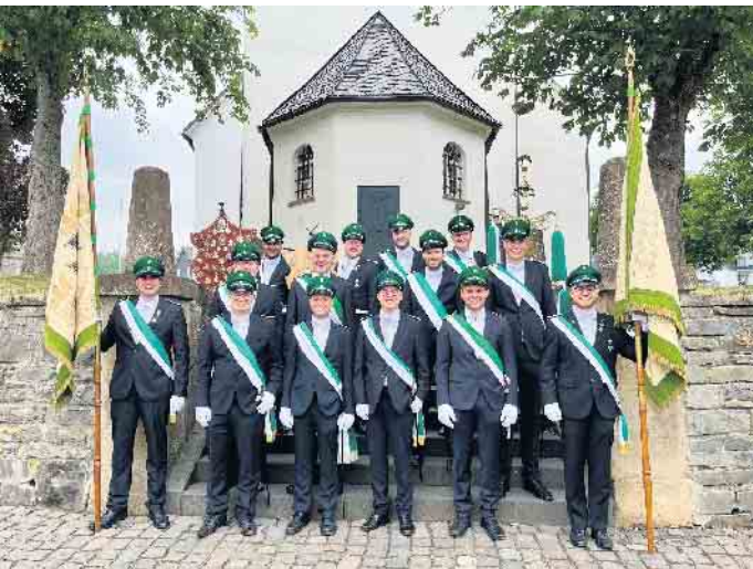
Ein besonderer Dank gilt den diesjährigen Unteroffizieren für ihren tatkräftigen Einsatz während des gesamten Schützenfests