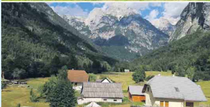
„Eine heile Welt“ bot sich den Bikern aus Winterberg bei ihrer Tour