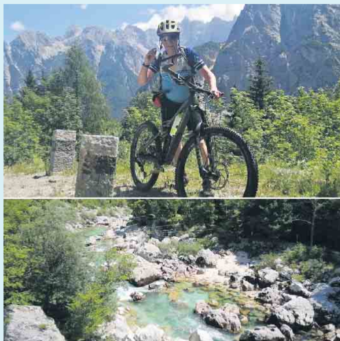
Besonders schön war es am Sojá, Europas schönstem Fluss

Truppe jubelte den Mädels und Jungs zu, die den schneid hatten, die älteren Herrschaften am Pass zu überholen. Oben bot sich nach der Bezwingung als Belohnung stets eine herrliche Aussicht über die Pässe Kranjska Gora, Vrsic' und Čepovanska. Bei der rasanten Pass-Abfahrt hatten jedoch nicht mal die Autos eine Chance! Nach der Grenzüberschreitung bei Nora Gorica in Slowenien war für alle interessant zu sehen, plötzlich in einem alten sozialistischem Land angelangt zu sein – es bot sich ein krasser, optischer Unterschied zu Italien. Als Highlight der Tour blieb die Übernachtung in einer privaten Pension mit Informationszentrum, in Trenta unterhalb der Triglav, in einer Höhe von 2464 m, allen in bleibender Erinnerung. Besonders schön war es am sprichwörtlich „schönsten Fluß Europas“, dem Sojá, mit seinem kristallklaren, türkisfarbenen Wasser und der Sicht auf viele kleine Boote. Zurück ging's mit Bus und Bahn von Triest nach Tarvisio. Teils war die Bahnstrecke gesperrt, also ging mit dem Bus weiter, wobei die Bikes kurzerhand zerlegt wurden. Die Busfahrerin zeigte Routine und über-