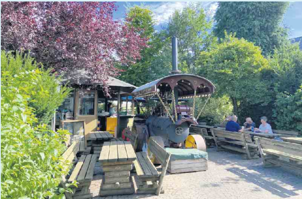
Der gemütliche Biergarten des Landgasthof Schöttes