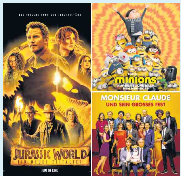
Die Filme der Open-Air-Kinoabende an der Hochheide Hütte