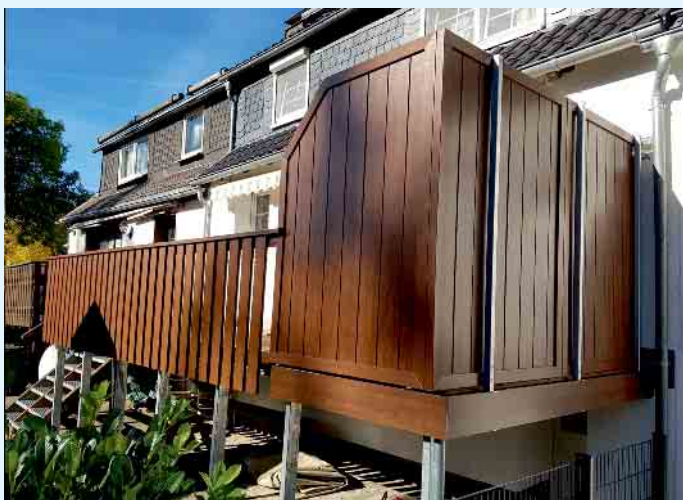
Balkon-/ Terrassengestaltung in Holzoptik

Auch zur Sommerzeit ist die Tischlerei Holztec aus Küstelberg der richtige Ansprechpartner in Sachen Terrassenböden, Sichtschutzelemente, Zaunelemente für den erholsamen Aufenthalt im eigenen Garten aber auch Balkongeländer aus Holz und Kunststoff. Bei einer Vielzahl an Gestaltungsmöglichkeiten in Form und Farbe bleiben nahezu keine Wünsche offen und bei der Auswahl des Werkstoffes Kunststoff, entfällt der aufwendige Renovierungs- und Pflegeaufwand. Sichtschutzelemente aus Kunststoff bieten auf der Terrasse, im Garten und dem Balkon die Möglichkeit, die