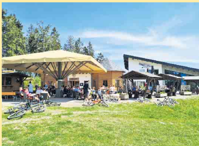
Einladende Terrasse im Grünen am Schneewittchen-Haus

Auf eine der schönsten Aussichtsterrassen von Winterberg