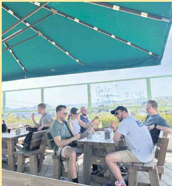
Gemütliche Terrasse mit Weitsicht am Fuß der St. Georg Sprungschanze

Schafe und Kaninchen in unserem Streichelzoo auf Eure Kleinen. Auf unserer Terrasse kann man aber auch ganz einfach dem Treiben nur zuschauen und an der Ostwand des Kahlen Asten vorbei den Blick in die Ferne schweifen lassen. Ein weiterer Blick in unsere Karte und schon zaubert unser Küchenteam Euch auch noch etwas Leckeres auf den Teller. Damit Ihr bei größeren Gruppen auch ausreichend Platz habt, empfehlen wir eine rechtzeitige