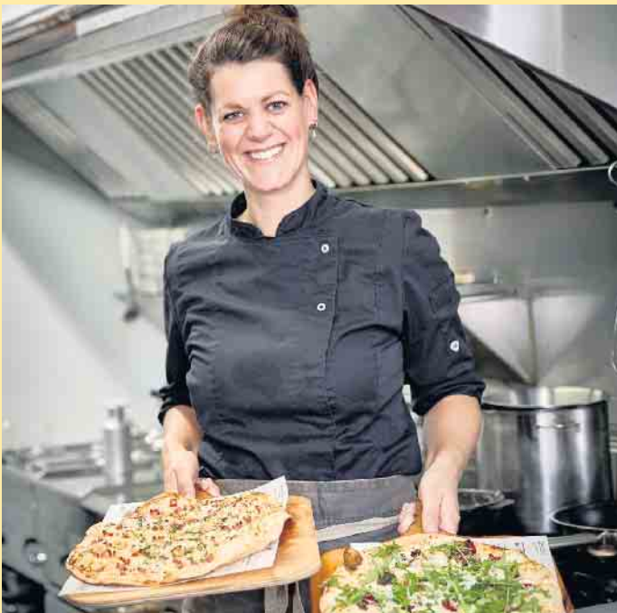
Leckeres aus der Küche in der Nordhang Jause

an der Hochsauerland Höhenstraße, zwischen Winterberg und Altsenberg gelegen. Altbewährte Hüttenatmosphäre mit herzhaften Speisen und Brotzeiten gehören genauso zum neuen Jausen Konzept wie die im alpenländischen Stil ergänzte Almhütte, die für gemütliche Hüttenabende mit Livemusik, Après Ski, sowie verschiedene Veranstaltungen als einzigartige Erweiterung zählt.- Egal ob gemütliche Stunden auf der Sonnenterrasse genießen, oder ausgelassene Hüttenabende am knisternden Holzfeuer des Bullerjahn! Tradition verbindet. Gutbürgerliche Küche und familiäre Atmosphäre.- So präsentiert sich die ursprüngliche Nordhang Jause schon länger als drei Jahrzehnte. 120 zusätzliche Sitzplätze befinden sich auf der Sonnenterrasse im Außenbereich sowie 90 Sitzplätze in der neuen Almhütte. Wir freuen uns über Deinen Besuch! [BL]