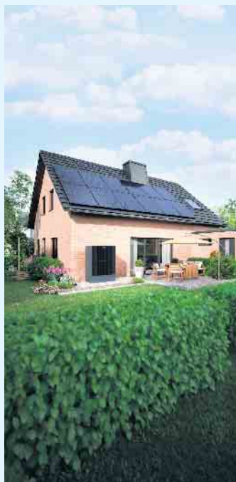
Modernes Einfamilienhaus mit PV-Anlage zur eigenen Stromversorgung

Wir können die unerschöpfliche und sehr effektive Energiequelle aus Sonneneinstrahlung für uns nutzen.- Optimal durch die Installation einer Photovoltaikanlage, auch „PV-Anlage“ genannt. Sie wandelt die Energie der Sonne in Strom um. Eine Anschaffung einer solchen Anlage rechnet sich für Sie und die Umwelt, denn Photovoltaikanlagen gewinnen anstatt Wärme kostenfreien Strom aus Sonnenenergie um das Eigenheim zu versorgen. Der erzeugte Strom lässt sich auch in das öffentliche Stromnetz einspeisen. Moderne Anlagen sind mit einem Speicher ausgestattet, sodass der erzeugte Strom gespeichert wird, bis er im Haus gerade gebraucht wird. Der Meisterbetrieb Menke berät Sie gerne rund um das Thema Solar. [BL]