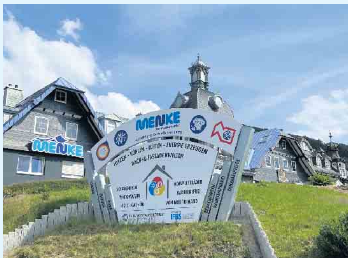
Der Meisterbetrieb Menke in Winterberg-Siedlinghausen

Mit einer solchen Solarthermieanlage kann die kostenfreie Energie aus der Sonneneinstrahlung in Wärme umgewandelt und in einem sogenannten Pufferspeicher, bzw. Warmwasserspeicher zur Trink- und Brauchwasseraufbereitung genutzt werden. Meistens wird eine solche Anlage mit einem anderen Heizsystem kombiniert, weil die Effizienz der Solarthermieanlage aufgrund des wechselnden Wetters natürlich schwanken kann. Durch so eine Kombination wird das Haus auch mit Wärme versorgt, wenn die Solarthermieanlage den