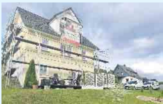
Fassadenarbeiten vom Malerbetrieb Schnorbus

Der Malerbetrieb Schnorbus ist sich den hohen Anforderungen bewusst, bietet Systemlösungen, Fassaden zu schützen, sanieren und ist auch in Sachen