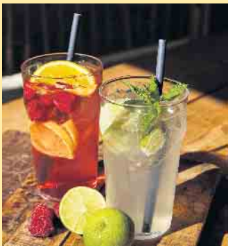
Kühle Sommerdrinks aus der Nordhang Jause

Hereinspaziert und wohlfühlen- in der neuen Location mit Flair und Gemütlichkeit, der Nordhang Jause, direkt am Fuße des Kahlen Asten, wo das Sauerland am „höchsten“ ist!- Hier lässt es sich gut einkehren und verweilen auf einer Wandertour oder einem Bikeausflug. Hüttenflair genießen in zentraler Lage, direkt