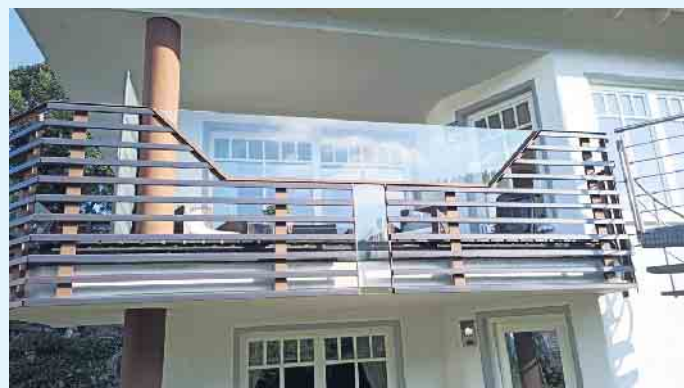
Moderne Balkongestaltung von Tischlerei Holztec

Privatsphäre auf attraktive Art zu schützen. Die Elemente können auf Wunsch als geschlossenes Element, teildurchsichtig mit „Rankschutzgitter“ oder auch in der Kombination mit satiniertem Glas, individuell auf Maß gefertigt werden und dienen natürlich auch als Windschutz. Ein großer Vorteil ist die auf Jahre bestehende Witterungsbeständigkeit bei einem Minimum an Pflege. Alle Kunststoff-Elemente bestehen aus hochwertigstem PVC-Material in verschiedensten Farben und Dekoren. Made im Sauerland. Auch die Gestaltung und Fertigung von Balkongeländern in