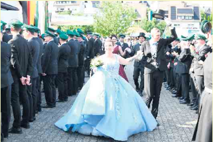
Das neue Königspaar wird am Schützenfestmontag von den Schützen gefeiert