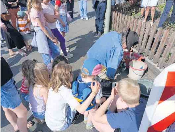
Die Verlegung stößt auf großes Interesse