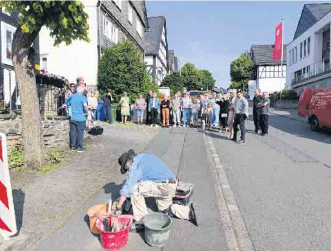
Gunter Demnig verlegt „Stolpersteine“ in Hallenberg

Zwölf „Stolpersteine“, verlegt im Dezember vorigen Jahres, erinnern in Hallenberg bereits an Mitbürgerinnen und Mitbürger jüdischen Glaubens, die unter dem NS-Regime ermordet wurden. Die pflastersteingroßen Gedenktafeln markieren die Orte ihrer letzten freiwilligen Wohnsitze. Neun weitere „Stolpersteine“ sind jetzt dazugekommen, verlegt durch den Künstler Gunter Demnig, der das Projekt „Stolpersteine“ ins Leben gerufen hat. Die 21 Hallenberger Steine reihen sich nun ein in über 110.000 Gedenktafeln für Opfer des Nationalsozialismus in diesem größten dezentralen Mahnmahl in Europa.