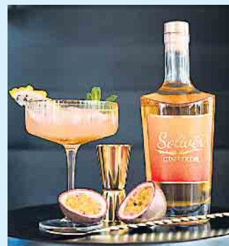
Der neue Gin-Likör: fruchtig-exotischer Mango Maracuja Gin-Likör der Solivér GIN GbR

Auch bei ersten Veranstaltungen und Verkostungen stieß der neueste Genussmoment auf durchweg positive Resonanz.