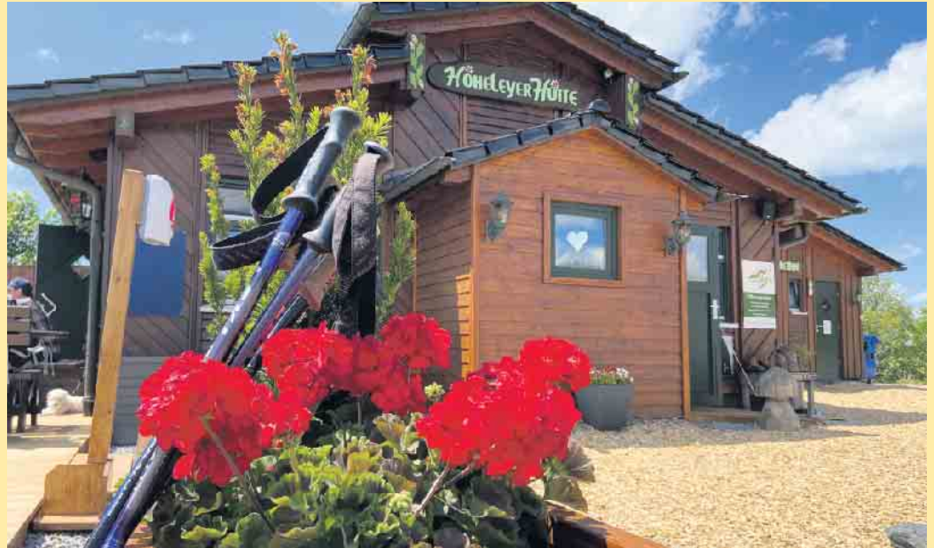
Die Hoheleyer Hütte in schöner Lage am Rothaarsteig