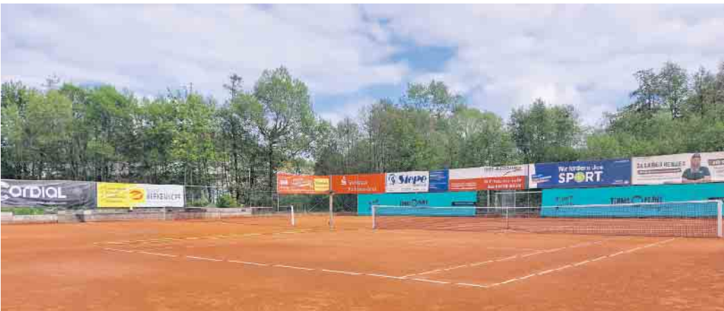
Tennisanlage des TC Hallenberg e.V.

Endlich ist es wieder soweit: In Hallenberg werden wieder Mannschaftsspiele ausgetragen! Nach über zwei Jahrzehnten finden die Medenspiele diesen Sommer endlich wieder auf heimischem Boden statt - und die Herrenmannschaft des TC Hallenberg e.V. freut sich auf spannende Begegnungen vor heimischem Publikum. Wir laden alle Sportbegeisterten herzlich ein, bei unseren Heimspielen dabei zu sein und mitzufiebern. Erlebe spannende Ballwechsel und unterstütze unsere Mannschaft - ob als Tenniskenner, neugieriger Besucher oder einfach nur auf der Suche nach einem schönen Sonntag! Die Heimspiel-Termine der Herrenmannschaft sind: