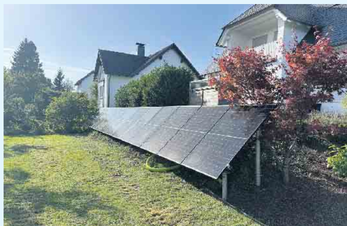
PV-Anlage auf der Rasenanlage - eine Montage muss nicht immer zwingend auf dem Dach erfolgen

Mit einer Solaranlage werden ausschließlich erneuerbare Energien genutzt, außer in Kombination mit einem anderen Heizsystem. Ein klarer Vorteil bei einer Anschaffung einer Solaranlage sind die hohen, staatlichen Förderungen der „BAFA-“ oder der „KfW-Bank“. Außerdem ist man unabhängig von den Energieversorgern, denn Solarenergie ist kostenfrei. Der Meisterbetrieb Menke berät Sie gerne rund um das Thema Solar. [BL]