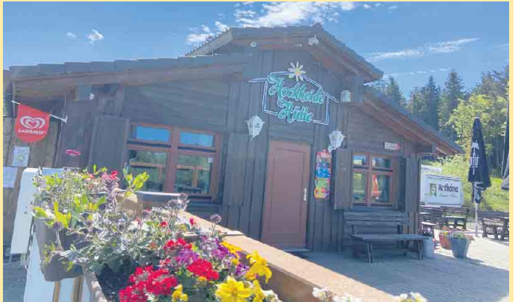
Die Hochheide Hütte am Rande der Niedersfelder Hochheide

Die „Hochheide Hütte“ über Niedersfeld heißt alle Besucher herzlich Willkommen. Vorbeiziehenden Wanderern und Mountainbikern eröffnet sich hier oben eine tolle Aussicht auf das Ruhrtal mit Blick auf den Stüppelturm, den Stimmstammturm und ganz klein, aber noch zu sehen- der Lörmecketurm und hochaufragend die neuen Windräder bei Wulmeringhausen. Die Hütte am Goldenen Pfad auf der Niedersfelder Hochheide hat bis Ende September täglich ab 11.00 Uhr geöffnet. Je nach Wetterlage können die Öffnungszeiten auch telefonisch erfragt werden. Aktuelle Informationen findet man auch bei Facebook, Instagram und www.hochheidehuette-niedersfeld.de . Eine Panorama-Kamera geht diesen Monat online und liefert rund um die Uhr, 24/7 Live-Fotos über das Dach der Hütte, zum Hang, der Heide und dem Einstieg des Goldenen Pfads. Neben der Hütte liefert ein Getränkeautomat jederzeit zusätzlich Kaltgetränke „to go“. Kleine Pizza-Snacks geben neue Kraft zum weiterwandern. Kulinarisches Highlight ist der „Pulled Pork Burger“, bestückt mit Röstzwiebeln und Gewürzgurken. Auf der Speisekarte finden