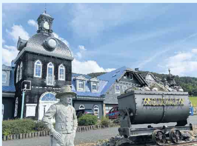
Der Meisterbetrieb Menke in Winterberg-Siedlinghausen