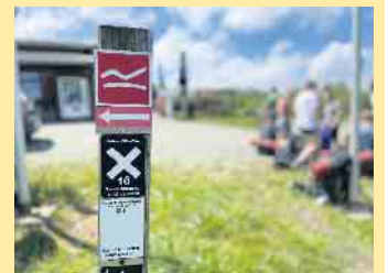
Direkt am Rothaarsteig gelegen: Die Hochheide Hütte

Glas Sekt für 69,- € pro Person ausklingen lassen. Voranmeldungen telefonisch über WhatsApp oder per E-Mail. Ein Frühstücks-Buffer ist täglich auf Voranmeldung ab 6 Personen möglich. Bei gutem Wetter ist die große, an die Hütte angrenzende, gepflasterte Außenterrasse mit ihren 450 Sitzplätzen auch nutzbar. [BL]