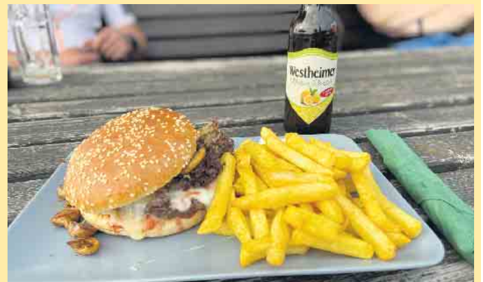
Leckeres Burger-Menü an der Hochheide Hütte