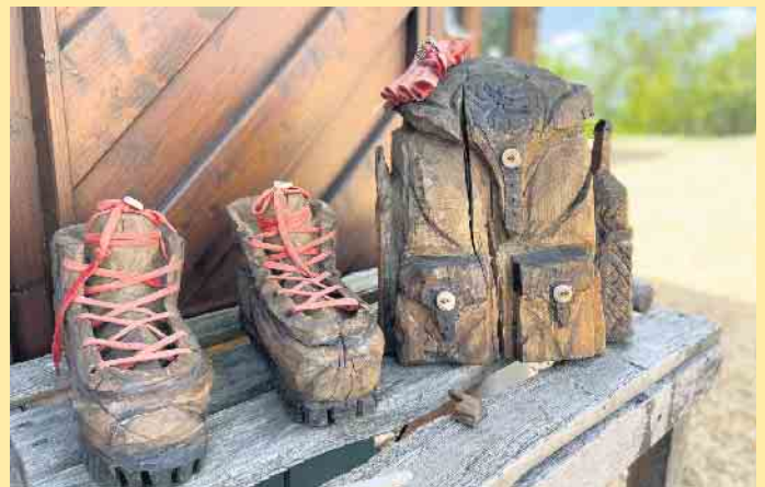
Schöne Schnitzereien an der Hoheleyer Hütte

te“- als Spezialität des Hauses oder der Hütten-Burger vom Angus Rind. Dazu natürlich auch eine passende Auswahl an Kalt- und Heißgetränken. Alle Gerichte auch „to go“ und „take away“. Als besondere Geschenkidee sind hier auch Gutscheine erhältlich. Außerhalb der regulären Öffnungszeiten steht das Hütten-Team auf Vorbestellung auch für private oder geschäftliche Feierlichkeiten gerne zur Verfügung. [BL]