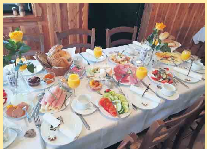
Frühstücksbuffet an der Hoheleyer Hütte