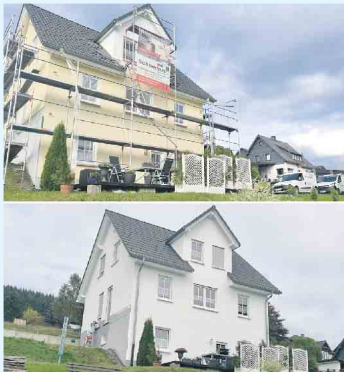
Vorher-nachher Haus nach neuem Anstrich

Die Fassade ist das Aushängeschild eines jeden Bauwerks und die Möglichkeiten der Farbgestaltung sind nahezu unendlich.