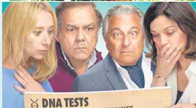
Die Filme der Kinoabende an der Hochheide Hütte: „Kung Fu Panda 4“ und „Oh lala“