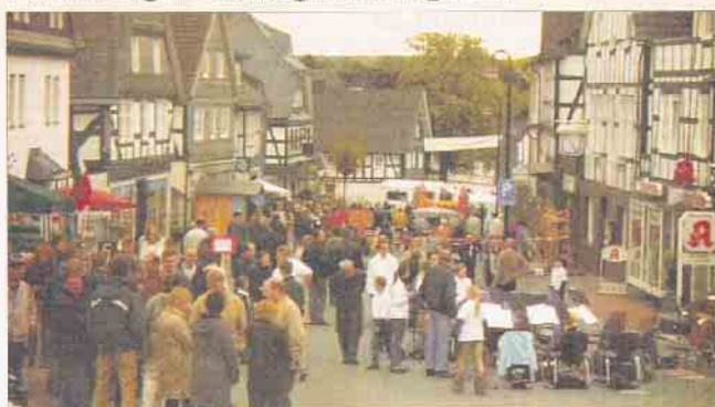
Gut besucht war der Hallenberger Frühling; auch wenn das Wetter nicht in Festtagsstimmung war.

Am 2. Wochenende im Mai startete der „Hallenberger Frühling“ mit einem bunten Rahmenprogramm. Am Samstagabend musste man zwar noch dem Regen weichen und das Open Air Konzert der Band „Magic Flair“ in die Schützenhalle verlegen, aber der