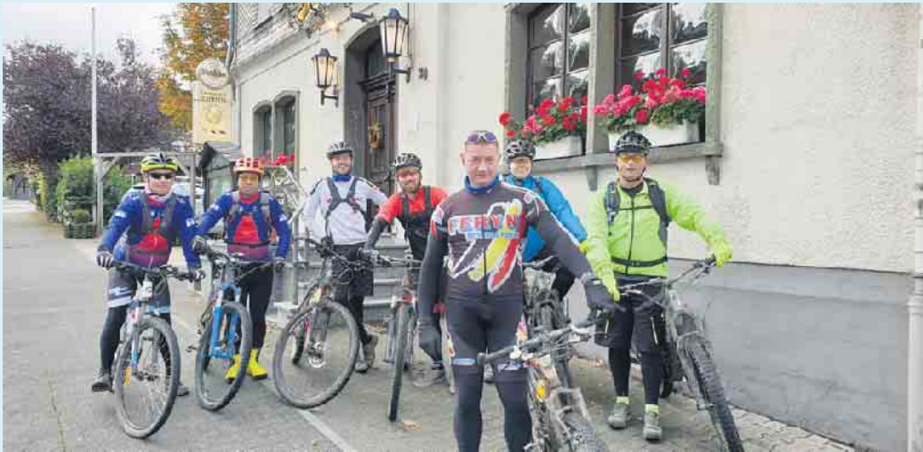
Bikegruppe vor dem Landgasthof Schöttes