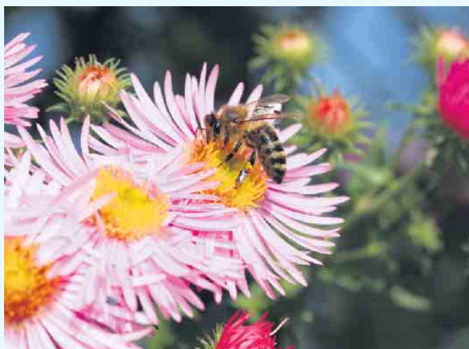
Herbstastern sind beliebte Anflugstationen für Bienen.

Gutes aus der Region, da steckt viel Herzblut drin!