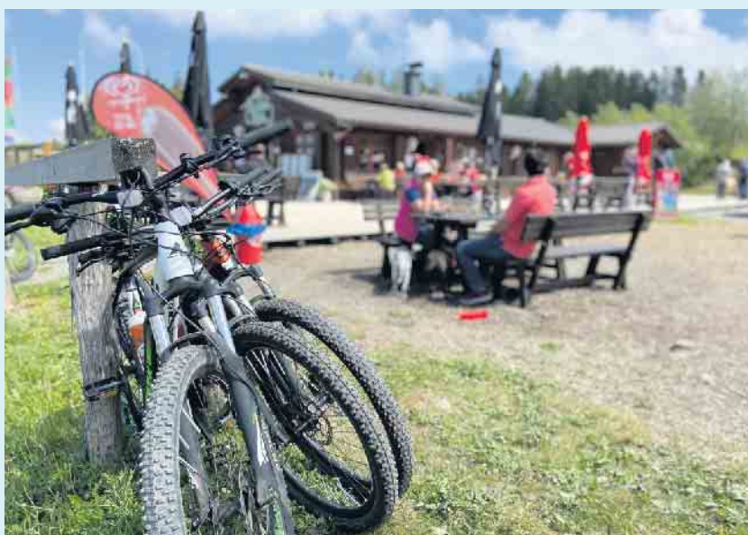
Für einen schönen Aufstieg mit dem MTB: Einkehr an der Hochheide Hütte

nur an der Abendkasse erhältlich. Wer die Festnetznummer der Hochheide Hütte im Handy gespeichert hat, bekommt automatisch über WhatsApp die neusten Events angezeigt. Aktuelle Informationen findet man auch bei Facebook, Instagram und www.hochheidehuetten-niedersfeld.de . Die Hütte ist täglich ab 11.00 Uhr geöffnet, je nach Wetterlage können die Öffnungszeiten auch telefonisch erfragt werden. Für Mountainbiker können die E-Bikes bei der Hochheide Hütte geladen werden. Für BOSCH-Motoren sind Ladegeräte vorhanden. Seitlich an der Hütte befindet sich auch ein hochwertiges Reparatur-Kit mit diverser Werkzeug. Neben der Hütte liefert ein Getränkeautomat jederzeit zusätzlich für Wanderer und Mountainbiker Kaltgetränke