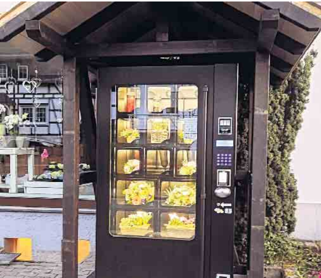
Der neue Blumenautomat vor Blumen Klauke in Züschen

Zum Muttertag am 12. Mai sind Sie bei Blumen Klauke aus Züschen an der richtigen Adresse, denn ein kreativer, liebevoll zu-