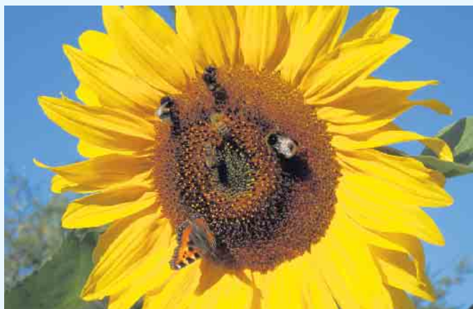
Bienen produzieren nicht nur Honig, sie sind auch unverzichtbar für die Bestäubung vieler Wild- und Nutzpflanzen.

Um die rund 160.000 Imker und Imkerinnen mit ihren nahezu 1.100.000 Bienenvölkern in Deutschland bei ihrem Engagement zu unterstützen, kann jeder selbst etwas beitragen – Tipps dazu gibt es unter www.deutscherimkerbund.de . Auf dem Balkon freuen sich Bienen zum Beispiel über Blumen wie Malven, Tagetes, Sonnenblumen, Astern und Herbstanemonen. Auch blühende Kräuter wie Thymian, Schnittlauch, Salbei, Zitronenmelisse und Bärlauch besuchen sie gern. An Wänden und Zäunen locken kletternder Wilder Wein, Clematis und Efeu die Bestäuber an. Gartenbesitzer können mit Obstbäumen, Beerensträuchern und anderen einheimischen Gehölzen Nahrungsangebote für Bienen schaffen. Und auch die blühende, vielfältige Wiese anstatt des englischen Rasens ist ein Paradies – nicht nur für Bienen. (djd)