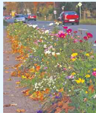
Wertvolle Blühstreifen sind auch auf kleinem Raum möglich. Der Deutsche Imkerbund setzt sich für die Schaffung neuer Flächen ein.