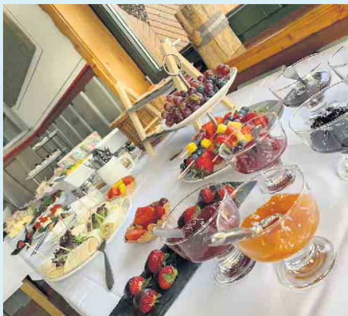
Großes Frühstücksbuffet in der Hoheleyer Hütte

Dazu natürlich auch eine passende Auswahl an Kalt- und Heißgetränken. Alle Gerichte auch „to go“ und „take away“. Als besondere Geschenkidee sind hier auch Gutscheine erhältlich. Außerhalb der regulären Öffnungszeiten steht das Hüttenteam auf Vorbestellung auch für private oder geschäftliche Feierlichkeiten gerne zur Verfügung. [BL]