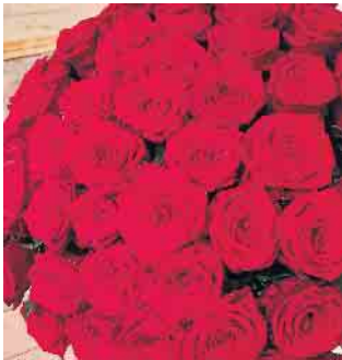
Rote Rosen zum Muttertag von Blumen Klauke