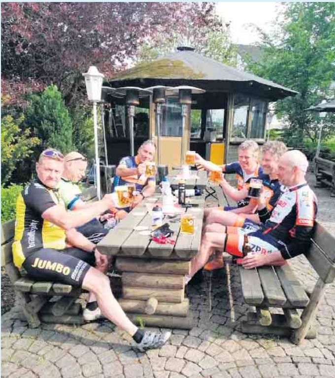
Bikegruppe im Biergarten beim Gasthof Schöttes