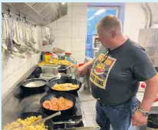
Im Gasthof Schöttes kocht der Chef noch selbst

Nach einer langen Biketour kann man im Biergarten mit Rondell direkt neben dem Gasthof bei gutem Wetter den Tag in gemütlicher Runde ausklingen lassen. Bei schlechtem Wetter natürlich auch in der Wirtsstube. Alle Speisen können einen Tag zuvor auf Bestellung gerne auch für zu Hause abgeholt werden. Vorbeischauchen lohnt sich immer. [BL]