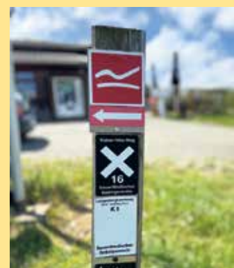
Direkt am Rothaarsteig gelegen- die Hochheide Hütte

derer und Biker. Für die kleinen Gäste ist ein Trampolin und eine große Bobbycar-Fuhrpark neben der Hütte vorhanden. Die Hütte am Goldenen Pfad auf der Niedersfelder Hochheide hat bis Ende September täglich, außer mittwochs ab 11.00 Uhr geöffnet. Eine Panorama-Kamera liefert rund um die Uhr 24/7 Live-Fotos über das Dach der Hütte, zum Hang, der Heide und dem Einstieg des Goldenen Pfads. Je nach Wetterlage können die Öffnungszeiten auch telefonisch erfragt werden. Aktuelle Informationen findet man auch bei Facebook, Instagram und der Website www.hochheidehuetten-niedersfeld.de . [BL]