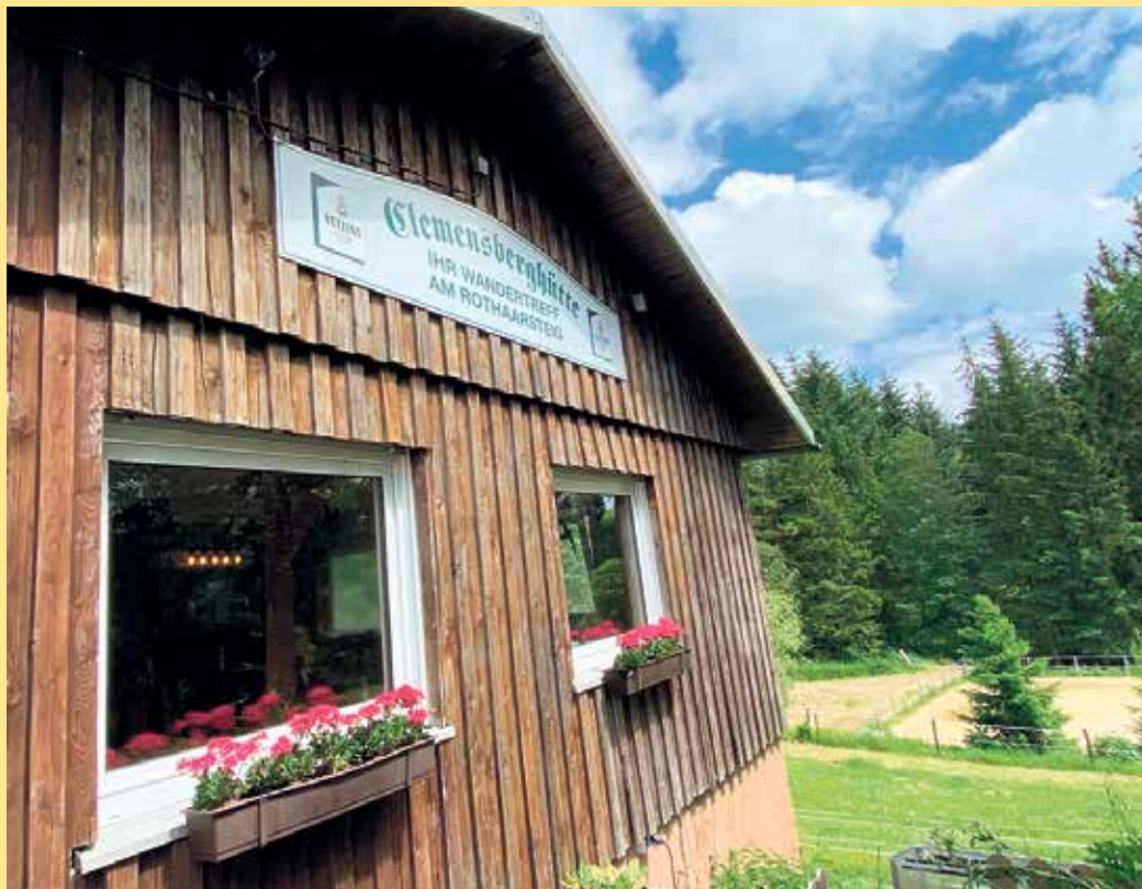
Die Clemensberghütte in ruhiger Lage am Rande von Hildfeld

Die Clemensberghütte ist ein beliebter Treffpunkt für Wanderer, Biker und die Einwohner aus der Umgebung. Die Hütte selbst, gelegen inmitten einer idyllischen Landschaft in der Nähe von Winterberg am Rande des hinzugehörigen Dorfes Hildfeld, ist manchen auch noch als ehemalige Lifthütte bekannt. Von hier aus erreicht man über die Zubringerwege unmittelbar den Rothaarsteig, der über die schöne Landschaft zur Hochheide hinauf zum Clemensberg führt. Hier kann man bei guter Fernsicht eine fulminante Aussicht zum Schloßberg, dem Kahlen Asten und den umliegenden Ortschaften Küstelberg, Hildfeld, Grönebach und Winterberg genießen. Oder man folgt dem "Uplandsteig" in Richtung Willingen. Hier passiert man schon die hessische Landesgrenze ins direkt angrenzende Upland. Über