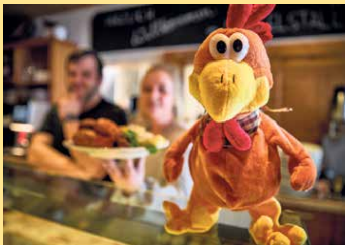
Das Maskottchen des Gockelstalls

Weitere und aktuelle Öffnungszeiten sowie alle Informationen auf www.gockelstall.de [BL]