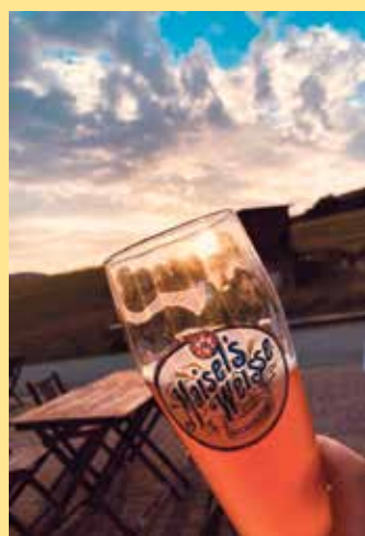
Weizenbiergenuss im Sonnenuntergang an der Clemensberghütte

die Hildfelder Höhe gelangt man auf kurzem Weg auch ins Stycktal zur Mühlenkopfschanze und den Willinger Skywalk.