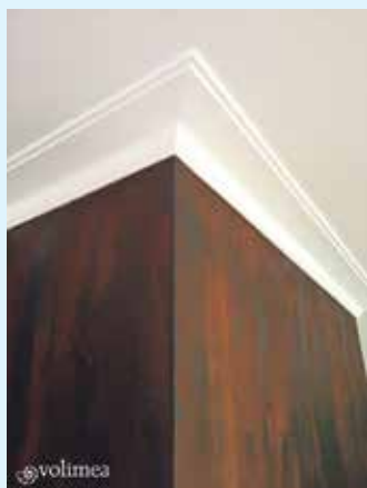
Wandbeschichtung Volimea grandezza bleigrau cortenstahl

Der Malerbetrieb Schnorbus aus Züschen verleiht Ihren Wänden eine zeitlos-elegante Noblesse mit schillernden farblichen Akzenten und außergewöhnlichen Strukturen. Dank der fugenlosen Spachtel mit authentisch wirkender Metalloptik von " Volimea grandezza ". Die brandzertifizierte Effektschichtung von grandezza eröffnet unzählige Gestaltungsmöglichkeiten.