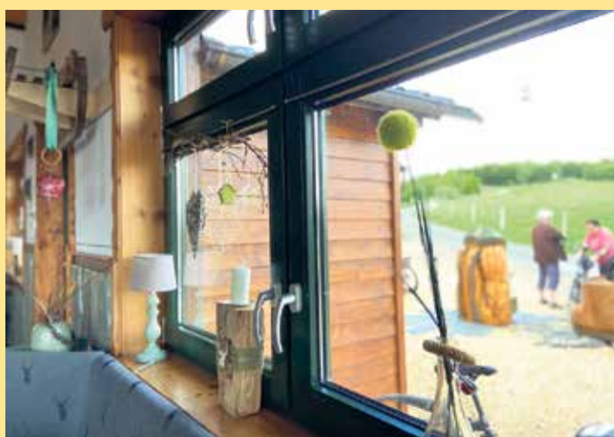
Gemütliche Räumlichkeit in der Hoheleyer Hütte