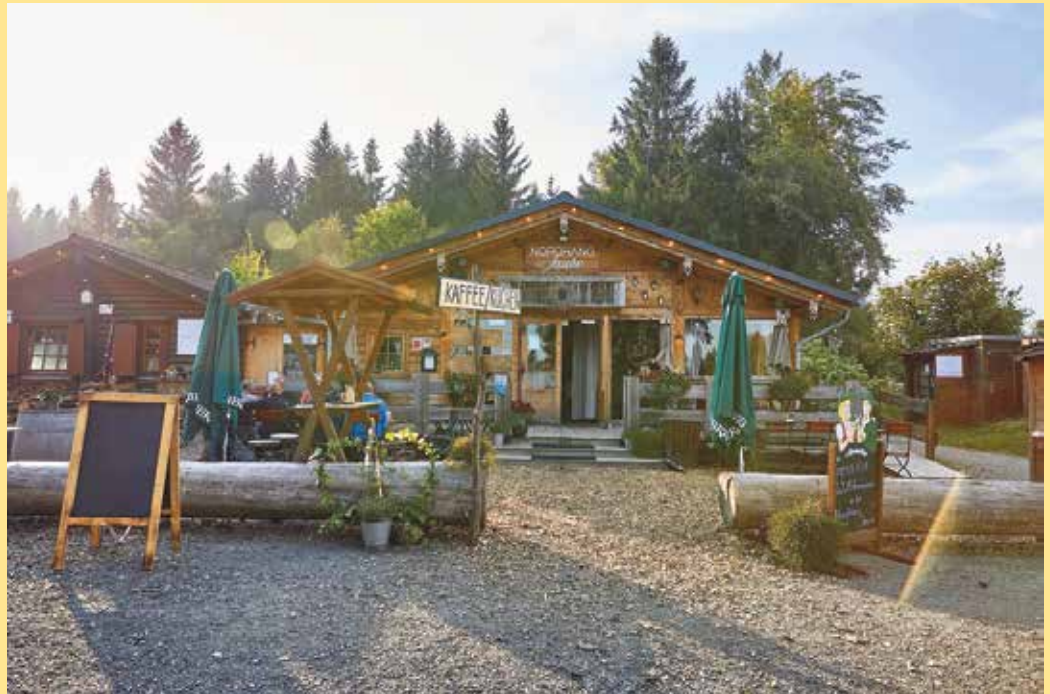
Die Nordhang Jause in zentraler Lage

Auch zum Saisonstart wird einiges geboten: Am Donnerstag, den 30.04.2026, startet ab 19.00 Uhr die „Tanz in den