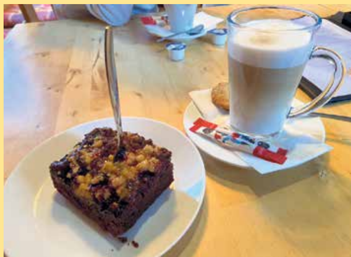
Kaffeepause an der Clemensberghütte

Uhr geöffnet, freitags und samstags auch bis 19.30 Uhr. Auf der Speisekarte befinden sich auch verschiedene Pastagerichte und vegetarische Gerichte zur Stärkung und Fortsetzung einer Wandertour. Die Bezahlung kann ganz flexibel in bar, per Karte oder mobil über Handy erfolgen. [BL]