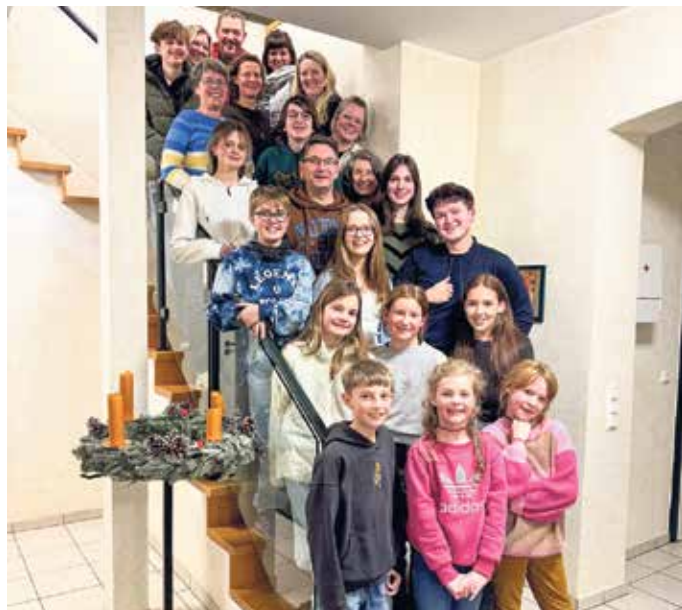
Sprechrollen des Familienstücks „Cinderella“.