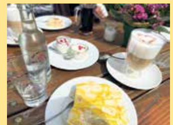
Kaffegedeck der Hoheleyer Hütte

Auch neben besonderen Events bietet das Hütten-Team auf Voranmeldung ein großes, leckeres Frühstücksbüfett an. Dienstags bis sonntags ist das Team um Volker