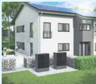
Modernes Haus mit PV-Anlage, Wärmepumpen und Wallboxen

Es kann so einfach und effektiv sein - Kostenlose Umweltenergie sinnvoll zu nutzen ist sehr gut mit einer Photovoltaik-Anlage möglich. Eine solche Anlage nimmt die solare Strahlung mithilfe eines "Absorbers" auf und wandelt solare Energie in Strom zu unterschiedlicher Nutzung im Haushalt um. Je nach Ausrichtung, Art der Kollektoren und der Globalstrahlung kann eine Photovoltaik-Anlage einen Großteil des Strombedarfs eines Haushalts decken. Eine Ausrichtung auf Ost- oder Westdächern passt am besten zum typischen Verbrauchsverhalten eines Privathaushalts, da die Module in den Morgen und Abendstunden Strom produzieren. In Kombination mit einer Wärmepumpe lässt sich der Solarstrom für den Kältekreisprozess nutzen. Das heißt, Betreiber einer Photovoltaikanlage können ein Stück weit unabhängiger von ihrem Stromanbieter werden. Außerdem