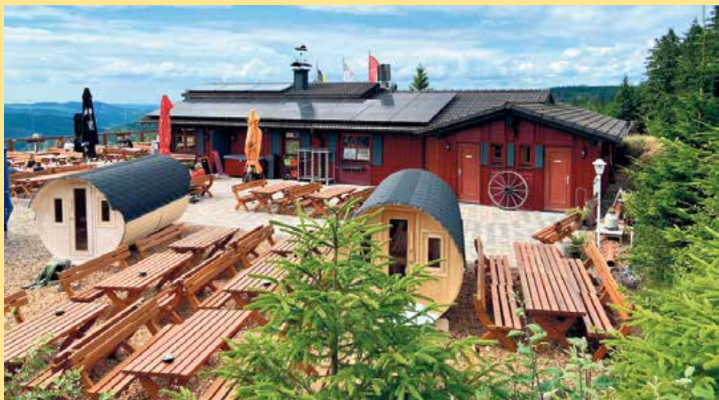
Die Hochheide Hütte in toller Lage mit herrlicher Fernsicht

Als besonderes Highlight zum Jahresende hat man am 31.12.2026 auch wieder hier oben die Möglichkeit, das Jahr bei einer Silvesterfeier bei einem 4-Gänge-Menü mit Miternachtsimbiss und einem Glas Sekt für 69,- € pro Person aus-