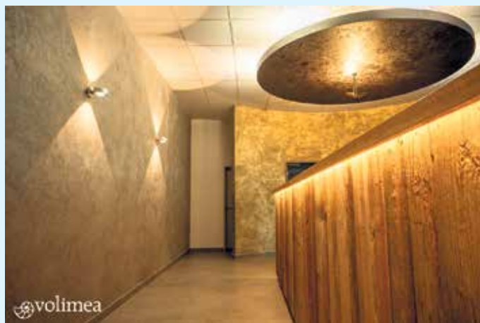
Spachteloptik bleigrau mit Goldlasur von Volimea

Zu den Gestaltungsmöglichkeiten von grandezza zählen veredelte Blattgoldimitationen, Lederoptiken mit Patina oder mit einer Antik-Bronze Veredelung sowie Rost-