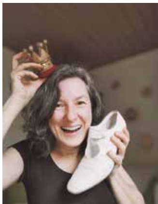
Bärbel Kandziora.

Freilichtbühne Hallenberg probt die Wunder der Saison 2026