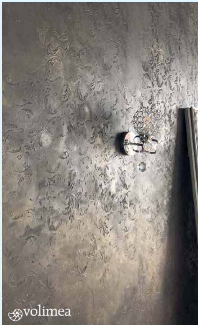
Volimea Grundspachtel anthrazit mit antikgold und Struktur

Ihr Malerbetrieb Schnorbus berät Sie gerne zu Ihrer individuellen, fugenlosen Wand- und Bodengestaltung. [BL]