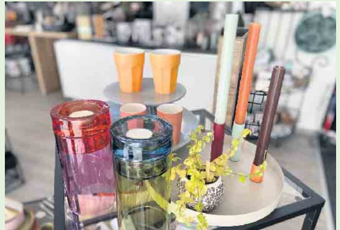
Windlichte „Lys“ und Kerzenhalter „Luna“ der Kollektion REMEMBER

Wer offen ist für neue Designs, die das eigene Zuhause zu etwas Einzigartigem machen, wird die Kollektion von REMEMBER lieben. Die Produkte umfassen Wohnaccessoires, Möbel und Spiele, die allesamt Farbe in das alltägliche Leben bringen und an denen man sich jeden Tag erfreuen kann. Metalltablets, Outdoor-Kissen, Outdoor-Leuchten, Glasdosen, Glasvasen, Kerzenständer sowie Windlichte sind von REMEMBER bei „Tischlein deck dich“ an der Unteren Pforte, ganz zentral am Marktplatz von Winterberg zu bekommen. Die Glaselemente bestehen stets aus zwei zart getönten Glaskörpern und ermöglichen dadurch immer wieder andere Kombinationsmöglichkeiten. Die mundgeblasenen Windlichte „Lys“ im Color-Blocking-Design