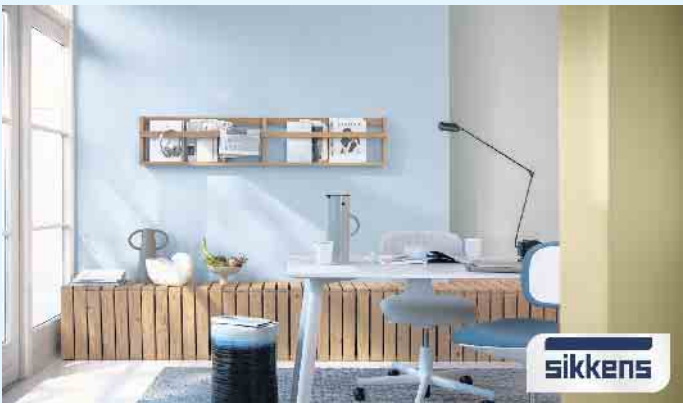
Büro in dezentem hellblau

Farbtöne. Darin enthalten sind nicht nur die beliebtesten Farbtöne, sondern auch mehr klassische Farbtöne an Off-Whites, Grautönen und gedeckten Farben. Die sorgfältige Farbwahl trägt in hohem Maße dazu bei, ein Zuhause wohnlich zu gestalten und die perfekte Farbe zu finden. Mit den Sikkens LifestyleColors verfügt auch der Malerbetrieb Schnorbus über einen qualifizierten Leitfaden für eine erfolgreiche Farbberatung für jeden Geschmack: Effektfarbtöne sorgen für außergewöhnliche Oberflächenoptik. Die zehn ausgesuchten Alpha Metallic Farbtöne sind ganz auf die Ansprüche hochwertiger und moderner (Innen)Architektur abgestimmt. Die Kollektion Weiss von Sikkens