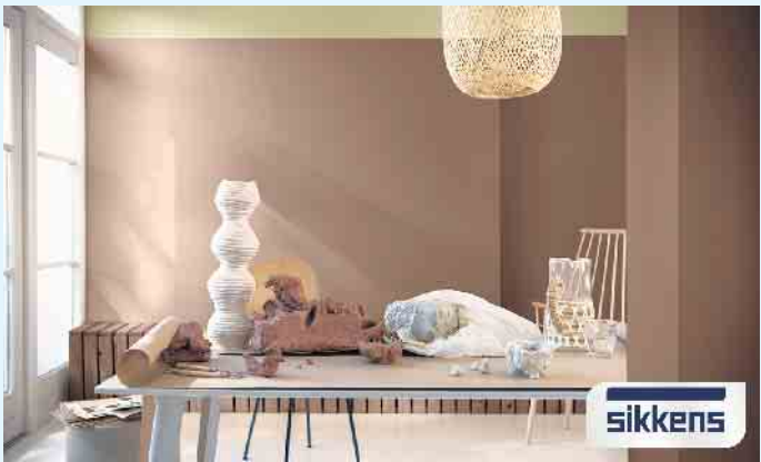
Arbeitszimmer in warmen Brauntönen

In Sachen Fassadenfarbe präsentiert Sikkens die besten 608 Farbtöne aus 50 Jahren Fassadengestaltung. Dank des Color-Mix-Systems können selbst kräftige und dunkle Farbtöne bedenkenlos an Fassaden eingesetzt werden. Kreative und stilischere Farbgestaltung von Holzfassaden bietet die Cetol Wetterschutz-Kollektion und ist das ideale Instrument für die kreative Gestaltung von Holzfassaden und -bauteilen. Diese Auswahl