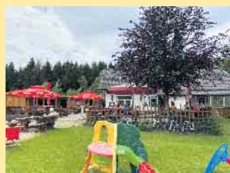
Kinderspielland für die Minis an der Schlossberg Alm

Wanderung K1 – Reetsbergweg: Start/Ziel am Schlossberg. Wir empfehlen am Schlossberg zu starten, dann über Küstelberg, Orkequelle, Rösberg, junge Grimme, Schienenhütte und wieder zurück über den Reetsbergweg zum Schlossberg. Wanderstrecke 9,8 km – Dauer ca. 3 Std., Anforderung mittel.