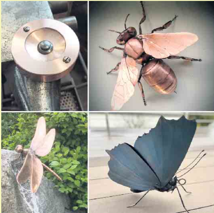
Formschöne Blecharbeiten für drinnen und draußen von M. Tuss