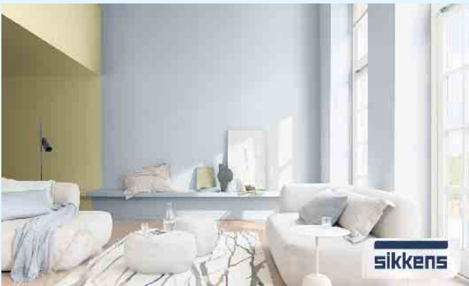
Wohnzimmer in hellem Blauton