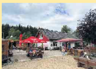
Die Schlossberg Alm mit großer Sonnenterrasse und Lounges (Almhütten)