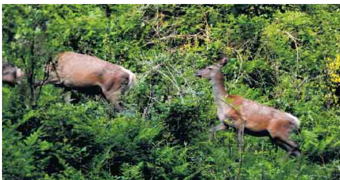
Leserfoto von Gerhard Kobbeloer aus Hallenberg