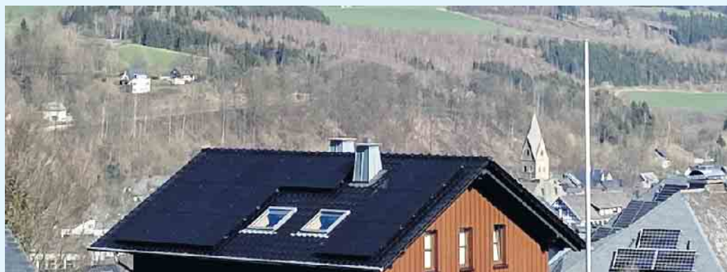
Dunkle, moderne Photovoltaikanlage vom Meisterbetrieb Menke