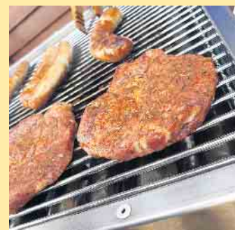
Rustikales Grillgut an der Hoheleyer Hütte

und Außenbereich wurde die Hütte modernisiert und renoviert. Unter anderem wurde der Boden in der Hütte mit neuen Fliesen verschönert und eine Tischplatte wurde mit einer Rothaarsteig-Karte für Wanderer versehen. Bei gutem Wetter kann man sich derzeit auf der Außenterrasse mit der herrlichen Fernsicht niederlassen. Am 1. Mai gibt's draußen bei gutem Wetter rustikale Speisen vom Grill mit musikalischer Unterhaltung. Generell bietet das Hütten-Team auch ein großes, leckeres Frühstücksbuffet auf Voranmeldung an. Dienstags bis sonntags ist das Team um Volker Müller durchgehend von 11.00 bis 19.00 Uhr für alle Einkehrer da.