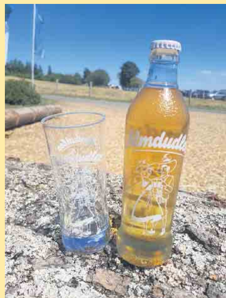
„Almdudler“-erfrischendes Getränk an der Hoheleyer Hütte