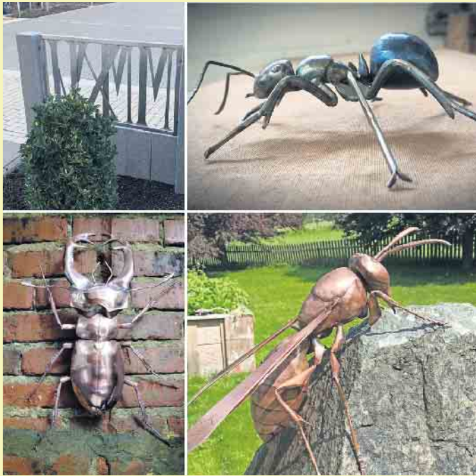
Outdoor-Kunstobjekte für stilvolle Gärten von Michael Tuss

außergewöhnliche Blecharbeiten aus Kupfer, normalem Stahl oder Cortenstahl. Bei allen Outdoor-Kunstobjekten handelt es sich um Dekorationen wie pflanzliche Objekte, Vogeltränken, Haus-schilder oder Lampen u.v.m. für stilvolle, schöne Gärten oder Terrassen. Spezialisiert hat sich M. Tuss dabei auf originalgetreu, aber überdimensional große Insekten, die er vorrangig aus Kupfer fertigt. Besondere Akzente setzt er bei seinen Treibarbeiten gerne durch verschieden angewandte Techniken. Formschöne Insekten wie Libellen, Wespen oder Schmetterlinge aus Metall hinterlassen einen sehr grazilen Eindruck im Auge des Betrachters.