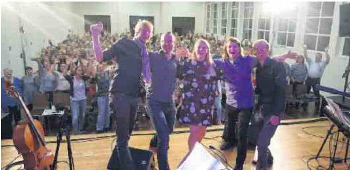
Patricia Kelly und Band bei ihrem umjubelten Auftritt 2017 in der Stadthalle.

Kelly zum zweiten Mal nach Hallenberg. Bereits 2017 begeisterte sie das Hallenberger Publikum bei einem umjubelten Konzert in der Stadthalle. Am Freitag, 9. Juni, um 20 Uhr, heißt es auf der Freilichtbühne in Hallenberg: Patricia Kelly & Band live in concert Herzlichen Dank an die Freilichtbühne, die dem Förderverein für dieses Konzert nicht nur ihr Gelände zur Verfügung gestellt hat, sondern auch den Kartenverkauf übernommen hat. Der Vorverkauf läuft bereits auf Hochtouren. Tickets gibt es im Vorverkauf für 30 Euro unter