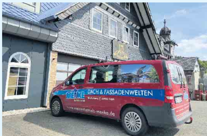
Der Meisterbetrieb Menke in Winterberg-Siedlinghausen

rechnerisch abziehen zu lassen. Der Jahres-Primärenergiebedarf würde dadurch sinken und Hausbesitzer wären berechtigt, attraktive staatliche Wärmepumpen-Förderung auch für Neubauten in Anspruch zu nehmen.- Aber ganz unabhängig davon, ob die Wärmepumpe in einem Neubau oder einem Altbau zum Einsatz kommt- für die Gewährleistung eines dauerhaft sicheren und wirtschaftlichen Betriebes oder Haushaltes muss das Heizsystem möglichst exakt zum Heizbedarf passen. Das Team vom Meisterbetrieb Menke berät Sie gern. [BL]