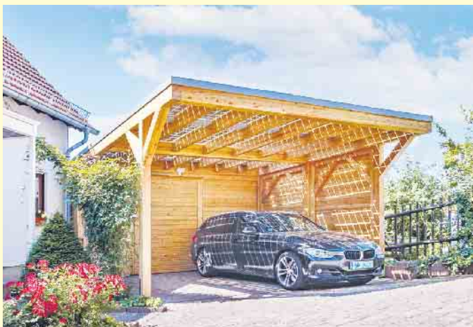
Nachhaltige Energiegewinnung: Solarcarports für Ihr Zuhause