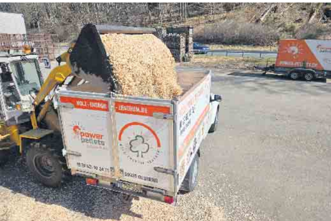
Abbildung: Auslieferung auch mit dem kleinen Kipperfahrzeug

Holz-Energie-Zentrum Olsberg GmbH Carls-Aue-Straße 91 59939 Olsberg/Steinhelle Öffnungszeiten mit Service: Telefon: 02962 802471 holz-energie-zentrum.de Mo-Fr 8-17.30, Sa 8-12 Uhr