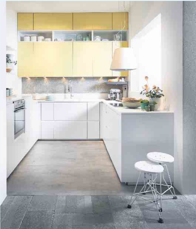
Je weniger Grundfläche zur Verfügung steht, desto mehr wird in die Höhe geplant wie bei dieser sehr ansprechenden Lösung mit reichlich Stauraum und modernen, softmatten Oberflächen in hochwertigem Echtlack.

ein. Und wo kein großer Geschirrspüler Platz hat, tut es auch ein 45 cm schmales Einbaugerät mit der gleichen Komfortausstattung und Effizienz wie ein Modell in Standard-Size. Viele 45er-Modelle arbeiten zudem sehr leise, was sie auch für Apartments attraktiv macht. Damit die Tätigkeiten an der Spüle auch in kleinen und Tiny Kitchen flott und angenehm von der Hand gehen, hat die Zubehörin-