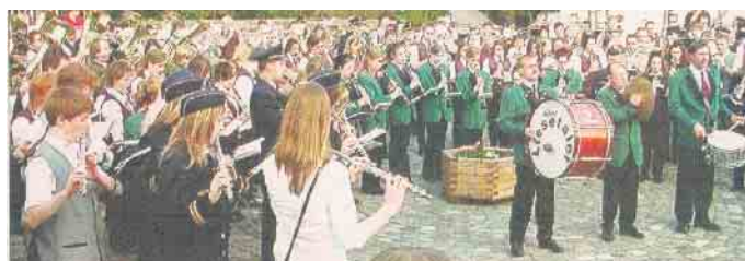
Die Musikvereine beim Konzert in der Dorfmitte