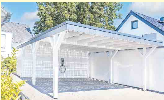
Jedes Solarcarport wird passend zum vorhandenen Platz und dem Bedarf geplant.

soliden Holz- oder Aluminiumkonstruktionen, deren Dach mit leistungsstarken und langlebigen Solarglas-Modulen belegt ist. Die Planung zur Größe und Farbgebung richtet sich individuell nach dem Bedarf, dem vorhandenen Platz und der Architektur des Eigenheims.