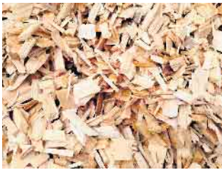
Abbildung: Fallschutzhackschnitzel mit dämpfender Wirkung

Die Fallschutz-Hackschnitzel sind für diesen Anwendungsfall produziert und aufbereitet. Der Feinanteil ist abgeschieden, es ist nahezu keine Rinde und keine gefährlichen Überlängen enthalten. Die Hackschnitzel werden jährlich zertifiziert und gemäß der DIN EN 1177 für stoßdämpfende Spielplatzböden überwacht. Das bedeutet, dass sie spezielle Tests zur Fallhöhe bestanden haben und somit den Schutz von Kindern gewährleisten. Dank ihrer Beschaffenheit verhindern sie zudem Stauunässe und reduzieren das Risiko der Bildung von Pilzsporen. Weitere Vorteile: Diese Hackschnitzel bestehen aus naturbelassenem Holz und sind vollständig biologisch abbaubar. Die Hackschnitzel stammen aus nachhaltiger Forstwirtschaft und sind frei von chemischen Zusätzen. Im Gegensatz zu Sand oder Kies bleibt das Material zudem sauberer und bietet einen angenehmen Untergrund zum Spielen.