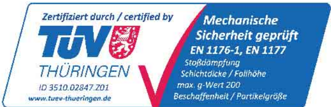
Abbildung: TÜV Bestätigung der Stoßdämpfung und Beschaffenheit