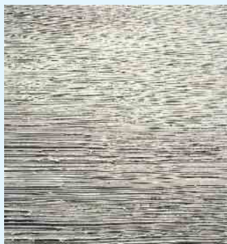
Wasserlasur-Wandbeschichtung von Volimea grandezza in anthrazit mit Bürstenoptik