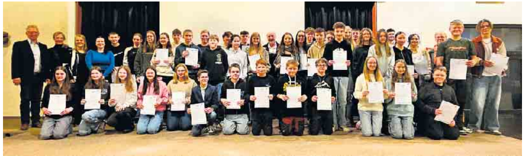
Schülerinnen und Schüler der Sekundarschule Medebach-Winterberg erhalten das ProBe-Zertifikate in der Aula der Sekundarschule am Standort Medebach.