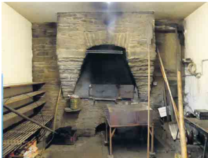
Die Außenhülle des historischen Backofens bleibt erhalten. Innen wird der Backofen erneuert.