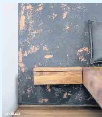
Schlafzimmer-Wanddesign mit Wandbeschichtung in Antik-Bronze-Patina von Volimea grandezza

Der Malerbetrieb Schnorbus aus Züschen verleiht Ihren Wänden eine zeitlos-elegante Noblesse mit schillernden farblichen Akzenten und außergewöhnlichen