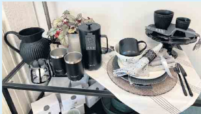
„Frenchpress to go“- Kollektion in schwarz von SCANPAN Denmark

Dänische Markenprodukte für zuhause und unterwegs bei „Tischlein deck dich in Winterberg