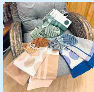
Küchenhandtücher und Topfuntersetzer von ZONE DENMARK

Das Team vom „Tischlein deck dich“ informiert und berät gern rund um Ersatzteile, Nutzung, Reinigung und Pflege der hochwertigen Marken. [BL]