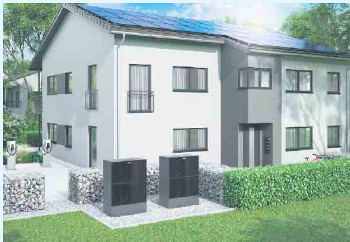
Modernes Mehrfamilienhaus mit Wärmepumpen, PV-Anlage und Wallboxen.

Um die in Erde, Wasser oder Luft gespeicherte Wärme verfügbar zu machen, nutzen Wärmepumpen elektrische Energie. Durch die Kombination mit einer Photovoltaikanlage lässt sich ein erheblicher Teil des benötigten Stroms aus Sonnenenergie erzeugen. Damit erlangt man mehr Unabhängigkeit von Energieversorgern und erreicht geringere Stromkosten. Eine Ausrichtung auf Ost- oder Westdächern passt am besten zum typischen Verbrauchsverhalten eines Privathaushalts, da die Module in den Morgen und Abendstunden Strom produzieren. Der Meisterbetrieb Menke aus Siedlinghausen steht für diese Anwendung