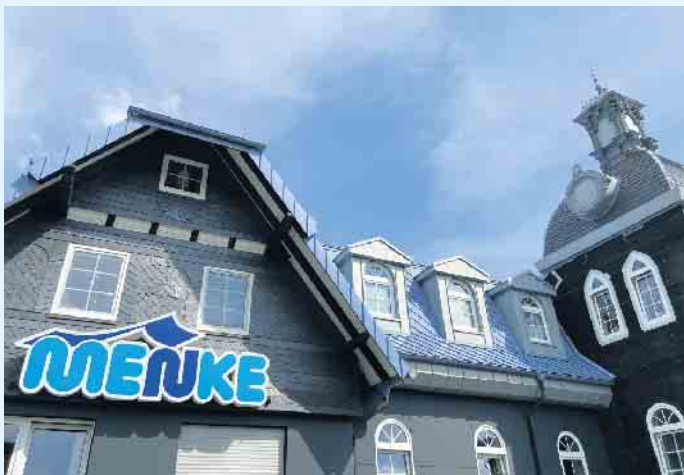
Der Meisterbetrieb Menke in Winterberg-Siedlinghausen

Komplettlösungen vom Meisterbetrieb Menke aus Winterberg-Siedlinghausen