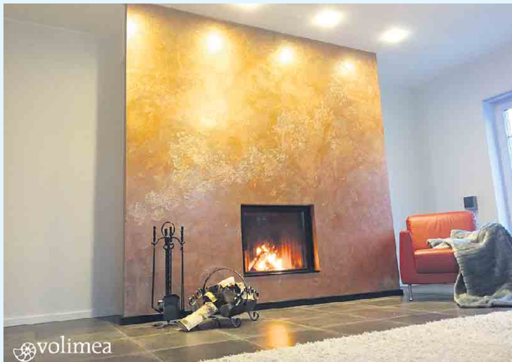
Wohnzimmer Kamin-Wandbeschichtung von Volimea grandezza in bronze

Der Malerbetrieb Schnorbus aus Züschen verleiht Ihren Wänden eine zeitlos-elegante Noblesse mit schillernden farblichen Akzenten und außergewöhnlichen