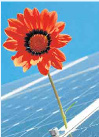
Natürlicher geht's kaum- Grüner Strom über die PV-Anlage

terhaltungselektronik und Elektrofahrzeugen möglich. Ein Stromspeicher ist Grundvoraussetzung für eine optimale Versorgung. Wärmepumpen und Photovoltaikanlagen können in Neu- und Altbauten installiert werden. Es kann eine staatliche Förderung beantragt werden. Das Team vom Meisterbetrieb Menke berät Sie gern. [BL]