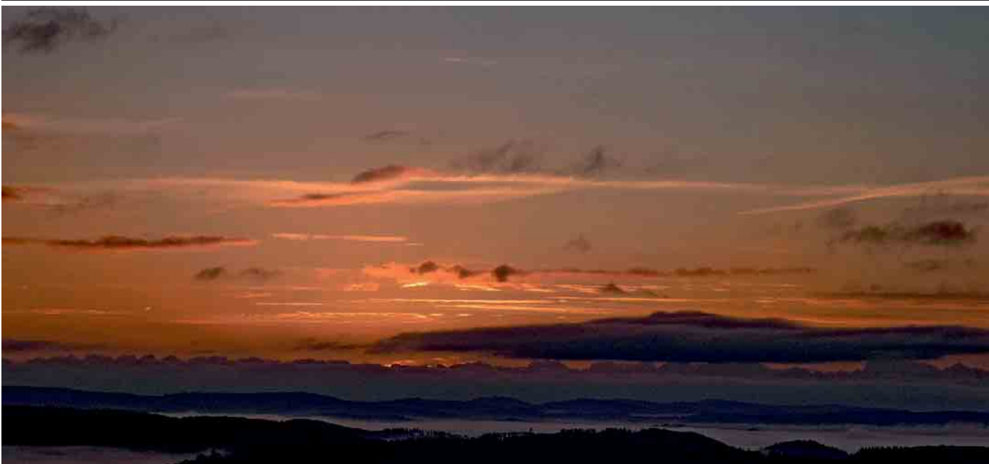
Leserfoto von Gerhard Kobbeloer aus Hallenberg