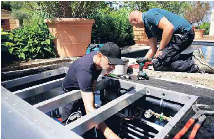
Arbeiten am Technischacht.

Gibt es einen Beruf, in dem man Träume erfüllen kann? In dem individuelle Beratung genauso gefragt ist wie handwerkliches Können und ein Gespür für Ästhetik und Design? In dem man Werte schafft, die für andere den „Himmel auf Erden“ bedeuten? Schwimmbadbauer ist so ein Beruf - vor allem, wenn es um den Bau privater Pools geht. Hier sind kreative Köpfe am