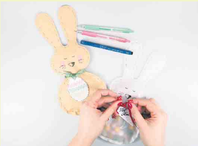
Niedliche Osterhasentüten machen die Eiersuche noch spannender und abwechslungsreicher.

Um die Hasentüten zu basteln, braucht man zunächst Pack- oder Transparentpapier, eine Nadel, einen stabilen Faden, ein Schleifenband, eine Schere, einen Locher und Kreativstifte wie den Fineliner Drawing Pen in Schwarz und den Gelschreiber G2-7, den es von Pilot in einer Auswahl von 31 bunten Farben gibt. Hinzu kommen ausgedruckte Vorlagen für Hase und Anhänger, die man zum Beispiel unter www.pilotpen.de/diy-tutorial kostenlos herunterladen kann.