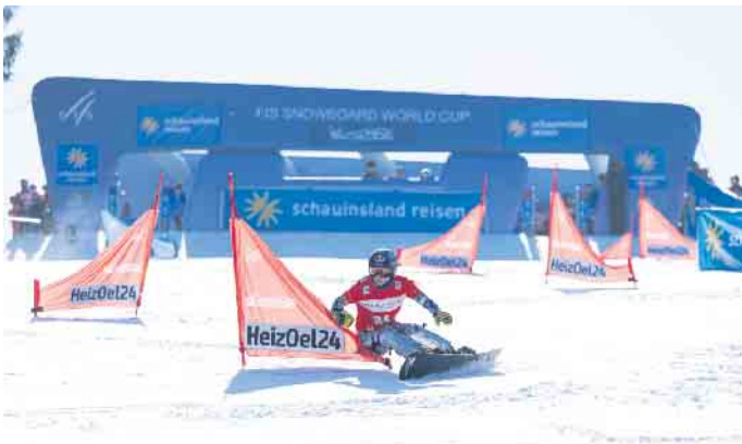
Hervorragende Pistenverhältnisse prägten auch in diesem Jahr den FIS Snowboard-Weltcup am Poppenberghang im Skiliftkarussell Winterberg.