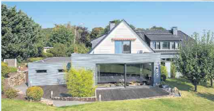
Maßgeschneiderter Anbau in Holzbauweise sowie Aufstockung, vorher und nachher

In Bestandsgebäuden steckt häufig ein enormes schlummerndes Raumpotenzial mit zahlreichen Möglichkeiten erweitert und aufgewertet zu werden. Wohnraumerweiterungen schaffen nicht nur mehr Raum und bringen Ihnen wertvolle Quadratmeter voller Lebensqualität, sie verschaffen den Bestandsimmobilien zugleich auch einen deutlichen Mehrwert. Mit einer professionell durchgeführten Aufstockung oder einem Anbau in Holzbauweise kann die Flächennutzung optimiert und der Wohnwert gesteigert werden. Der Baustoff Holz bietet dabei reichlich Vorzüge und unendliche Gestaltungsmöglichkeiten. Kreative Lösungen