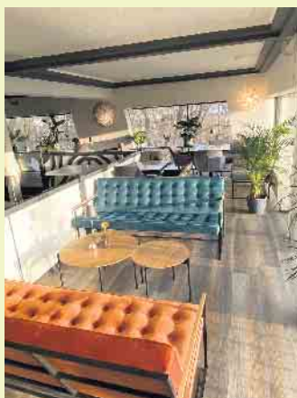
Gemütliche Loungemöbel im NEXO Restaurant

und Geschichte- an der modernen NEXO Bar lassen sich auch angesagte Drinks in vielen Varianten genießen. Geöffnet hat das NEXO mittwochs bis samstags immer ab 17.00 Uhr. [BL]