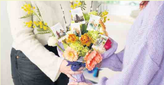
Ostergruß mit persönlicher Note: Ein frühlingshafter Blumenstrauß kommt mit eigenen Schnappschüssen noch besser an.

Die Sonne wärmt die Haut, die Natur erwacht und erblüht von Neuem in allen Farbtönen: Mit den Temperaturen steigt im Frühjahr auch wieder die Stimmung. Das lange Osterwochenende bietet die beste Gelegenheit, Familie und Freunde zu treffen sowie endlich wieder mehr Zeit unter freiem Himmel zu verbringen. Kleine Aufmerksamkeiten gehören zum Osterfest natürlich dazu. Besonders gut kommen Präsente an, die mit Kreativität und persönlicher Note selbst gestaltet wurden. Mit eigenen Fotos zum Beispiel wird jedes Geschenk zu einem Unikat.