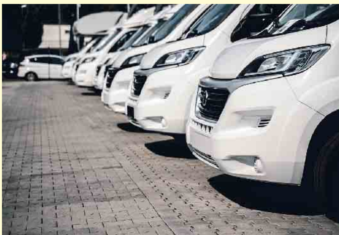
Wohnwagen sind aktuell sehr beliebt.

Wohnwagen und Reisemobile liegen in Deutschland voll im Trend. Auch die Miet-Nachfrage ist groß. Doch mit ein paar Tipps können Mietwillige ein Fahrzeug für ihren Traum-Urlaub finden.