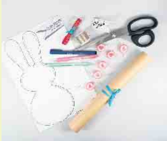
Das Material für die Osterhasentüten auf einen Blick.