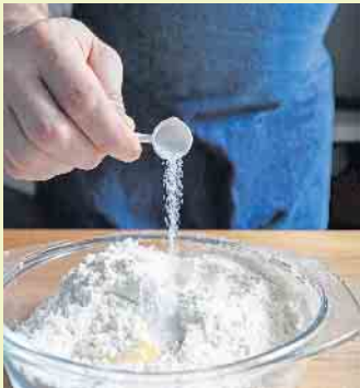
Speisesalz spielt beim Backen eine entscheidende Rolle, da es den Geschmack verbessert und die Aromen intensiviert.