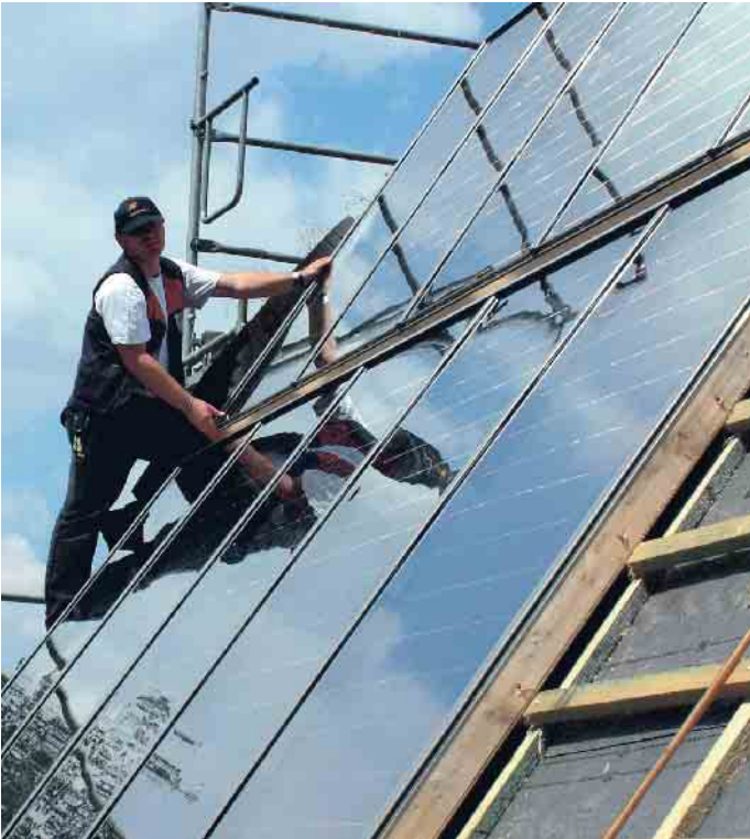
Photovoltaik: Dachdecker wissen, was zu tun ist. Foto: HF. Redaktion Harald Friedrich/akz-o

Der Run auf Photovoltaik-Anlagen hat begonnen, denn viele Bauherren möchten von den Steuererleichterungen und Förderungen profitieren, aber auch die Klimawende mitgestalten. In einigen Bundesländern sind PV-Anlagen auf Dächern mittlerweile sogar verpflichtend. Allerdings gibt es bei der Montage von PV-Anlagen auf Dächern einiges zu beachten. Mittlerweile häufen sich die Schadensmeldungen durch unsachgemäße Arbeiten. So werden Solaranlagen auf bauphysikalisch nicht geeigneten Unterkonstruktionen montiert. Daher sollte vor der Installation einer PV-Anlage geprüft werden, ob das Dach die notwendigen Eigenschaften erfüllt oder vorher ertüchtigt werden muss. Der Zentralverband des Deutschen Dachdeckerhandwerks (ZVDH) geht davon aus, dass unsanierte Dächer oft vor Ablauf der Amortisationszeit der PV-Anlagen von 20 Jahren saniert werden müssen. „Die vorhandene PV-Anlage muss dann abgebaut und während der Sanierungszeit außer Betrieb genommen werden. Dadurch entstehen für den Bau-