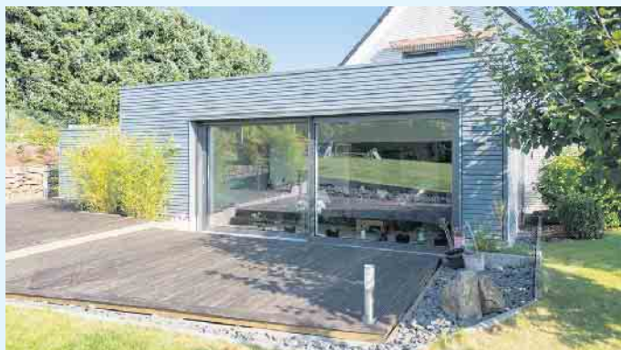
Anbau in Holzbauweise von außen

Mehr Wohnraum und eine neue Garage mit Abstellraum waren die Wünsche der Bauherren. Der weitläufige Garten bot ausreichend Platz, um genau diese Vorstellungen verwirklichen zu können. Im rund 40 Quadratmeter großen Flachdachanbau erstreckt sich eine stilvolle und elegante Wohnlandschaft. Die Eleganz der Innen-