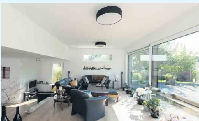
Anbau in Holzbauweise von innen

lassen den Bestand perfekt mit dem neuen Gebäudeteil harmonisieren. So auch in diesem Beispiel: Als sichere Altersversorgung wurde in diesem Mehrgenerationenhaus eine separate Einliegerwohnung zum Vermieten geplant. Durch einen Anbau entstand ein Gebäudeensemble, das in zwei Wohnungen einen hohen Wohnkomfort und viel Privatsphäre bietet. Und wieder einmal ging, dank der Holzbauweise, alles ziemlich zügig! Innerhalb von nur sechs Monaten wurde der neue Gebäudeteil durch das Olsberger Holzbau-Unternehmen Wiese und Heckmann errichtet und damit der Grundriss der Einliegerwohnung fertiggestellt.