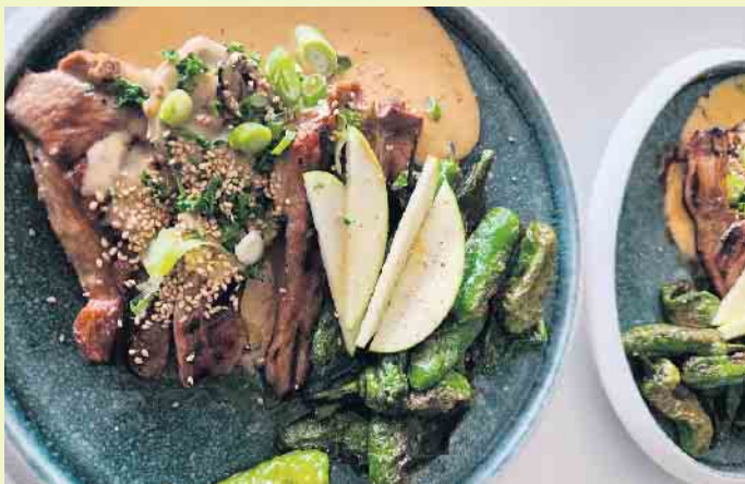
Eines von vielen Tapa-Menüs des NEXO Restaurant

Nach fast halbjähriger Umbauphase entstand direkt angrenzend an die Räumlichkeiten des Bowlhaus das „NEXO Restaurant“ in Winterberg, was letzten Monat in komplett neuem Style und Konzept seine Pforten öffnete. Eine Neuheit mit Kultcharakter.