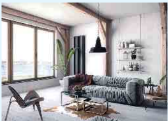
Eine energetisch optimierte Gebäudehülle mit Wärmedämmglas reduziert den Heizbedarf und auch die sommerliche Kühllast jedes Gebäudes.

schließend die Effizienz für Heizung und Kühlung zu maximieren“, rät Grönegräs. Energieberatungen und anschließende energetische Sanierungsmaßnahmen werden in Deutschland durch verschiedene Förderprogramme unterstützt, zum Beispiel durch die Kreditanstalt für Wiederaufbau (KfW), das Bundesamt für Wirtschaft und Ausfuhrkontrolle (BAFA) oder Förderungen der Bundesländer und Kommunen. Weitere Informationen unter www.glas-ist-gut.de/energiesparenmitglas und zu den Förderprogrammen unter www.bafa.de/beg und www.kfw.de . (akz-o)