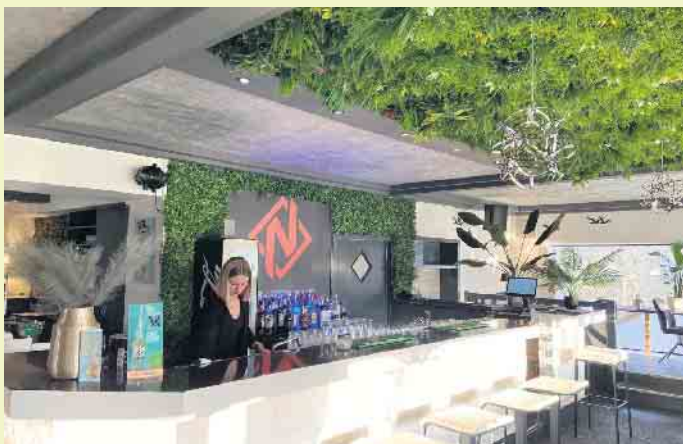
Die kultige NEXO Bar