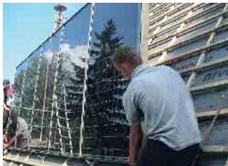
Photovoltaik: Dachdecker wissen, was zu tun ist. Redaktion Harald Friedrich/akz-o

gebende können haftbar gemacht werden. Es häufen sich Fälle, wo Baustellen wegen Nichtbeachtung von Arbeitsschutzmaßnahmen stillgelegt werden. Das kostet Nerven, Zeit und Geld. Dachdeckerfachbetriebe haben die Erfahrung und Routine, all die genannten Punkte umzusetzen. Sie beraten, führen alle Arbeiten fachgerecht durch und bauen in Kooperation mit Betrieben aus dem Elektro-Handwerk sichere und nachhaltige Anlagen ein. Auch kennen sie sich mit den aktuellen Förderprogrammen aus. (akz-o)