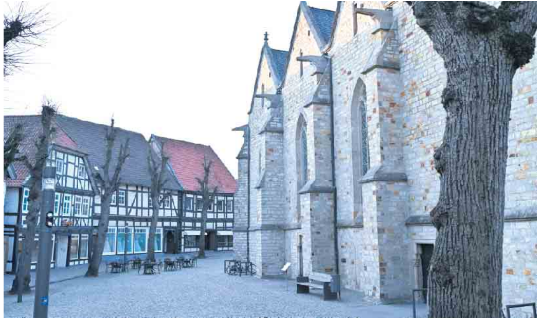
Pfarrkirche St. Johannes Baptist mit Vorplatz in Delbrück.

Medebach/Hallenberg: Gemeinsam wollen wir zum Delbrücker Kreuz unterwegs sein und eine Heilige Messe am Kreuz halten. Die Reliquie des Heiligen Kreuzes erfährt hier seit mehr als 500 Jahren große Verehrung. Anschließend besuchen wir in diesem Jahr die dortige Ausstellung zum Turiner Grabtuch in der St. Johannes-Kirche mit einer Führung. Wir starten mit dem Bus ab der Pfarrkirche St. Peter und Paul Medebach am Donnerstag, 19. März, um 15:30 Uhr und fahren direkt nach Delbrück. Im Anschluss an den Besuch laden wir zu einem kleinen Snack ein, bevor es mit dem Bus wieder nach Hause geht. Kostenbeitrag für die Busreise 20 Euro pro Person. Weitere Informationen unter www.prmh.de . Herzliche Einladung zur Wallfahrt nach Delbrück.