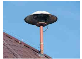
Am 12. März ist landesweiter Warntag.

Der Funktionalität von Cell Broadcast kommt aufgrund der besonderen Bedeutung im Warnmittelmix eine grundlegende Funktion zu. Die Smartphone-Einstellung und die technischen Voraussetzungen zum Empfang der Warnmeldungen können Sie auf der Internetseite des Bundesamtes für Bevölkerungsschutz und Katastrophenhilfe (BBK) nachlesen: www.bbk.bund.de/DE/Warnung-Vorsorge/Warnung-in-Deutschland/So-