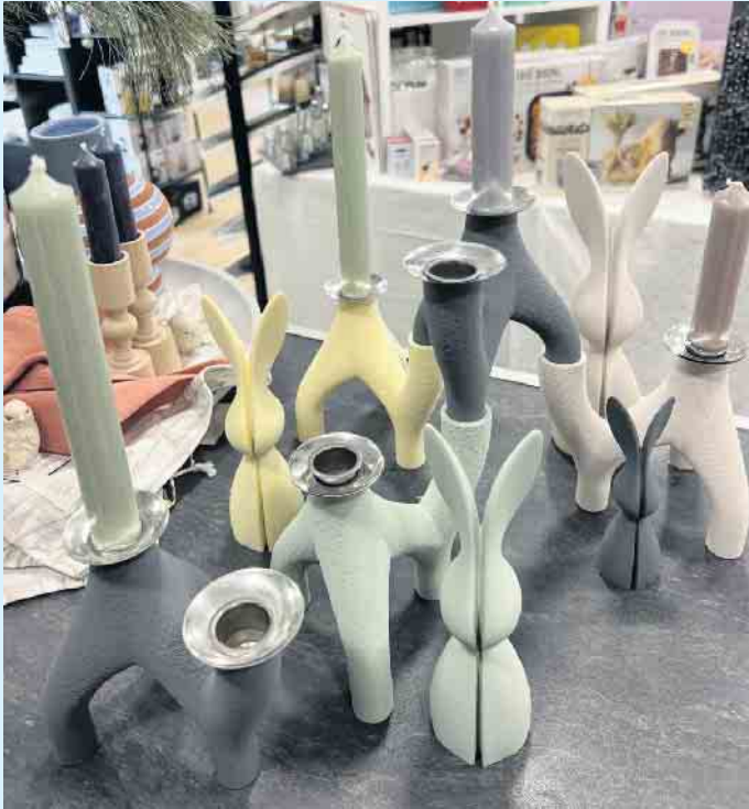
Kerzenständer und Osterhasen von nevalu aus recycelten Materialien bei „Tischlein deck dich“

Als nachhaltiges Start-Up-Unternehmen aus dem schönen Müns-terland entwickelt nevalu stilvolle Designobjekte für eine angenehme Wohnatmosphäre aus recyclingfähigen Materialien. „Nevalu“ steht dabei für „New Value“ und bedeutet so viel wie neuer Wert, denn dieses Unternehmen haucht recycelten Materialien ein zweites Leben ein- und was für ein schönes!- Anstatt Kunststoff als Wegwerfprodukt zu sehen, wird er somit als eine wertvolle und bleibende Ressource wiederverwendet. Ziel dabei ist es, zukünftig eine Welt zu schaffen, in der Ressourcen effizient genutzt werden und hochwertige Produkte wieder wie früher, die Norm sind. Auch das „Tischlein deck dich“ Am Waltenberg 40, in Winterberg unterstreicht dieses Vorhaben und bietet neu im Sortiment futuristische und stylisch zugleich aussehende Kerzenständer dieser Serie an. Das besondere dabei ist sie sind beliebig erweiterbar: Ei-