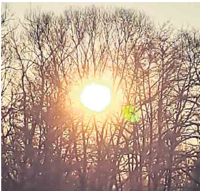
Sonnenaufgang von Hallenberg in Richtung Bromskirchen.

Bildungsgänge, Abschlüsse, Arbeitsmethoden, außerschulische Veranstaltungen und vieles mehr. Darüber hinaus unterstützt das Schulbüro während seiner Öffnungszeiten gerne bei der Anmeldung.