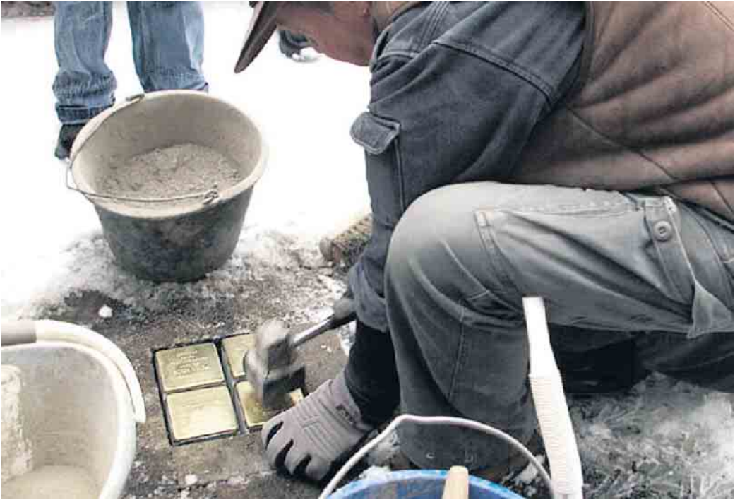
Günter Demnig bei der Verlegung von Stolpersteinen.