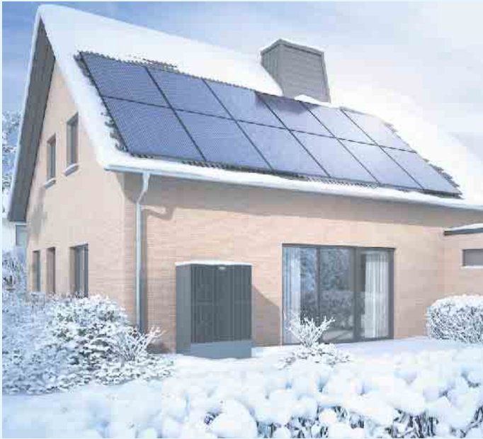
Wohnen auf dem neusten Stand: Einfamilienhaus mit Wärmepumpe und PV-Anlage

Komplettlösungen vom Meisterbetrieb Menke aus Winterberg-Siedlinghausen