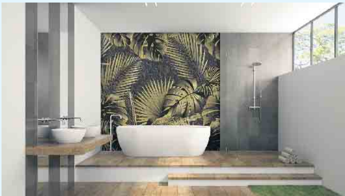
Florale Muster dank Motivtapeten auch für Bäder

komplett. Ihr Malerbetrieb Schnorbus berät Sie gerne zu Ihrer individuellen, motivreichen und gleichzeitig fugenlosen Wandgestaltung in Ihrem Bad. [BL]