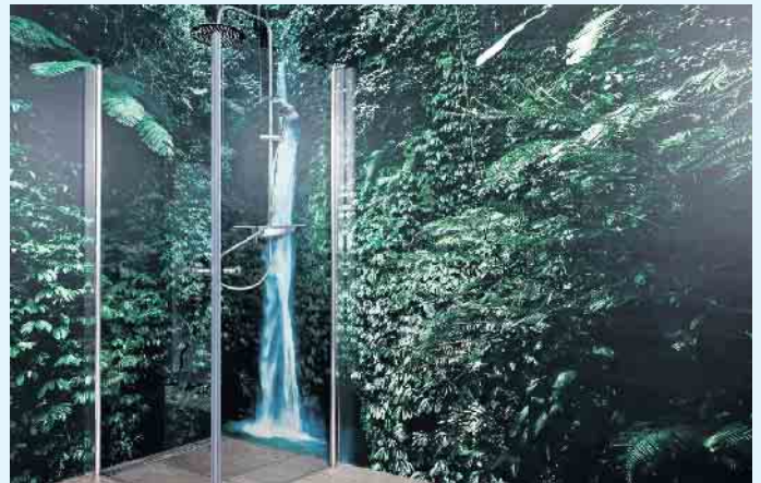
Dschungelfeeling auch in Nassräumen mit Motivtapete