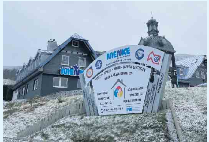
Der Meisterbetrieb Menke in Winterberg-Siedlinghausen

verfügbar zu machen, nutzen Wärmepumpen elektrische Energie. Durch die Kombination mit einer Photovoltaikanlage lässt sich ein