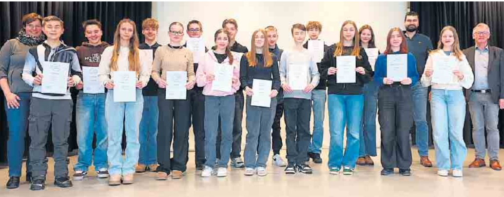
20 Schülerinnen und Schüler der Sekundarschule Medebach-Winterberg erhielten jetzt für ihre erfolgreiche Teilnahme am Projekt „Unternehmen vor Ort“ das Zertifikat von der Wirtschaftsförderung Winterberg.

Wirtschaftsförderung Winterberg übergibt „UvO“-Zertifikate an 20 teilnehmende Sekundarschüler / Stärkung der heimischen Wirtschaft