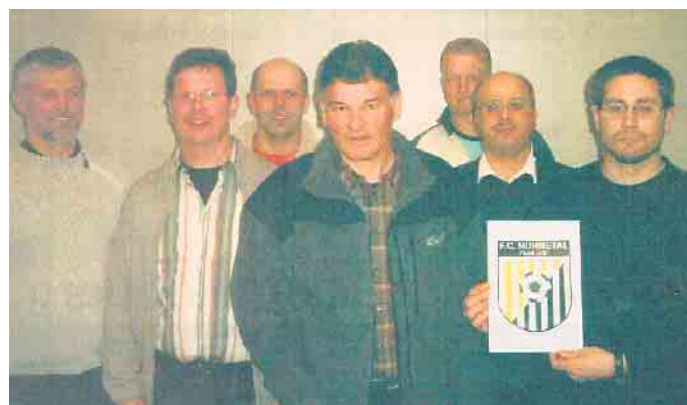
Vorstand mit neuem Wappen

Neu gewappnet kann der FC Nuhnetal in die nächste Saison starten. Das neue schwarz-weiß-gelbe Wappen mit dem Fußballmotiv in der Mitte wurde auf der Generalversammlung vorgestellt