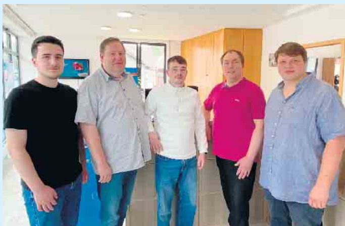
Das Team von „Sauerland Promotion“ aus Winterberg-Züschen

Das junge, dynamische Team von „Sauerland Promotion“ befindet sich seit über einem halben Jahr in der ehemaligen Sparkassen-Filiale in Winterberg-Züschen und hat seitdem die bereits vielfältigen Dienstleistungen stetig erweitert, so auch in Züschen um den Bereich der Appartement- und Ferienhaus-Services, die u.a. auch die Schlüsselübergabe & -aufbewahrung für Ihre Gäste durch eine sichere Verwahrung in einem modernen Schlüsselsafe-System mit flexibler 24/7-Schlüsselausgabe beinhaltet. Stets persönlich und rund um die Uhr, angepasst an die Bedürfnisse Ihrer Gäste. Das geprüfte und zuverlässige Schlüsselsystem verspricht höchste Sicherheit. Der Reinigungsservice umfasst eine professionelle Endreinigung nach der Abreise der Gäste und regelmäßige Zwischenreinigungen auf Wunsch des Gastes. Gründliche Desinfektion und Pflege