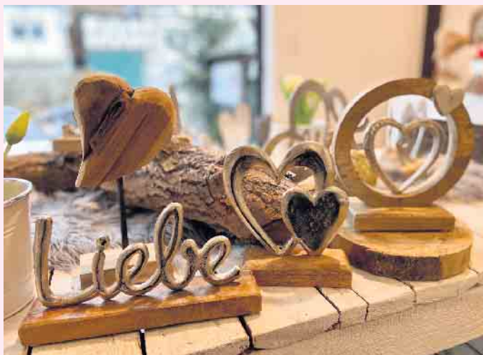
Stylische Dekorationen von Blumen Klauke zaubern Liebe ins Haus

Schließlich zählen Blumen zu den Klassikern unter den Geschenken zum Tag der Verliebten.