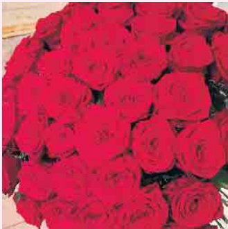
Das höchste der Gefühle zum Valentinstag: Ein klassischer Strauß roter Rosen

Zum Valentinstag am 14. Februar sind Sie bei Blumen Klauke aus Züschen an der richtigen Adresse, denn ein kreativer, liebevoll zusammengestellter Blumenstrauß läßt das Herz der Liebsten garantiert höher schlagen. Schließlich zählen Blumen zu den Klassikern unter den Geschenken zum Tag der Verliebten. Den Klassiker dabei bilden rote Rosen als Symbol für Liebe und Zuneigung. Blumen Klauke hat am diesjährigen Valentinstag-Mittwoch an den regulären Öffnungszeiten vormittags von 9.00 bis 12.30 Uhr und nachmittags von 14.30 bis 18.00 Uhr für Sie geöffnet. [BL]