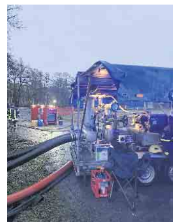
Hochleistungspumpen im Einsatz

Gebäude wieder an das Stromnetz angebunden werden. Am Heiligabend entspannte sich die Lage und es begannen die Aufräumarbeiten. Die Pegelstände sind gesunken und die überschwemmten Bereiche sind weitestgehend frei von Hochwasser. Es waren in Oberschledorn 40 Feuerwehrkräfte im Einsatz. Unterstützt durch HFS, THW, freiwillige Helfer aus dem Ort sowie das DRK die für die Verpflegung sorgten. Auch in Medebach und in den Ortsteilen Medelon, Referinghausen und Dreislar wurde wegen Sturmschäden und Hochwassers alarmiert. Insgesamt waren im Zusammenhang mit der Großschadenlage 111 Einsatzkräfte von Feuerwehr, DRK und THW im Einsatz.