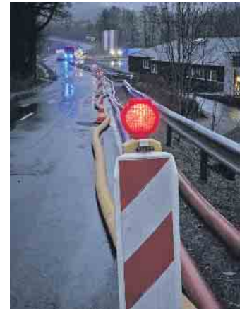
„Bypass“ Wilde Aar

der Feuerwehr gerettet. Für betroffene Anwohner wurde im Feuerwehrhaus Oberschledorn und in Medebach die Möglichkeit geboten, warme Getränke und Speisen zu sich zu nehmen und sich aufzuwärmen. Wegen der Großschadenlage wurde der SAE (Stab für aussergewöhnliche Ereignisse) einberufen, bestehend aus Wehrleitung, Bürgermeister Thomas Grosche, Ordnungsamt, Wasserwerk und Kreisbrandmeister Uwe Schwarz. Diese machten sich noch am Abend ein Bild von der Lage vor Ort. Durch den Einsatz einer Hochleistungspumpe HFS (Hytrans Fire System), welche ca. 8.000 Liter pro Minute fördert und auf 800 Meter Länge als sogenannten Bypass die „Wilde Aar“ entlastet hat, konnten die Pegelstände gesenkt werden. Noch vor Mitternacht wurde das THW Korbach alarmiert, um die Einheiten vor Ort zu unterstützen. Die Pumpen liefen die ganze Nacht hindurch. Am frühen Morgen verschaffte sich Bürgermeister Thomas Grosche zusammen mit den Leitern der Feuerwehr erneut einen Überblick der Situation. Gegen 3 Uhr konnten die