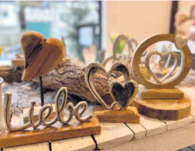
Liebevolle Holzdekorationen zum Valentinstag von Blumen Klauke