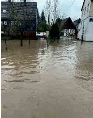
Ortsmitte Oberschledorn ist geflutet.

Überflutete Straßen und vollgelaufene Keller