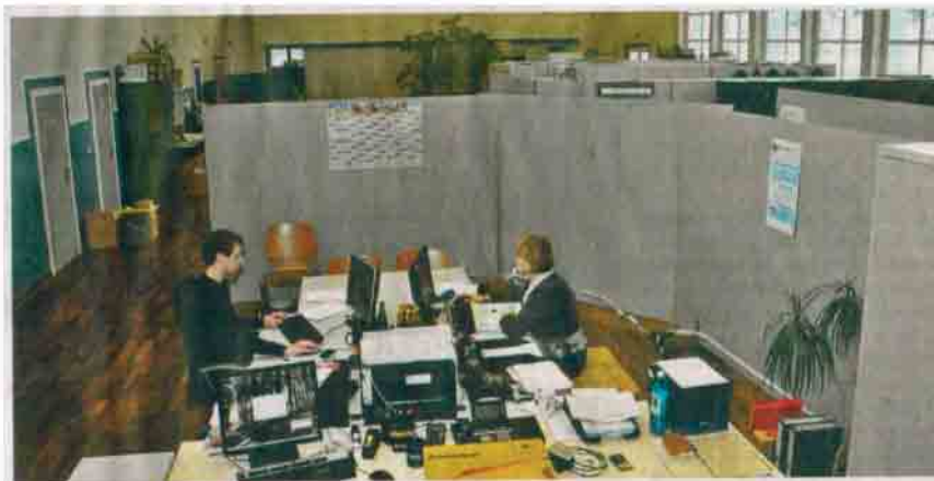
Die Stadtverwaltung ist in die Stadthalle umgezogen. Die dort geplanten Veranstaltungen werden in den Kump oder in die Schützenhalle verlegt.