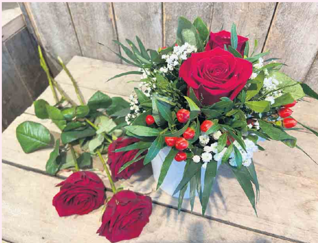
Liebevolle Dekorationen bei Gartenbau Klauke

Blumen Klauke hat am diesjährigen Valentinstag-Dienstag vormittags von 9.00 bis 12.30 Uhr und nachmittags von 14.30 bis 18.00 Uhr für Sie geöffnet. [BL]