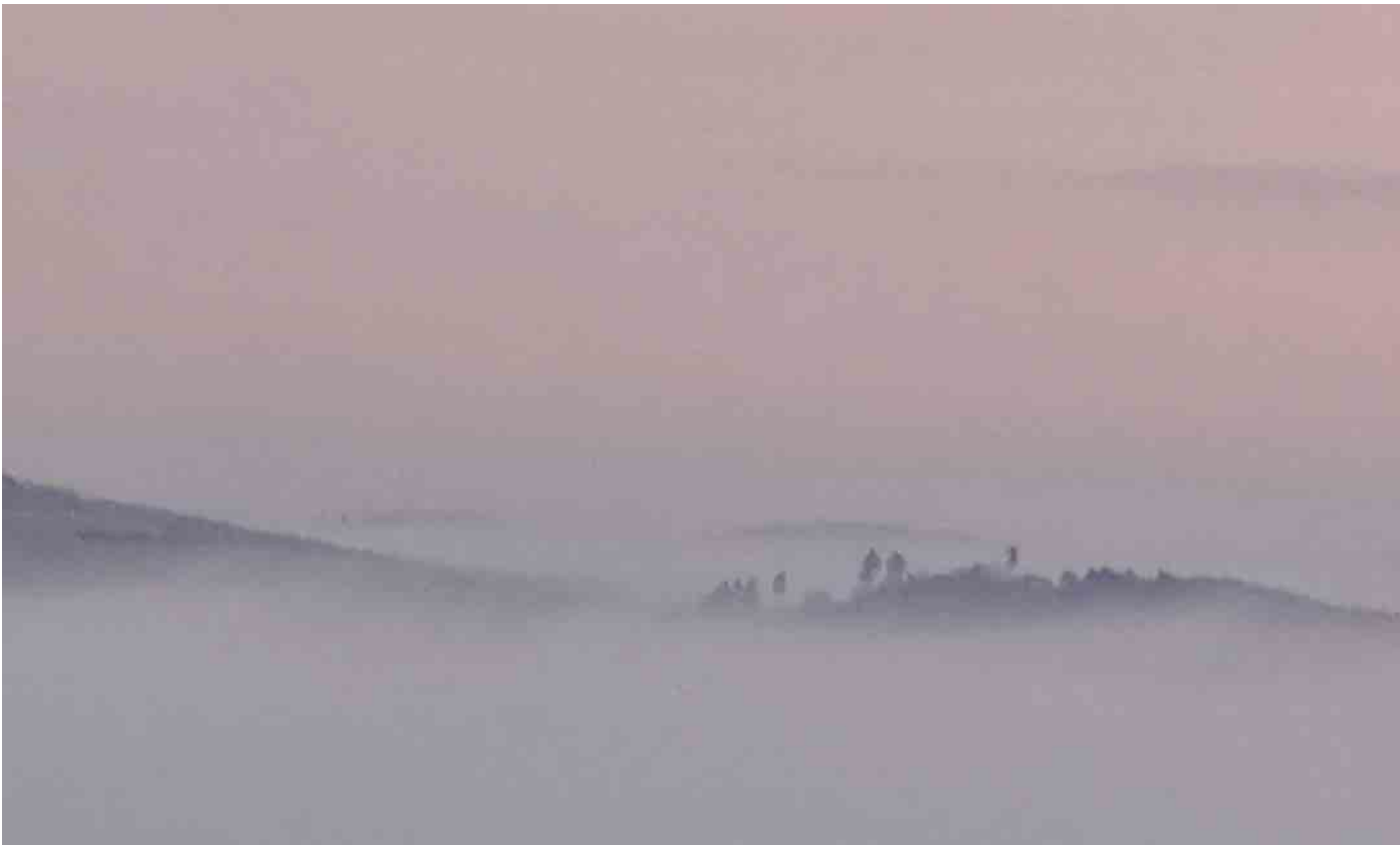
Mystischer Nebel über Hallenberg von Silke Watzlawik aus Bromskirchen