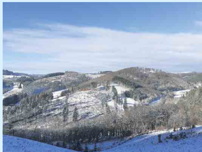
Ausblick im Winter