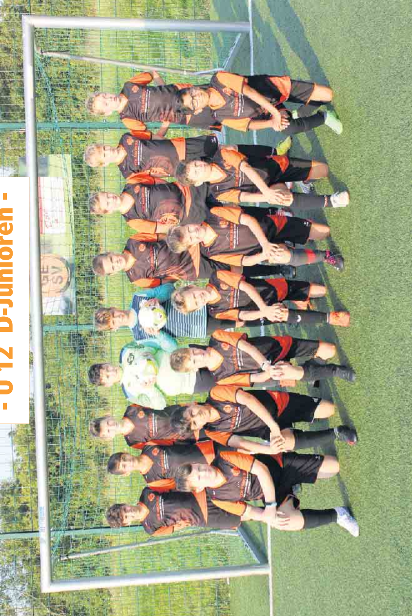
Jugend Förderverein (JVF) Meiersheide - Winterscheid