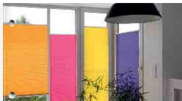
MHZ und Teba

Anfragen und Termine vereinbaren wir gerne auch per WhatsApp unter 01512 - 2734363