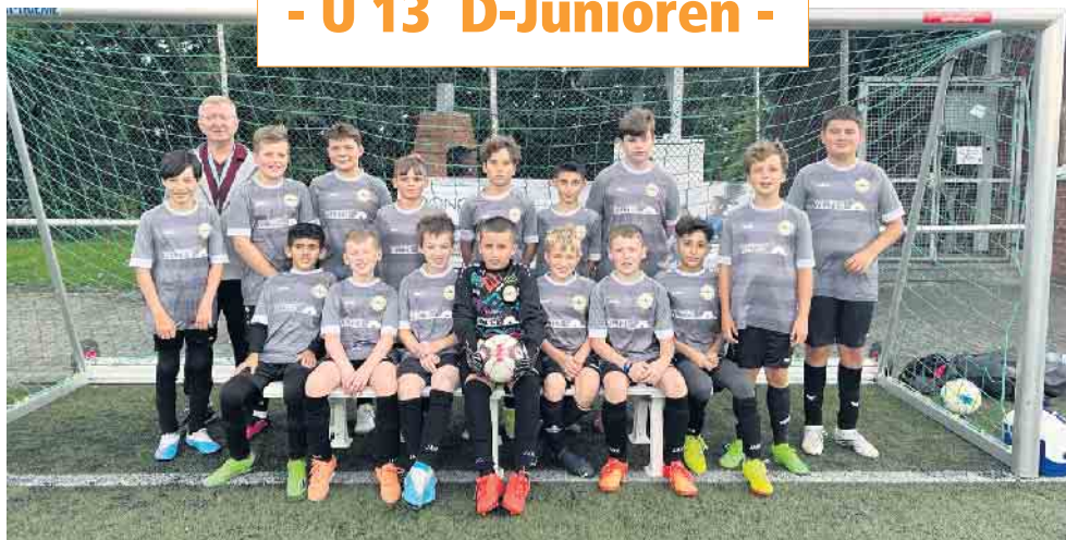
Jugend Förderverein (JFV) Meiersheide - Winterscheid