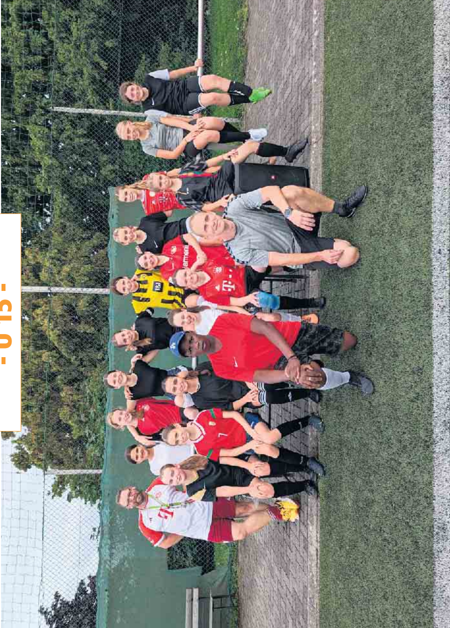
Spielgemeinschaft GESV - TuS Winterscheid mit Verstärkung durch den SV Allner-Bödingen