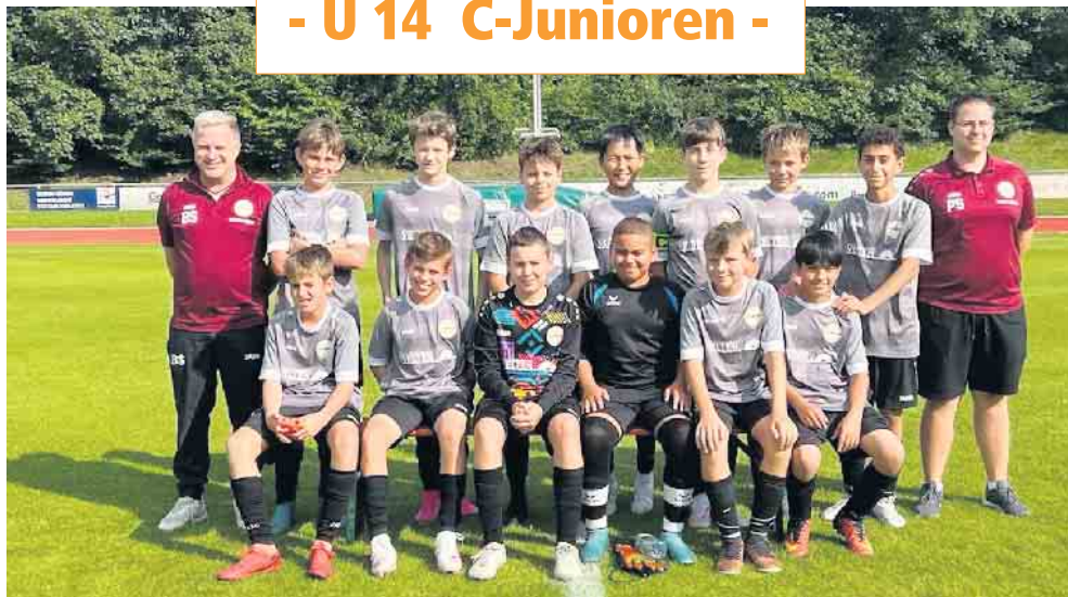
Jugend Förderverein (JFV) Meiersheide - Winterscheid