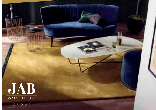
Teppiche und Teppichböden

Aufmaß, Beratung und Montage vom Fachmann