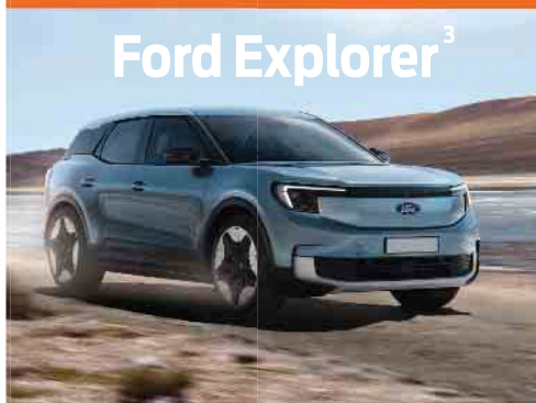
Ford Explorer 3