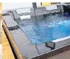
Whirlpools & Swim Spas

ACR Living GmbH Reisertstraße 2 53773 Hennef Tel.: 02242 91441-44 E-Mail: info@acrliving.de