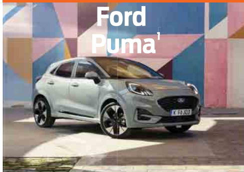
Ford Puma 1