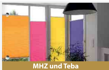
MHZ und Teba

Anfragen und Termine vereinbaren wir gerne auch per WhatsApp unter 01512 - 2734363