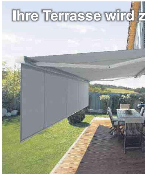
Ihre Terrasse wird z