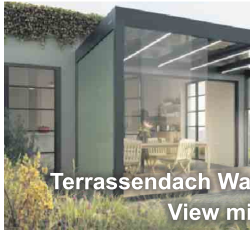
Terrassendach Wa View mi