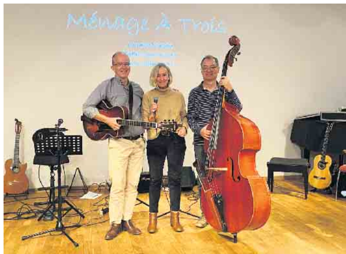
Spezialisiert auf Chansons: Menage á trois zu Gast im Kulturzentrum

Am Sonntag 10. November gibt es Gypsy-Jazz mit Les Ducs - Französisch für Die Herzöge - der Pumpe? „Les Ducs de la Pompe“ sind sozusagen die „Sultans of Swing“ übersetzt in den Gypsy-Jazz. „La Pompe“ ist der Rhythmus-Schlag, der bei Stücken wie „Minor Swing“ oder „Artillerie Lourde“ den typischen Gypsy-Sound gibt. Zudem spielen sie Schlager wie „Sweet Sue“ oder „Hallo Kleines