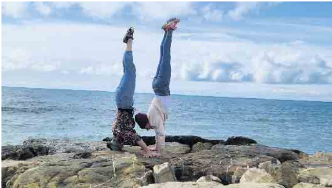
Der Kopfstand funktioniert nicht nur auf dem Kunstrad

ten Teams schaffen sie den bislang größten Erfolg und erringen den Deutschen Meistertitel. Ein Titel, der über die Saison gesehen hochverdient ist, der aber am Tag der Meisterschaft kaum noch erreichbar schien. Bereits kurze Zeit später dann der Start bei der Weltmeisterschaft in Bremen. Es ist der Höhepunkt einer äußerst ereignis- und erfolgreichen Saison 2024. Und auch diese Her-