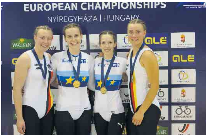
Silbermedaille bei der EM in Ungarn

ausforderung meisterten die Spitzensportlerinnen bravourös (siehe dazu gesonderten Bericht...) Viel Zeit zum Feiern und Ausruhen blieb ihnen nicht. Bereits eine Woche später folgte am 2 November zum Saisonabschluss das Finale des Weltcups in Oberbüren in der Schweiz. Auch diesen Wettkampf gewannen sie mit einer sehr schön gefahrenen Kür und 143,52 Punk-