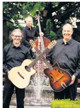
Gypsy Jazz und mehr mit „Les Ducs de la Pompe“ im Kulturzentrum