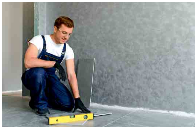
In der SHK-Branche eröffnen sich für Einsteiger und Aufsteiger ausgezeichnete Berufsperspektiven.

derlich, um den Kunden eine optimale Lebensqualität zu bieten. (DJD)