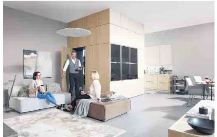
Eine begehbare Vorratskammer als repräsentatives Raum-in-Raum-Konzept und Verbindung zwischen Kochen, Essen & Entspannen. Der Innenraum des Kubus lässt sich individuell mit Schränken, Auszügen, Schubfächern und Regalen ausstatten - z. B. zum Lagern edler Spirituosen.

wie das Bevorraten leckerer Lebensmittel und Getränke, Kochen, Essen, Wohnen und Leben. Genuss, Austausch, Kommunikation und Geselligkeit. Neuerdings für viele Berufstätige auch ein regelmäßiges Arbeiten von zuhause aus. „Gleichzeitig stellen wir auch eine zunehmende Nachfrage nach einem schnell und direkt zugänglichen, jedoch unsichtbar integrierten Hauswirtschaftsbereich oder zusätzlichen Vorratsraum fest“, so Volker Irlé. In einer Küche ist jedes noch so kleine Detail perfekt durchdacht und hoch funktional. So auch bei den neuen, intelligenten Türsystemen und Beschlägen, die optisch wie funktional vielfältige Aufgaben übernehmen und jedem Grundriss und Käuferanspruch gerecht werden: Angefangen bei traditionellen Schranktüren bis hin zu Sonderausführungen wie den neuen Durchgangstüren,