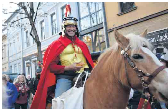
Höhepunkt des Martinsmarkts: Sankt Martin reitet durch Endenich.

mit „Knack die Nuss“. Beim Entenangeln und Dosenwerfen können die Kids ihre Geschicklichkeit unter Beweis stellen, auf einem Karussell und einer nostalgischen Eisenbahn