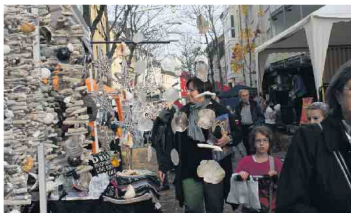
Belebte Straßen beim Endenicher Martinsmarkt.

braucht an diesen Tagen kein Besucher selbst, es gibt eine tolle Auswahl an „Essen to go“ in internationaler Vielfalt. Neben rheinischen Spezialitäten wie Reibekuchen versprechen Produkte aus der thailändischen, afrikanischen und polnischen Küche ganz neue aufregende Geschmackserlebnisse. Attraktive Gewinne warten beim traditionellen Stand der Trini-Kids