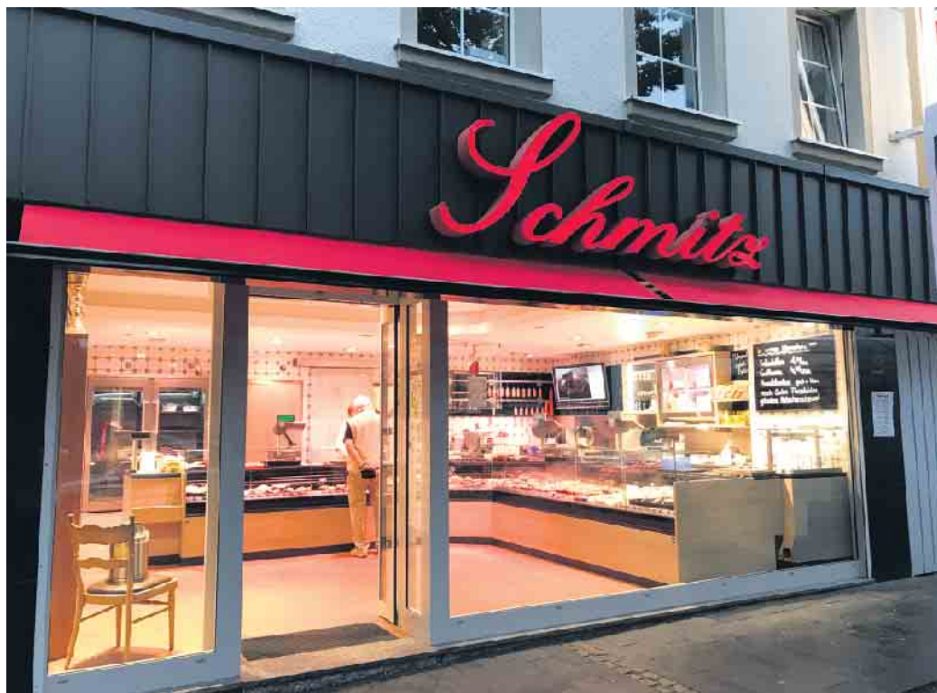
So präsentiert sich die Metzgerei Schmitz heute nach Umbau und Modernisierung

Hier erhält man im wahrsten Sinne des Wortes „Hausgemachtes“. Der größte Teil der Waren wird noch selbst produziert. Qualität ist keine Floskel, sondern Überzeugung. So ergibt sich bei Fleisch- und Wurstwaren eine fein abgestimmte Mischung aus Bodenständigkeit und Probiervfreude, Tradition und Innovation. Qualität eben, die man schmeckt. Das Fleisch stammt