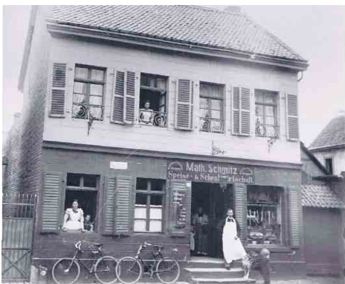
Die Metzgerei Schmitz im Jahr 1908

pflegen ohne sich neuen Produktionstechniken und Herstellungsweisen zu verschließen „Diese Metzgerei gehört zu den besten in Deutschland“ urteilte auch die Zeitschrift „Feinschmecker“. Ein Urteil, dem sich viele zufriedene Kunden anschließen. CSH