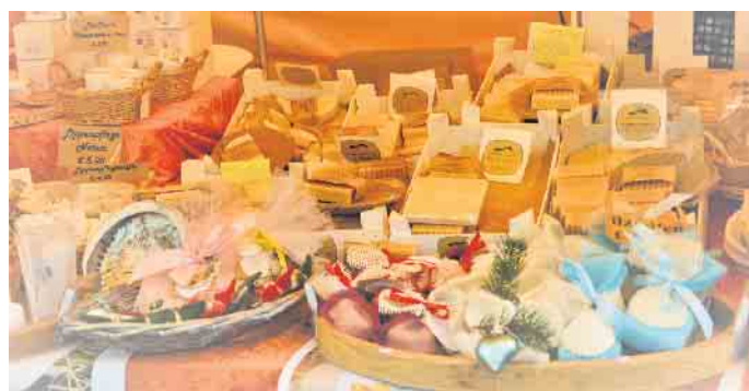
Hier duftet es himmlisch: Seifenstand beim Martinsmarkt

Diese putzige Eisenbahn wird auf dem Martinsmarkt ihre Runden drehen