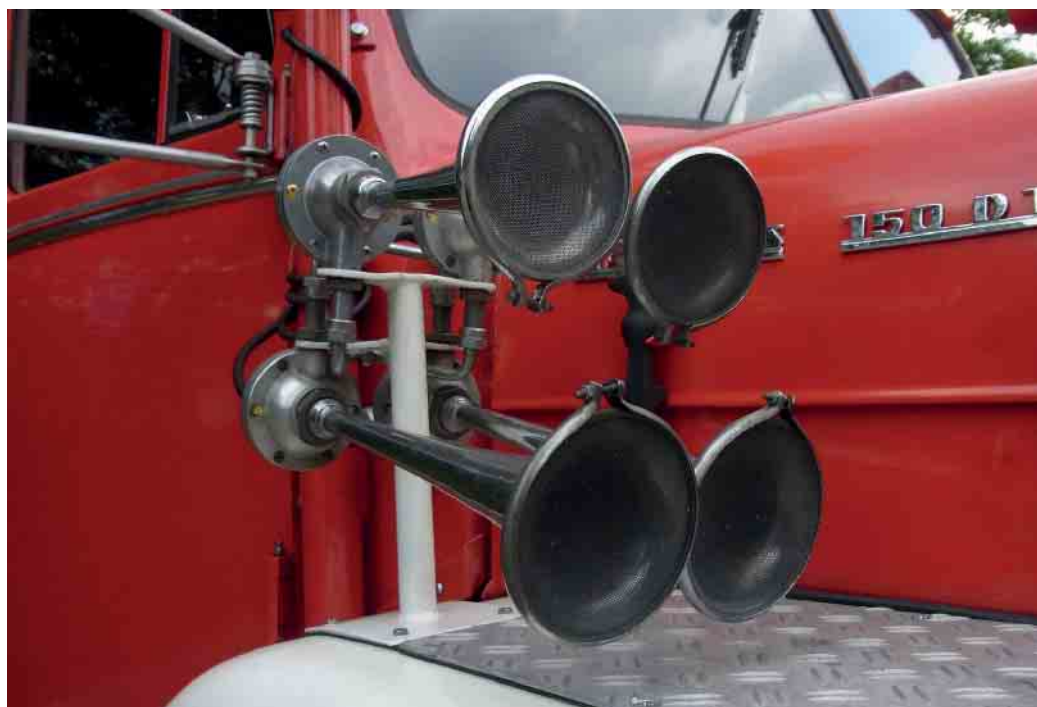
In Deutschland sind kreative Installationen von Schallerzeugern am Privatfahrzeug verboten.

den Pokal oder der Neffe hat gerade geheiratet? Autokorsos mit wiederholtem Hupen sind rechtlich Lärmbelästigung und damit ebenfalls nicht erlaubt, oft wird aber ein Auge zugeknippt. Wer es übertreibt, kann dennoch ein Bußgeld erhalten. Übrigens: Auch ein unerlaubtes oder mangelhaftes Schallzeichen, wie eine Melodie als Hupsignal, kann ein Bußgeld in Höhe von 15 Euro nach sich ziehen. Die Hupe muss ein akustisches Signal mit gleichbleibender Grundfrequenz erzeugen. Ausgenommen von dieser Regel sind Fahrzeuge mit Blaulicht, wie Polizei- und Feuerwehrautos. (mid/ak-o)