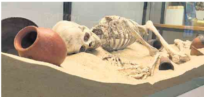
Ägyptisches Halloween im Museum Bonn

genommen werden können. Das Programm findet einmal für jüngere (6 bis 8 Jahre) von 15 bis 17 Uhr und einmal für ältere Kinder (9 bis 12 Jahre) 18 bis 20 Uhr statt. Die Kosten für die Teilnahme belaufen sich auf 10 Euro pro Kind. Bei Interesse schicken Sie uns gerne Ihre Anmeldung bis zum 24. Oktober per Email an aegyptisches-museum@uni-bonn.de oder telefonisch unter 0228/73 97 17. Wir freuen uns auf Ihren Besuch!