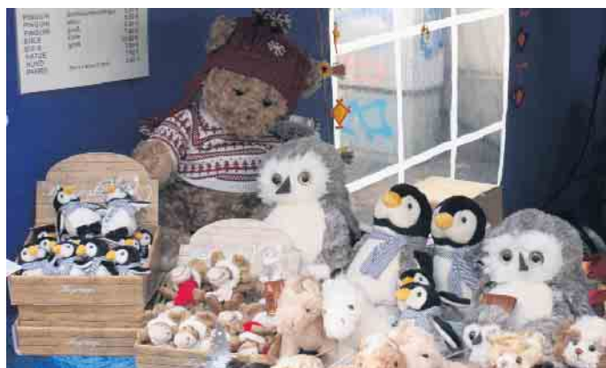
Hier finden sich viele schöne Geschenkideen