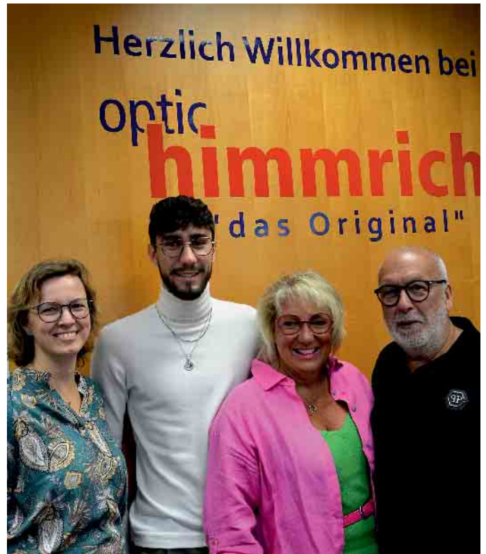
Experten für individuell bestes Sehen: das Team von Optic Himmrich

Lesebrille. Doch um eine Brille zu haben, die den ganzen Tag auf der Nase bleiben kann, kommt man um eine Gleitsichtbrille nicht herum. Viele Fehlsichtige schieben den Schritt lange hinaus, weil sie sich vor „Horrorstories“ aus dem Bekanntenkreis fürchten. Gewöhnungsschwierigkeiten, Schwindel, etc. kommen meist nur vor, wenn die Brille nicht richtig vom Optiker angepasst ist. Sollte es trotzdem Probleme geben, haben Sie bei Rodenstock Optikern eine Zufriedenheitsgarantie. Das bedeutet: Sollten Kunden innerhalb der ersten 6 Monate nicht zufrieden sein, ersetzt Rodenstock die Brillengläser durch ein anderes Produkt mit denselben Korrektionswerten.