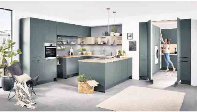
Neue Möglichkeiten bei der Raumplanung: Einladende U-förmig angeordnete Wohnküche mit einer praktischen Durchgangstür in Schrankoptik, durch die man in den angeschlossenen und diskret verborgenen Hauswirtschaftsraum gelangt - das Ganze in Kombination mit zwei Hochschränken.

Stilmittel zur Strukturierung und Neugestaltung von Räumen, um dort verschiedene Lebens-, Wohn- und Arbeitsbereiche geschickt voneinander abzugrenzen. Auch, um sie auf Wunsch sogar gänzlich unsichtbar zu machen - auf eine geradezu geniale Weise. Ein Beispiel hierfür sind die neuen Durchgangstüren - als verbindendes Element zwischen zwei Räumen oder für Raum-in-Raum-Konzepte. Kombiniert mit Hochschränken ergeben sich ganz neue Planungsoptionen. Zudem ermöglichen diese Durchgangstüren direkte, kurze Wege von der Wohnküche in angrenzende, verwandte Bereiche wie einen verborgenen Hauswirtschaftsraum, Vorrats- & Abstellraum oder Homeoffice-Bereich. Das Raffinierte dabei: Die Durchgangstüren, ob mit oder ohne Griff, sind als solche absolut nicht zu erkennen, da sie in dergleichen Frontausführung wie die Hochschränke in der Wohnküche sind plus einem farblich angepassten Sockel. Bei grifflosen Planungen öffnen und schließen sie sich geräuschlos mithilfe einer Öffnungsunterstützung und integrierten Dämpfung. Schiebetür- bzw. Gleittürsysteme bieten interessante Alternativen. Beim Öffnen verschwinden sie entweder platzsparend in der Wand oder gleiten dank eines dezenten Schienensystems schwebelicht daran entlang. Insbesondere kleine Räume profitieren von solchen Lösungen, da keine Grundfläche für aufschwingende Türen freigehalten werden muss. Oder wenn z. B. ein separater Homeoffice- oder Laundry-Bereich in einer Ecke oder Nische in die Wohnküche integriert werden