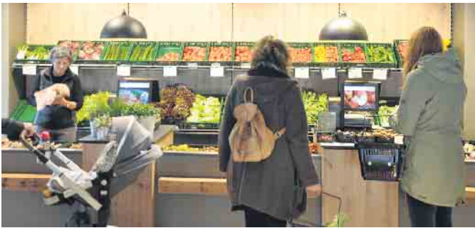
Die Frischetheke lockt mit frischen und aktuellen Obst- und Gemüseangeboten.