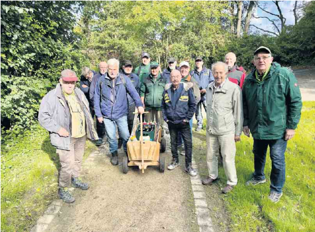
Waldfreunde und Stiefelclub auf Bosseltour