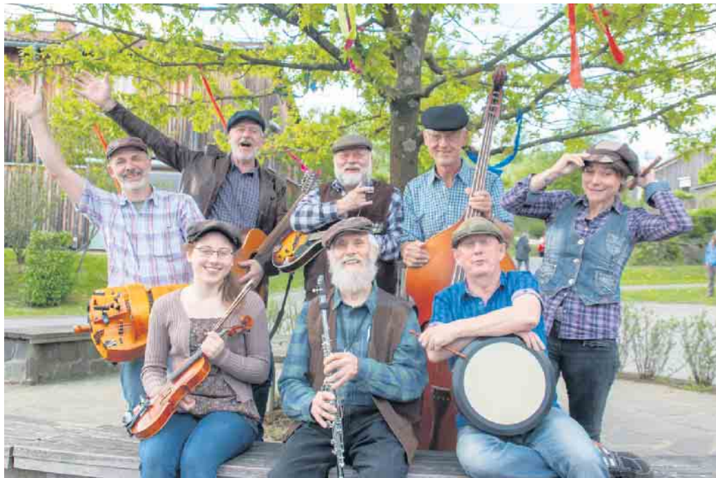
Präsentieren fast vergessene Lieder: die Zaitenpfeiffer zu Gast im Kulturzentrum

Besondere Markenzeichen der Gruppe sind Spielfreude und Lieder mit besonders griffigen Texten, die den Folk-Sessions der Band eine besondere Note und zusätzliche Würze geben. Ein zentrales Anliegen der Gruppe dabei ist die Interaktion mit dem Publikum: Mitsingen und Mitmachen ist bei den „Zaiten-Pfeiffern“ nicht nur erwünscht, sondern fester Programmpunkt eines jeden Auftritts.“