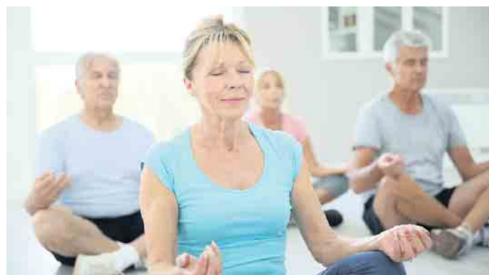
Wer regelmäßig meditiert, ist gelassener, konzentrierter und selbstbe- wusster.

Beruflich und privat verbringen wir zunehmend mehr Zeit vor dem Bild- schirm. Das führt bei immer mehr Menschen zu digitaler Müdigkeit, vor allem Personen zwischen Mitte 20 und Mitte 30 sind laut einer Studie der Hans-Böckler-Stiftung deswegen häufig erschöpft. Einge- schränkte Bildschirmzeiten, Wald- spaziergänge und analoge Hobbys können im Alltag helfen. Für einen richtigen Digital Detox braucht es mehr: ein paar Tage ohne Internet, Fernseher und Radio. Das ist beispielsweise im Samariter-Fasten- zentrum im Münsterland möglich. „Bei uns geht es darum, wieder zu sich selbst zu kommen“, sagt Kis- ters. Der Verzicht helfe, jeden kör- perlichen und seelischen Ballast abzuwerfen und neue Kraft zu fin- den. (DJD)