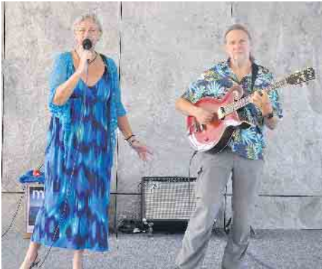
Musikalisch umrahmte das Duo meoneo die Zertifikats-Verleihung.