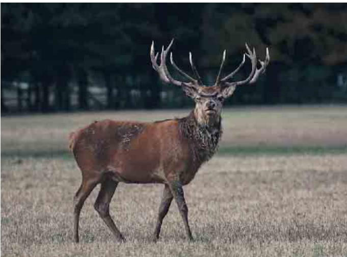
Autofahrer müssen an Straßen, die an Wäldern und Feldern vorbeiführen, immer damit rechnen, dass Wildtiere die Straße queren.

Im Herbst werden die Tage wieder kürzer und es dämmt früher. Gerade in der Dämmerung passieren viele Wildunfälle. Damit steigt die Unfallgefahr auf Straßen, die an Wäldern oder Feldern vorbeiführen. Mit vorausschauender Fahrweise lassen sich Unfälle häufig vermeiden. Konkret heißt das, die Straßenränder im Auge behalten und immer bremsbereit sein. Oft taucht das Wild in kurzen Entfernungen und nicht einzeln sondern in Rudeln auf. Schnelfahrer haben keine Chance zu bremsen. Wichtig ist auch, sofort abzublenden und zu hupen.