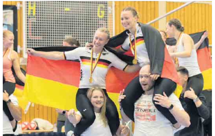
Jubel beim Team des RSF nach Gewinn der Meisterschaft