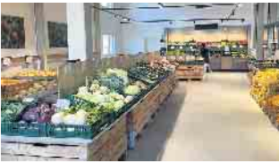
Sauber, ordentlich und übersichtlich warten die Produkte im Hofladen auf interessierte Käufer.

Hofladen des Naturhof Wolfsberg wiedereröffnet - Super Angebote auf rund 450 Quadratmeter Verkaufsfläche