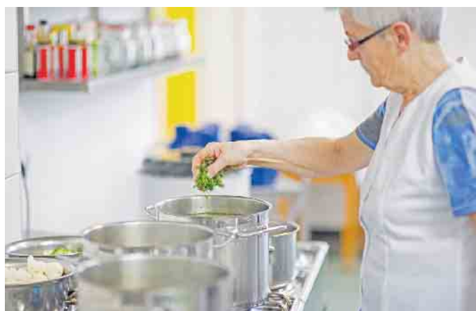
Wichtig beim Fasten: Genügend Flüssigkeit und Mineralstoffe aufnehmen. Am besten geht das mit frisch gekochter Gemüsebrühe.