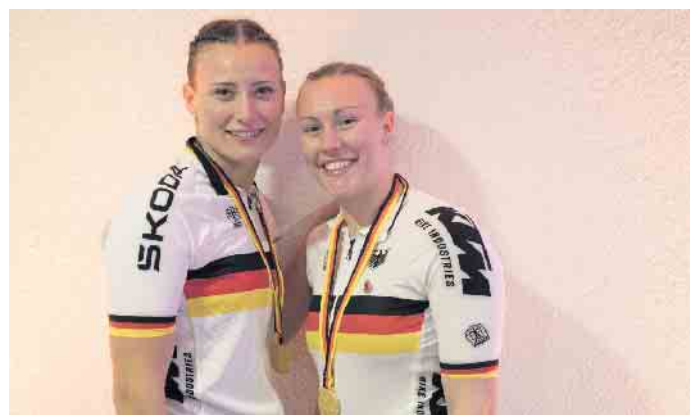
Die deutschen Meisterinnen im Zweier-Kunstradfahren