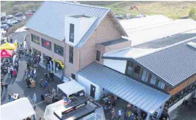
Vor morgens bis abends riss der Strom der Besucher bei der Wiederöffnung des Hofladens nicht ab.