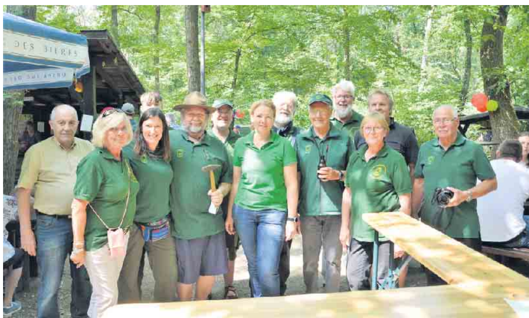
Erhalten hohe Auszeichnung für vielfältiges Engagement: Waldfreunde Duisdorf.

Auf Informationsveranstaltungen, z.B. Wanderungen und Radtouren werden interessierten Bürgerinnen und Bürgern die Umgebung näher gebracht und ein Eindruck von Aufgaben des Naturschutzes vor Ort