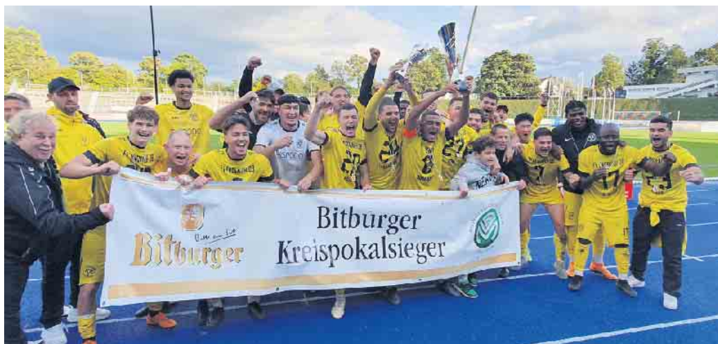
Stolze Pokalsieger: FV Eendenich 08.