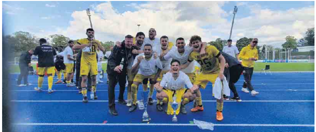
Großer Jubel beim FVE 08 nach dem Pokalgewinn.