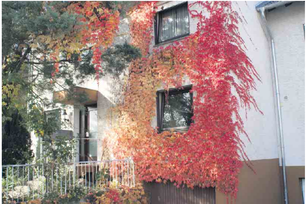
So schön leuchtet der Herbst.

Da gibt's nur eins: noch nicht an den Winter denken, sondern raus