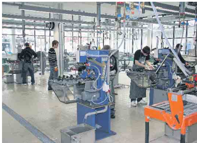
Ausbildung in der Flachglasindustrie.

greifend modernisiert und den Bedürfnissen und Anforderungen in den Betrieben angepasst, wie das des Flachglasmechanikers. Aus ihm wurde mit dem „Flachglastechnologen“ ein zukunftsweisender Beruf, der die technologische Entwicklung bezüglich Automatisierung, Vernetzung und Digitalisierung des innerbetrieblichen Material- und Warenflusses viel stärker berücksichtigt.