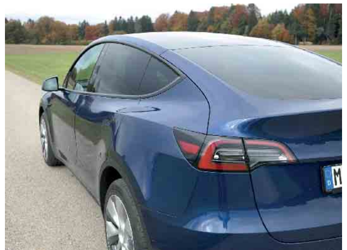
Wie weit man mit einer Akkufüllung kommt, hängt von verschiedenen Faktoren ab.

Standorten von Ladestationen planen. (mid/ak-o)