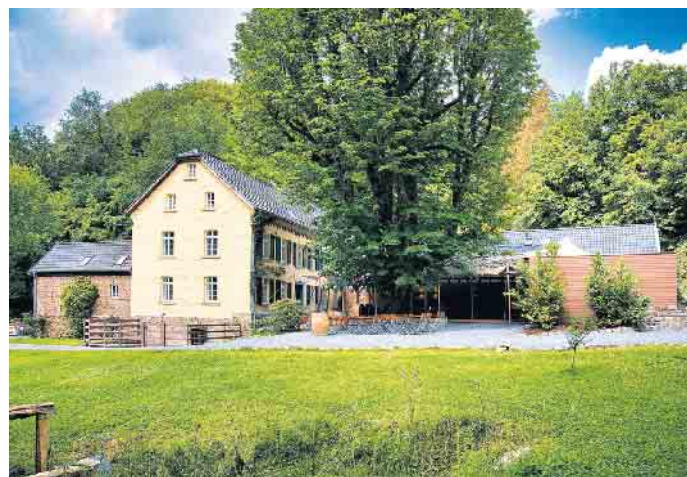
Die unter Denkmalschutz stehende Kupfersiefer Mühle bei Köln erhält eine neue Zukunft mit innovativen, kreislauffähigen Baumaterialien.