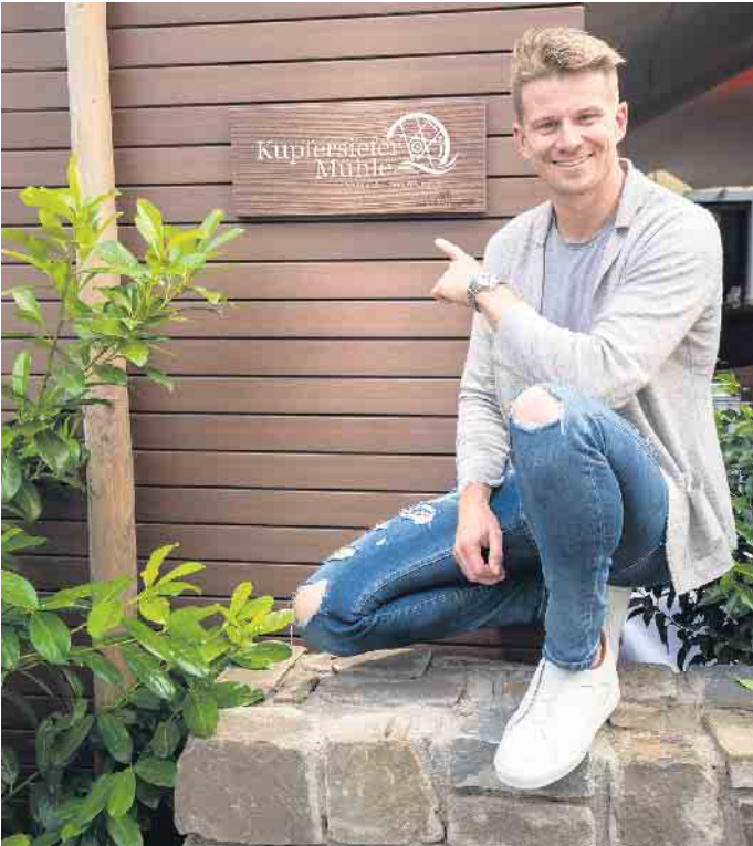
Formel-1-Rennfahrer Nico Hülkenberg hat sich auf den ersten Blick in die historische Mühle verliebt.