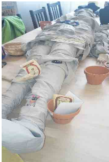
So kann dann die fertige Mumie aussehen.

In unserem Workshop werden wir das nachstellen. Beschriftete Stücke von Töpfen werden dabei aus dem Sand geborgen, zusammengefügt und die Aufschriften entschlüsselt. Hierzu machen wir vorab einen kleinen Hieroglyphen Kurs und üben auch, den eigenen Namen in Hieroglyphen zu schreiben.