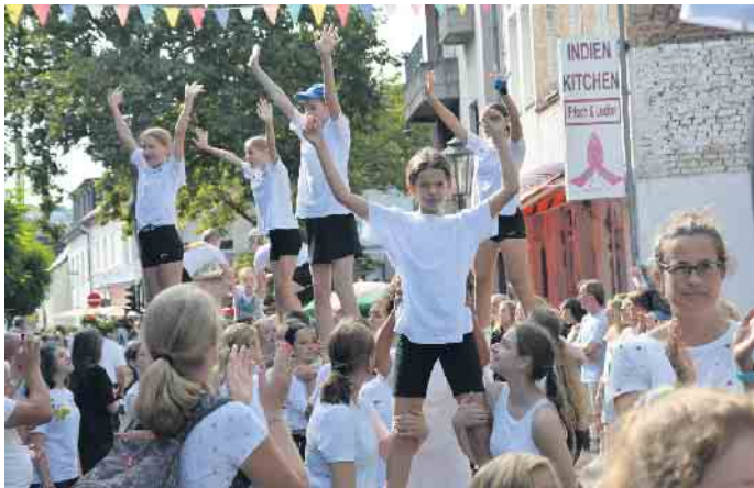
Hände zum Himmel: Cheerleader des TSV Duisdorf.