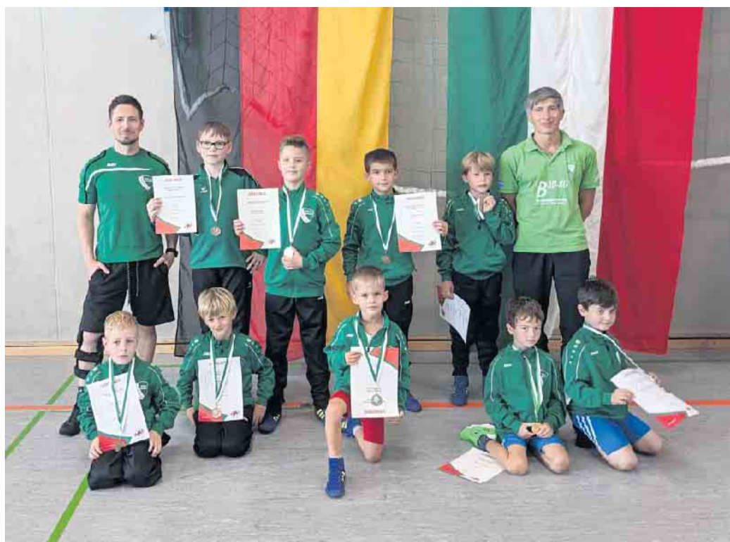
Behaupteten sich gut beim Landesturnier: die Nachwuchs-Ringer des TKSv