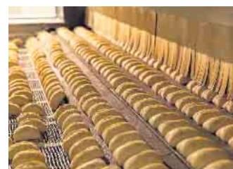
Produktion Foto: Harry-Brot GmbH

Die Führungen finden von 18 bis 23 Uhr stündlich statt und dauern jeweils 60 Minuten.