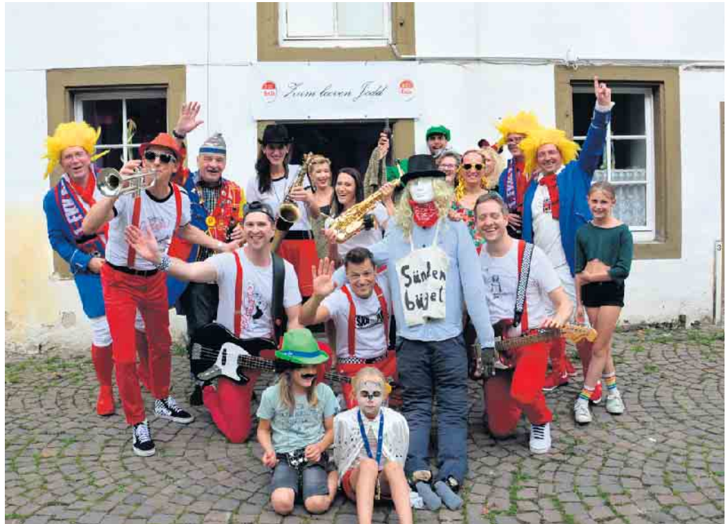
Schreiben alles dem Nubbel auf den Deckel: die Band „Jedöns“ CSH

„Kumm danz Marie“ so lautete der Sessionshit 2022/23 von Jedöns. Einem ganz anderen The-