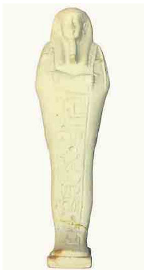
Hier ist, beispielhaft, ein Ushebti zu sehen

Viele Artefakte sind bisher nur auf Datenblätter oder Karteikarten dokumentiert. Nun werden in einer Datenbank alle Objekte mit allen dazu erstellten/ermittelten Informationen erfasst um zukünftig eine bessere Datenbasis vorzufinden. Bevor im 4. Quartal die Restauratoren vor Ort ihre Arbeit beginnen finden noch einige Workshops für Kinder und Führungen statt.