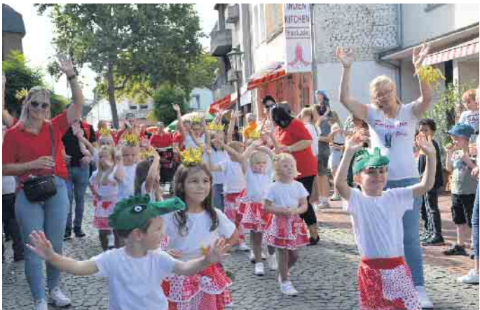
Die kleinsten Teilnehmer: Mini-Mäuse des TSV Legends of Dance.