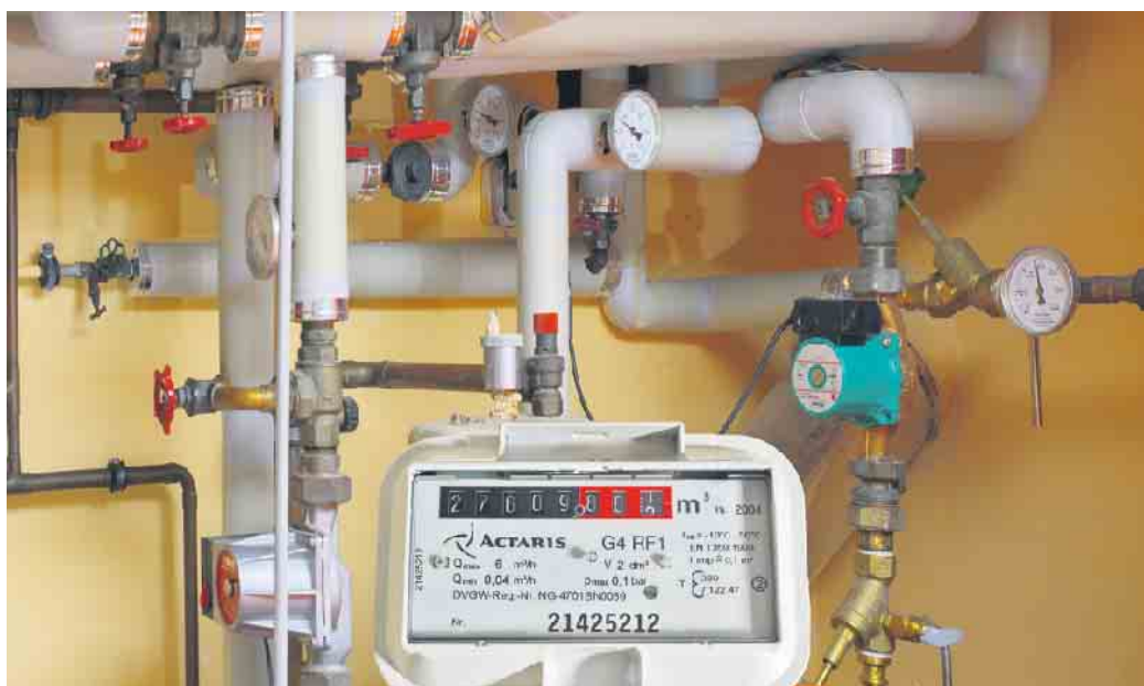
GEG und Heizungstausch.

Alternativen zur herkömmlichen Gas- und Ölheizung wie Wärmepumpe und Fernwärme werden vorgestellt, Fristen und Handlungsoptionen aufgezeigt. Klitz-