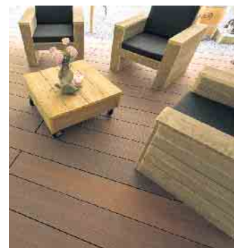
Die Terrasse der historischen Mühle hat mit dem Holzwerkstoff ein einladendes Ambiente erhalten.

Bei GCC handelt es sich um einen Werkstoff made in Germany, der gesundes Bauen über Generationen hinweg ermöglicht. Er setzt sich aus Holzfasern von Sägewerken, Recyclingmaterialien sowie umweltfreundlichen Additiven zusammen.