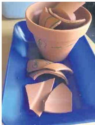
Im Sand versteckte Tonscherben

Die Workshops beinhalten eine Führung durch Mitglieder des Fördervereins, eine kleine Einführung in die Hieroglyphenschrift, das sachgerechte untersuchen und verpacken eines Uschebti auf dem im Vorfeld der Name des Kindes geschrieben wurde. Jedes Kind kann dann sein Uschebti mit nach Hause nehmen.