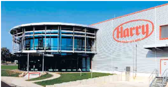
Werk in Troisdorf.

Die 3. Nacht der Technik in Bonn und dem Rhein-Sieg-Kreis