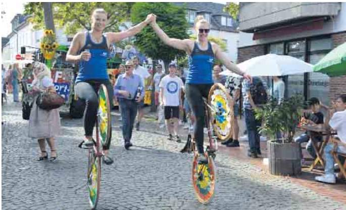
Arkobatisch unterwegs: Kunstradfahrerinnen der Radsportfreunde Duisdorf.

der strahlenden Weinkönigin. Die wurde von allen Zuschauer bejubelt, ganz besonders aber von ihrer Fangruppe, die sich mit einem großen Stand vor der Rochuskirche postiert hatte. Am Ende fanden sich alle Teilnehmer im großen Festzelt am Schickshof ein. Bei einer After-Zoch-Party wurde hier bis in die Abendstunden hinein kräftig weitergefeiert. CSH