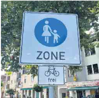
Das Schild an der Rochusstraße erlaubt radfahren im Schritttempo.

Ende: Aus der Arbeit der Parteien Bündnis90 / Die Grünen