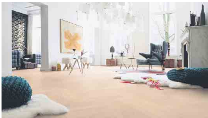
Parkett im Fischgrätmuster gibt weitläufigen Räumen Struktur.

Helle Holzarten lassen kleine Räume großzügiger und offener wirken. Auch Zimmer mit wenig Tageslicht profitieren von einem hellen Bodenbelag, der den Raum freundlicher erscheinen lässt. In großen Räumen entfalten dunkle Hölzer wie Nussbaum oder geräucherte Eiche ihre besondere Wirkung. Sie verleihen dem Raum eine elegante Tiefe, besonders dann, wenn viel Tageslicht einfällt. Bestimmte Verlegemuster verstärken diesen Effekt. Werden