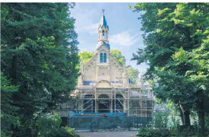
Die Kapelle aus dem 13. Jahrhundert gehörte ursprünglich zur Ramersdorfer Kommende. Sie wurde im 19. Jahrhundert auf den Alten Friedhof linksrheinisch nach Bonn versetzt.

viele dieser Denkmale. Bei gemeinsamen Rundgängen und Führungen können die Besucher*innen die Geschichten hinter den Mauern entdecken. Bauwerke und Führungen in Bonn Das Programm zeigt die ganze Breite des gebauten Kulturerbes in der Bundesstadt - von der Antike bis in die jüngste Vergangenheit. Es umfasst über 40 kostenfreie Veranstaltungen, für die teilweise eine vorherige Anmeldung erforderlich ist. So macht die Bonn-Information das zum UNESCO-Welterbe „Niedergermanischer Limes“ gehörende Römerlager „Castra Bonnensia“ in der Präsentationsfläche Graurheindorfer Straße 10 erlebbar. Sie ist von 11 bis 16 Uhr geöffnet. Interessierte können stündlich an Rundgängen teilnehmen. Zudem