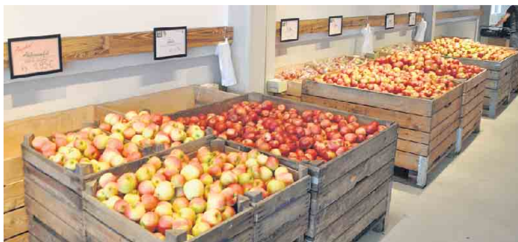
Natürlich ist das umfangreiche hofeigene Bio-Apfelsortiment gleich zu Beginn ein Blickfang im neuen Hofladen des Naturhof Wolfsberg.