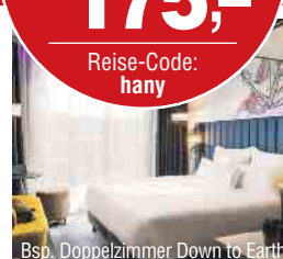
Bsp. Doppelzimmer Down to Earth