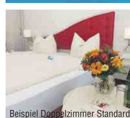
Beispiel Doppelzimmer Standard