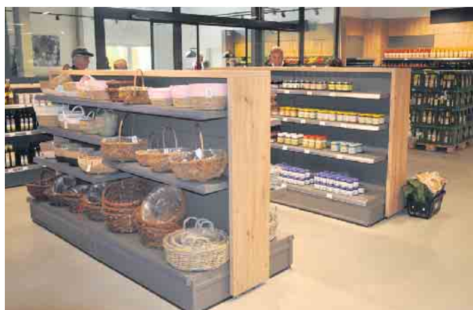
Übersichtlich gegliedert finden sich die einzelnen Produktgruppen in Regalsystemen aus umweltfreundlichem Holz.