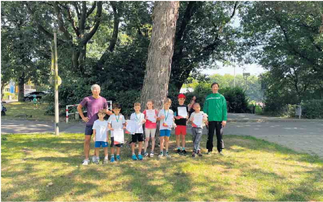
Erneut erfolgreich unterwegs: die Duisdorfer Jungringer des TKS-V