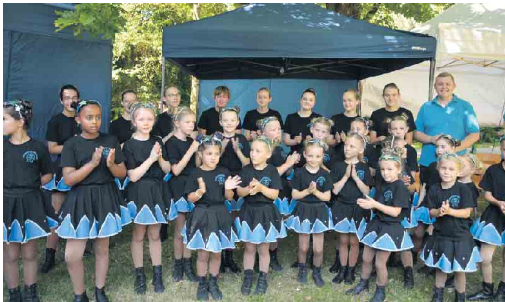
Gardetanz beim Derletalfest: KG Lessenicher Sterne