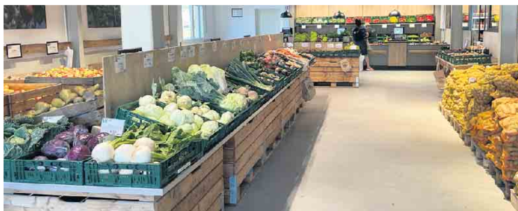
Den Marktcharakter unterstreicht die übersichtliche Bedientheke für besonders empfindliche Produkte am Kopfende der großen Obst- und Gemüseabteilung.