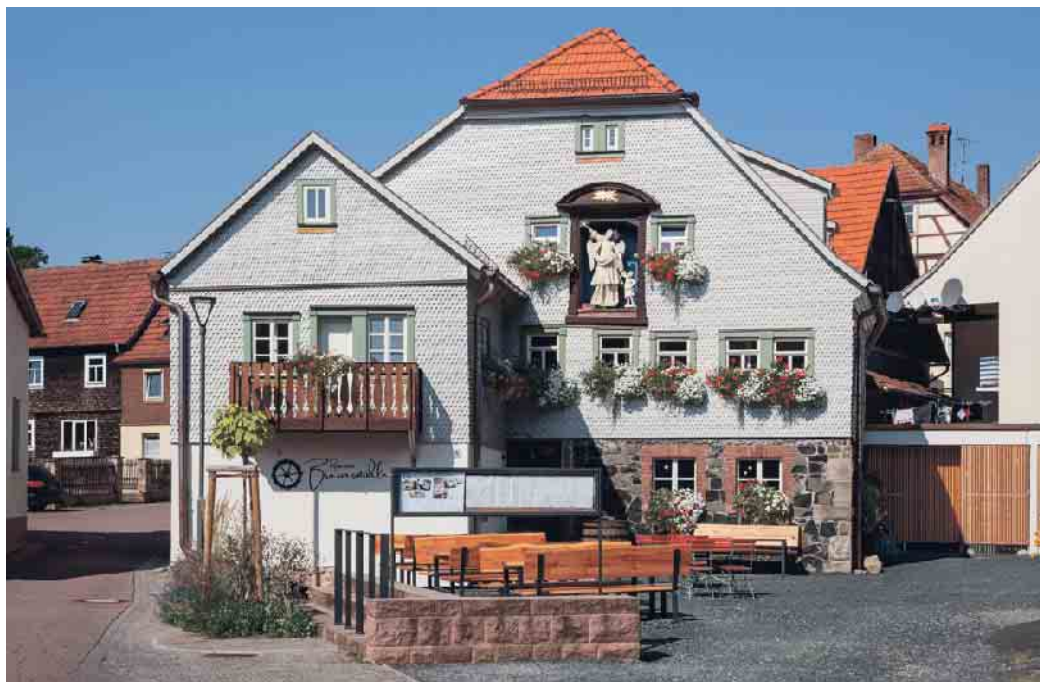
Wer die alte Mühle kannte, kommt aus dem Staunen nicht heraus.