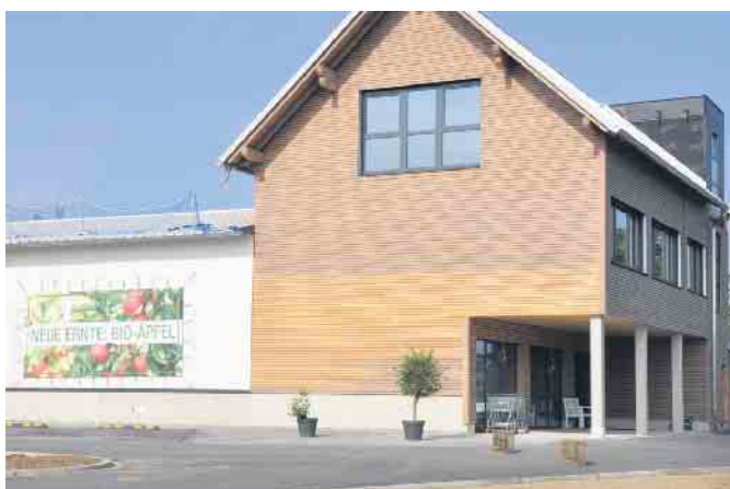
Frisch geerntete Bio-Äpfel sind im großzügig erweiterten Hofladen der aktuelle Renner.

Nachdem der Hofladen bereits seit dem 5. September seine Türen geöffnet hat, findet am 28. September die feierliche Eröffnung des neuen Hofladens statt. Von 11 bis 16 Uhr erwartet die Gäste ein abwechslungsreiches Programm für die ganze Familie, bei dem auch die Gelegenheit besteht, den Naturhof