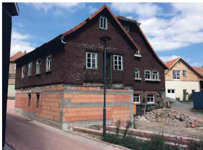
Bevor die Maler kamen, war die Mühle in einem traurigen Zustand.