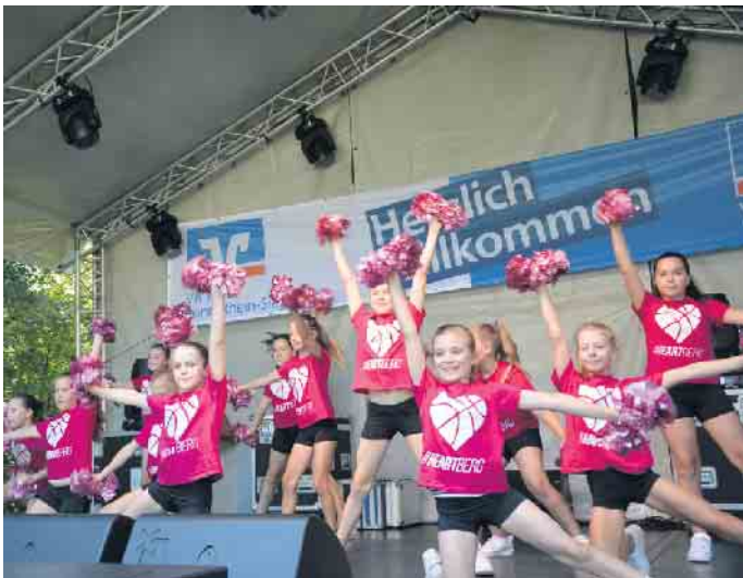
Mit Schwung und Puscheln: Mini Dance-Team der Telekom Baskets

das Publikum. Doch dann zog sich der Himmel immer mehr zu, bedrohliche Wolken und aufziehendes Gewitter ließen nichts Gutes ahnen. Eine schwierige Situation für die Organisatoren. Sie mussten entscheiden: Unterbrechen? Oder kompletter Abbruch? Schließlich siegte die Überlegung: Safety first, sie entschieden sich für Abbruch, die beiden letzten Bands konnten nicht mehr antreten. Eine Entscheidung, die sowohl bei den Bands als auch bei den Besuchern auf volles Verständnis stieß. CSH