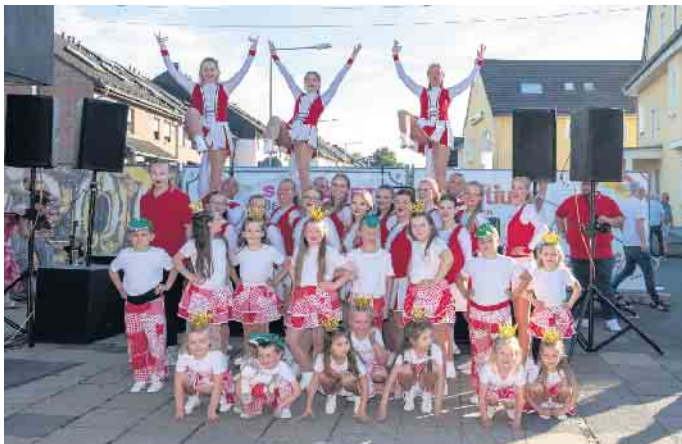
Präsentierten Gardetanz vom Feinsten: die Minimäuse des TSV Legends of Dance