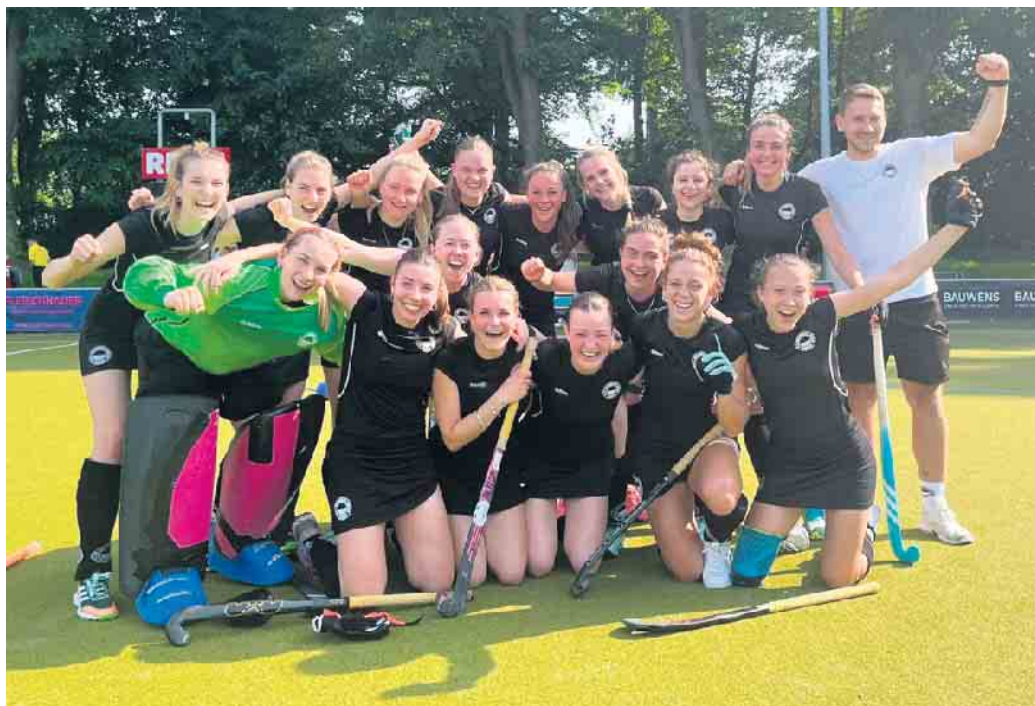
Die Damenmannschaft des HTC Schwarz-Weiss Bonn