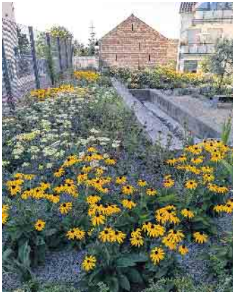
Die neugestaltete Kurfürstenquelle in Duisdorf.

Die Grünen in Hardtberg freuen sich über die neue Bepflanzung an der Kurfürstenquelle in Duisdorf. Hier wird sichtbar, wie sich die Grünen die Umgestaltung Bonns vor dem Hintergrund des Klimaplanes vorstellen. Die Verwaltung hat die Grünfläche gegenüber des Brunnenhauses mit insektenfreundlichen Stauden, die gut mit Hitze zurechtkommen, bestückt. Die Rasenfläche wurde mit einer gebietsheimischen Saatgutmischung angesät, um für biologische Vielfalt zu sorgen. Mineralischer Mulch sorgt darüber hinaus vor Sonneneinstrahlung und Verdunstung sowie Unkraut. Entstanden ist ein attraktiver Ort für Mensch und Tier. Die Sitzbänke laden zu einem Pauschen und zur Begegnung mit anderen Menschen ein. Bis Ende des 20. Jahrhunderts sorgte die Quelle für die Bewässerung des Botanischen Gartens, ihre Ursprünge gehen zurück bis in römische Zeiten. Den Grünen in Hardtberg gefällt sehr, wie die Stadt das rund 90 Quadratmeter große Gelände gestaltet hat. Sie setzen sich dafür ein, nach diesem Vorbild weitere Plätze auf dem Hardtberg zu gestalten - nach Möglichkeit jedoch barrierefrei.