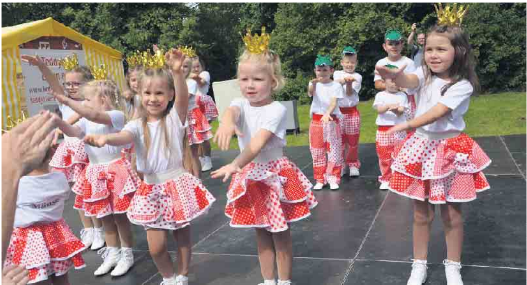
Sehr niedlich: die Minis des TSV Legends of Dance

gerufen, mitzumachen. Hier konnten sie Jonglieren mit Tüchern, Tellern und Bällen, das Diabolospielen und Balancieren auf dem Drahtseil selbst ausprobieren. Ein toller Spaß! Ganz viel Tanz gab es auf der großen Aktionsfläche. Den Auftakt machten die Minis des noch recht jungen Vereins TSV Legends of Dance. Die Deutsch-Kongoloesische Gesellschaft präsentierte afrikanische Lieder und Tänze. Karnevalistisches ging es am frühen Abend weiter mit der KG Teddybären und der KG Lessenicher sterne. Musikalisch eingeeizt wurde den Besuchern von einem rockigen Programm. Zum vierten mal wurde gleichzeitig mit dem Derletalfest die insbesondere beim jüngeren Publikum beliebte Veranstaltung „Rock im Tal“ angeboten. Mehr als sieben Stunden Livemusik von sechs Bands und Einzelinterpreten mit nur kurzen Umbaupausen ließen das Herz jedes Festivalfans höherschlagen. Das Line Up bot einen bunten Mix aus Singer/Songwriter, Indie, Pop, Cover bis Rock CSH