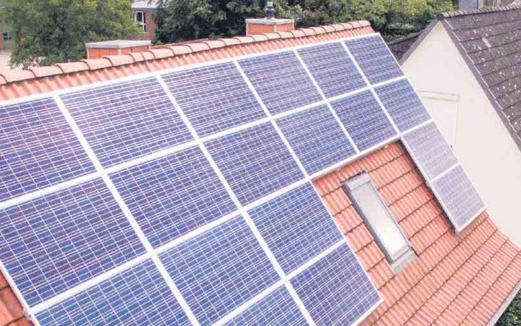
Vorausschauende Investitionen reduzieren auch die „2. Miete“

Ressourcen und Energie sind kostbar und auf unserem Planeten nicht mehr unbegrenzt verfügbar. Das sollten Bauherren auch beim Bau oder der Modernisierung ihres Hauses berücksichtigen. Die Investition in eine Sanierung oder energetische Maßnahmen wird belohnt, mit geringeren Betriebskosten, staatlichen Förderungen und einer Wertsteigerung der Immobilie. Neue Fenster, Solarthermie oder Brennwertkessel - wer sich beim Bauen und Modernisieren für Nachhaltigkeit entscheidet, tut nicht nur etwas für die Umwelt. „Bei Bestandsbauten führt die ökologische und energetische Sa-