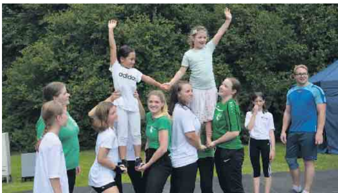
Gar nicht so einfach: Cheerleader-Training beim TKS

Zielsicherheit und Treffgenauigkeit ankam. Kniffliges präsentierte auch die Circusschule Don Mehloni. Sie bot ein faszinierendes Programm aus Pyramiden, Diabolo, Jonglage, Akrobatik, Seiltanz, Einrad und vielem mehr. Auch die Besucher waren auf-