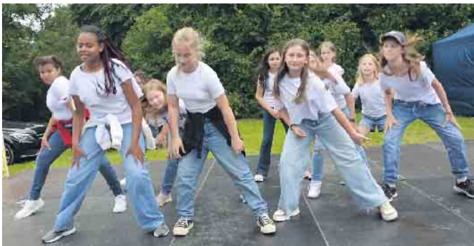
Hip Hop beim Derletalfest

Derletalfest und Rock im Tal findet viel Anklang