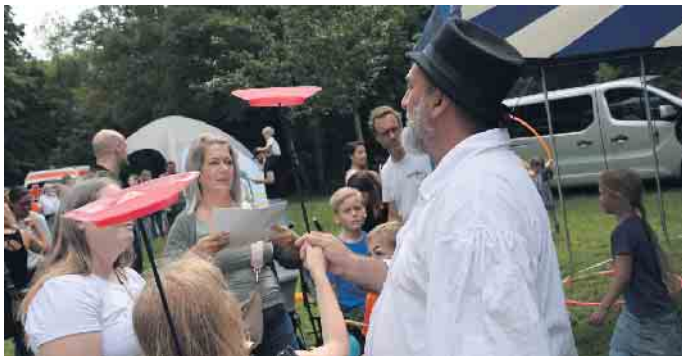
Hereinspaziert: Jonglage und mehr im Circus Mehloni