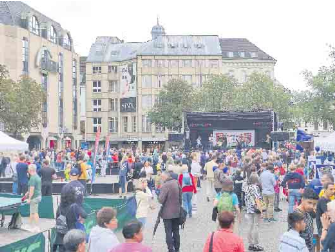
Das traditionelle SSF Festival auf dem Münsterplatz

Bonns größter Sportverein lädt die Bevölkerung auf den Münsterplatz in der Bonner Innenstadt ein