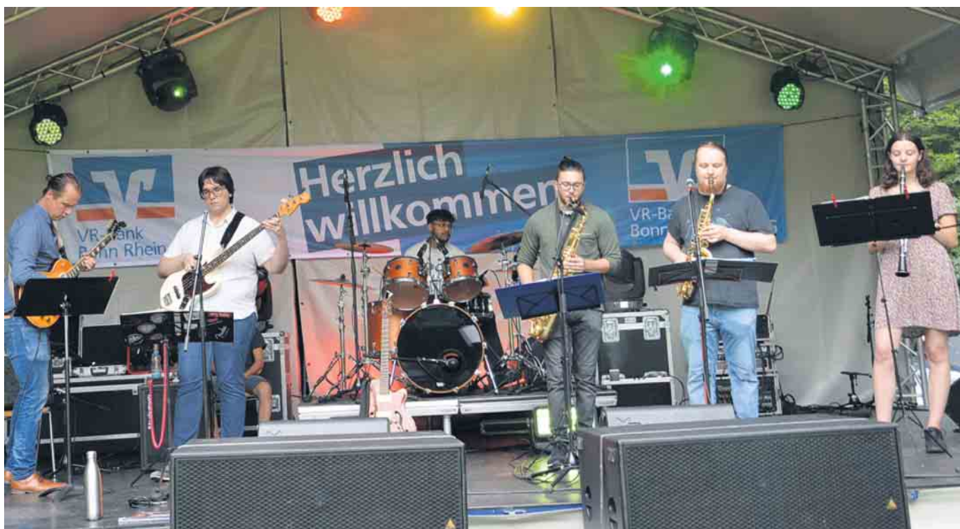
Musikalischer Auftakt von RIT: Mixed Bag Boogie Band