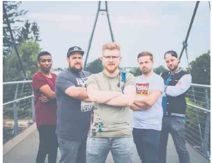
Unverwechselbarer Sound: Genetic Blueprint ist bei der 2. BurgRock dabei

ein Stück weit mehr Richtung Metal, der andere mehr Richtung Blues, Pop, Hip-Hop sowie auch Alternative. Genau das macht den unverwechselbaren Sound von GB aus, da jeder einzelne beim Songwriting und auch beim Live-Arrangement der Songs beteiligt ist. GB ist nicht nur eine Band, es ist Freundschaft und Familie. Und das schmeckt man auch! Informationen zu den weiteren Bands finden sich unter www.kube-bonn.de Die erste Band wird ab 12 Uhr die Veranstaltung eröffnen; das genaue Line-Up wird noch bekannt gegeben. CSH