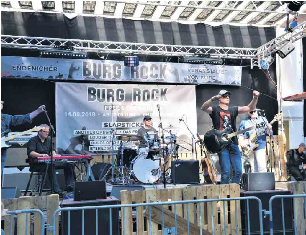
Tolle Location, tolle Musik: Impression Burgrock 2019.

Gegründet wurde KUBE im November 2015 von Endenicher Bürgerinnen und Bürgern. Ihr gemeinsames Ziel: die Unterstützung bedürftiger Menschen oder Organisationen in ihrem Ort. Zur Erfüllung dieses Zwecks entstand die Idee, Veranstaltungen durchzuführen, um mit dem Verkauf von Speisen