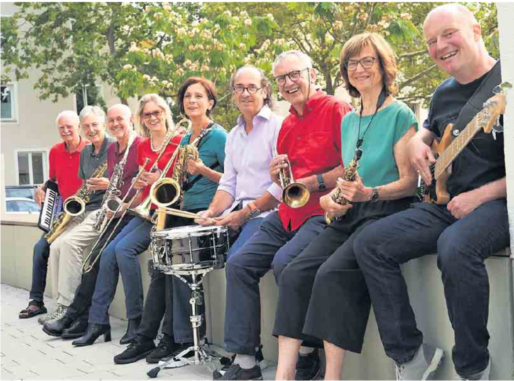
Sound ohne Schnickschnack: Nine Steps zu Gast im Kulturzentrum