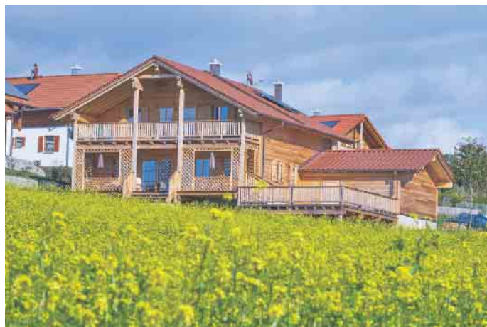
Vor dem Stadion des 1. FC Heidenheim hat Lehner Haus ein Vereinslokal und die Geschäftsstelle mit Fanshop des Zweitligisten gebaut.

eilen. In Deutschland kam das Fertighaus in den 1950er und 1960er Jahren in Fahrt: Das Wirtschaftswunder schaffte in dieser Zeit Wachstum, das den Eigenheimbau und auch die Fertigbauweise antrieb. Schon seit einigen Jahren wächst der Fertigbauanteil vor allem auf Kosten anderer Bauweisen, denn die Vorteile von Holz-Fertighäusern überzeugen immer mehr Bauherren. Die Fertigbauweise bietet allen voran Planungssicherheit in Sachen Baukosten und Bauzeit. Ein Fertighaus kommt aus der Hand eines Anbieters, der sich darum kümmert, dass es planmä-