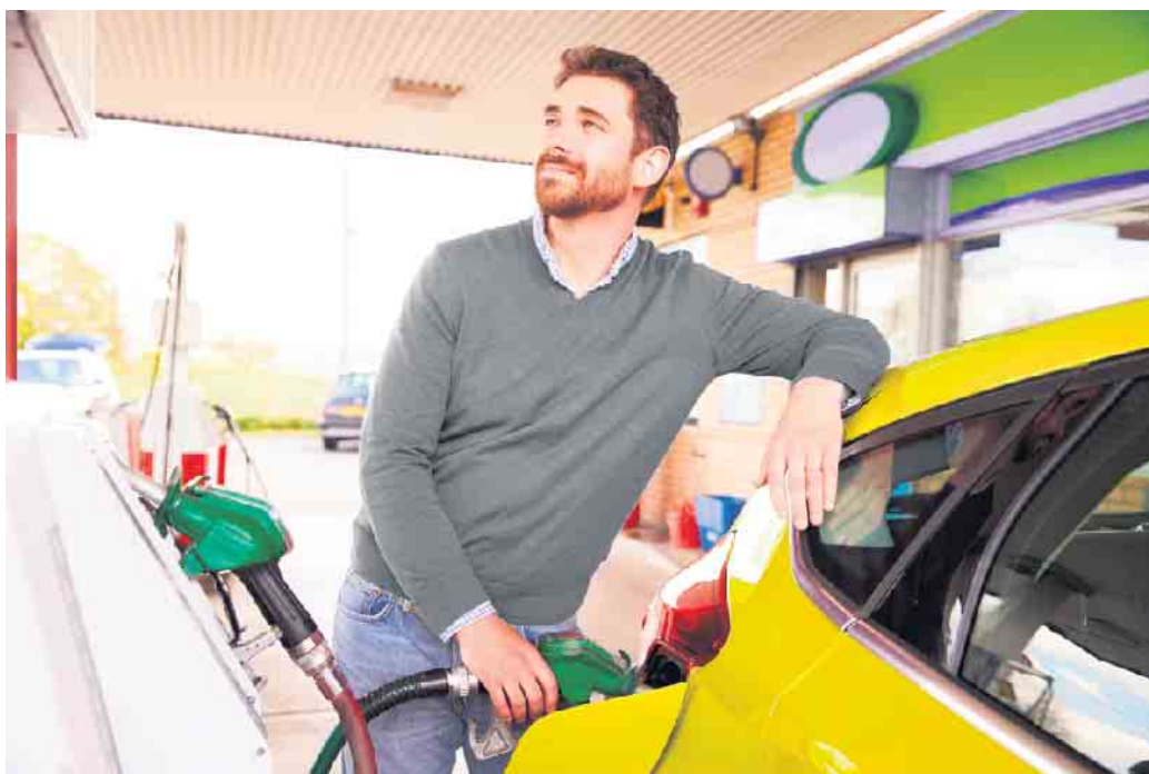
Fast alle Benzinmotoren vertragen den preiswerteren und umweltfreundlicheren E10-Kraftstoff.

E10 steht seit rund zehn Jahren an allen Tankstellen zur Verfügung und hat sich in langjährigem Einsatz bewährt. In der Regel können alle Benzinzer mit Baujahr ab November 2010 problemlos damit betankt werden. Doch auch viele ältere Pkw tragen den umweltfreundlicheren Treibstoff ohne Weiteres. Oft genügt schon ein Blick in die Tankklappe oder in die Betriebsanleitung, im Zweifelsfall kann man in der Kfz-Werkstatt nachfragen oder online unter www.dat.de/e10 nachschauen.