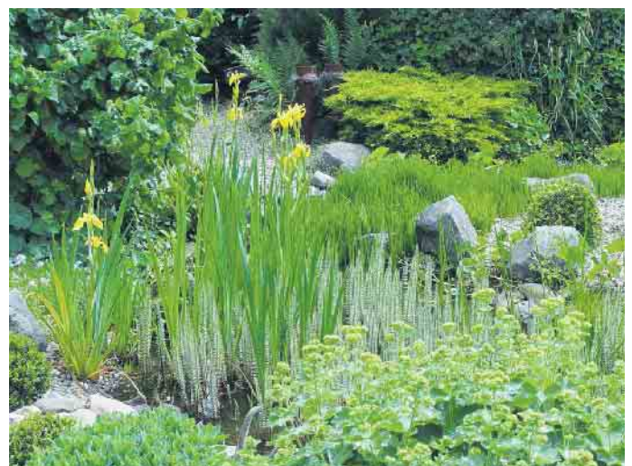
Vor allem feuchte Senken, die sich überwiegend in einem sonnigen oder halbschattigen Teil des Gartens befinden, eignen sich dazu, ein Sumpfbeet anzulegen.