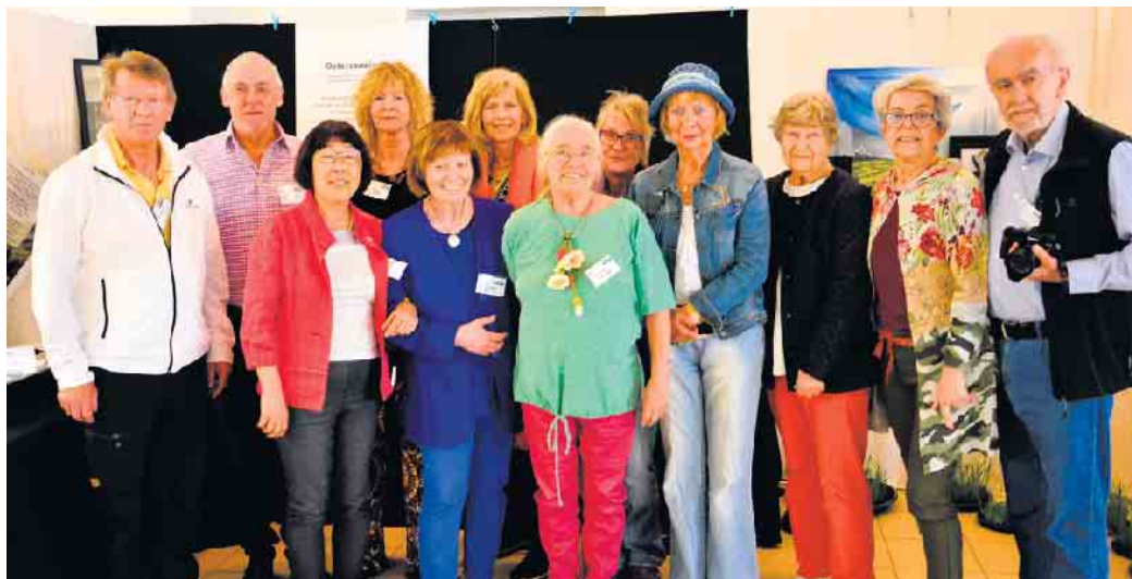
Kreative Gruppe: einige der Mitglieder von „Stadtteilkultur“.

Bis heute gelingt es der Initiative mit wechselnden Mitgliedern immer wieder, ihr Ziel zu erreichen und den Brüser Berg auf vielfältige künstlerische Weise bunter zu machen. Ihr Flaggschiff ist der seit 2000 ununterbrochen stattfindende Kunst- und Kreativmarkt im Stadtteilzentrum des Brüser Bergs. Was mit Ständen im Saal anfang, wurde schnell größer. Seit 2015 schafft die Initiative auch gemeinsam Kunstwerke, die auf dem Markt und der begleitenden Ausstellung im Innenhof des Stadtteilzentrums aus-