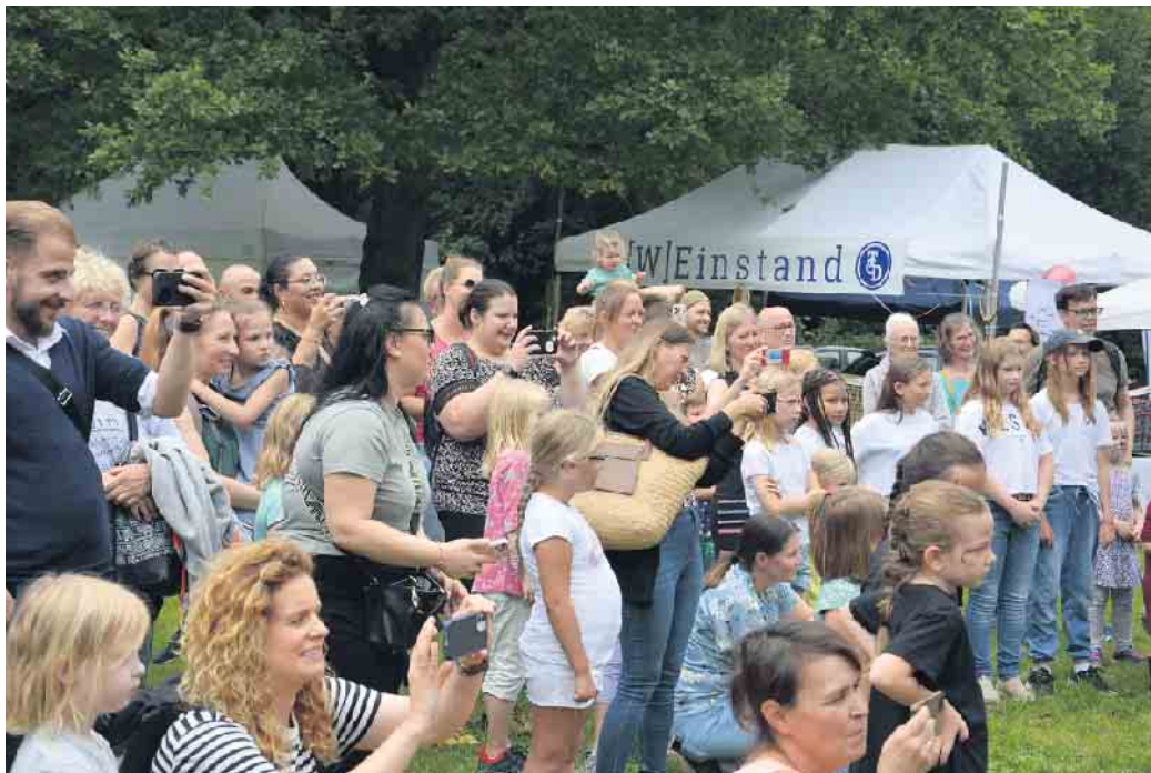
Derletalfest: seit Jahren ein großes Fest für die ganze Familie.

Hardtberg. Am Samstag, 24. August, findet im Stadtbezirk Hardtberg von 14 bis 23 Uhr das 38. Derletalfest statt. Bestandteil des Derletalfestes bleibt das Musikfestival „Rock im Tal“. Dieses beginnt in diesem Jahr um 17 Uhr.