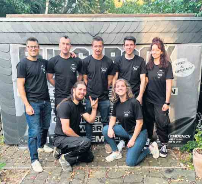
Stellen ein tolles Event auf die Beine: das Orga-Team der BurgRock

Endenich. Der Kultur- und Bürgerverein Endenich e. V. (KuBE) freut sich, die Rückkehr der BurgRock anzukündigen. Am 7. September ist es wieder soweit, wenn es heißt „umsonst und in der Burg“ und die Mauern der Burg Endenich von Livemusik erfüllt werden. Die BurgRock 2024 verspricht ein dynamisches Line-Up mit einer breiten Palette von Rockgenres, darunter Metal, Heavy-Rock, Glam und Retro-Rock’n’Roll sowie Classic Rock und Pop-Punk. Regionale Bands wie Onexx, Area South und Toxic Youth (alle aus Bonn), Sweet Electric und ANCR TO PAST (aus Köln) werden das Festivalgelände zum Beben bringen. Ein besonderes Highlight wird der Headliner Friends Don’t Lie (Frankfurt) sein, die bereits bei Veranstaltungen wie Rock am Ring, Rock im Park und dem Reload Festival begeisterten. Die Veranstaltung beginnt um 11 Uhr, die erste der zehn Bands wird um 12 Uhr die Bühne betreten. Der Eintritt zur BurgRock 2024 ist kostenfrei, die Veranstaltung finanziert sich ausschließlich über den Verkauf von Speisen und Getränken vor Ort. Aus diesem Grund ist das Mitbringen von eigenen Spei-