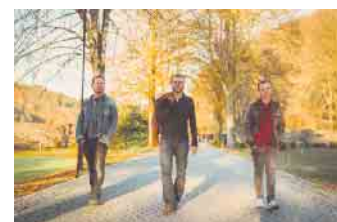
Rocker mit Herz: Electric Coast: zu Gast bei Rock im Tal