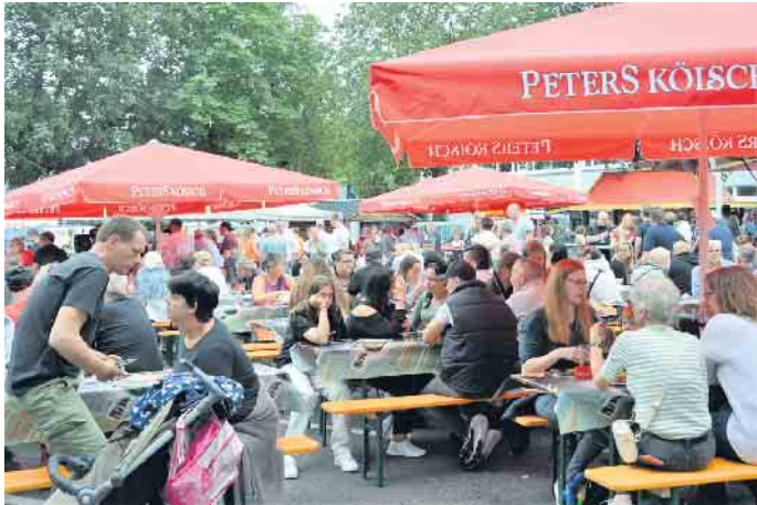
Gut gefüllt: der Magdalenenplatz wird zur Kirmeslocation