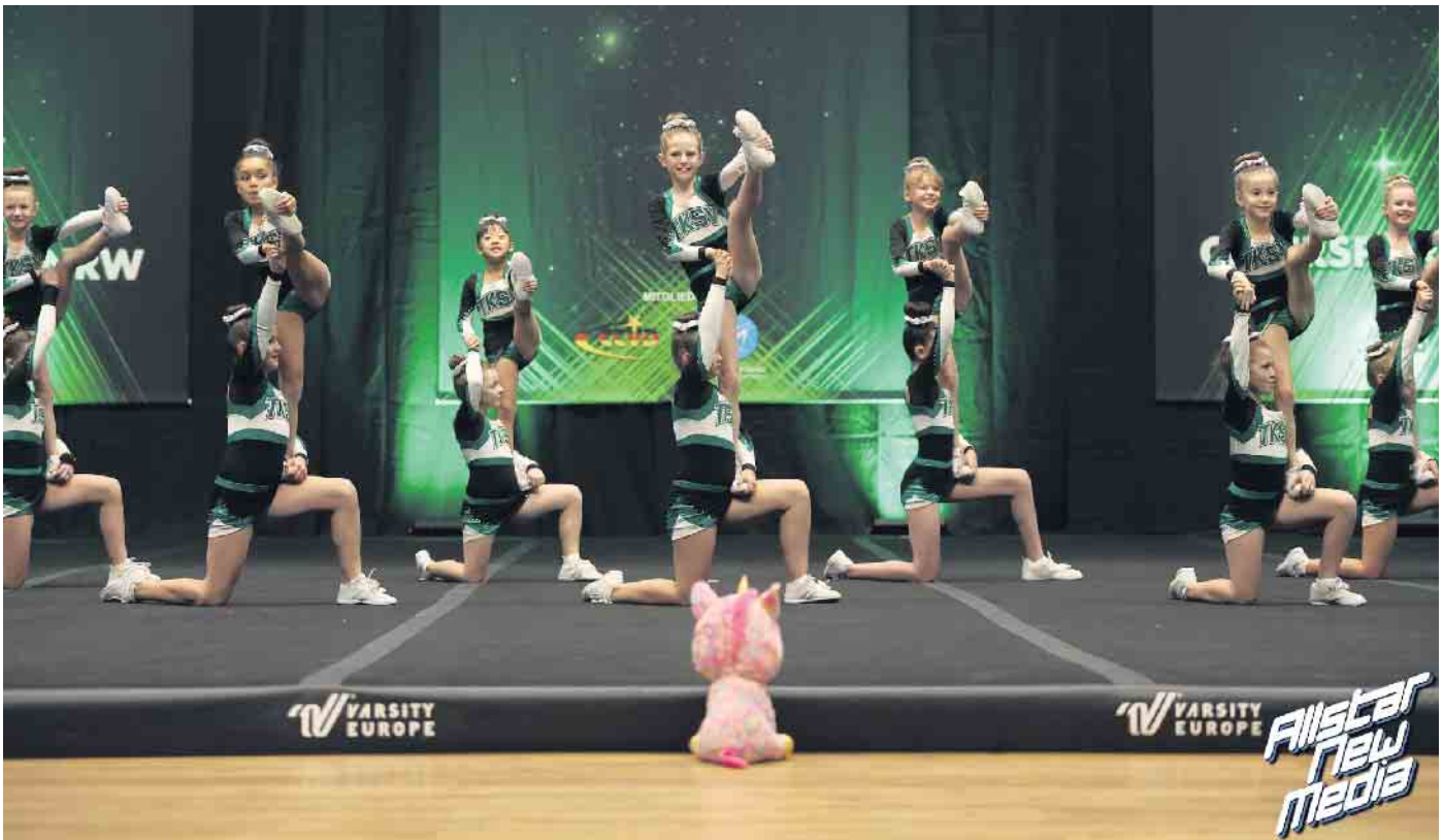
Jüngstes Team der Cheerleader des TKS: die Rainbows. Bericht auf Seite 2