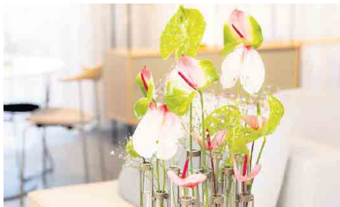
Alle Pastellfarben lassen sich nach Lust und Laune miteinander kombinieren.

ein relaxtes Miami-Flair in die eigenen vier Wände. Weitere Tipps und Informationen zu Anthurien finden Sie unter www.anthuriuminfo.com . GPP