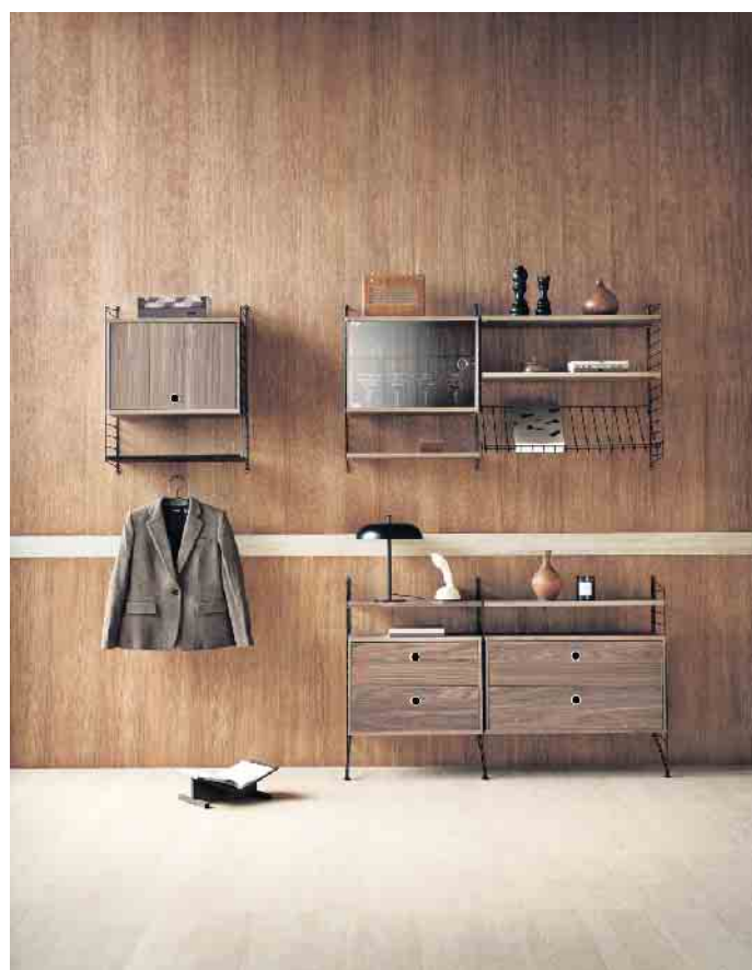
Edel und einzigartig: Furnierte Möbel.