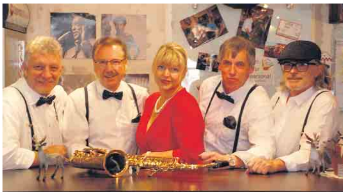
Besondere Arrangements: Kraske's Knusperjazz im beim Duisdorfer Jazzsommer

kannt für ihren lebendigen Sound in Stile der 50er- und 60er-Jahre. Das ist quasi ihr Markenzeichen. Es gelingt den sieben Jazzmusikern immer, die Lebensfreude des Old-Time-Jazz zu vermitteln. Das Programm der „Mary-Castle Jazz Band“ weicht vom üblichen