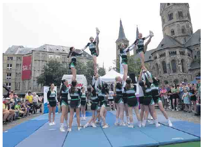
Begeisterten auf dem Bonner Münsterplatz: die Cheerleader des TKSVD

Die anwesenden Zuschauer wurden dazu aufgerufen, gerne auch einmal die Sportart Cheerleading auszuprobieren. Interessierte Kinder, Jugendliche und junge Erwachsene können sich per E-Mail an cheerleader@tksv-duisdorf.de zu einem unverbindlichen Probetraining anmelden. CSH