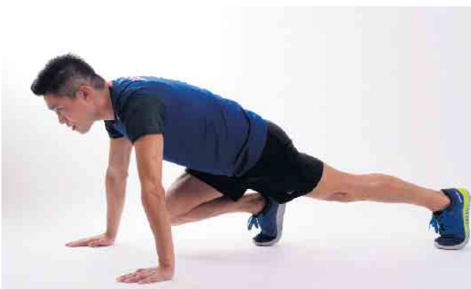
Steigen Sie ab August ein beim Ganzkörper-Workout und Selbstverteidigungskursen des TGV.

ab mit kurzen, intensiven Cardio-Einheiten. Neben Functional-Fitness-Übungen mit dem eigenen Körpergewicht (u. a. als Circle-Training) kommen Elemente aus Kickboxen und Krav Maga zum Einsatz. Krav Maga und Fitness-Kickboxen