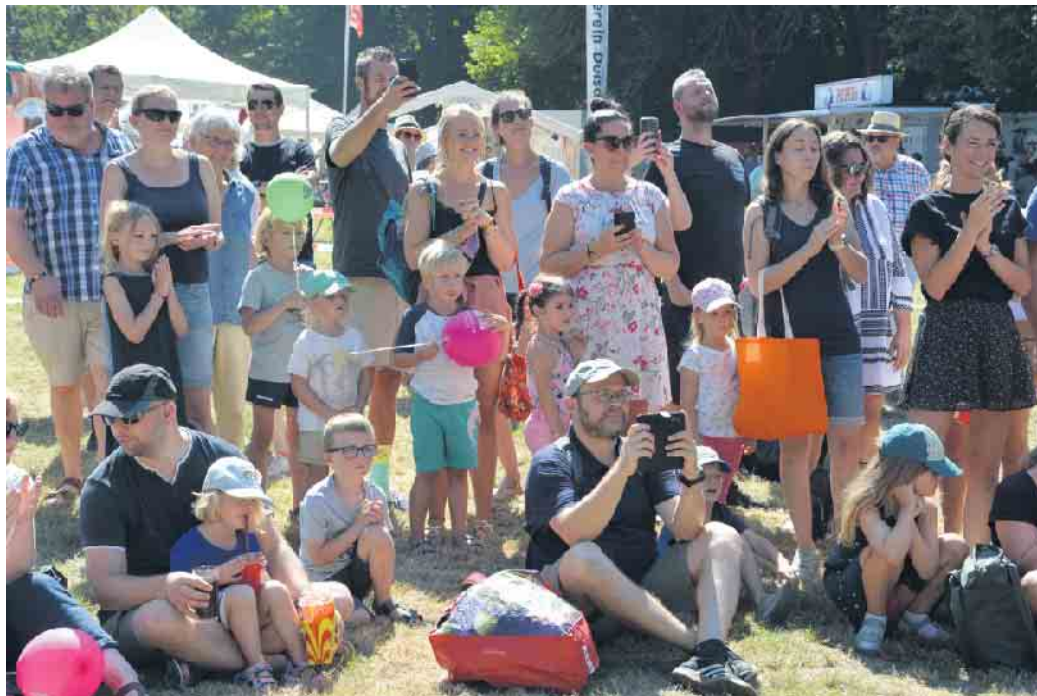
Sommerfest für die ganze Familie: das Derletalfest.

Bestandteil des Derletalfestes bleibt das Musikfestival „Rock im Tal“. Dieses beginnt in diesem Jahr um 17 Uhr. Zuvor, von 14 bis 17 Uhr, steht die Bühne für Auftritte von Musik-, Tanz- oder Sportgruppen zur Verfügung, vorrangig aus dem Stadtbezirk Hardtberg. Die großen Hardtberger Ortsvereine werden wieder rund um die Bühne vertreten sein, die Info-, Spiel- und Aktionsangebote der Schulen und Jugendeinrichtungen im hinteren Bereich der Wiese in Richtung des unteren Teiches. Dort wird auch die Circusschule Don Mehloni ihr großes Zelt aufschlagen. Den Sanitätsdienst während der Veranstaltung übernimmt das Deutsche Rote Kreuz. CSH